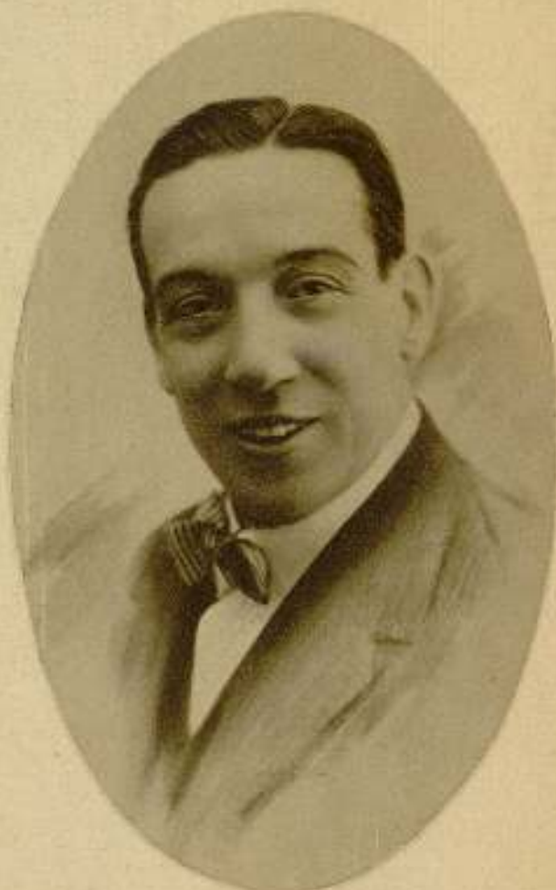
Francisco Fuentes, primer actor y director del teatro Puencarral y uno de los valores indiscutibles de la escena española