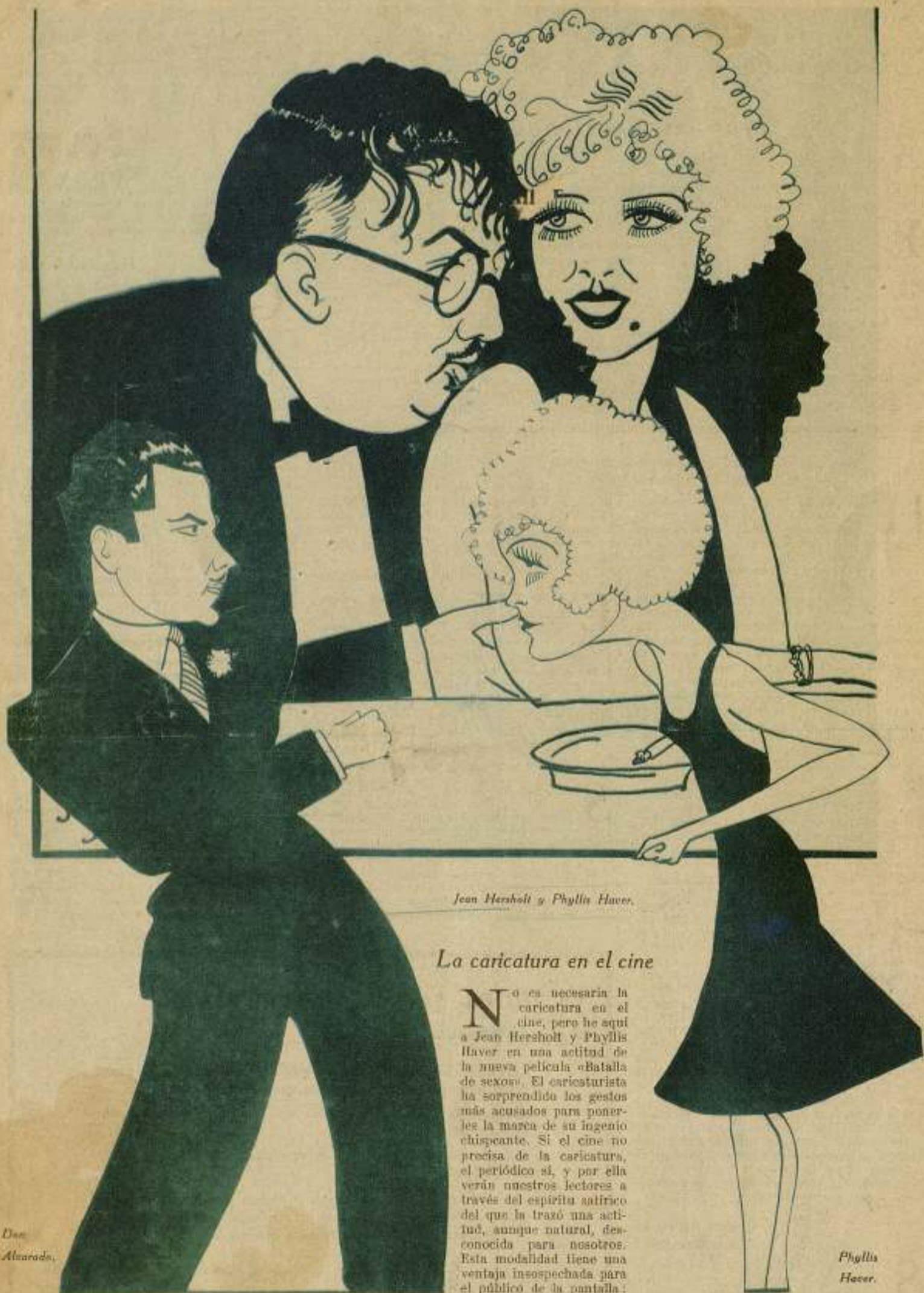
Jean Hersholt y Phyllis Haver.