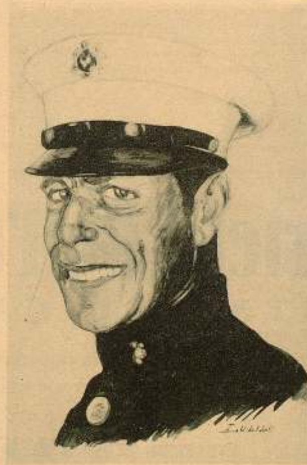
LON CHANEY en «El sargento Malacara»

siempre, desde entonces, el gran actor dramático que más hondamente ha sabido impresionar al público con sus inimitables creaciones.