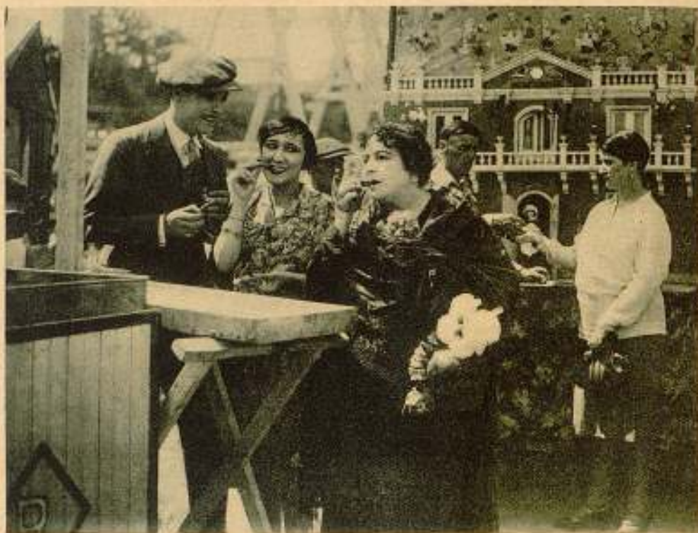
Una escena de "Estudiantes y Modistillas", tomada en la Pradera de San Isidro

Conformes: los que no se atreven a subscribir este propósito demostrarán que el arte mudo nacional es para ellos un mero pasatempo al que no conceden otro valor que el puñado de pesetas que puedan obtener a su amparo. Y el arte mudo, como todas las artes y como todas las profesiones que se derivan y convivan con un arte, requiere algo más que la torpe ambición de un estómago abito de engullir; requiere fe, entusiasmo, sacrificio, estudio... Es el fuego sagrado que debe vivir latente y puro, hasta su postrer momento, en nuestra ideología.