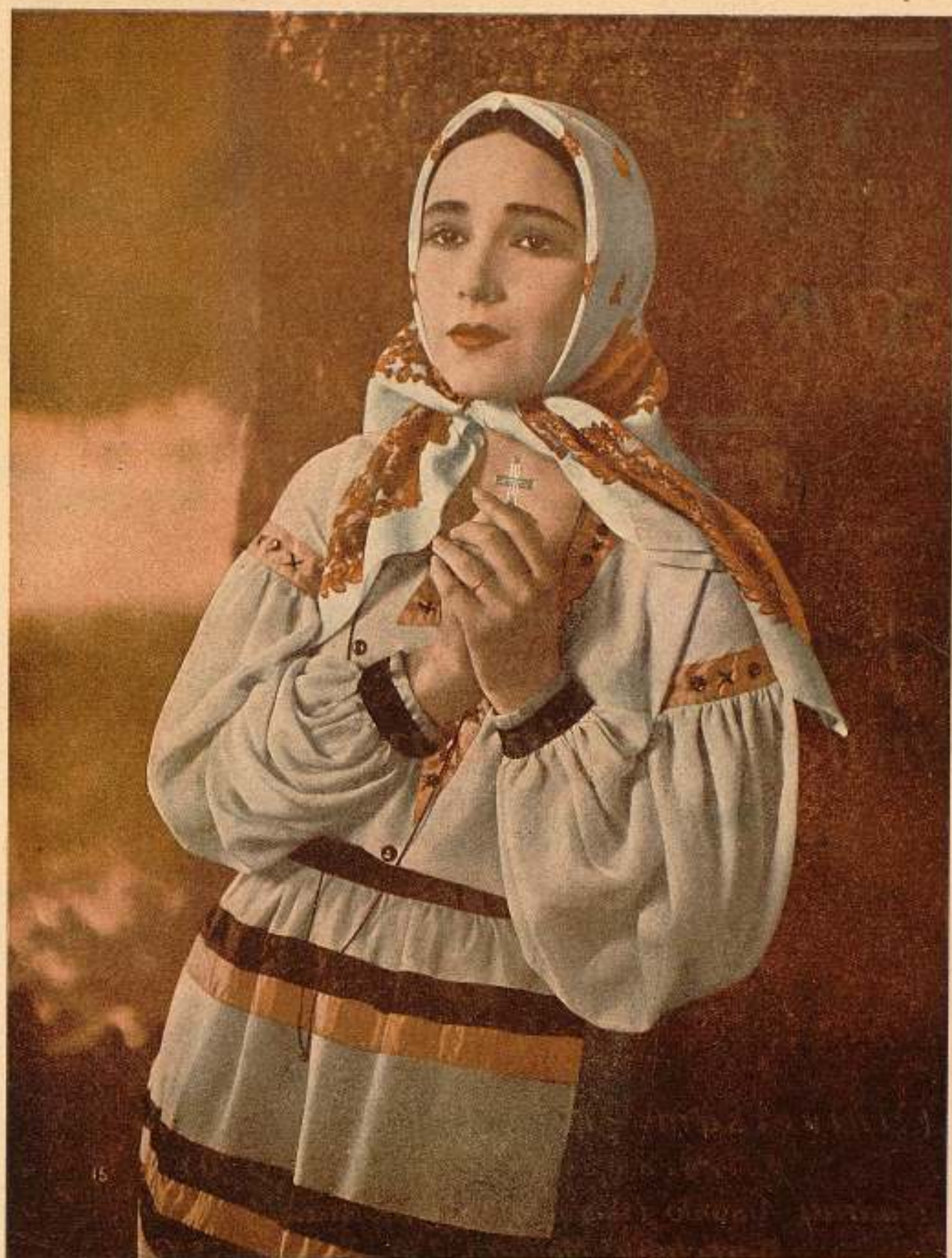
Una bella actitud de Dolores del Río en Resurrección , de Tolstoi. Hevada a la pantalla por los ARTISTAS ASOCIADOS