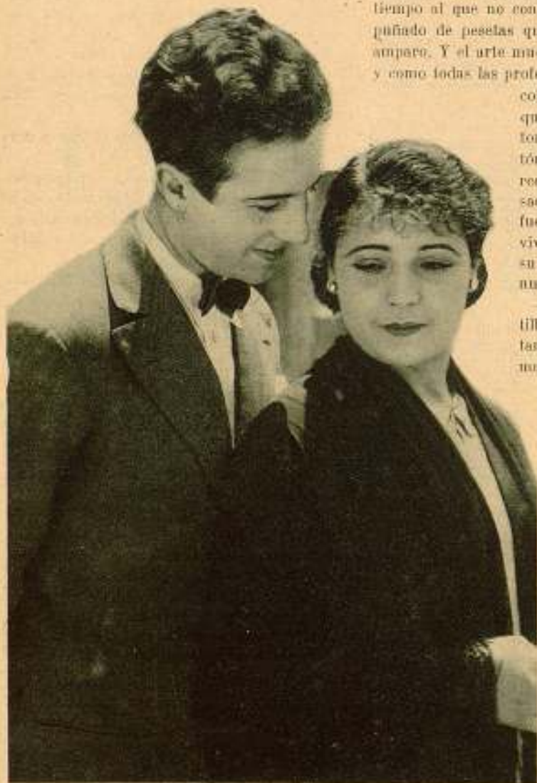
Un primer plano de la Romerito y Orduña en la película "Estudiantes y Modistillas"

—Basta ya de engañarnos — ha dicho Cabero en uno de sus últimos artículos —. Para ensayo es suficiente el tiempo transcurrido, ahora es preciso rendir tributo a la verdad para que ésta nos haga más conscientes y más cultos.