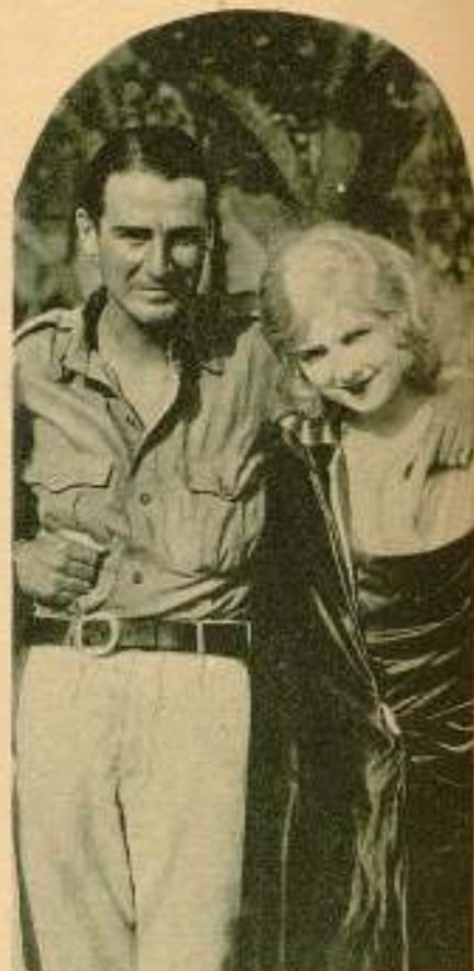
Rex Ingram y su bellísima esposa, la actriz teatral Alice Terry

periódico neoyorquino — recoge sus declaraciones, de segunda mano, de un rotativo madrileño — el caso que nos ocupa, viene con sus palabras a darne, en cierto modo, la razón. Son las suyas sobre poco más o menos estas: «Si los dos films que lleva realizados Rex Ingram en la Costa Azul («Mare nostrum» y «El mágico dominio») han de aceptarse como reflejo del influjo que al arte nado proporciona la Riviera, es mejor que los directores yanquis, no le presten oído a su requerimiento ya que para hacer malas películas no es necesario salir de California». Digan, pues, mis lectores si llevo o no razón al apropiar como una de las causas del desalén de los realizadores estadounidenses hacia el proyecto