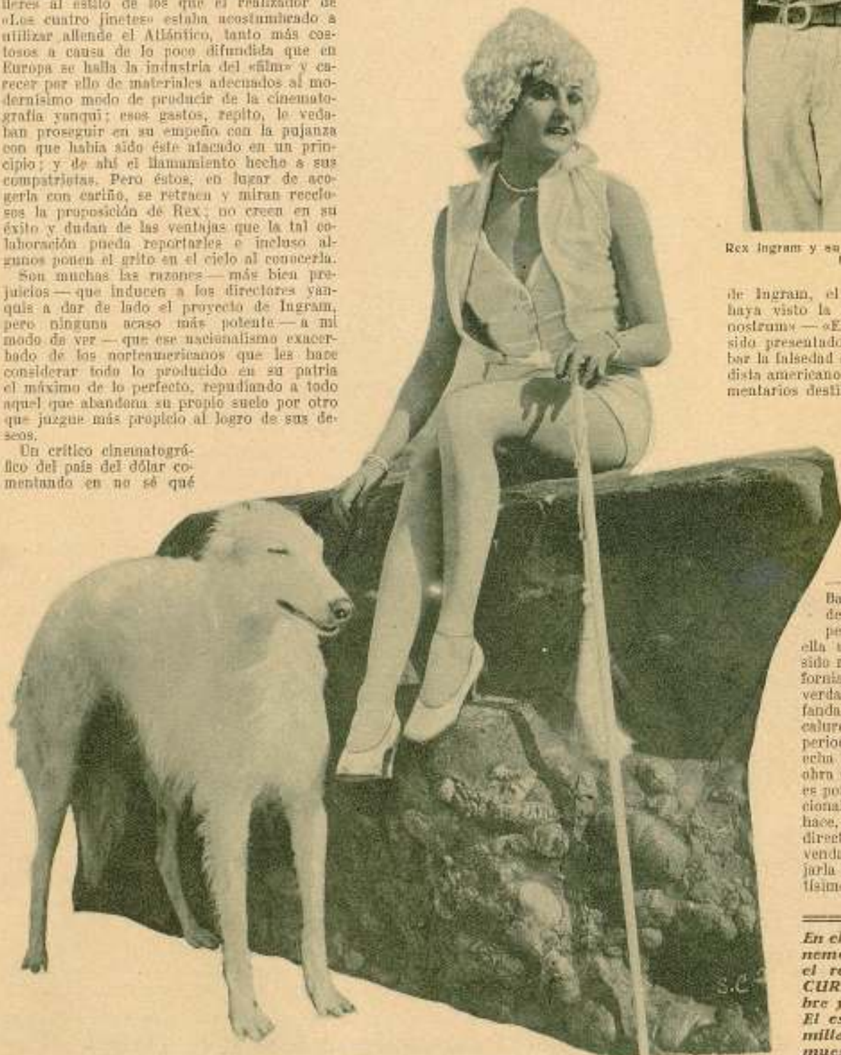
Encantadora "jolie", completamente veraniega, de Vera Stoneham, "vedette" de las comedias Christie, de la Paramount

En el próximo número, como o-nemos anunciado, publicaremos el resultado de nuestro CONCURSO FOTOGÉNICO y el nombre y retrato de los vencedores. El escrutinio, ascende a varios millares de votos, lo que demuestra que este primer concurso de «POPULAR FILM», ha sido un triunfo para la revista.