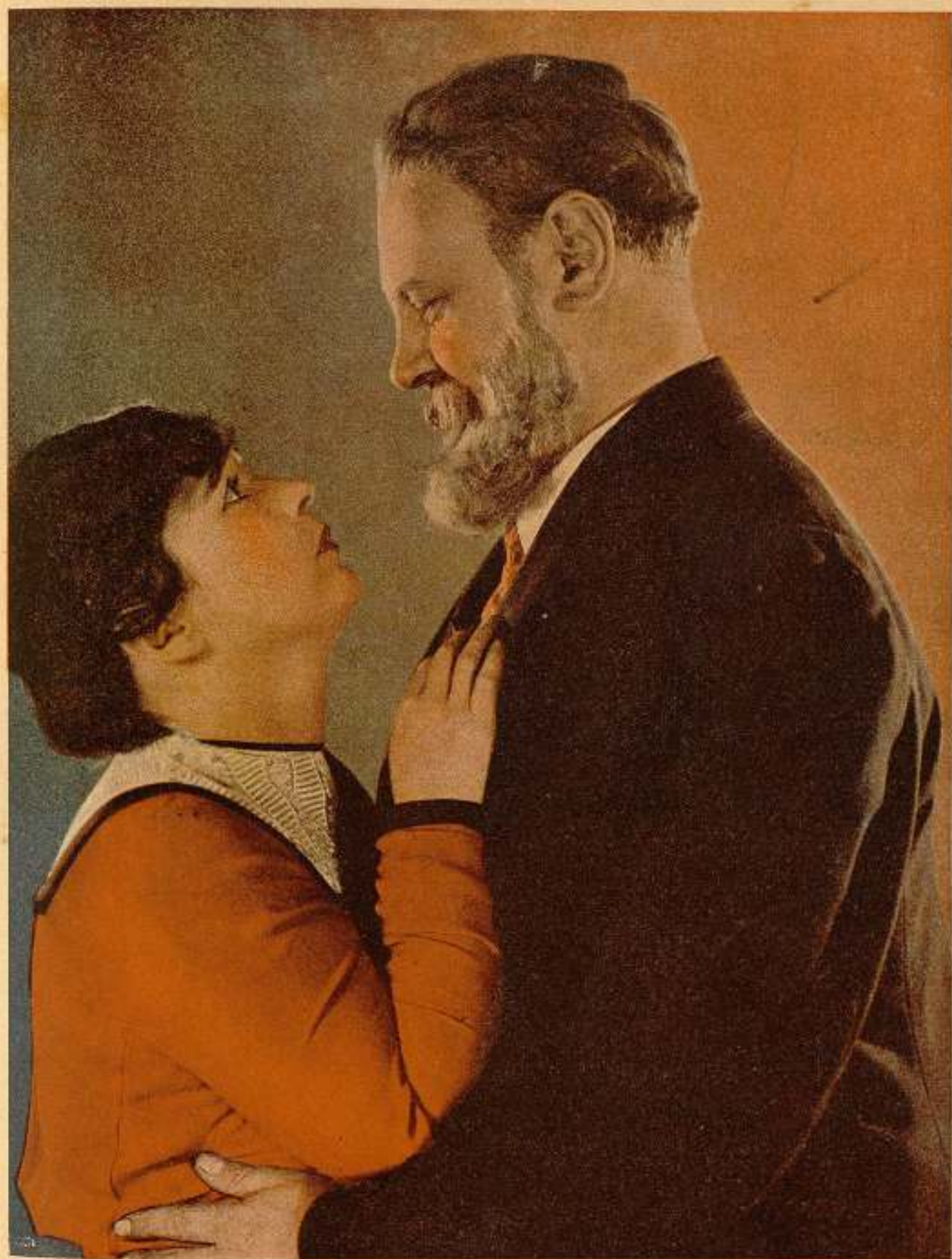
Escena de "El camino de la carne", primera producción de Emil Jannings para la PARAMOUNT