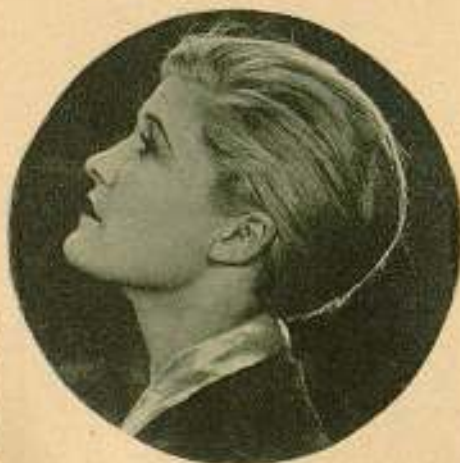
Laura La Plante