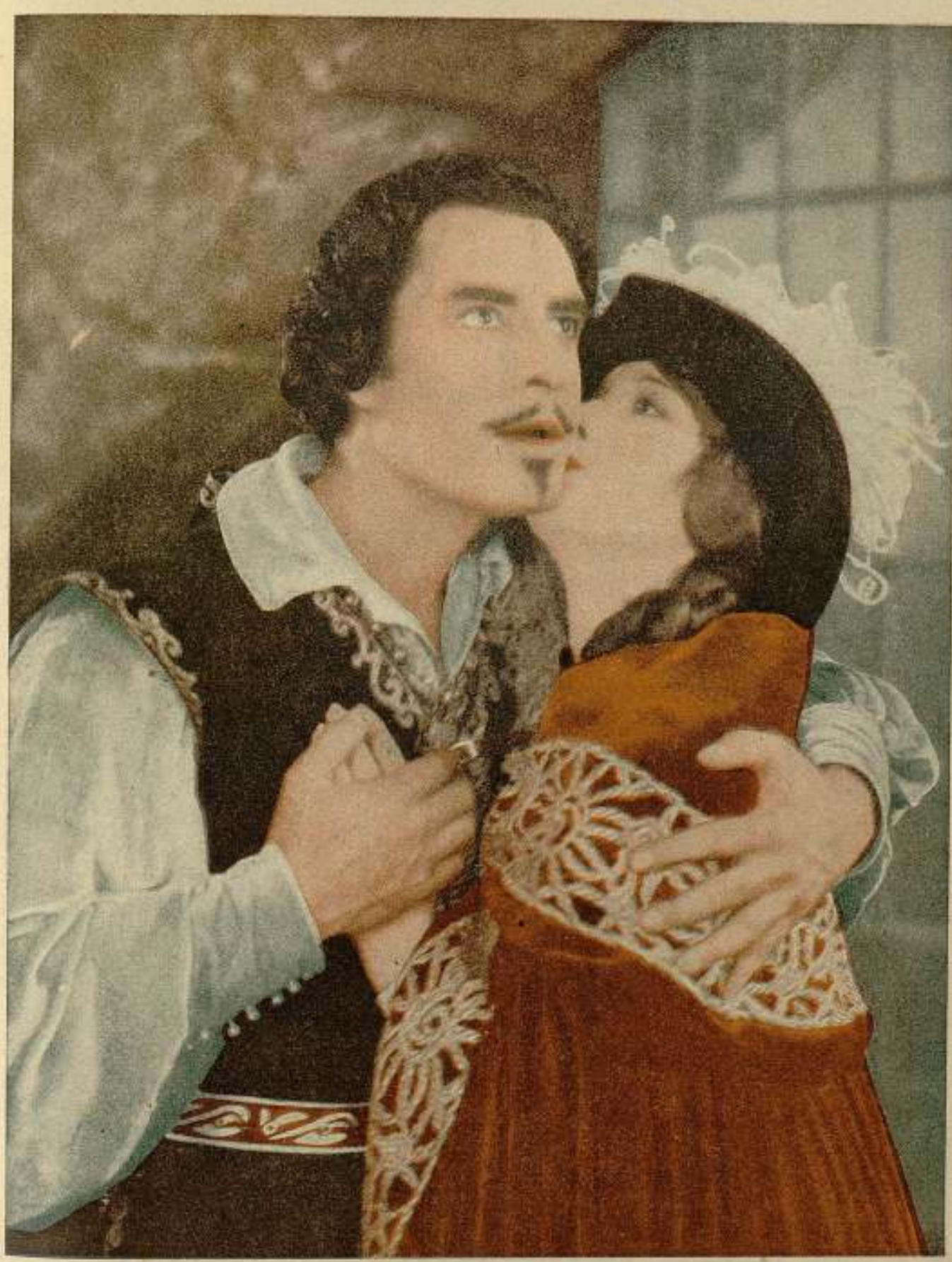
John Gilbert y Eleanor Boardman en «El caballero del Amor», de la M-G-M.