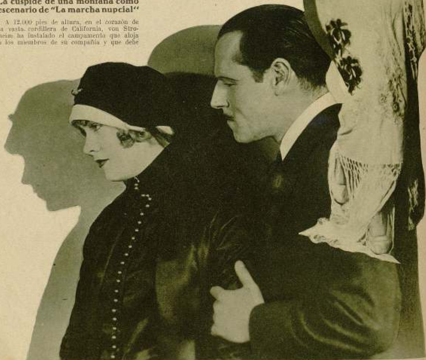
Baither Ralston y Jack Holt, en "The Bend Gers", de la Paramount, y Gloria Swanson en "El Amor de Sonia", de los Artistas Asociados