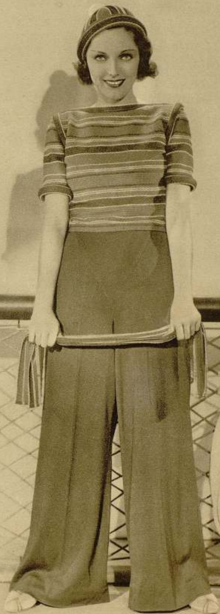
ADRIENNE AMES Actriz de la Paramount