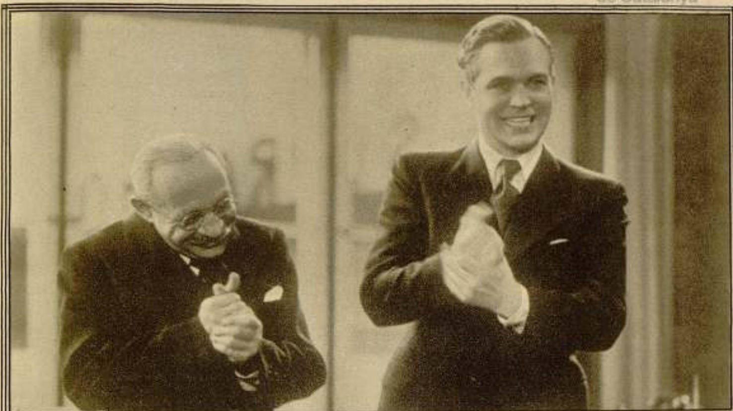
Marta Eggerth, Gus- tav Fröhlich y Ge- rardo Ritterband en "Una canción, un beso, una mujer", de Exclusivas Huet.