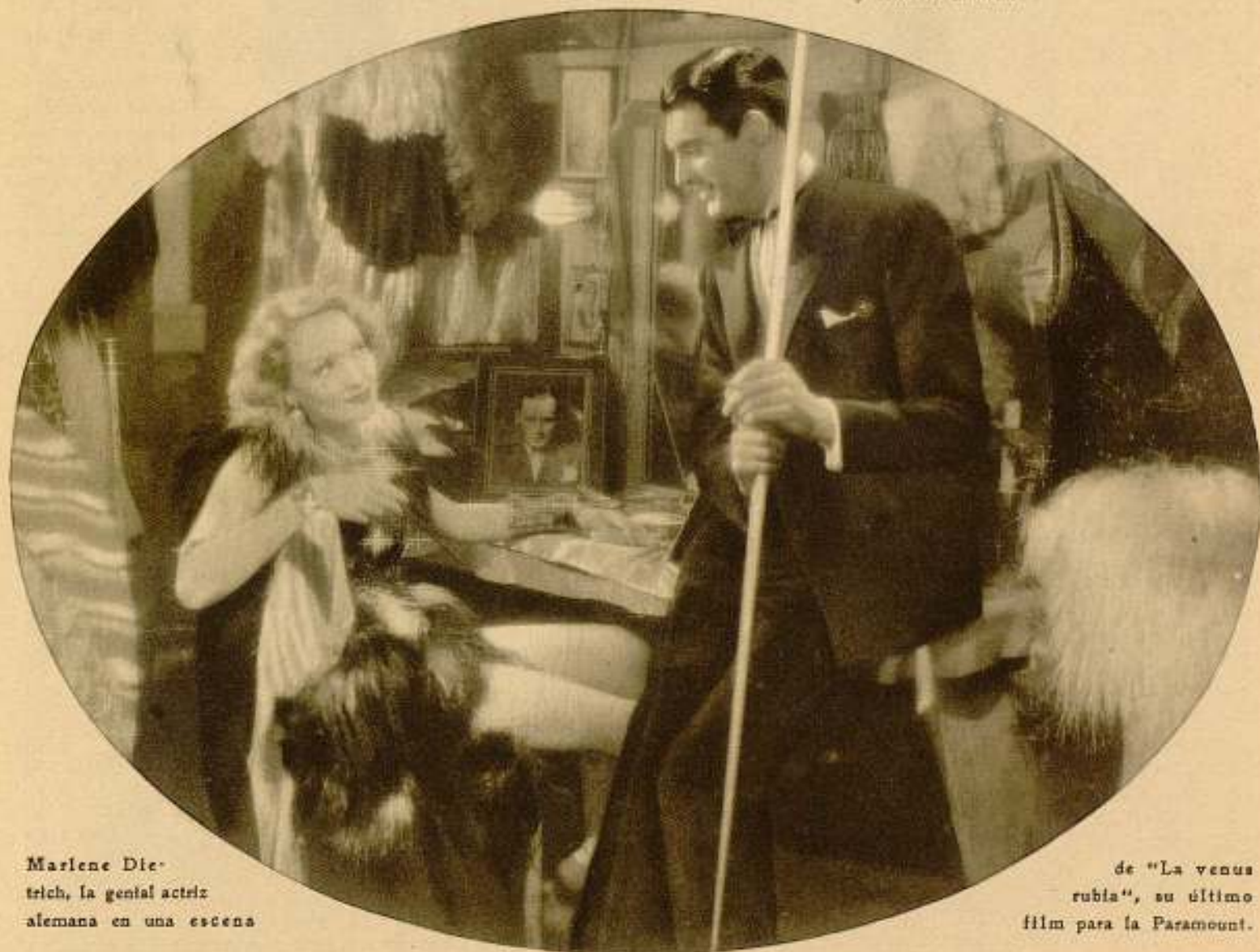
Marlene Dietrich, la genial actriz alemana en una escena

Todo en la «estrella» alemana es admirablemente fotogénico, enormemente expresivo y sensible al arte.