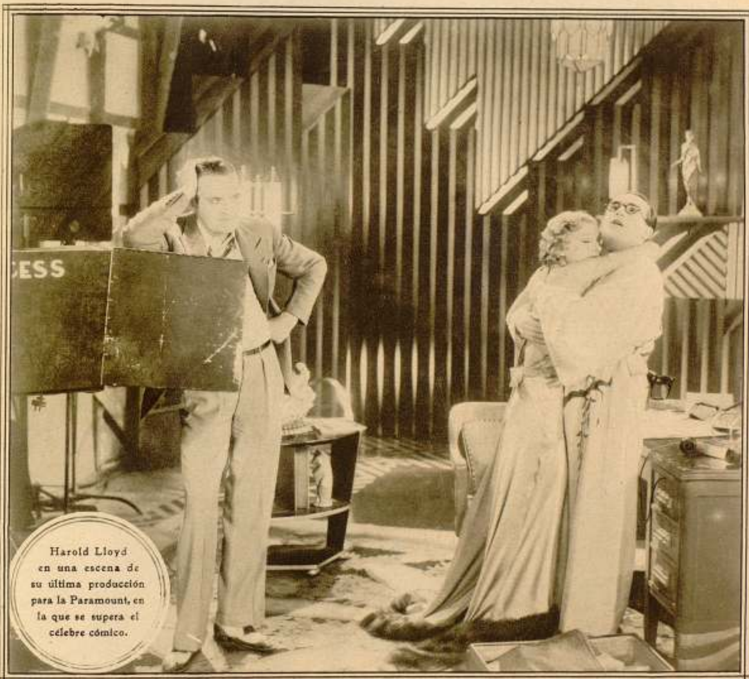
Harold Lloyd en una escena de su última producción para la Paramount, en la que se supera el célebre cómico.