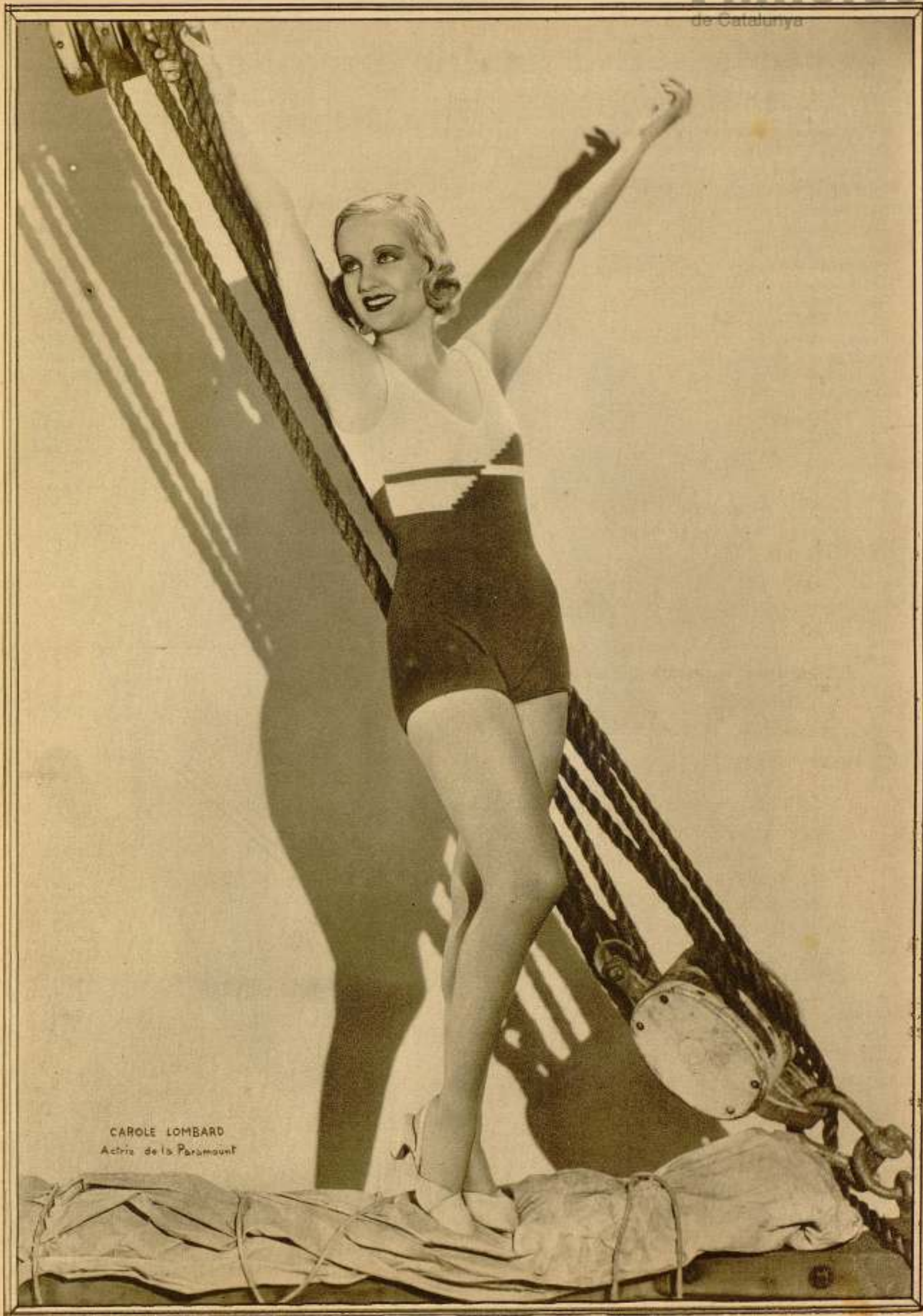
CAROLE LOMBARD Actriz de la Paramount