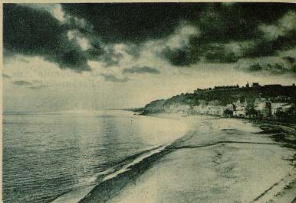
Uno de los espléndidos panoramas que destacan por la película "Siluetas y paisajes de Cataluña"