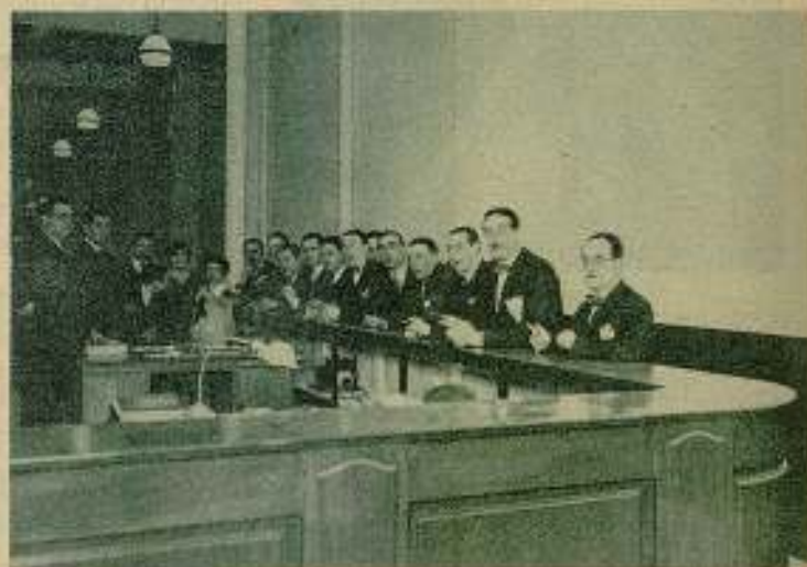
Personal de la casa alquiladora de películas "Exclusivas Diana", y algunos periodistas que analizaron el acto de apertura de las nuevas oficinas