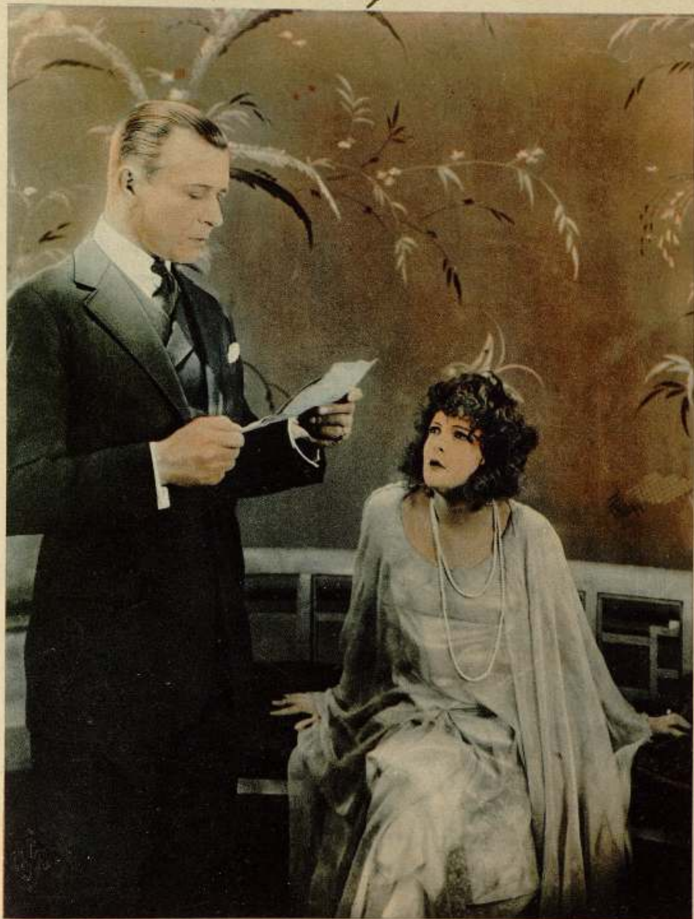
Una interesantísima escena de Celos , tragicomedia de la U. F. A. que obtendrá un éxito el día de su estreno.