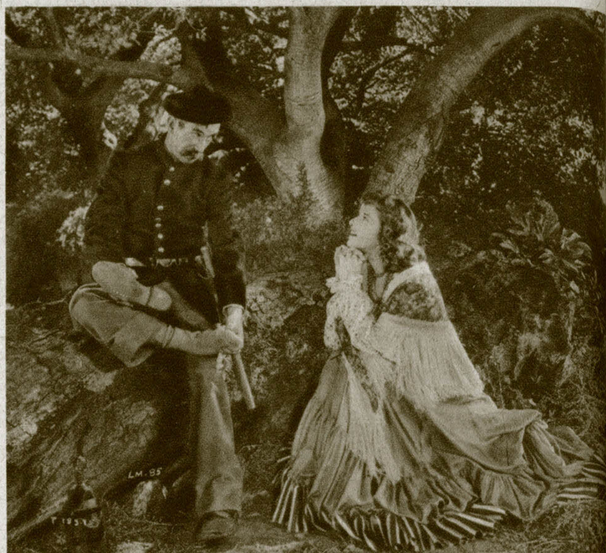
He aquí varios fotogramas de «Sangre gitana», producción Radio Films, en la que la genial Katharine Hepburn interpreta el principal papel con John Beal, como colaborador.

de juicio, y de desconcierto. ¿Cuál de todos será el mejor?