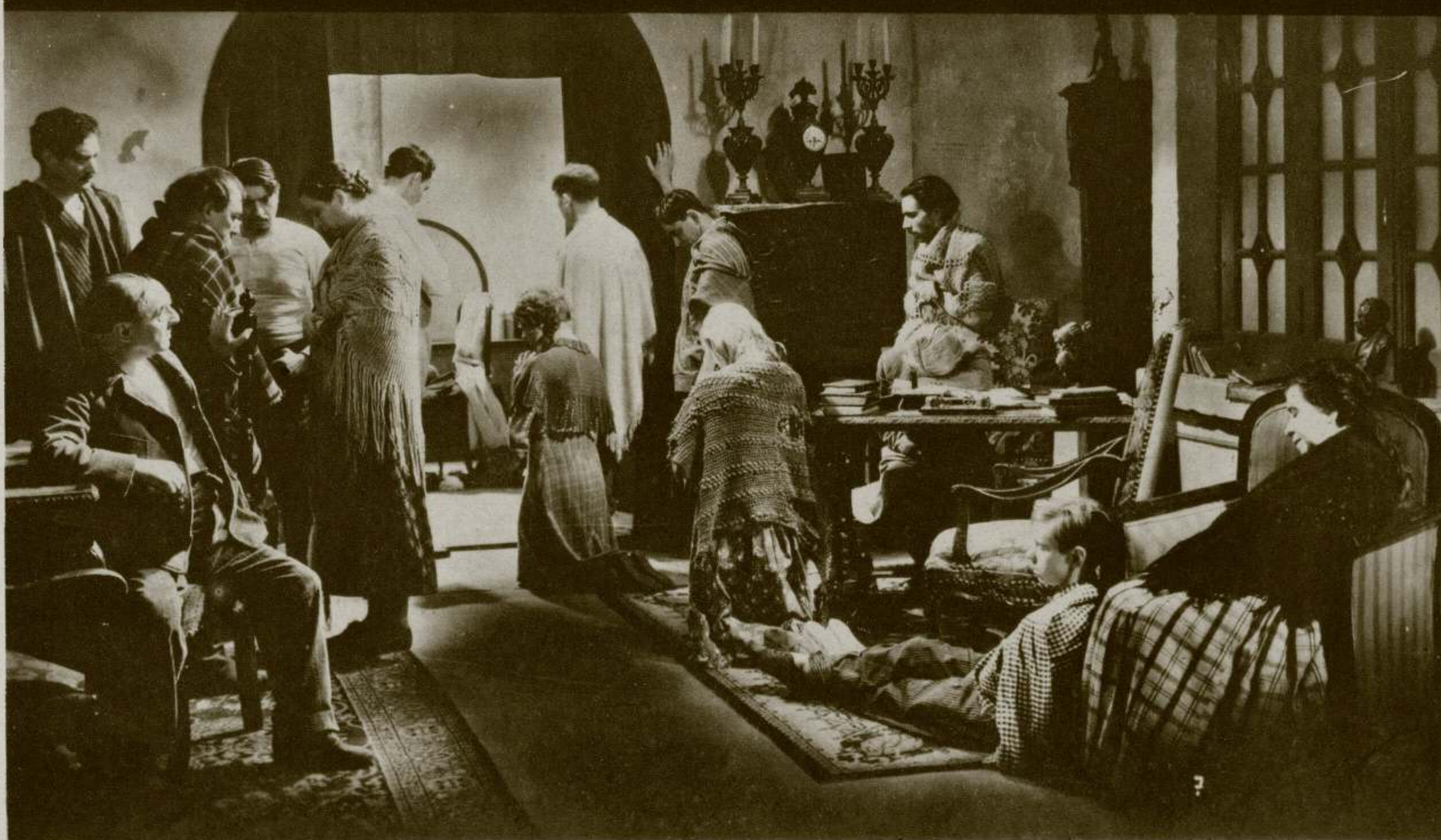
Un momento de gran intensidad dramática del film «Poncho Blanco»