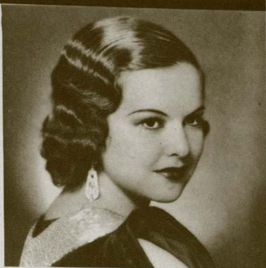
FICHA NÚM. 127: MAPY CORTÉS