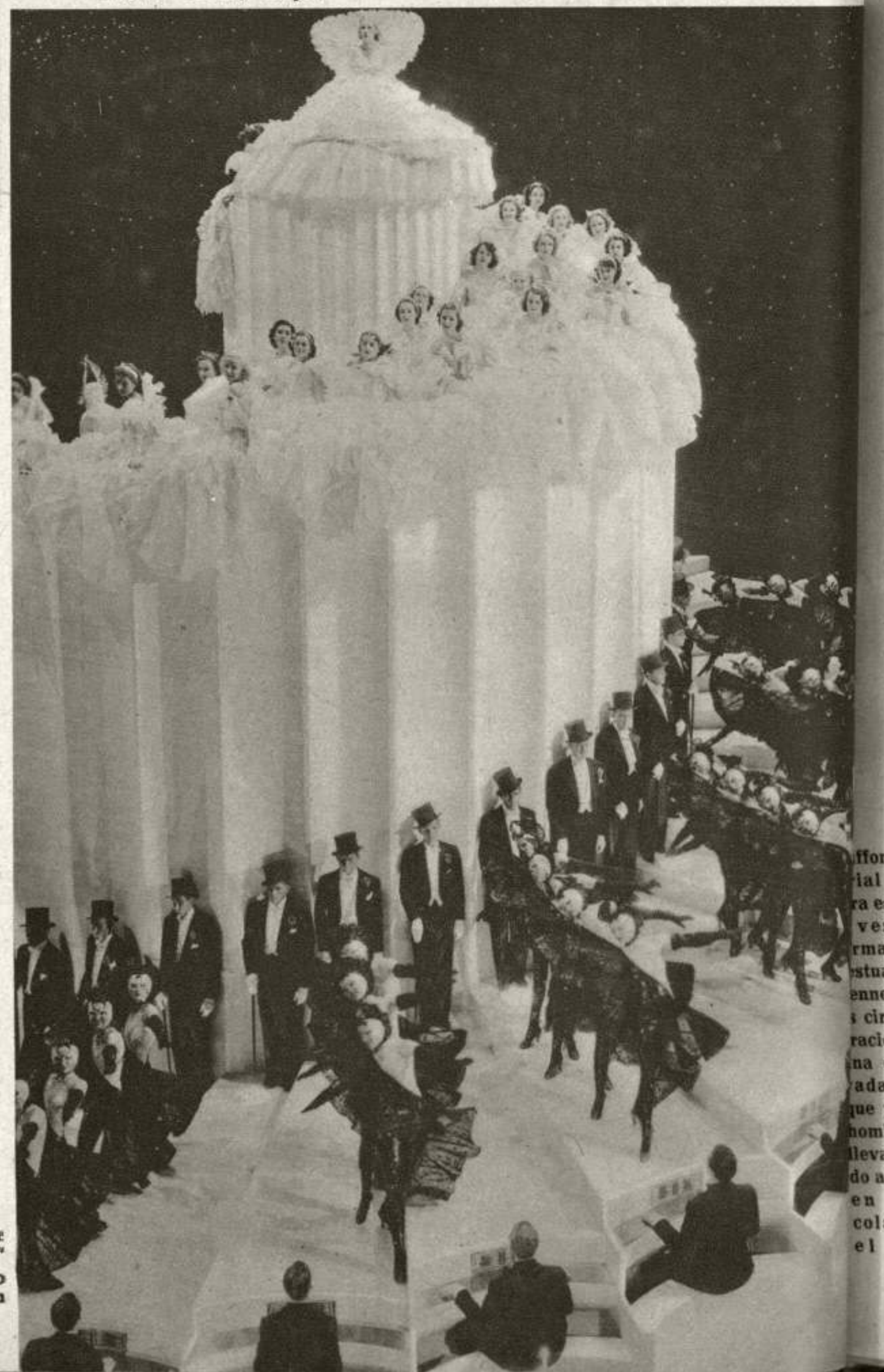
Una vistosa escena de «The Great Ziegfeld»... las girls, un puñado de bellezas, desfilan gloriosamente...