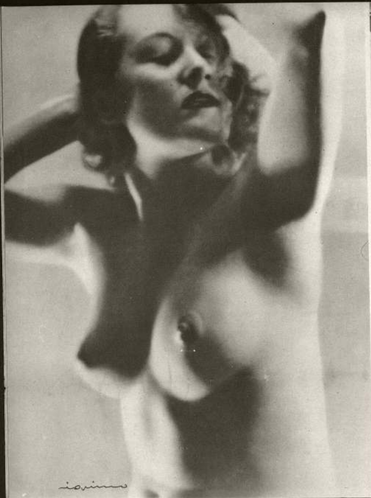
«Sensualidad», estudio de Iquino