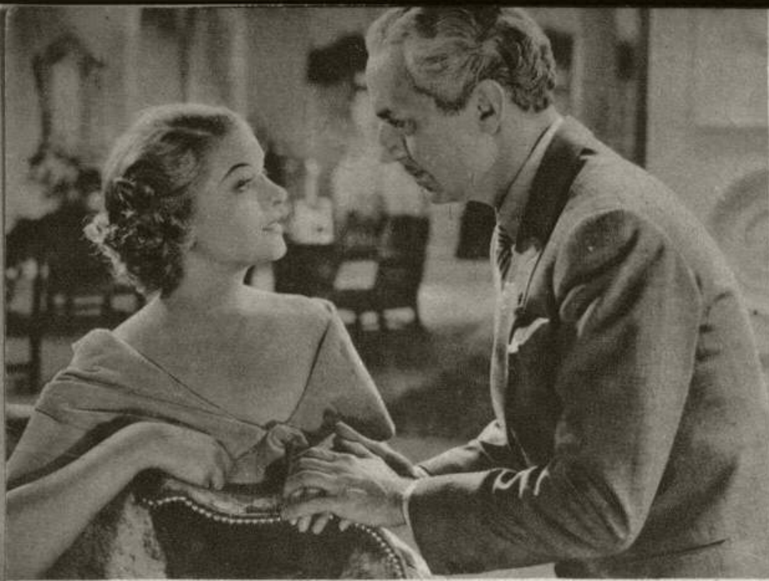
Myrna Loy y William Powell ...sólo se les ve en las tres últimas cuartas partes de la película...