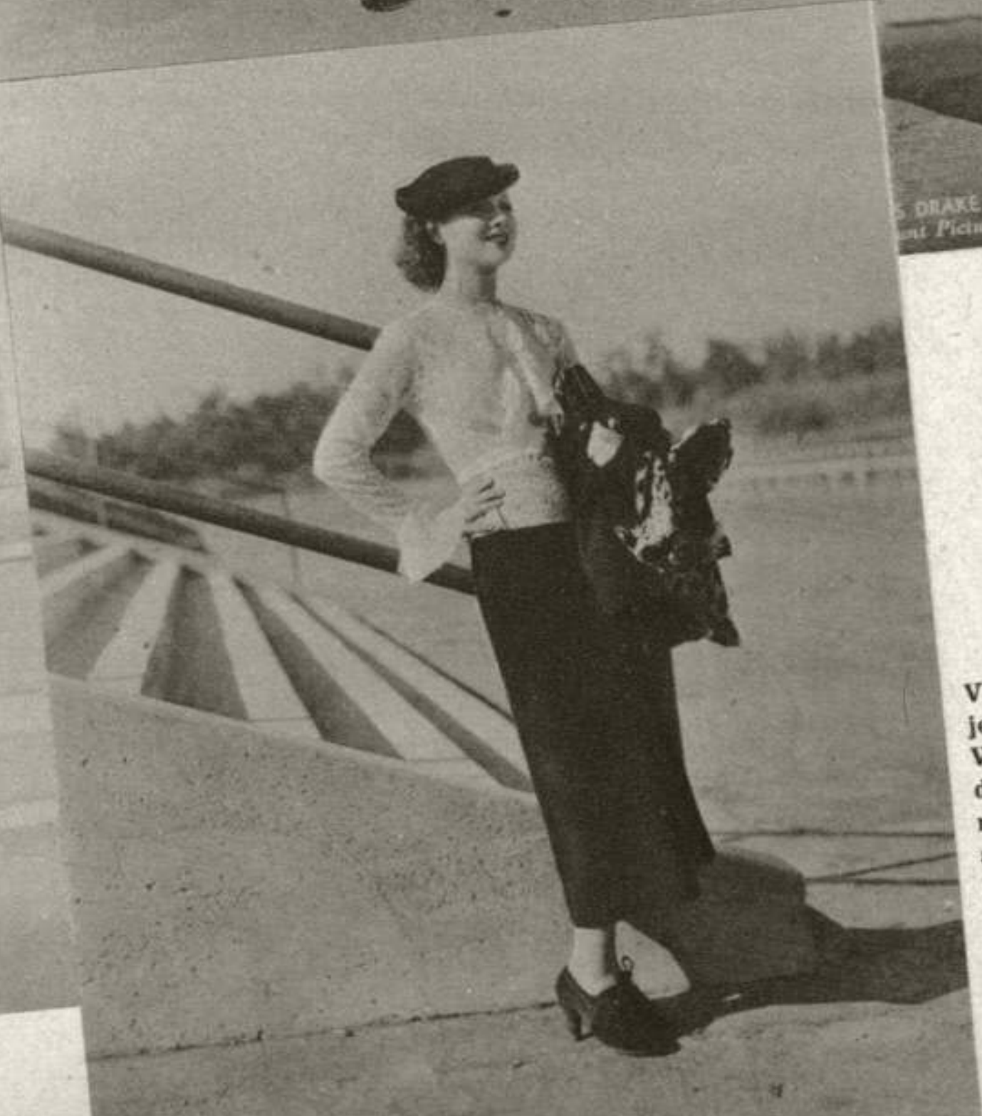
Verde oscuro es el tono de este traje de dos piezas que lleva Eleanore Witney. La chaqueta y falda son de líneas simples y el único adorno consiste en una piel de leopardo aplicada al cuello. Con este traje, la bella actriz lleva una blusa de puntilla de lana de color beige. Un sombrero diminuto de fieltro negro y guantes, zapatos y monedero de gamuza negra completan el conjunto de esta doble toilette.