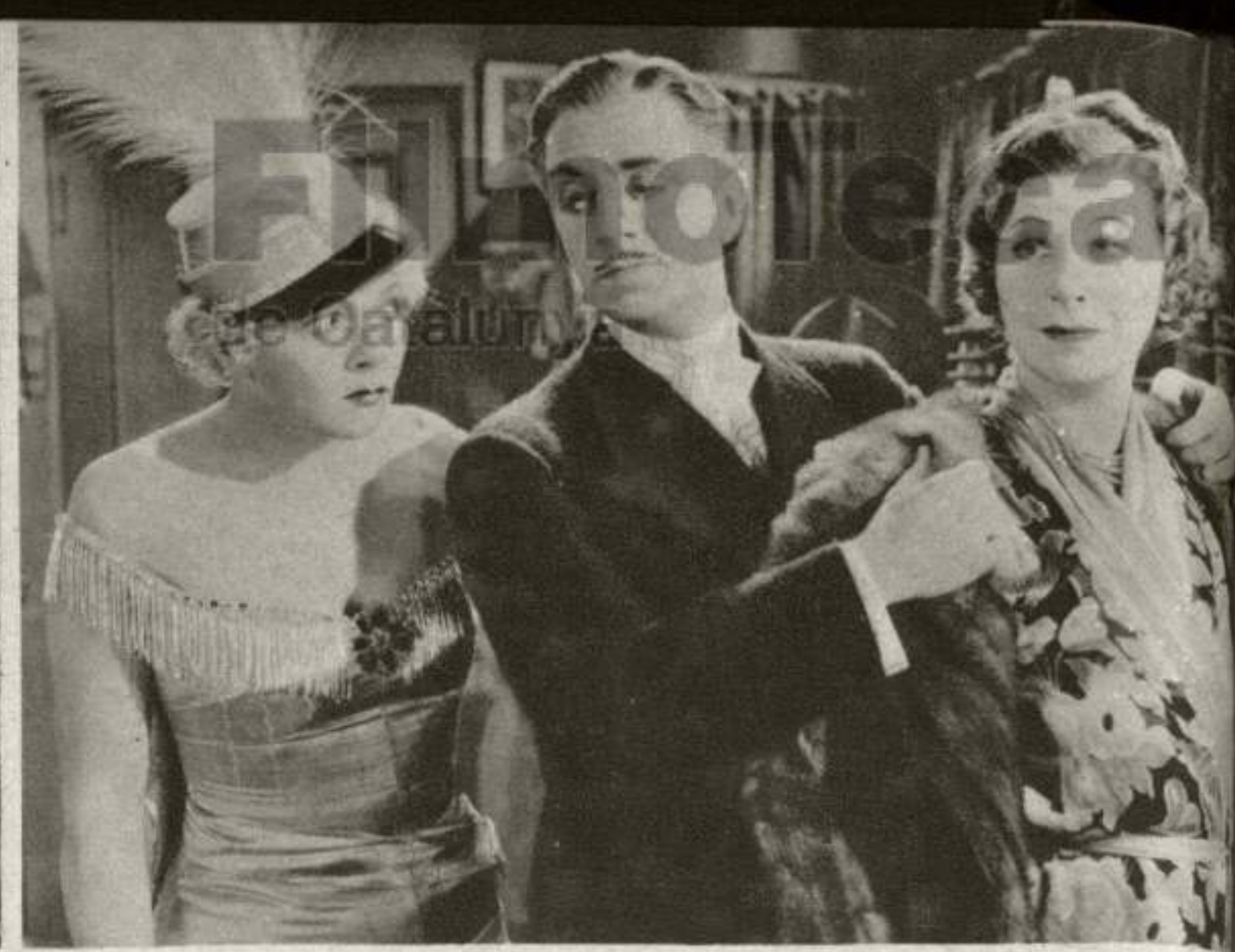
Virginia Bruce, William Powell y Fannie Brice ...lo que va en fealdad va en gracia y todo se compensa...