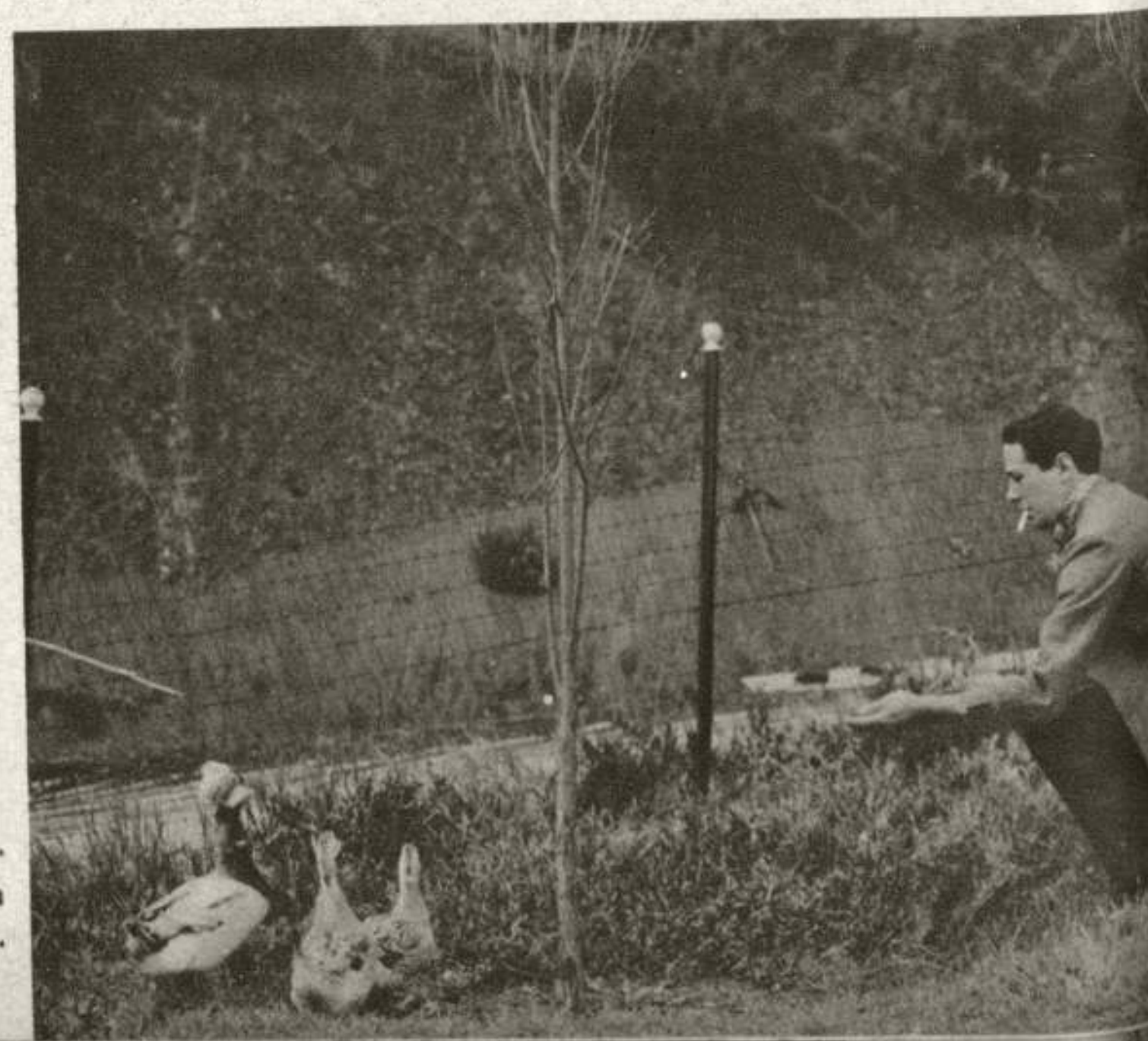
He aquí cuatro instantáneas de este admirable artista de Warner Bros. En tres de ellas el fotógrafo le ha sorprendido fuera del estudio en tres momentos de su vida privada de deportista y hombre de mundo.