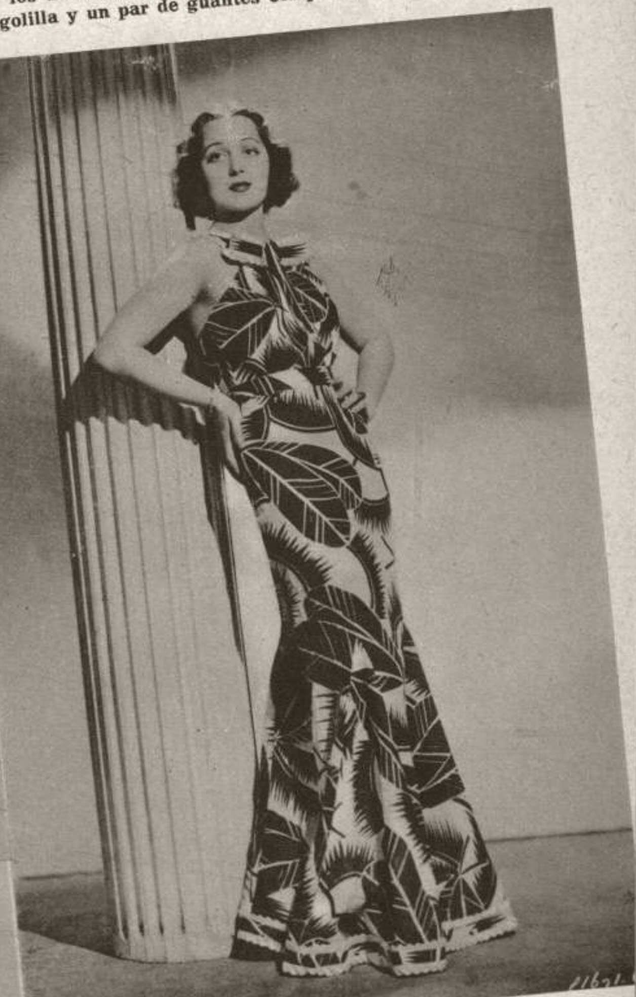
El algodón se impone... Frances Drake, escoge un vestido de satén de algodón estampado blanco y azul. El extravagante trazo azul oscuro sobre fondo blanco da a este modelo un tono aristocrático. Obsérvese el pliegue triangular que guarnece las tiras de los hombros.