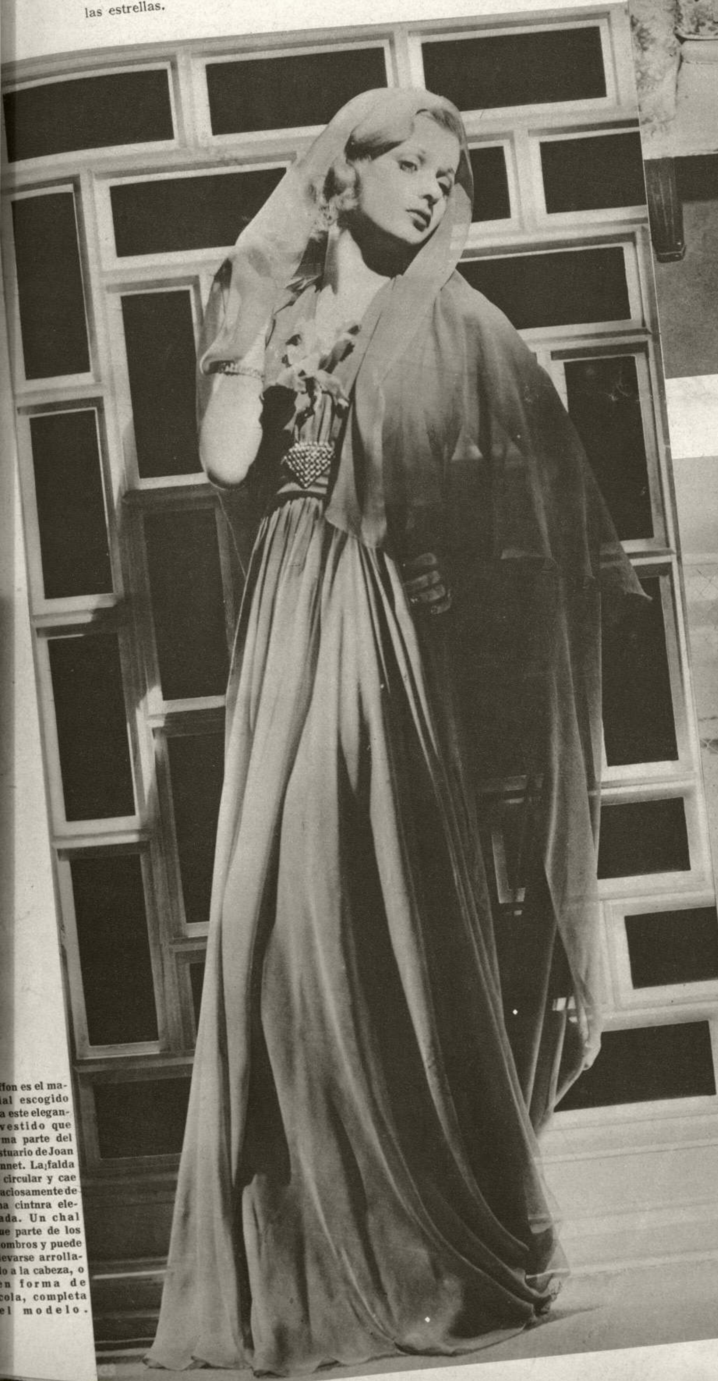
Este es el modelo escogido para este elegante vestido que forma parte del atuendo de Joan Bennet. La falda circular y cae aciosamente de la cintura elevada. Un chal que parte de los hombros y puede verse arrollado a la cabeza, o en forma de cola, completa el modelo.