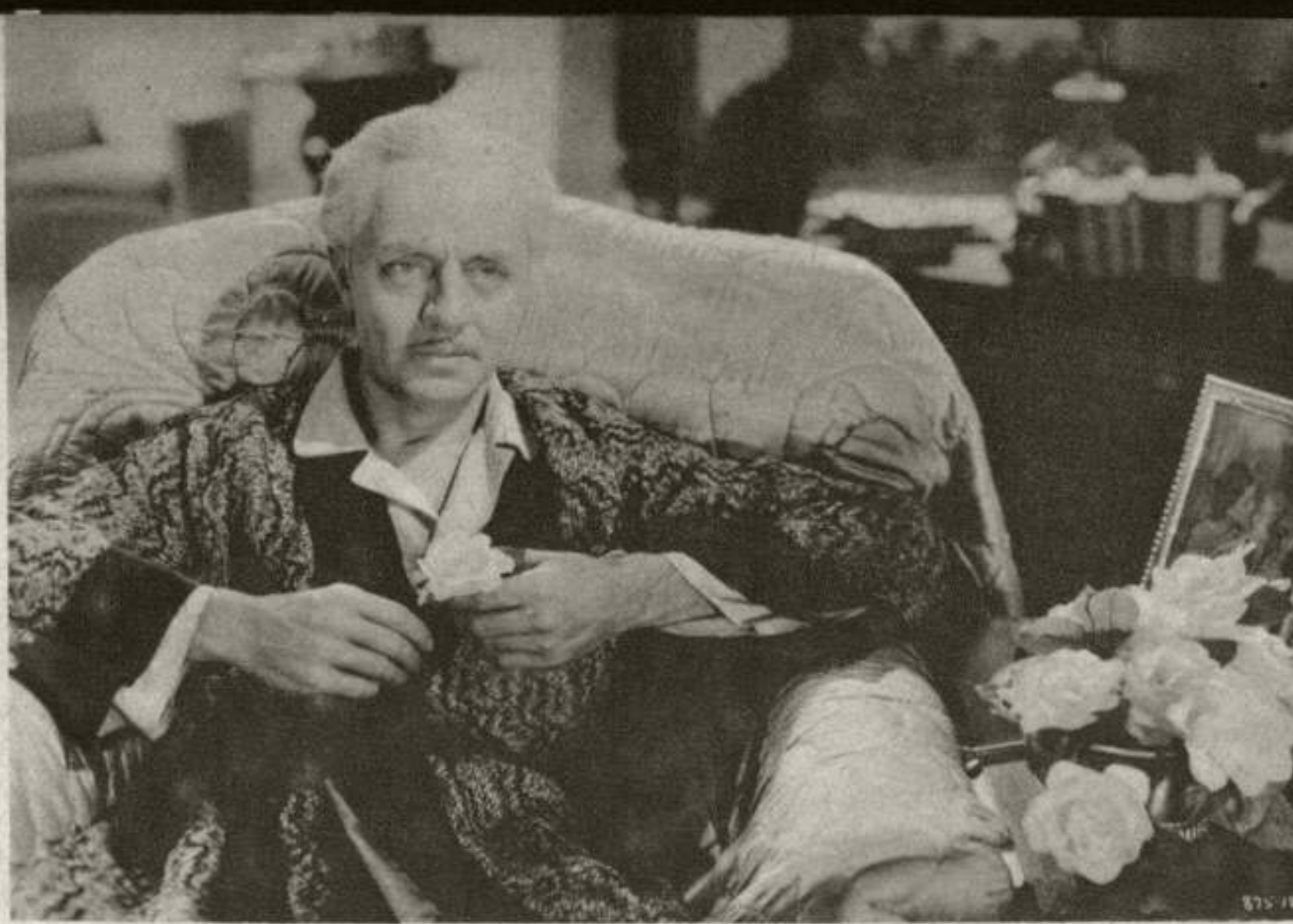
William Powell en su interpretación de Ziegfeld ...no nos hacen caso y el padre de las "follies" expira con una blanca flor en la mano...