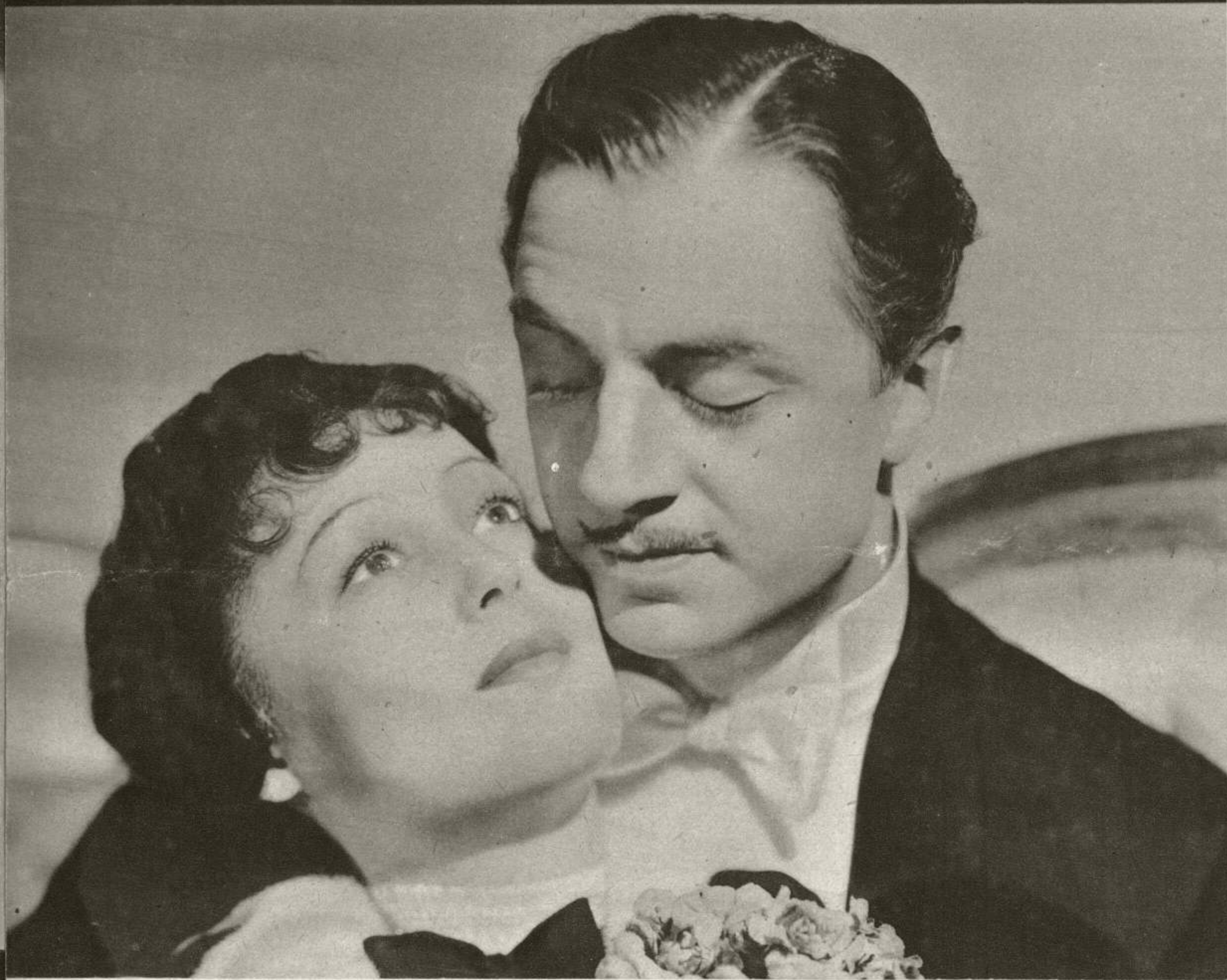
William Powell y Louise Rainer—... de paso el espectador descubre a una gran artista y se siente un poco Colón...

Y o que estoy muy lejos de ser millonario, he pagado diez dólares por una butaca para presenciar las «follies» que presentaba el señor Ziegfeld en el Amsterdam Theatre de Nueva York. Lo menos que he llamado al pobre señor Ziegfeld, en mientes, ha sido bandido.