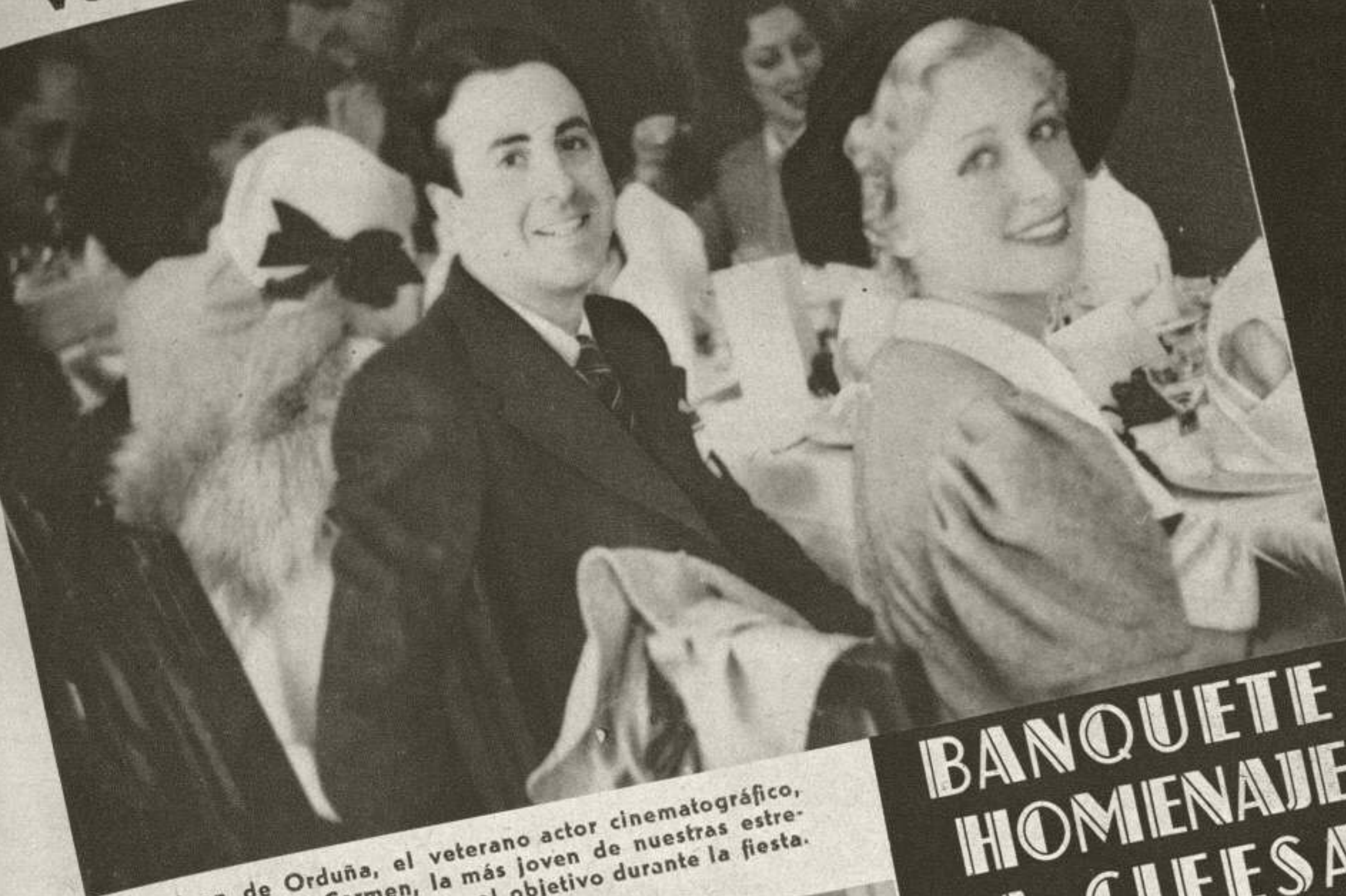
Juan de Orduña, el veterano actor cinematográfico, y Mary del Carmen, la más joven de nuestras estrellas, tal como los «cazó» el objetivo durante la fiesta.