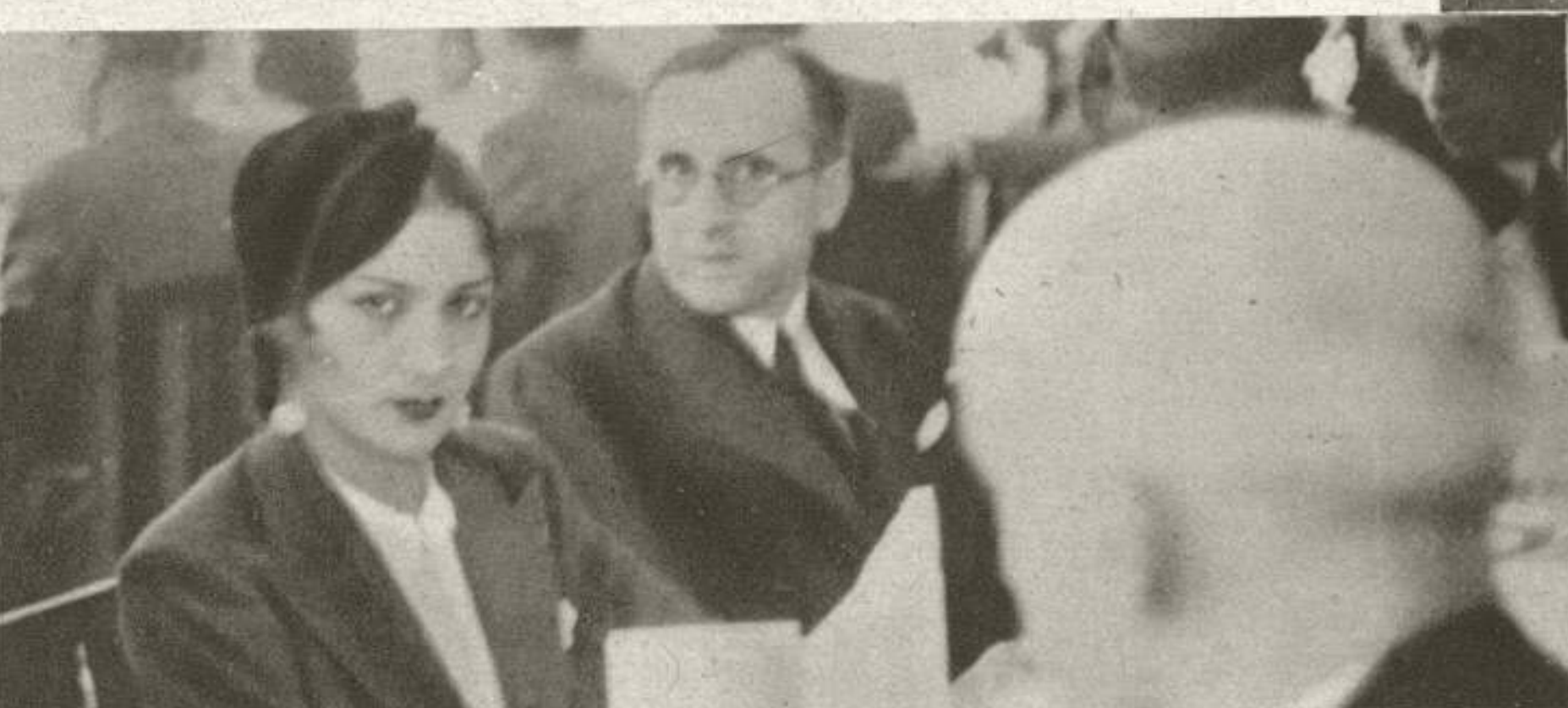
Carmen Amaya, la bella bailarina gitana que recientemente celebró sus bodas con la producción nacional en el film "María de la O".

Para conmemorar la centésima proyección de la película "MORENA CLARA", en Madrid y Valencia, se celebraron grandes festejos, propios de tal solemnidad. A la bella ciudad del Turia, acudieron las más destacadas figuras del cinema español al llamamiento de la prensa valenciana, para testimoniar su admiración a CIFESA, la marca que ahora como nunca merece el título de "antorcha de los éxitos". Ofrecemos varias instantáneas tomadas en la función de gala que se celebró en el Olympia, y en el banquete con que fueron obsequiados los artistas y autoridades.