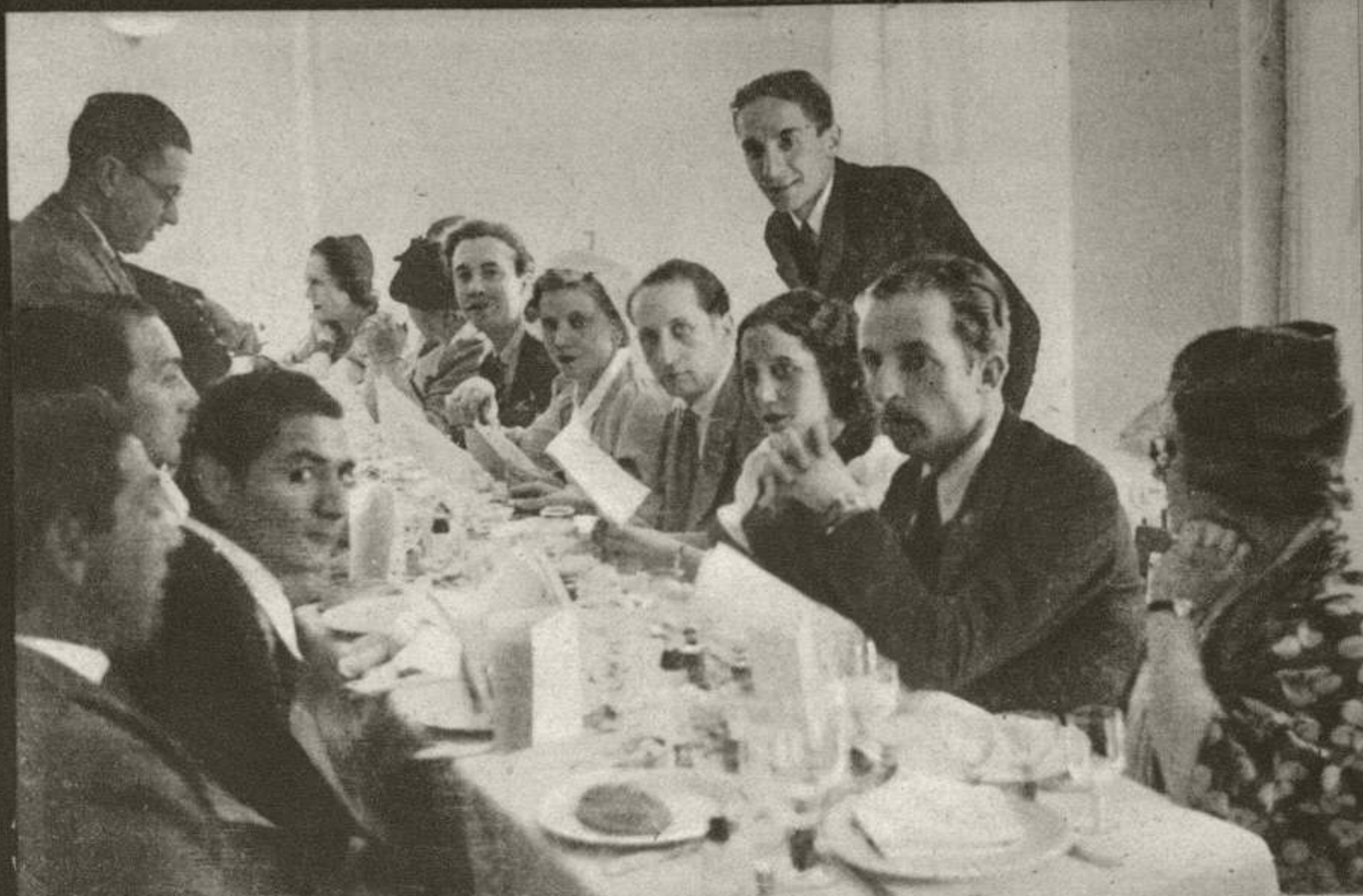
Un grupo de asistentes al banquete que, presidido por los directores de Cifesa, y con asistencia de las autoridades, artistas de la casa y la prensa valenciana, se celebró recientemente en la ciudad del Turia.