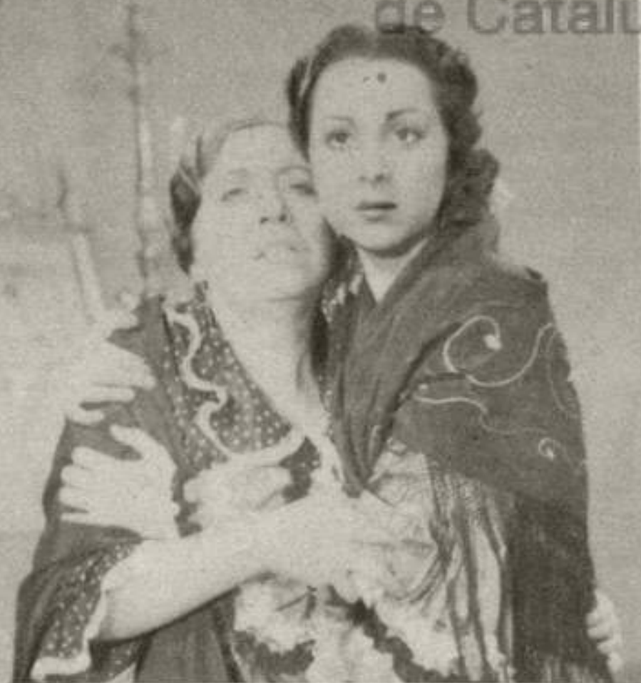
«El gato montés»