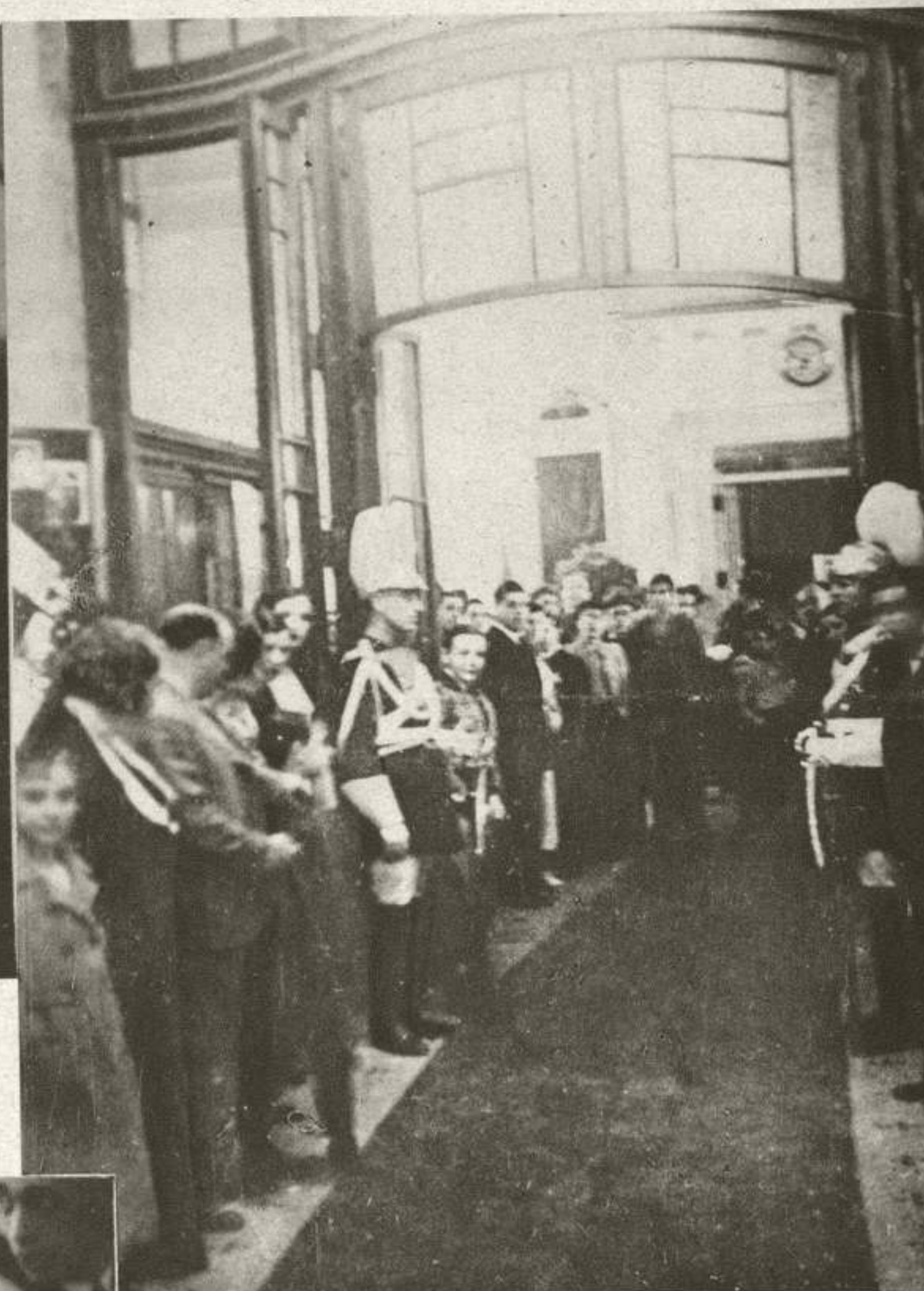
Un aspecto del vestíbulo de Olympia, donde se celebró el banquete.