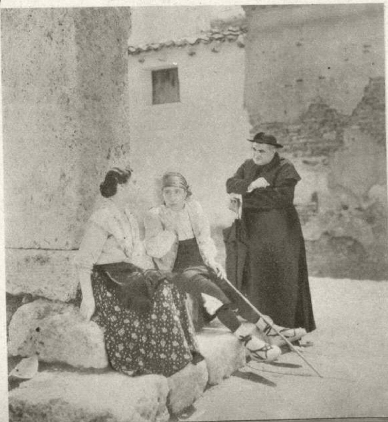
«Currito de la Cruz»

cio de una estabilidad perdurable». La realidad nos está ratificando las palabras de Piqueras, que fueron combatidas con muy buena intención por Antonio Guzmán. El cinema hispano, tal y conforme hoy está orientado, no puede durar mucho tiempo. En su espíritu brotan la incultura y el anacronismo. Buena prueba de ello es el hecho de que se hayan repetido casi todos los temas del cinema mudo: «Currito de la Cruz», «Nobleza baturra», «Niño de las monjas», «La hermana San Sulpicio», «La casa de la Troya», «Luis Candelas», «Rosario la cortijera»... ¿Es que España no ha evolucionado nada en el aspecto social, político y cultural desde entonces acá? Todo el sistema de la vida española ha sido removido, aunque no revolucionado. Ha habido huelgas, muchas huelgas, revoluciones, cambios políticos... Por las fronteras ha entrado lo mejor de la cultura internacional: libros de Waldo Frank, de Remarque, de John dos Passos, Upton Sinclair, Henry Barbusse, Máximo Gorki, Romain Roland, Sinclair Lewis, Ilya Ehrenburg, Fedor Glad-