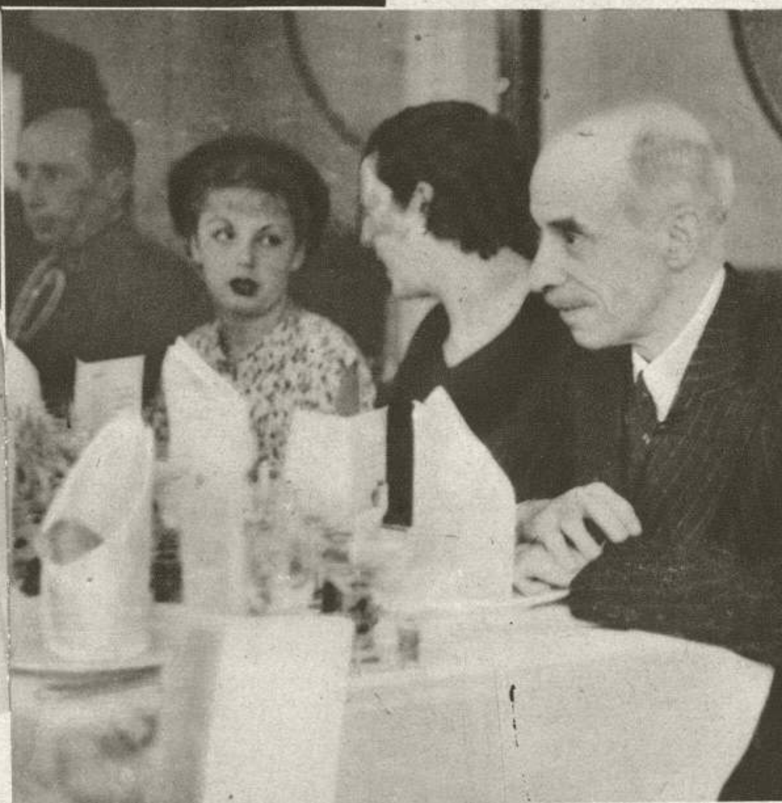
D. Gregorio Martínez Sierra, el ilustre escritor, cuyas actividades cinematográficas le han alejado de sus antiguas empresas literarias.