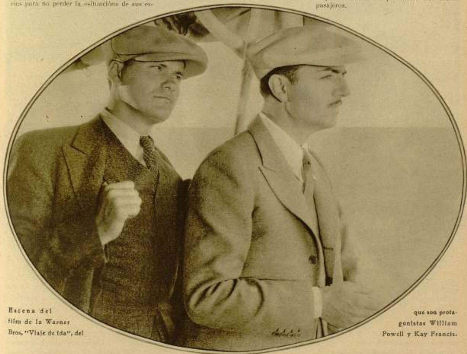
Escena del film de la Warner Bros. «Viaje de ida», del

daban para conducirles a la ciudad, con una tristeza no confesada, pero que pesaba sobre todos como una cosa irreparable, pues sabían que nunca se presentará dos oportunidades como la que acababan de gozar en ese viaje de ensueño del que habían sido únicos pasajeros.