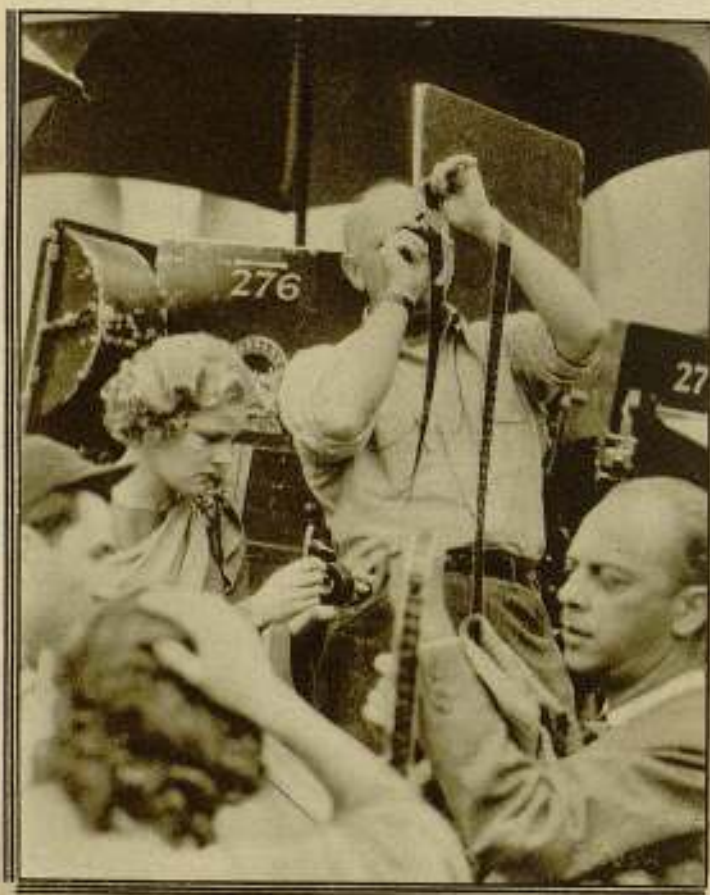
El gran director Cecil B. de Mille y la deliciosa Eliza Landi, revisando unos cuadros de «El signo de la Cruz».

A veces, por excepción, se adaptan historias de las que nunca se hizo una sinopsis.