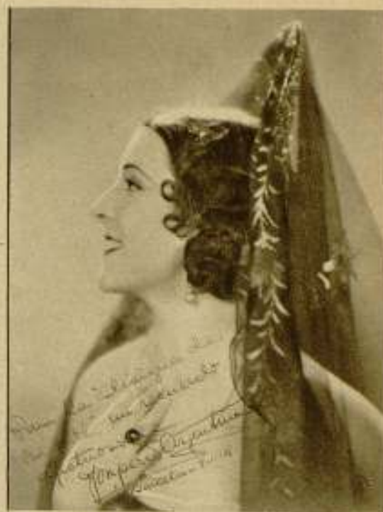
CLINIQUE DE BEAUTÉ, - Rambla de Catalunya, 5

Al llegar al puerto, después de haber rodado la escena final tomando el desembarque de todo el pasaje del vapor, los artistas subieron a los automóviles que les aguardaban para conducirles a la ciudad, con una