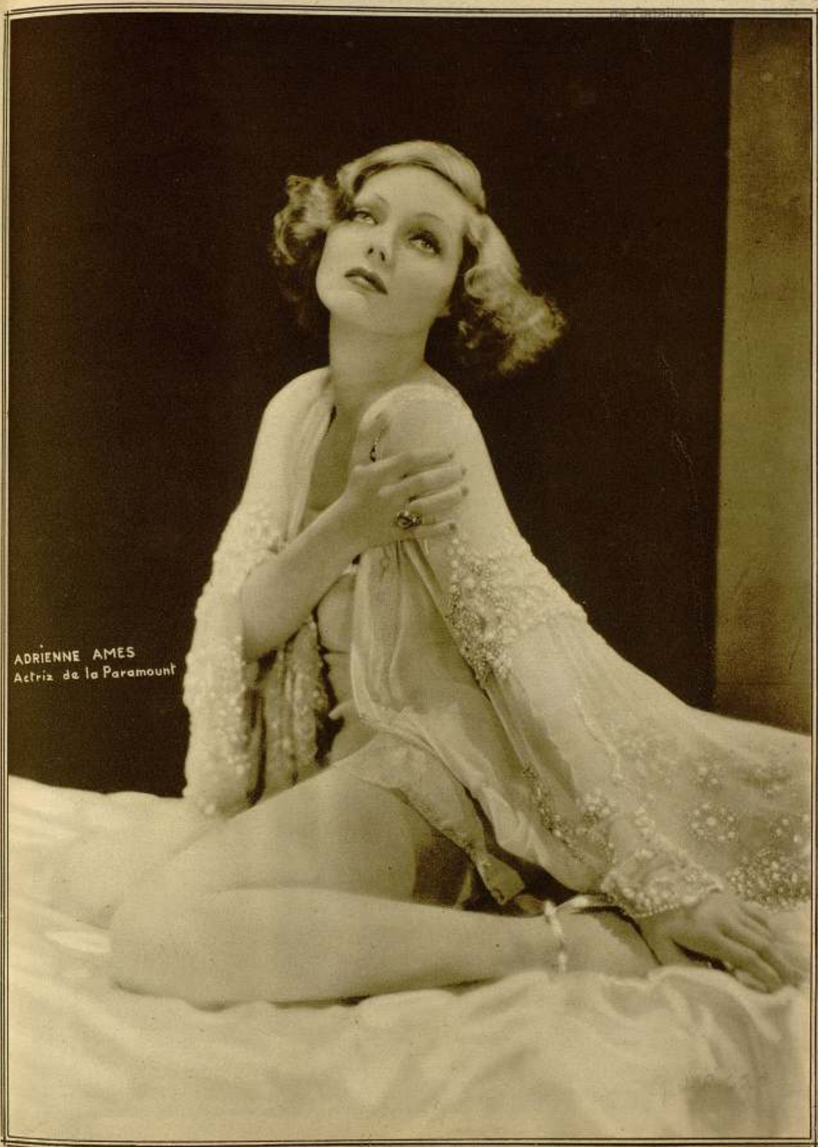
ADRIENNE AMES Actriz de la Paramount