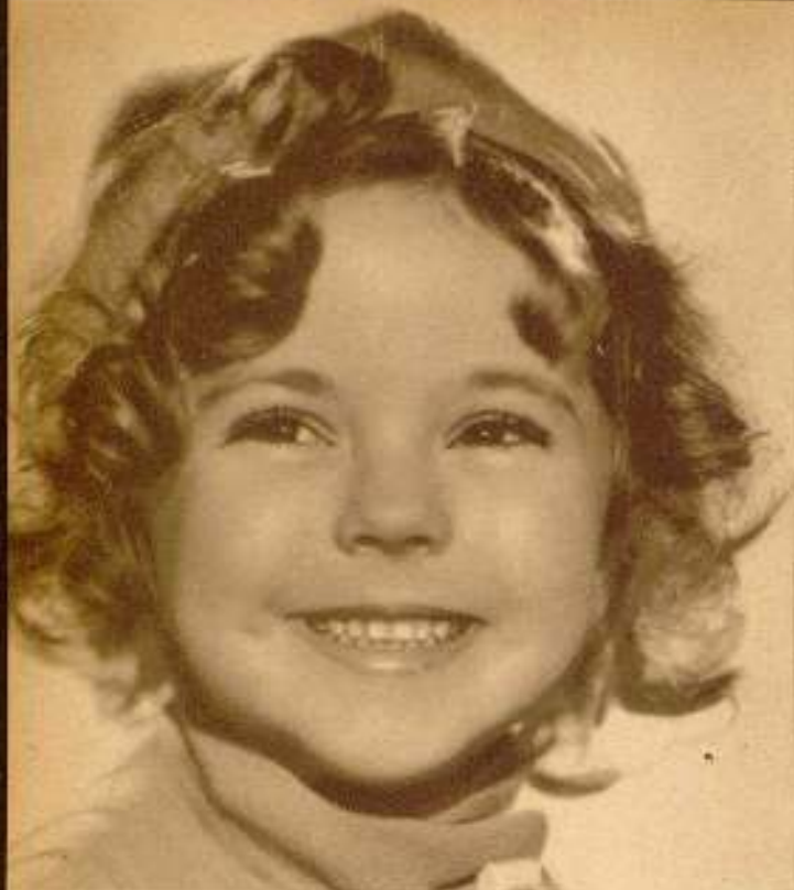
Shirley Temple, menuda y encantadora "little star" de la Fox.