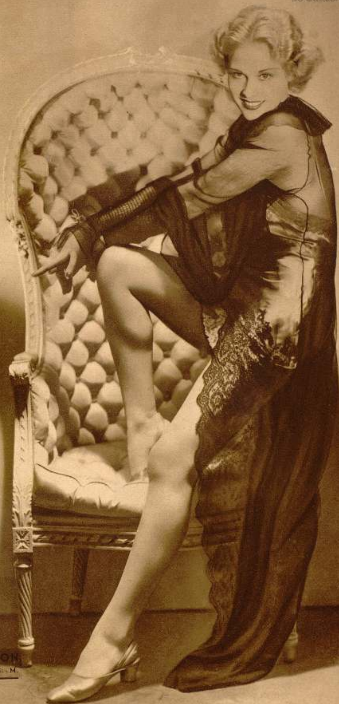
ESTHER RALSTON ACTRIZ DE LA M. G. M.