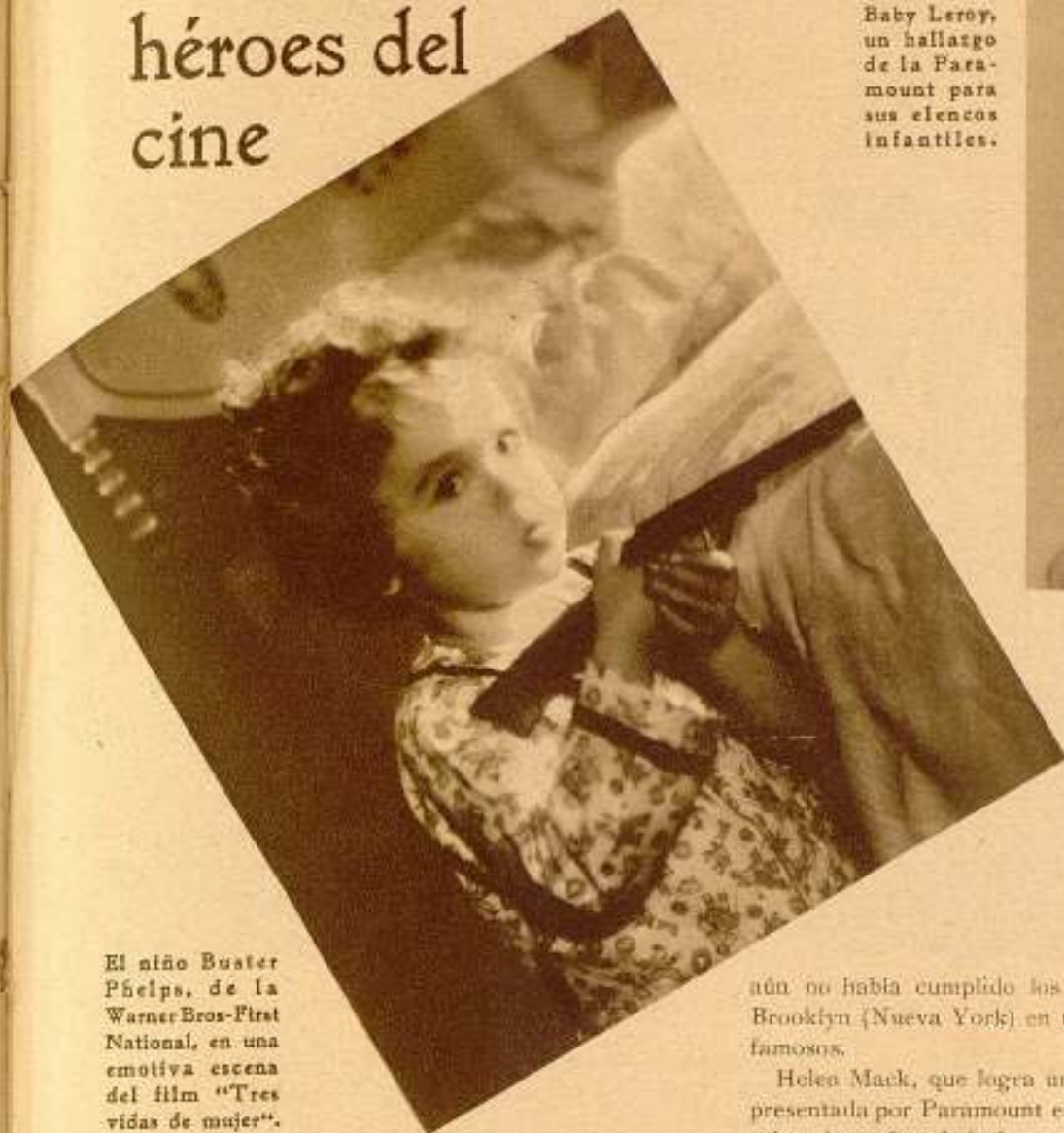
El niño Buster Phelps, de la Warner Bros-First National, en una emotiva escena del film "Tres vidas de mujer".

Baby Leroy, un hallazgo de la Paramount para sus elencos infantiles.