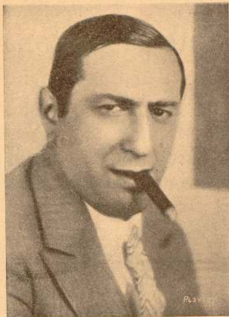
Lubitsch, el genial realizador de «Remordimiento», admirable cine-drama basado en la obra cumbre de Maurice Rostand, «L'homme que je tue».

Murnau, con el característico realismo que sabe imprimirle a