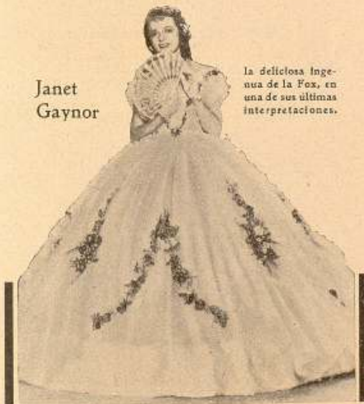
la deliciosa Inge- nua de la Fox, en una de sus últimas interpretaciones.