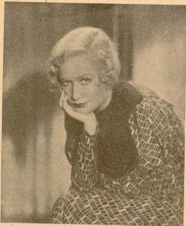
Mae West, la sugestiva "estrella" de la Pa- ramount.

Miriam Hopkins, rutilante "estrella" de la Paramount.