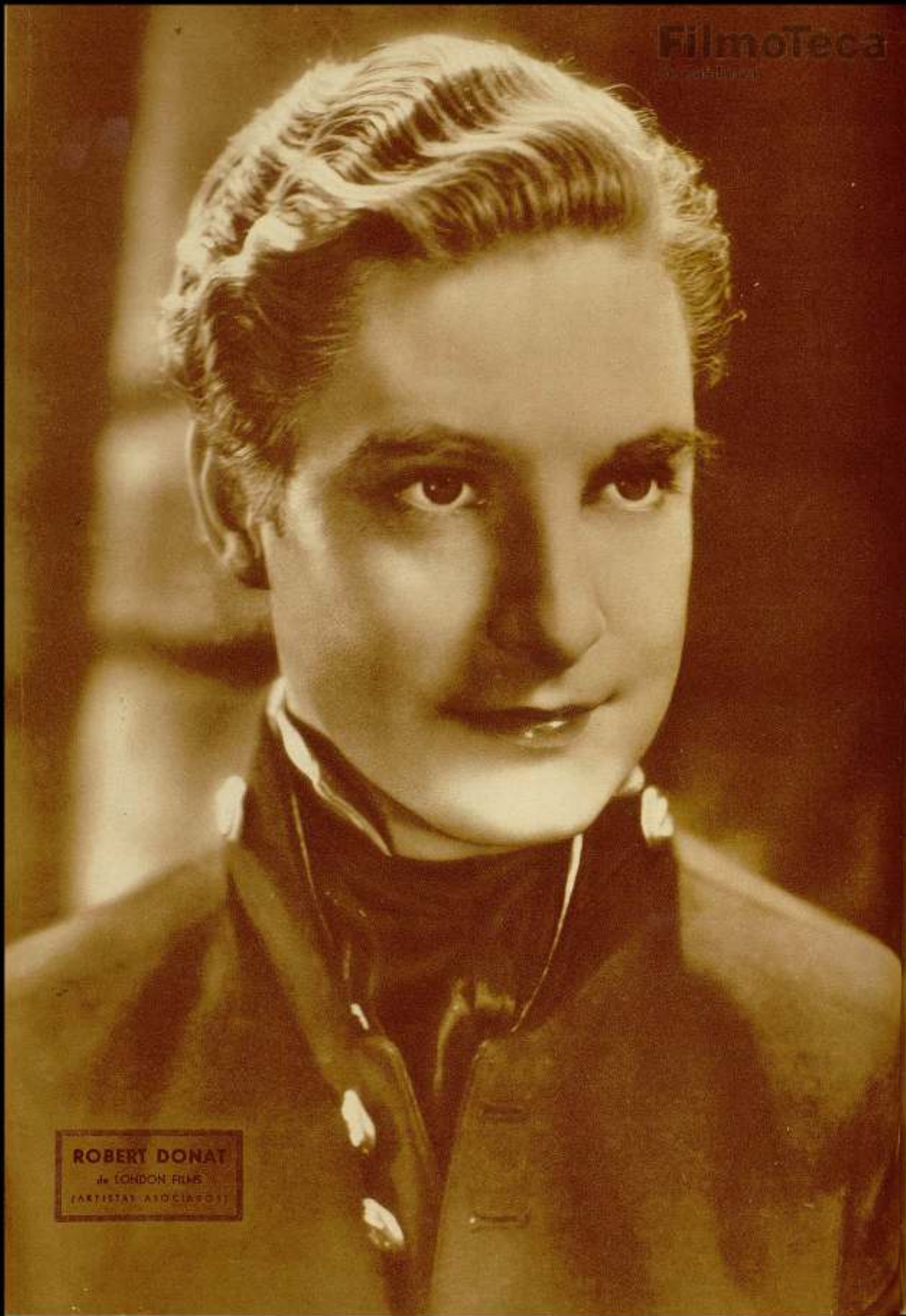
ROBERT DONAT di LONDON FILMS (ARTISTAS ASSOCIATI)