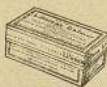
Cajas metálicas de 10 paquetes con regalo-vale.

regalo por cada docena de cajas metálicas de 10 paquetes.