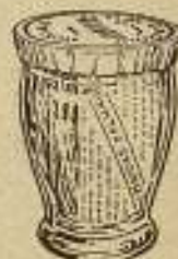
Vasos de 10 paquetes

Colores surtidos en Blanco, Azul, Verde, Topacio, Violeta y Rosa.