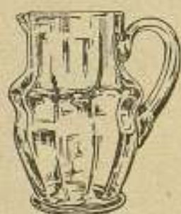
Botella y Jarro

regalo por cada docena de cajas metálicas de 10 paquetes.