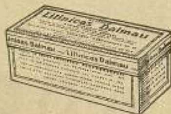
Cajas de 120 paquetes