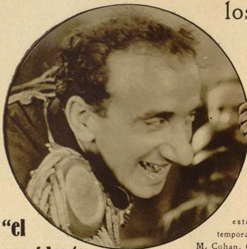
“el presidente fantasma”

este fin de temporada con George M. Cohan, Claudette Colbert y