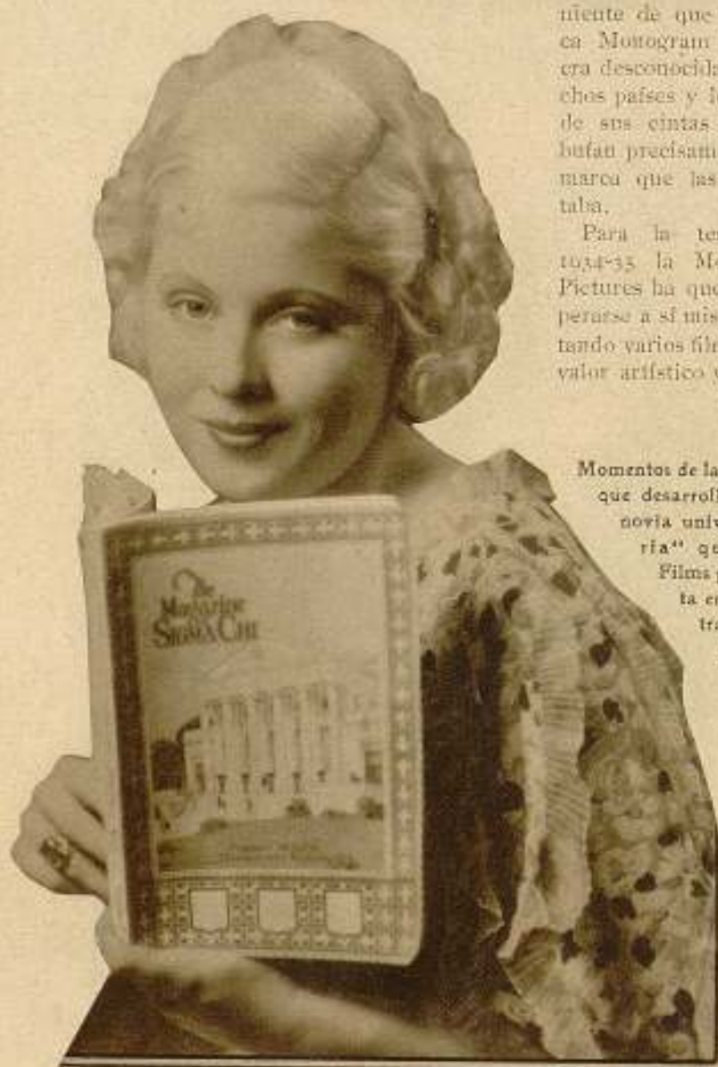
Momentos de la acción que desarrolla «La novia universitaria» que I. B. I. Films presenta en nuestras pantallas.

En esta página reproducimos varias escenas