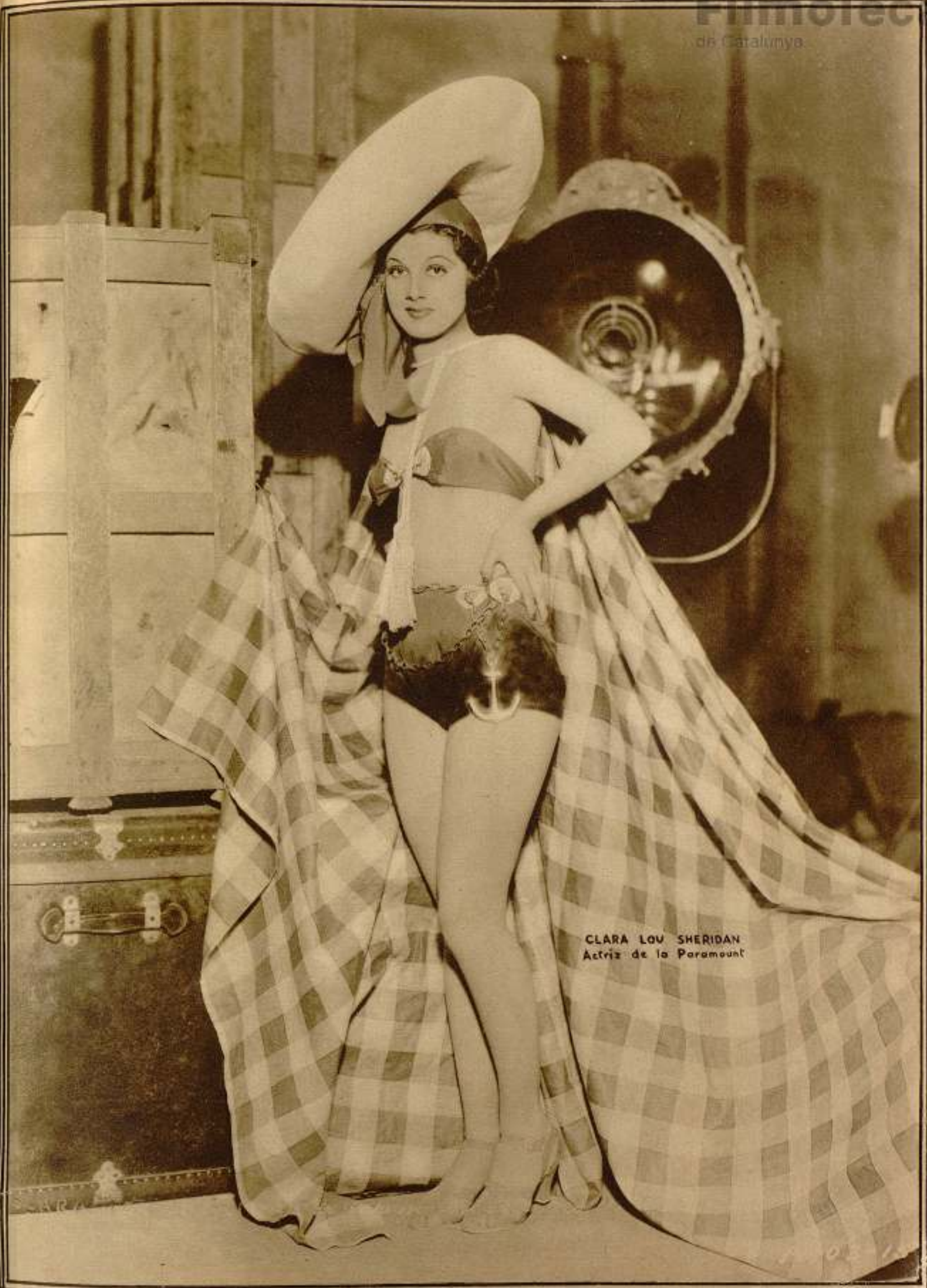
CLARA LOV SHERIDAN Actriz de la Paramount