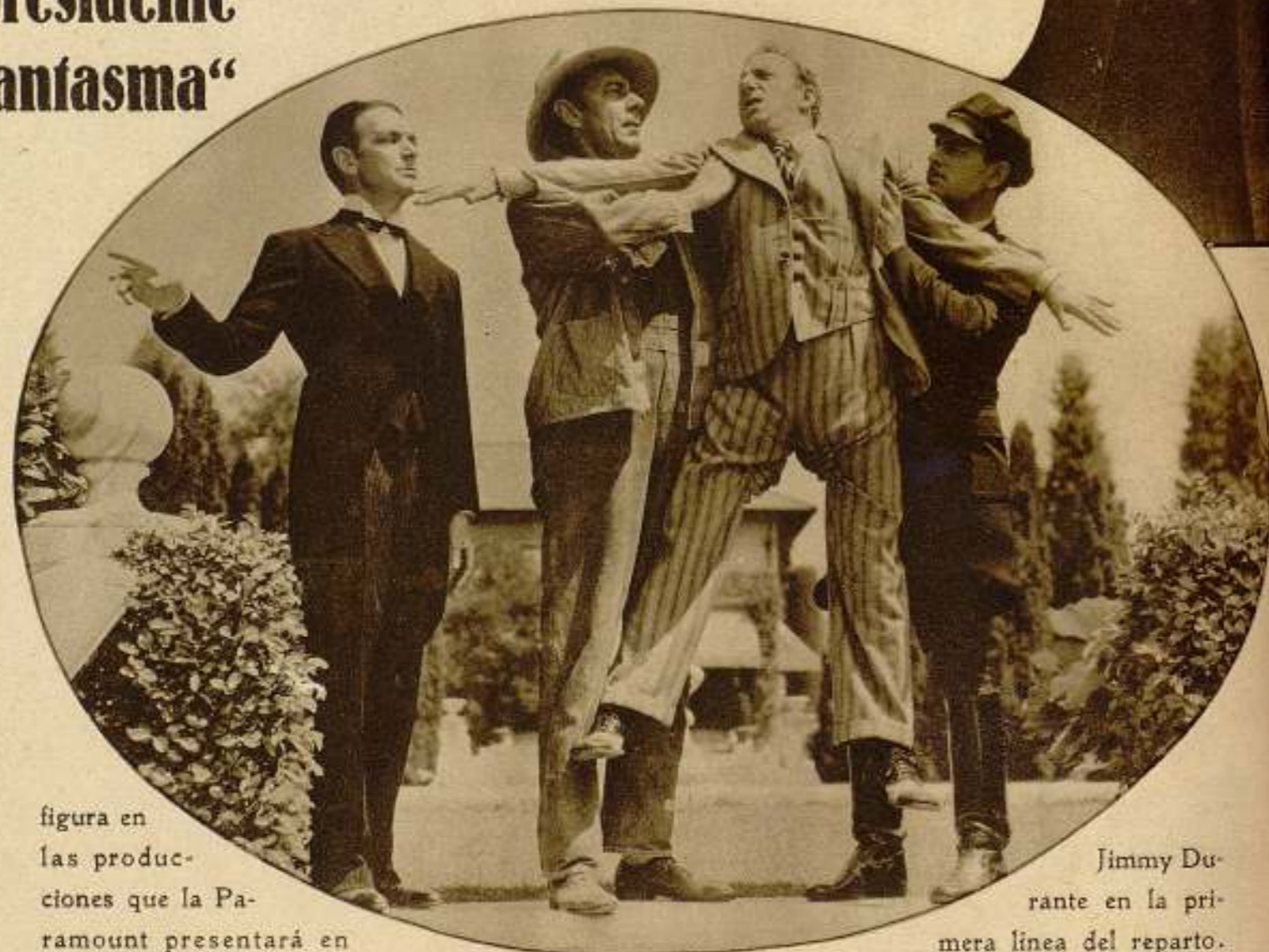
figura en las produc- ciones que la Pa- ramount presentará en

Jimmy Du- rante en la pri- mera línea del reparto.