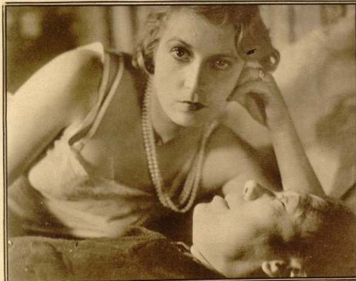
Escenas de «La cabeza de un hombre», de Exclusivas Huel.