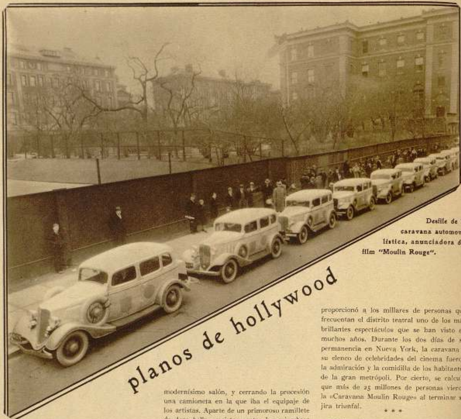
Desfile de la caravana automovi- lística, anunciadora del film "Moulin Rouge".