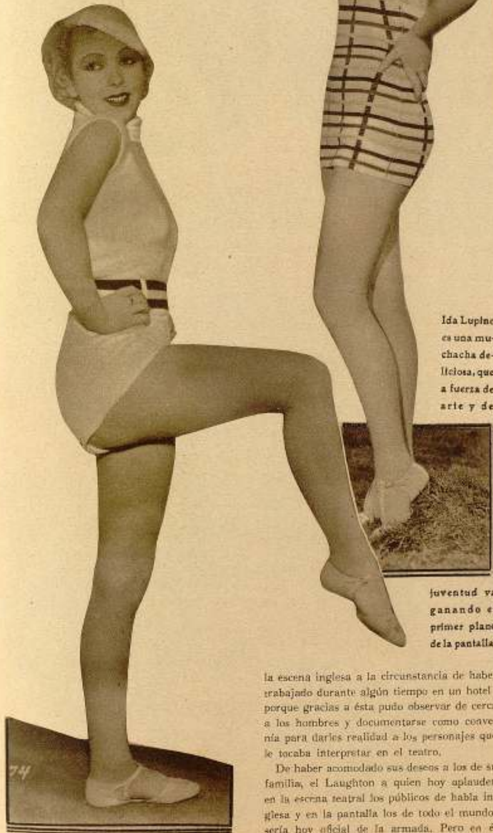
Ida Lupino es una muchacha dellosa, que a fuerza de arte y de

Charles Laughton atribuye sus triunfos en