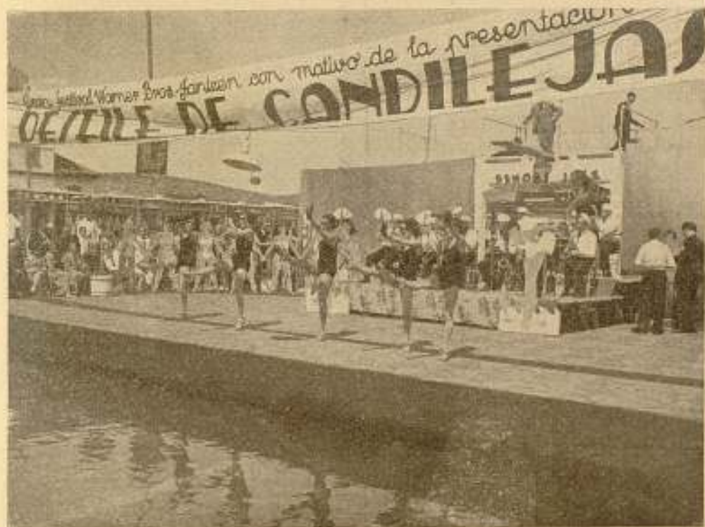
Brillante aspecto de la fiesta celebrada en Sitges con motivo del concurso organizado por la Warner Bros-First National y la casa Jantzen para la presentación de «Desfile de candilejas», estrenada en el teatro Tivoli.