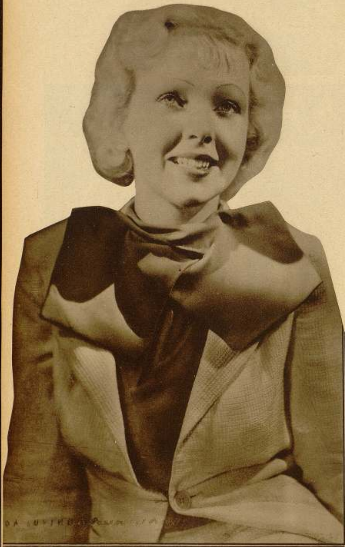
IDA LUPINO. Paramount Pictures

Mediante la representación periódica de las obras que, convenientemente arregladas, pasarán más adelante a la pantalla, no sólo adquieren los juveniles intérpretes de ellas práctica muy valiosa, sino que permiten a los directores apreciar sus capacidades para los diversos géneros dramáticos.