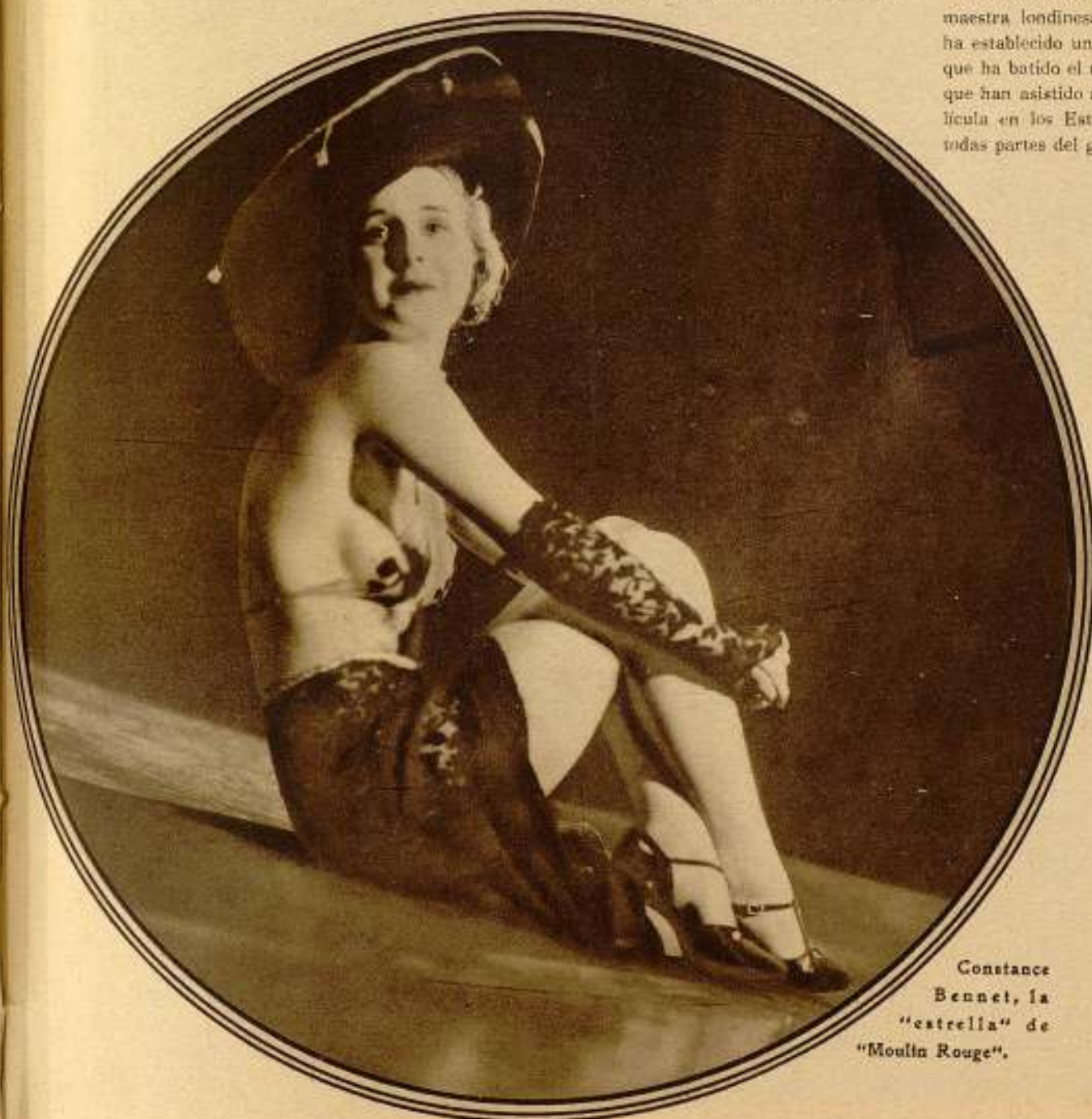
Constance Bennett, la "estrella" de "Moulin Rouge".

«El arrabal», «El emperador Jones», «Las apariencias engañan» y «A la sombra de los muelles».