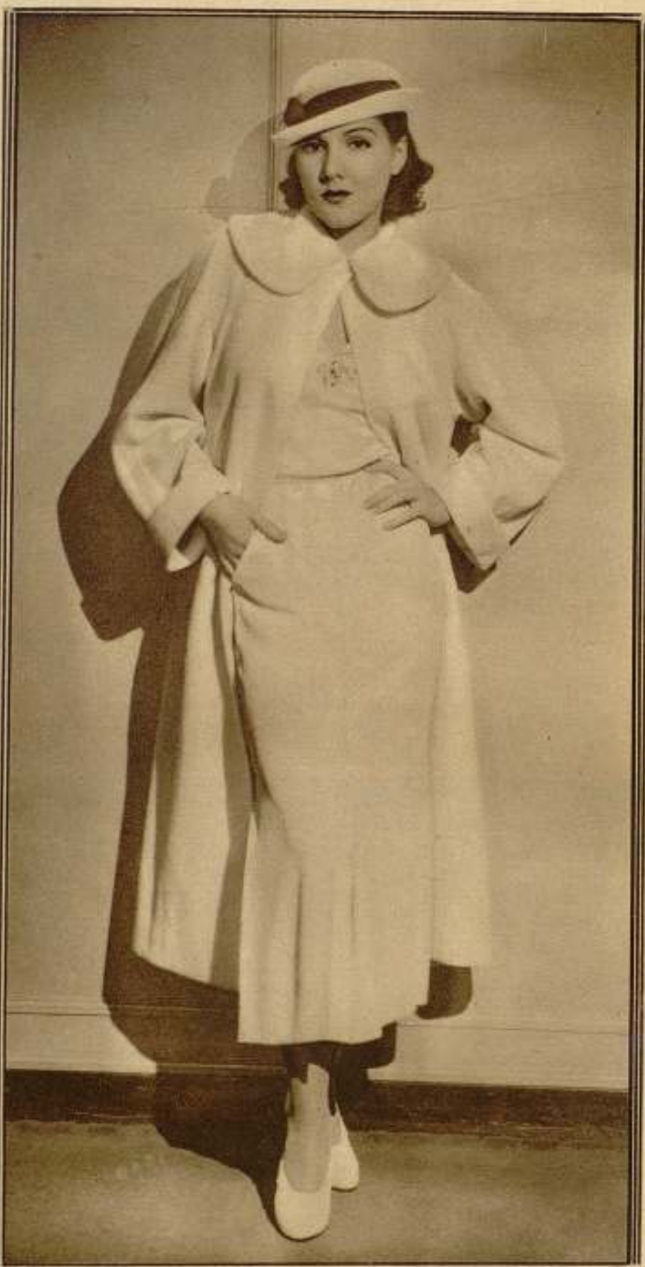
Jean Parker, de la M-G-M., con su nuevo y elegante vestido de verano, adornado con chinchilla blanca, que fué diseñado especialmente para esta gentil artista.

sentarse en la playa a contemplar las espumosas olas del Océano... Obtuvo su diploma en el instituto estudiando