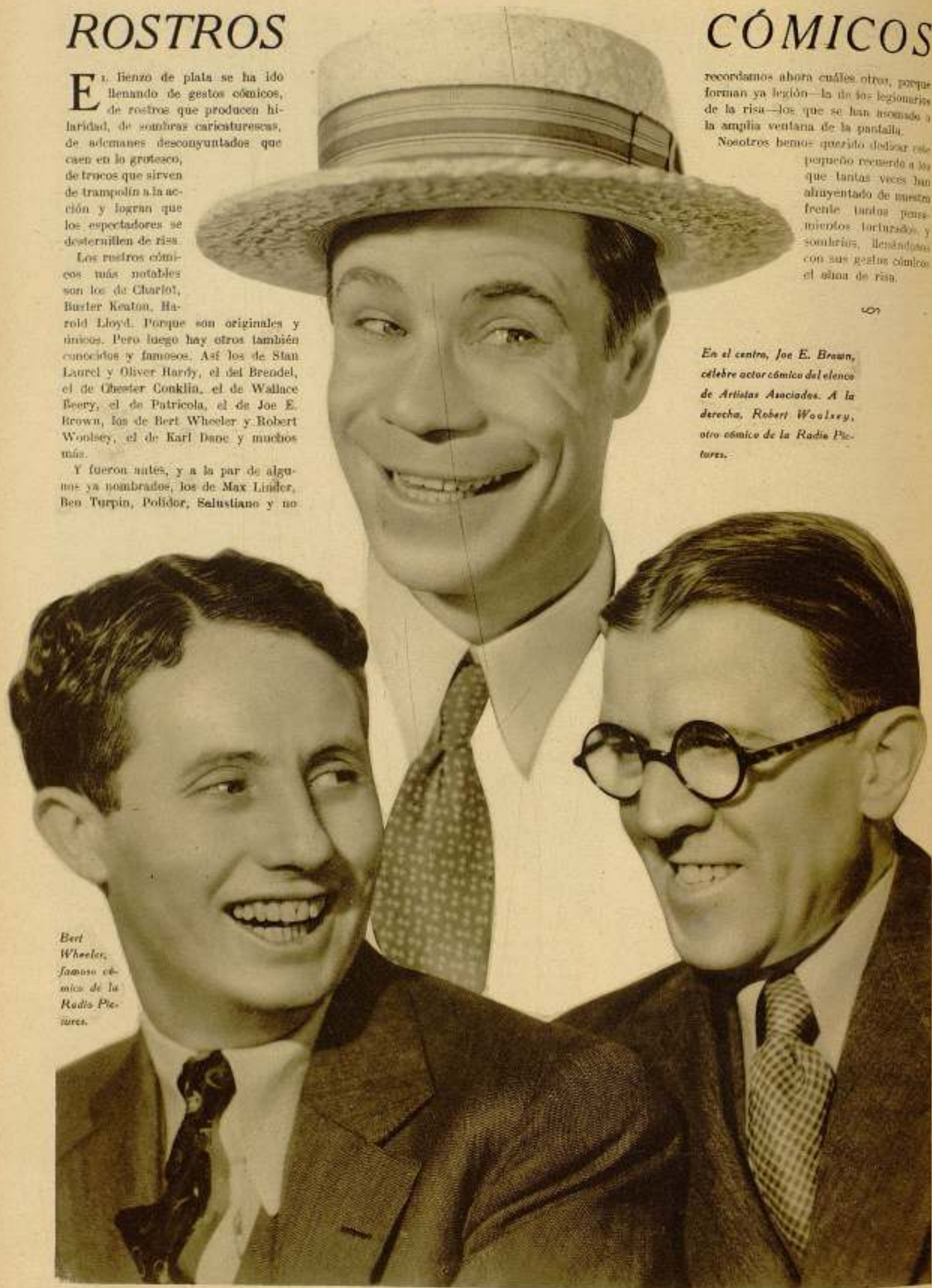
Bert Wheeler, famoso cómico de la Radio Pictures.

En el centro, Joe E. Brown, célebre actor cómico del elenco de Artistas Asociados. A la derecha, Robert Woolsey, otro cómico de la Radio Pictures.