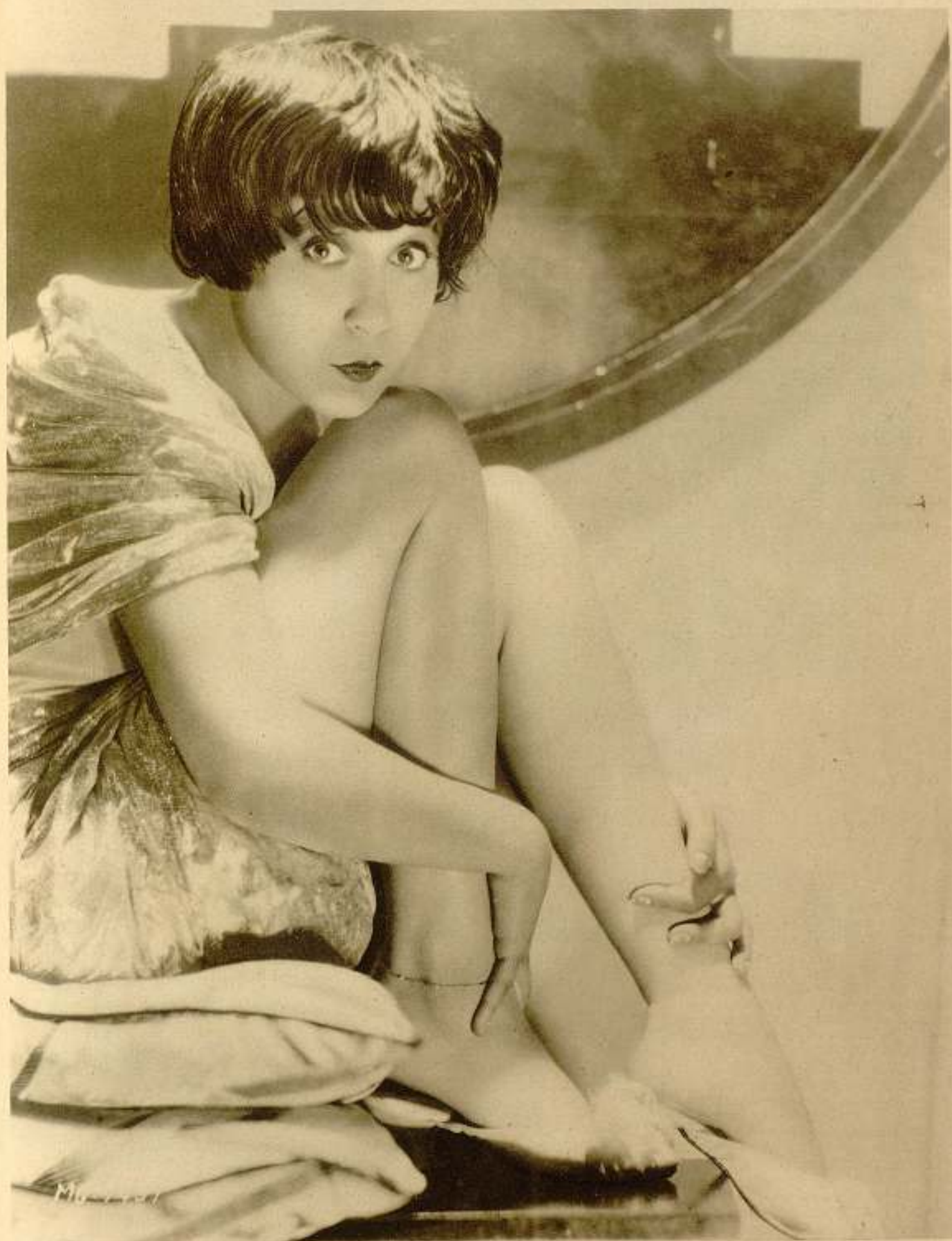
Fifi D'Orsay Actriz de la M.-G.-M.