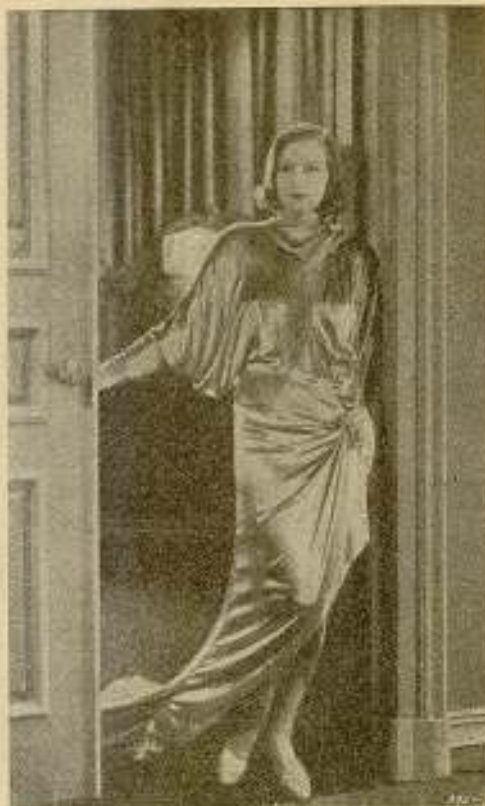
Greta Garbo en «La Mujer Ligera»