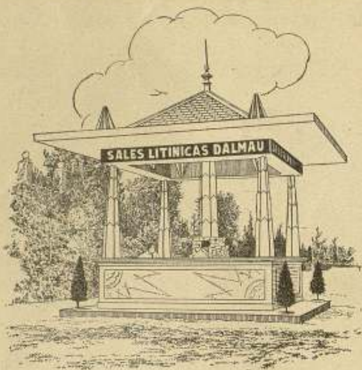
Pabellón de las Sales Litínicas Dalmau

NO DEJE de visitar el Pabellón instalado en el Mirador del Palacio Nacional, en donde podrá apreciar las excelentes cualidades de las