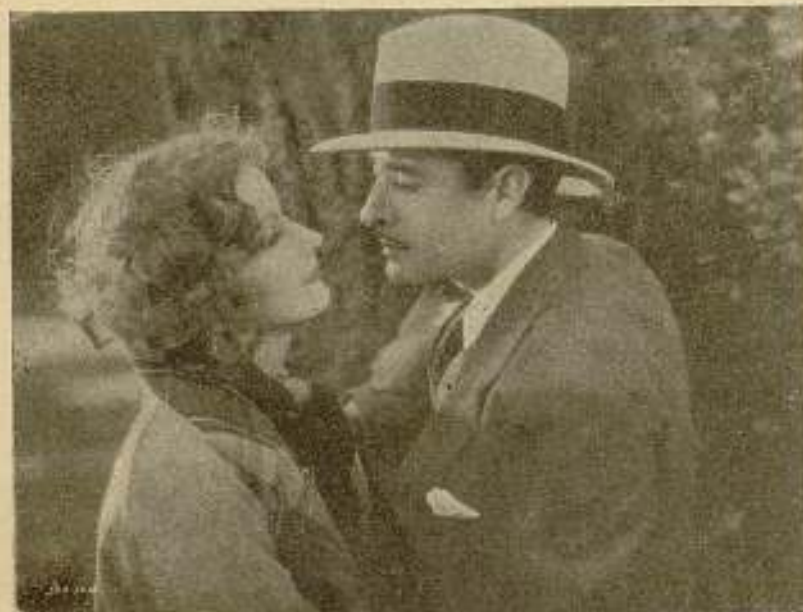
John Gilbert y Greta Garbo en una escena de «La Mujer Ligera», último film en que aparecen juntas esta célebre pareja de amantes de la pantalla.

Caja de 50 Comprimidos, Pastas P50 en Farmacias. Pida literatura gratis al Apartado 234-Barcelona