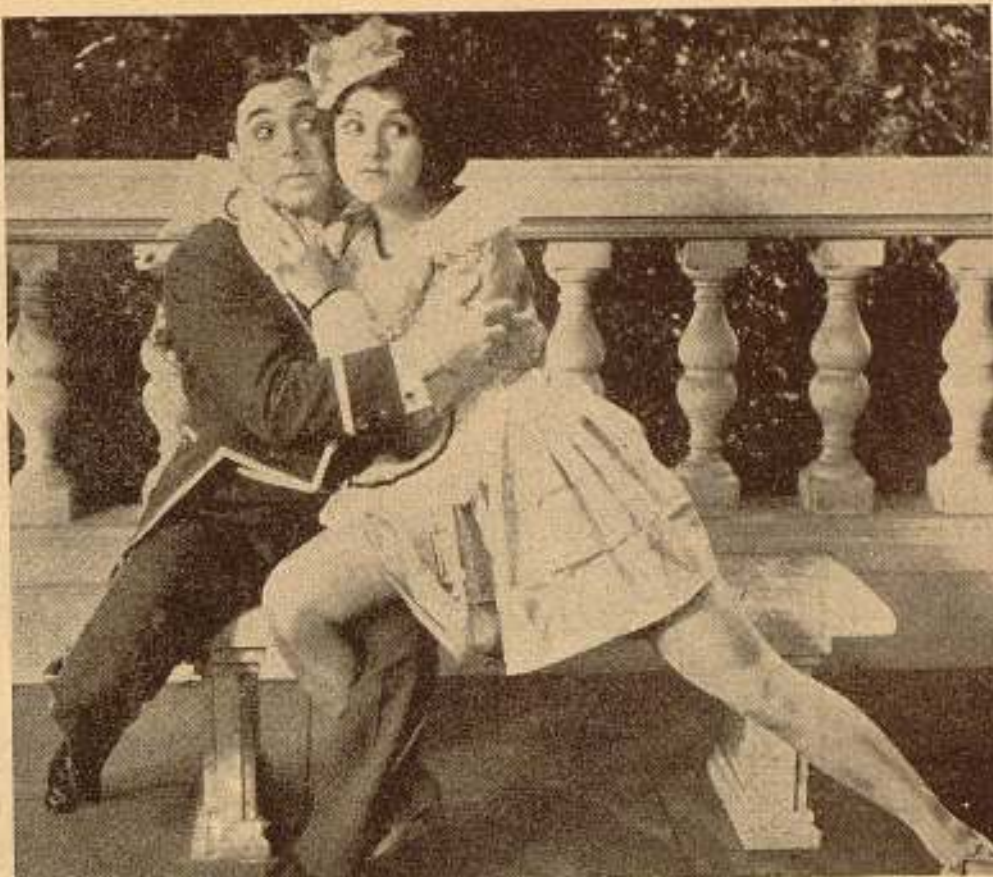
Estoy terriblemente impresionado por lo que veo

«Sucedió — dice este historiador — que la reina, cansada del desapoderado interés que tanto en consejo de ministros como su corte y la mayoría de sus leales súbditos mostraban por verla casada, y hallándose en la mañana en que concedió al conde Alfredo de Renard la sobredicha audiencia harto pensativa y afligida además, maguer indignada y colérica, por haberle manifestado el presidente y los otros miembros de su real consejo de ministros que desesperaban de encontrar aspirante a la regia mano, dado que el papel de príncipe