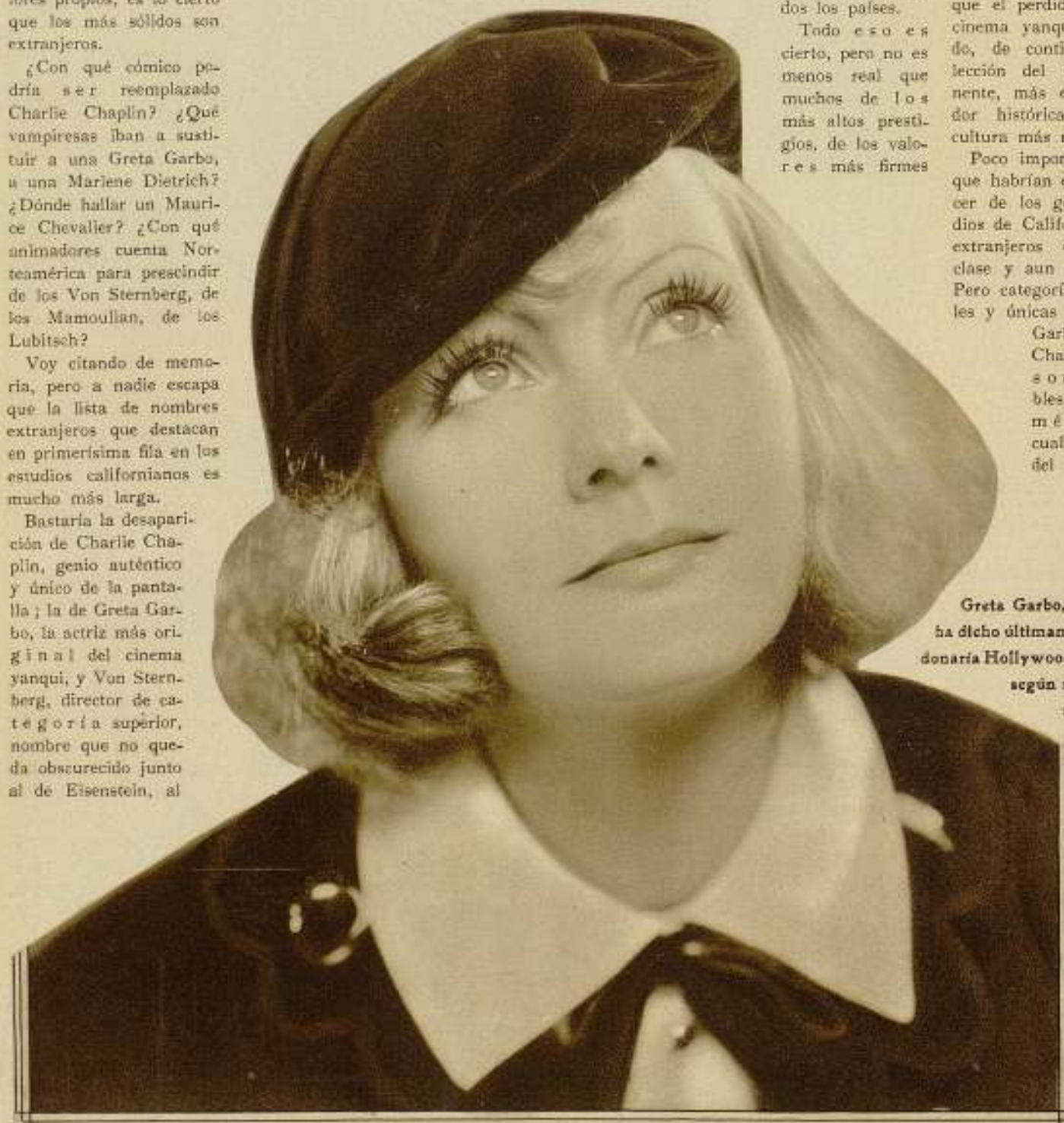
Greta Garbo, de la que se ha dicho últimamente si abandonaría Hollywood, pero la que, según nuestras referencias, continuará en la ciudad del celuloide, al servicio de la M-G-M.

Poco importaría si los que habrían de desaparecer de los grandes estudios de California fuesen extranjeros de segunda clase y aun de primera. Pero categorías universales y únicas como Greta Garbo y como Charlie Chaplin, son insustituibles en Norteamérica y en cualquier lugar del mundo.