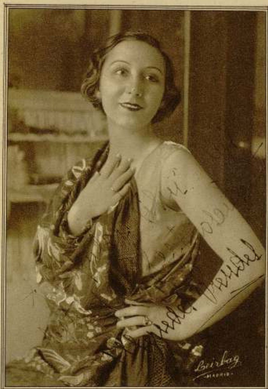
La bella actriz española, Mercedes Prendes, que ingresa decididamente en el cinema