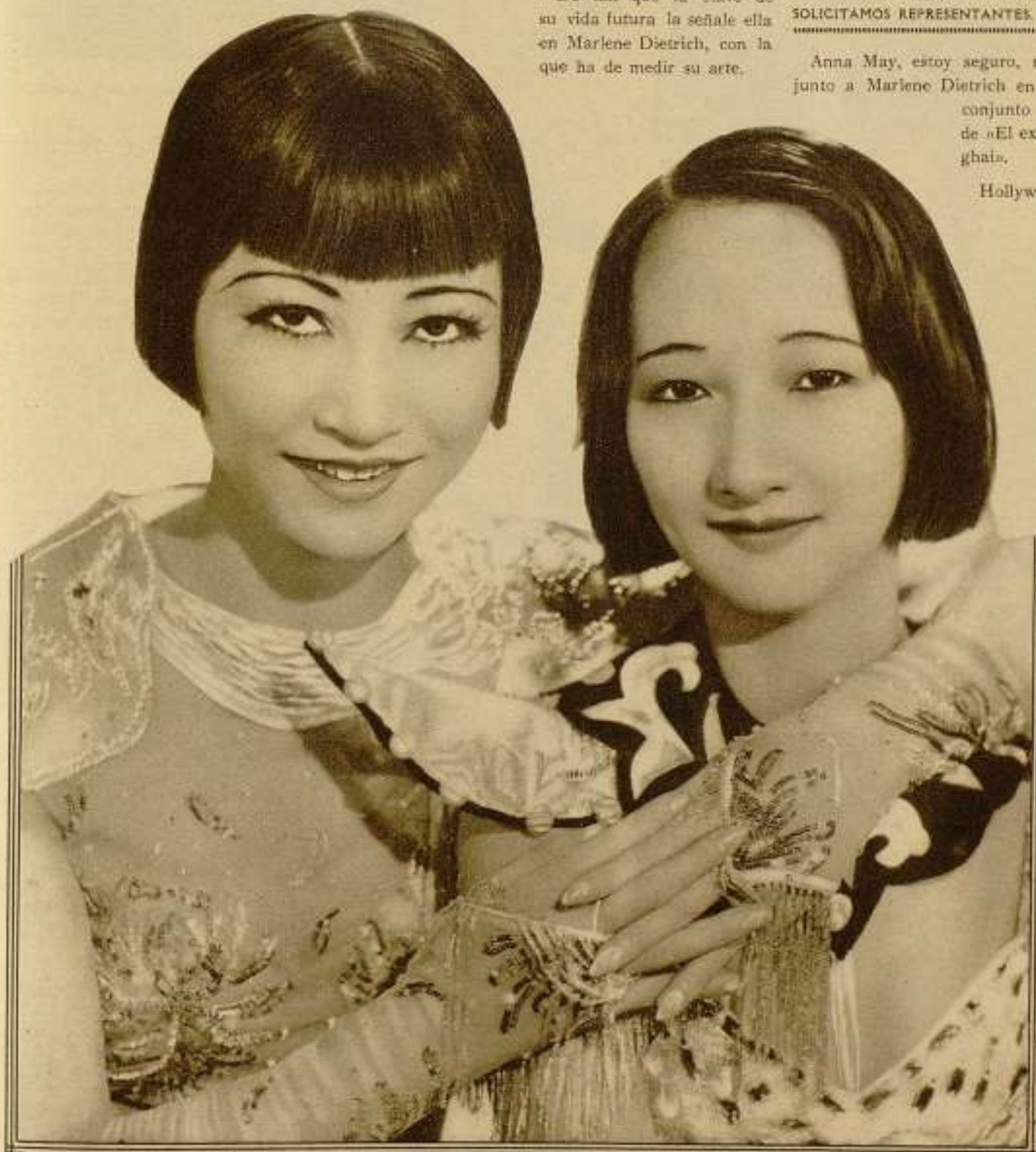
Anna May Wong, la actriz de la Paramount que aparece en «El expreso de Shanghai», con su hermana.