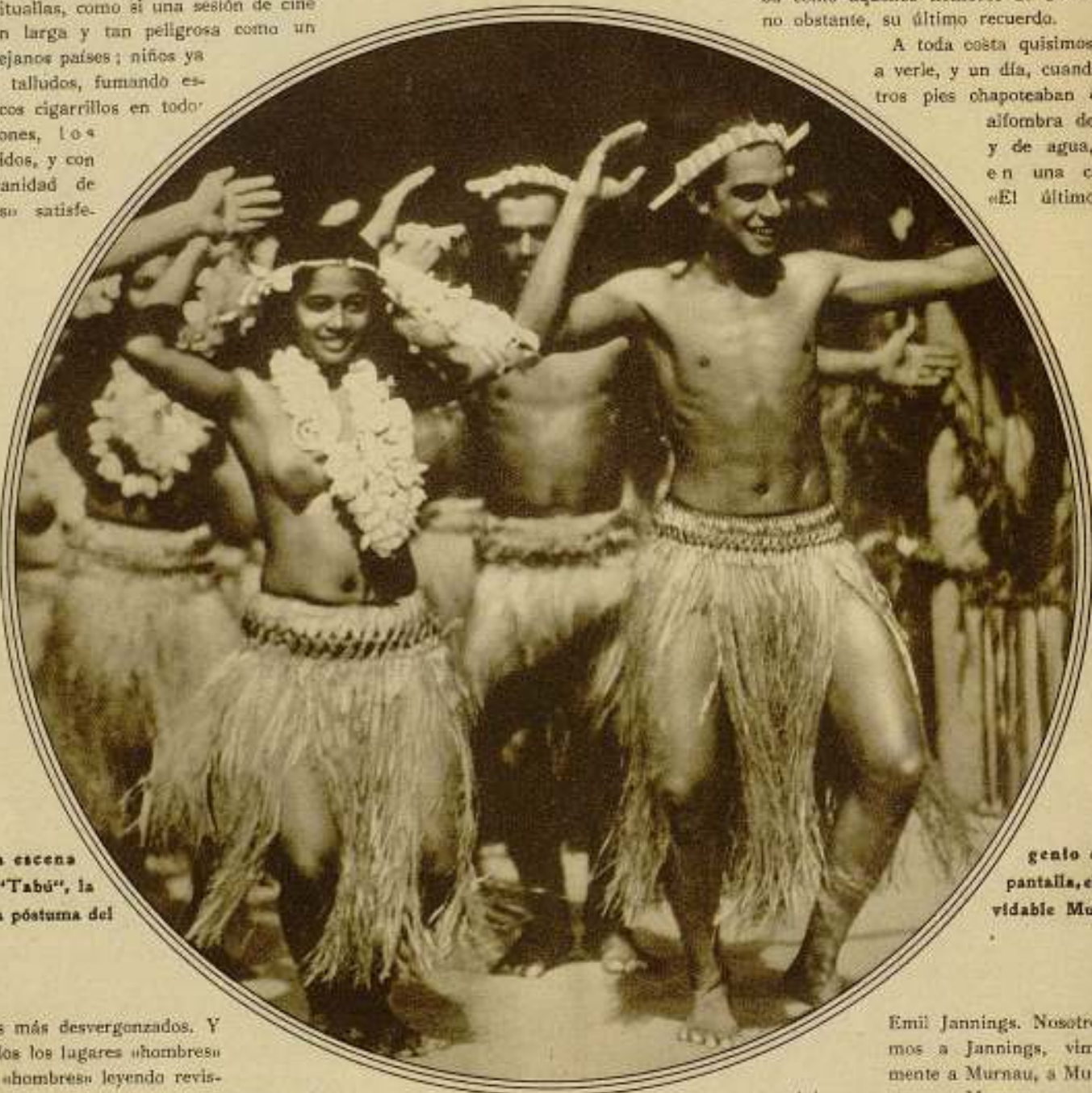
Una escena de «Tabú», la obra póstuma del

A toda costa quisimos volver a verle, y un día, cuando nuestros pies chapoteaban en una alfombra de barro y de agua, vimos en una cartelera «El último», de