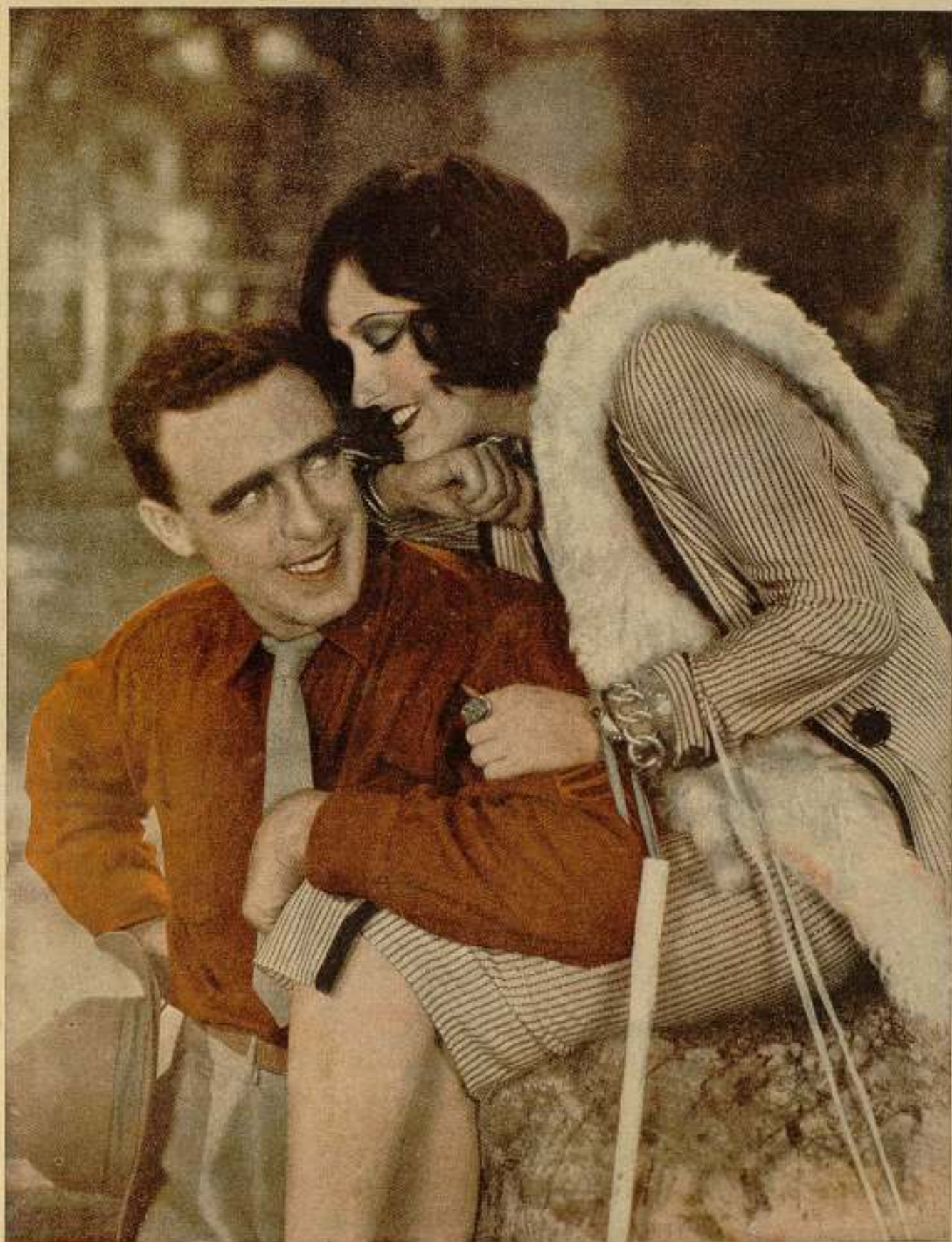
Gloria Swanson y Raul Walsh, en una escena de «Sadie Thompson», de los ARTISTAS ASOCIADOS