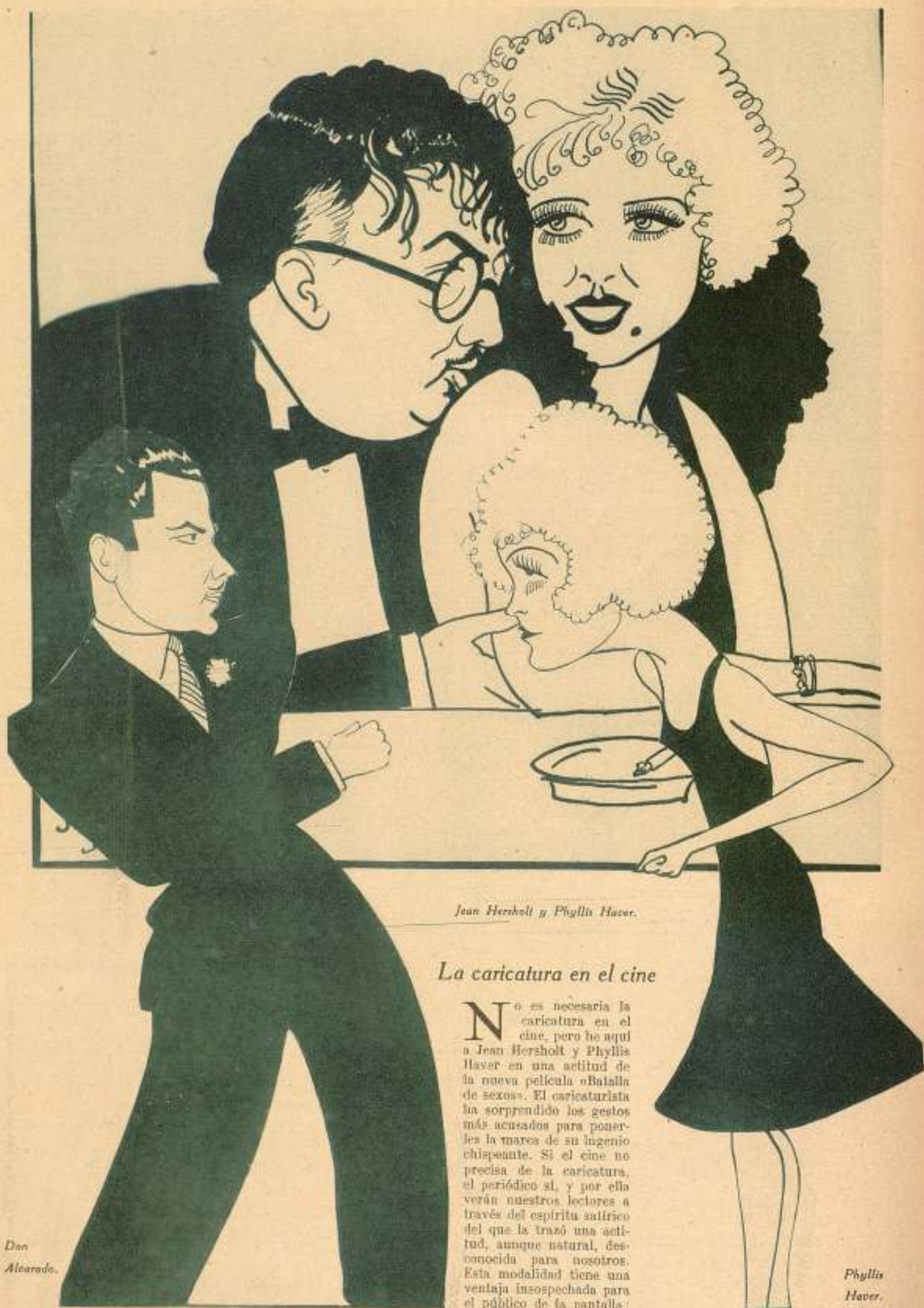
Jean Herzholt y Phyllis Haver.