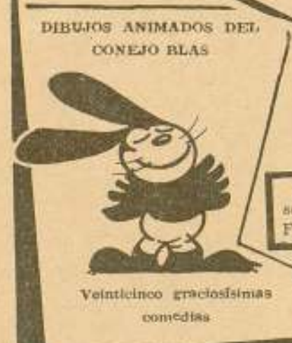
DIBUJOS ANIMADOS DEL CONEJO BLAS

PRODUCCIONES Glenn Tryon REPIQUE DE TACONES EN ALAS DEL AMOR LIOS REALES Estas tres películas harán famoso en España a su protagonista, Glenn Tryon, un gran actor cómico nuevo, desconocido para nosotros, pero popularísimo ya entre los públicos yanquis.