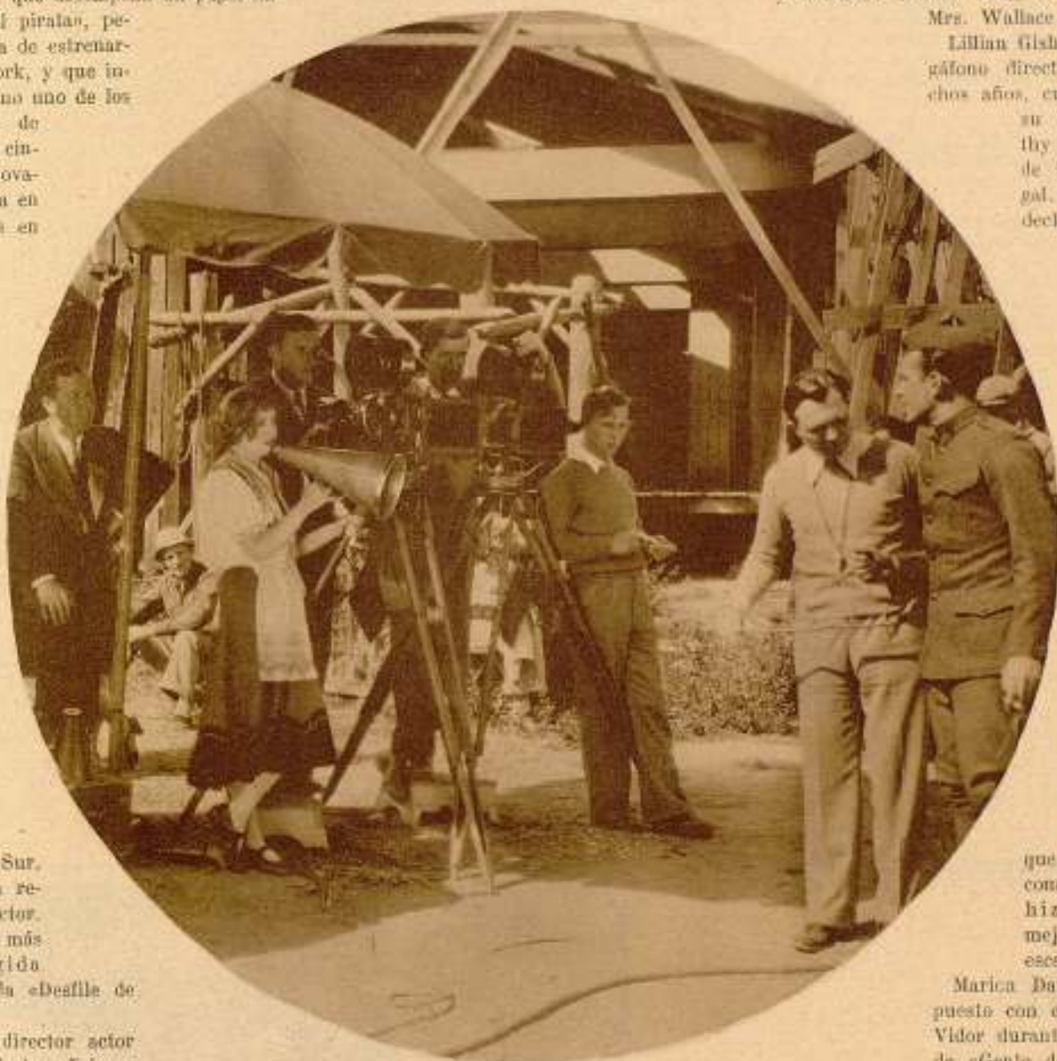
Marion Davies cambió de puesto con King Vidor durante la producción de "Gente de cine", en una de cuyas escenas interviene el

Lillian Gish ensayó el megáfono directoral hace muchos años, cuando dirigió a su hermana Dorothy en una comedia de la vida conyugal. Mrs. Gish ha declarado siempre