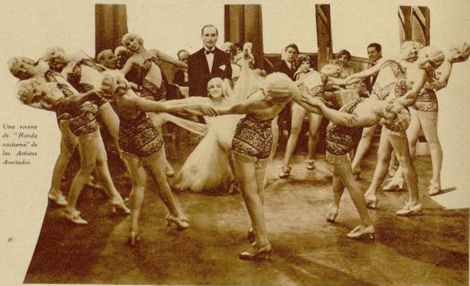
Una escena de "Ronda nocturna" de los Artistas Asociados.