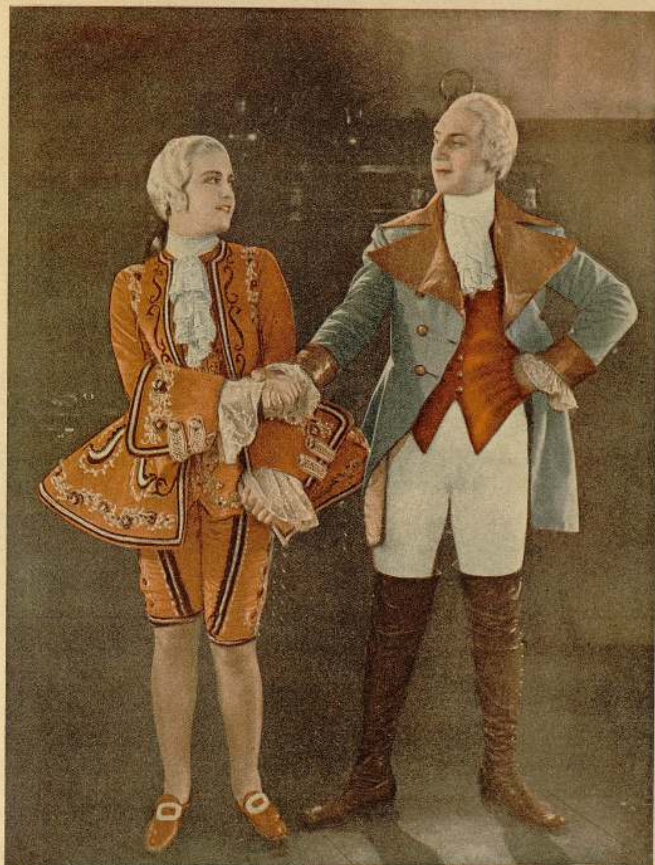
Ivan Mosjoukine y Jenny Jugo en una escena de «Casanova», de GAUMONT