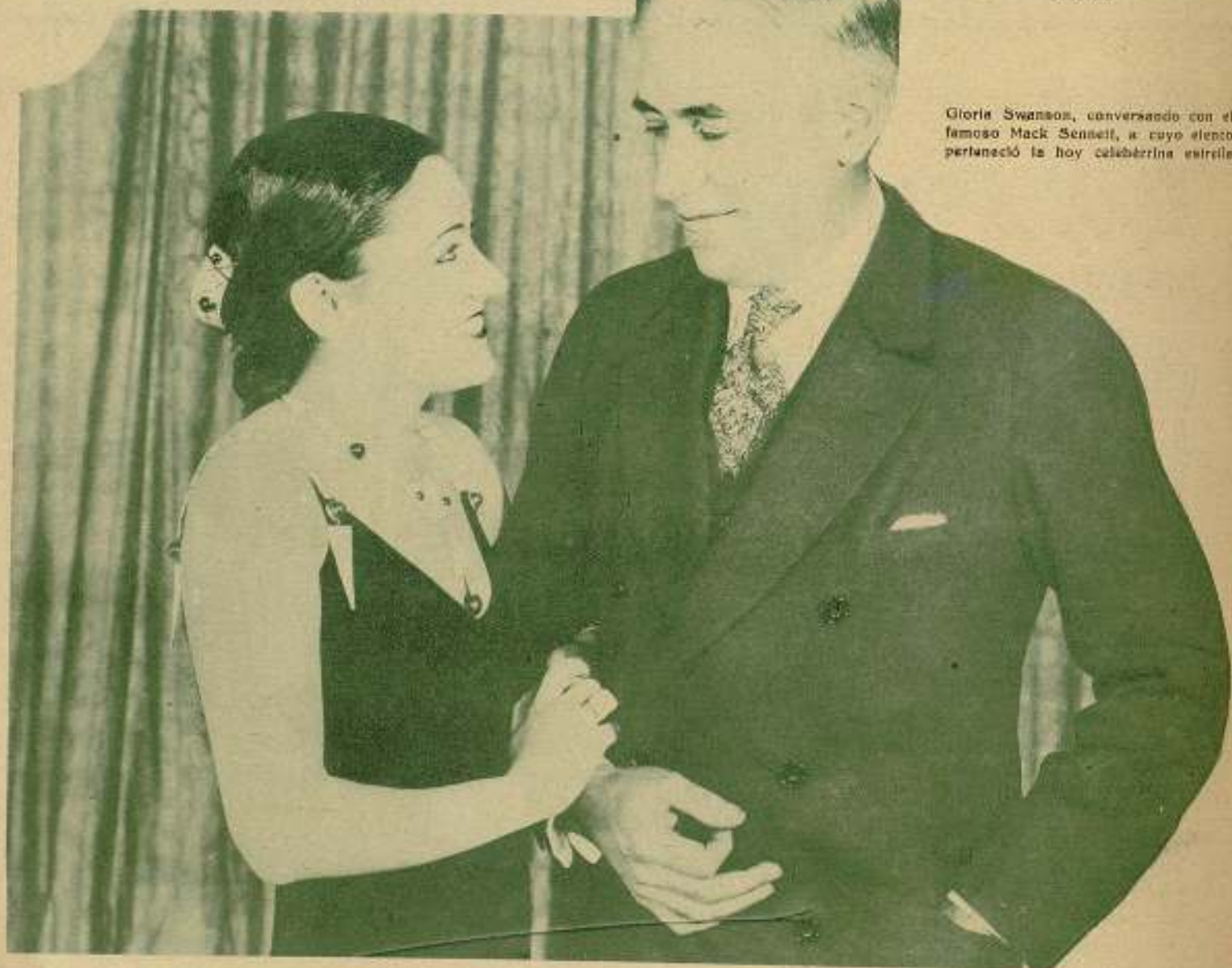
Gloria Swanson, conversando con el famoso Mack Sennett, a cuyo elenco perteneció la hoy calabrera estrella