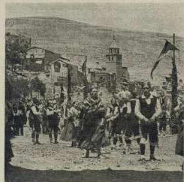
PILMANDO LA DOLOROSA

Este interés de la cinematografía extranjera por La Dolorosa prueba que, cuanto más típicamente racial es una cinta, mayor es su universalidad. Demuestra también que, cuando un film cuenta con valores tan destacados como la partitura del maestro Serrano, su éxito trasciende a todos los ámbitos.