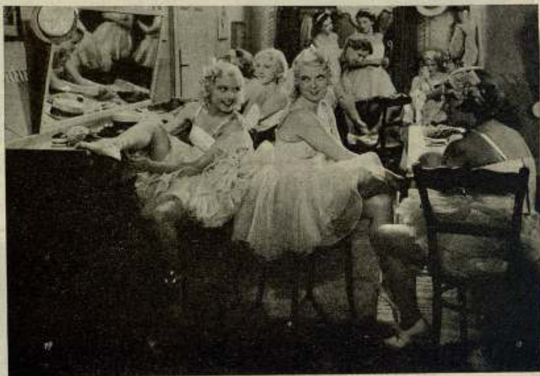
Uno de los bellísimos momentos de la producción alemana Rosas del Sur que Cifesa presentará todavía en la actual temporada

Toni cuenta a Mizzi la situación apuradísima en que se encuentra su padre ante el fracaso sufrido, y requiere la ayuda de Mizzi, quien no duda en prestarla, prometiéndole conseguir que el gran músico Strauss, que sólo dirige sus conciertos ante el emperador, acuda a dirigir el que con ocasión de celebrar la fiesta organizada por su padre ha de celebrarse. Así lo anuncian Toni y Poldi a los clientes del comerciante, quienes, por ver a Strauss dirigir un concierto, no vacilan en acudir a la espléndida mansión de Moedlinger, ante el asombro y estupor de éste y su esposa.