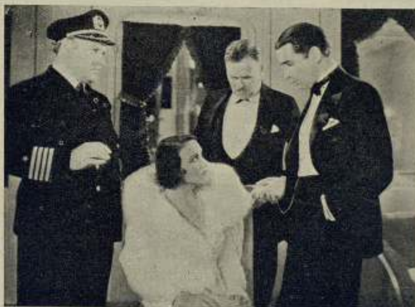
Una escena del interesante film Columbia Nebliua , que distribuye Cifesa

Descubierta su culpabilidad, Winstay acaba por suicidarse, mientras Brown y Mary, la bella pasajera, inician el camino para realizar sus ansias amorosas.