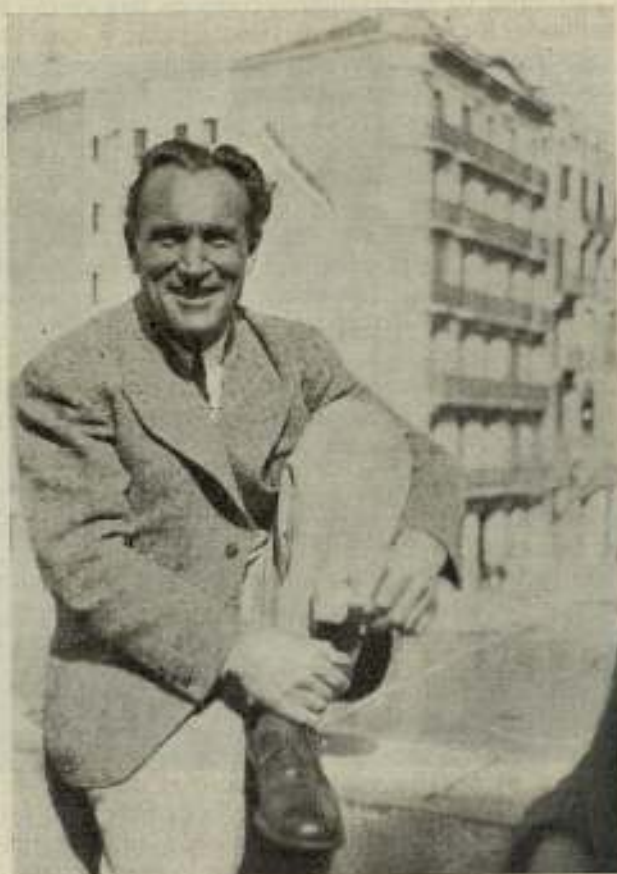
Luis Trenker, famoso actor europeo que últimamente estuvo en Barcelona para asistir al estreno de El hijo perdido , una de sus últimas producciones, editada por la Universal

Encantados de tener en el referido Consejo a un compañero de los méritos que adornan al elegido.