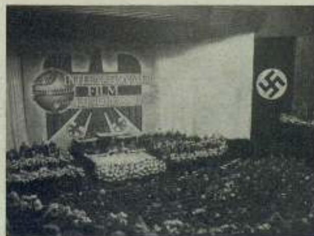
Solemne apertura del Congreso. El Dr. Scheuermann, presidente de la Cámara del Film Alemán, pronunciando su discurso de solución.

"Independientemente de los derechos patrimoniales de los autores e incluso después de la cesión de sus derechos el autor conserva el de reivindicar la paternidad de la obra, así como el derecho de