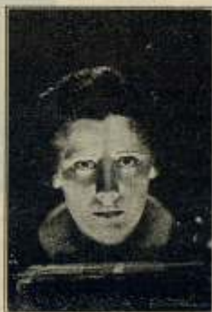
Podría decirse que la modesta de artista tan talentosa como Irene Dunne es proverbial en Hollywood. Su contrato con la RKO-RADIO ha sido renovado al terminar su actuación en la cinta Piel a una mujer (No Other Women)

En breve serán ofrecidas pruebas fehacientes a las casas productoras, a los técnicos y a la Prensa, pues se están acabando de montar las máquinas de revelaje del color, por un procedimiento que pondrá a España a la cabeza de las investigaciones cromocinematográficas.