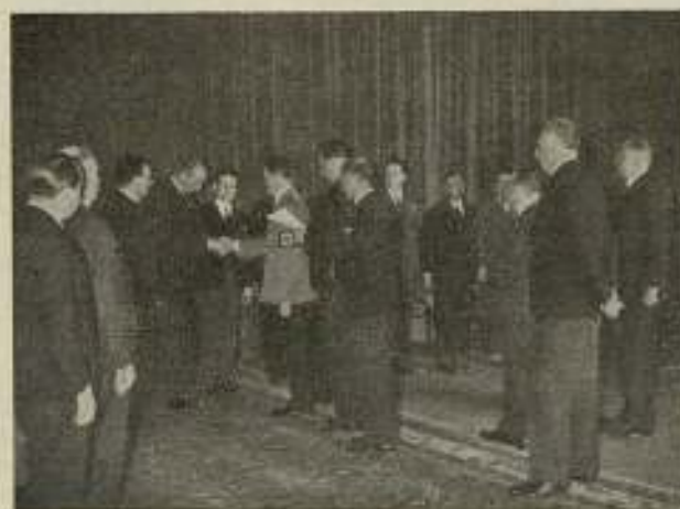
Nota final del Congreso. — El conde Adolfo Hiltner recibe a los delegados extranjeros en visita de despedida.

El Congreso recomienda que en todos los países sea creada una organización compuesta de todas las personas que hagan música cargada con derechos y que deben además asociarse dentro de una organización internacional.