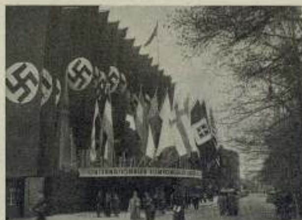
Entrada a la sala de sesiones del Reichstag (Kroll), en donde se celebraron las sesiones del Congreso Internacional del Film.

El Congreso celebrado del 25 al 30 de abril en Berlín se desenvolvió tal como se había proyectado, siendo la nota dominante del mismo su perfecta organización y la magnificencia de las fiestas celebradas en honor de los congresistas.