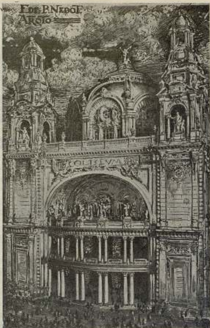
Monumental fachada del edificio