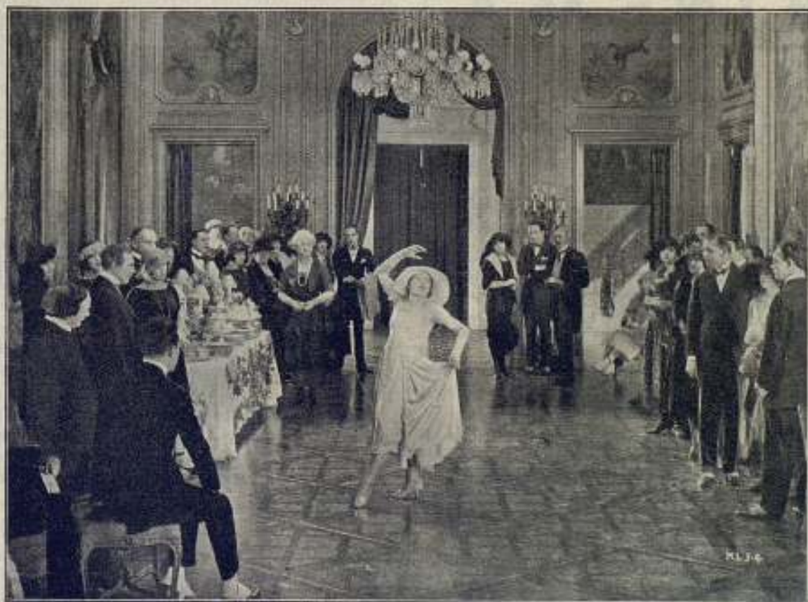
Una escena de la película La rosa de New York , interpretada por la célebre artista Mae Murray , que obtuvo un gran éxito en el Aristocrático Salón Kursaal, donde hace pocos días se ha proyectado.