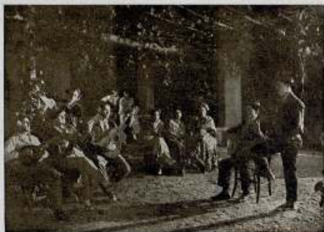
Una escena de la película