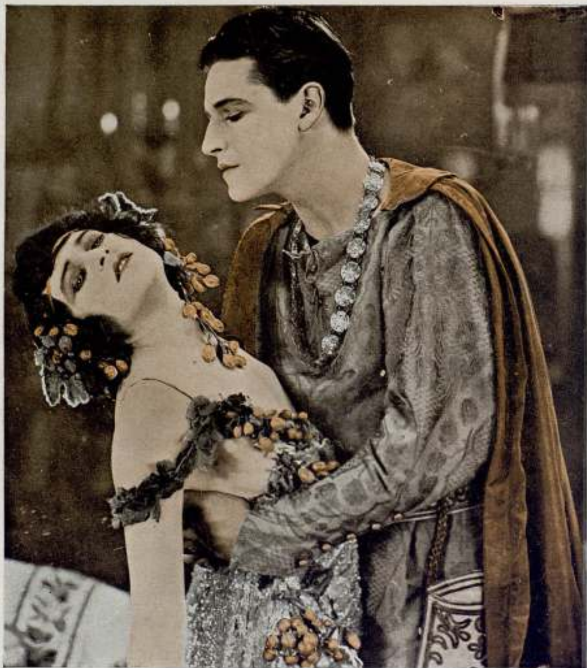
HILDA BAYLEY e IVOR NOVELLO

famosos artistas ingleses, en una escena de la obra Carnaval , del