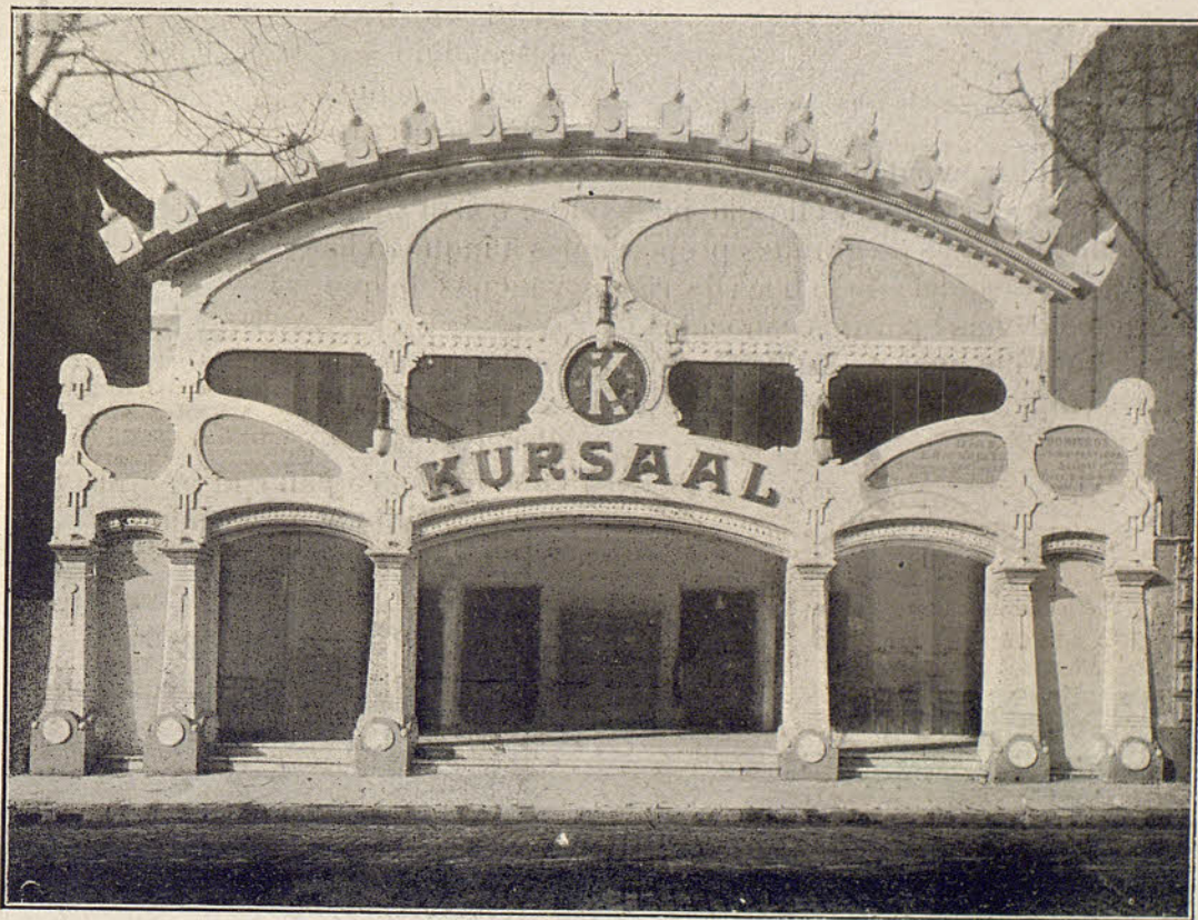
Rambla de Catalunya, 55. - BARCELONA