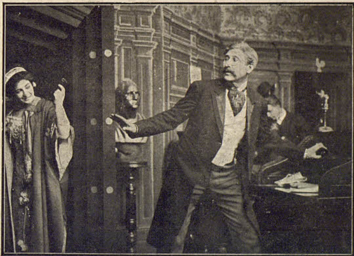
El secreto del coire