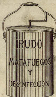
Depósito para soluciones antisépticas y extintoras