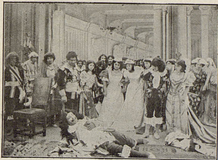
PATHE FRÈRES. - El baile de máscaras

La mujer no tiene en aquel momento la cantidad que se le pide, é inútil toda súplica, intenta apoderarse de las cartas que la comprometen; pero él se niega y ya va á asesinarla, cuando un ladrón que estaba escondido en la casa esperando la ocasión para desempeñar su oficio , al ver la escena de violencia corre en socorro de la joven y da muerte al infame, salvando así el honor de una señora.