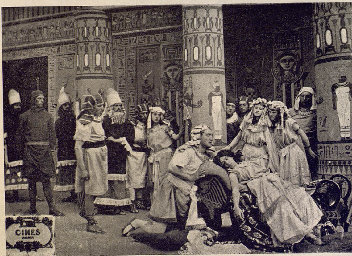
«CINES» SERIE DE GRANDE ARTE.-La esposa del Nilo

Apenas se separan, la gitana denuncia al Comisario de la policía que le ha sido robada la alhaja referida, acusando de autor del hecho al Vizconde, al cual, al ser detenido se le ocupa el collar que se supone robado, por cuyo motivo, ha sido detenido, y al enterarse y creyendo a su hijo culpable de un robo, se suicida, dándose la gitana por vengada.