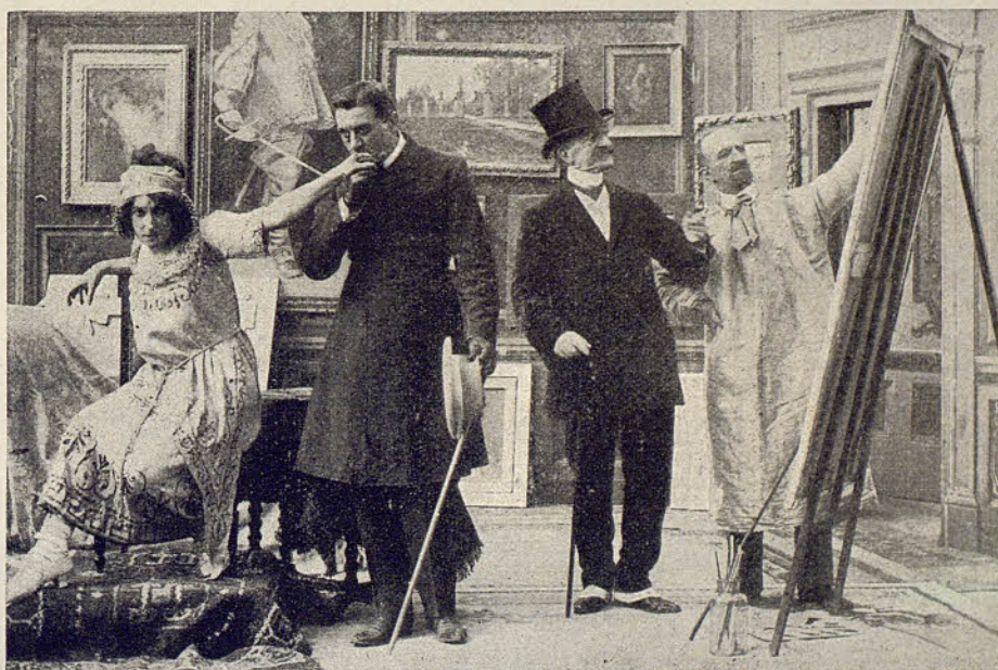
MILANO FILMS. - Odio de gitana

Por un periódico se entera de un oculista muy notable y decide verle por si puede curar á la ciega, aunque el tutor teme que si recupera la vista quizá pierda la joven su afecto hacia él debido á su fealdad.