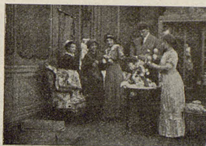
EDISON FILMS. - Campana de boda

Un día el hijito del director quiere entrar en la mina, escondido en el carro de Jaime.