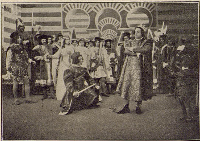
PATHE FRÈRES. - La Favorita

Un joven señor, Fernando, se enamora de la bella Eleonora de Guzmán, ignorando que es la favorita del rey; ésta corresponde á su amor, y él, para merecer su mano, va á batallar, haciendo singulares servicios al rey y á su patria.