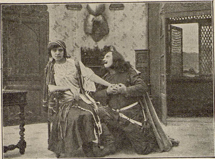
PATHE FRÈRES. - Jacinta la posadera

Landry, enamorado de Jacinta, para conquistar su