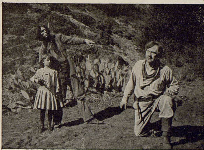
PATHE FRÈRES. - Salvado por un indio

Dos cow boys son expulsados del rancho y, enojados, se vengán raptando al hijo de su patrono. Un indio, testigo del profundo dolor de la familia,