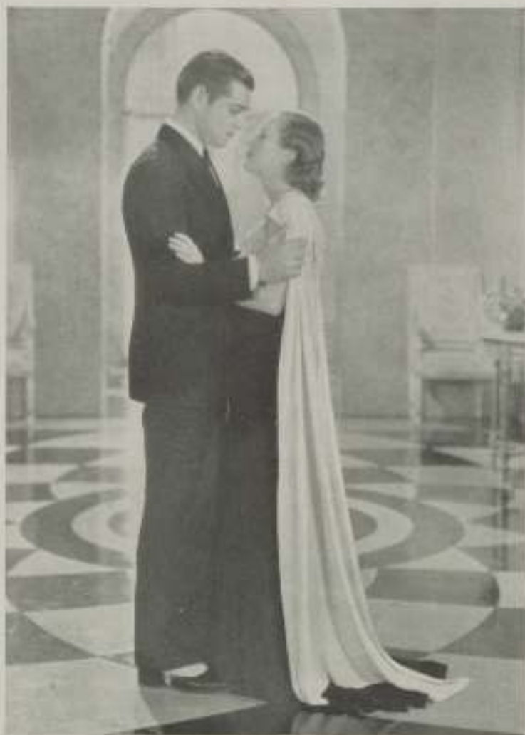
«Aah, Mark, jeg er bange! Sommetider hader jeg den Dag, paa hvilken jeg blev født.»