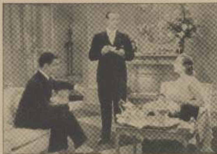
«Hun har alt undtagen en Mand,» sagde Al, «er det ikke rigtigt, Marion?»

«Jeg beder tusinde Gange om Forladelse,» sagde han, «tænk, at jeg kunde være saa klodset!»