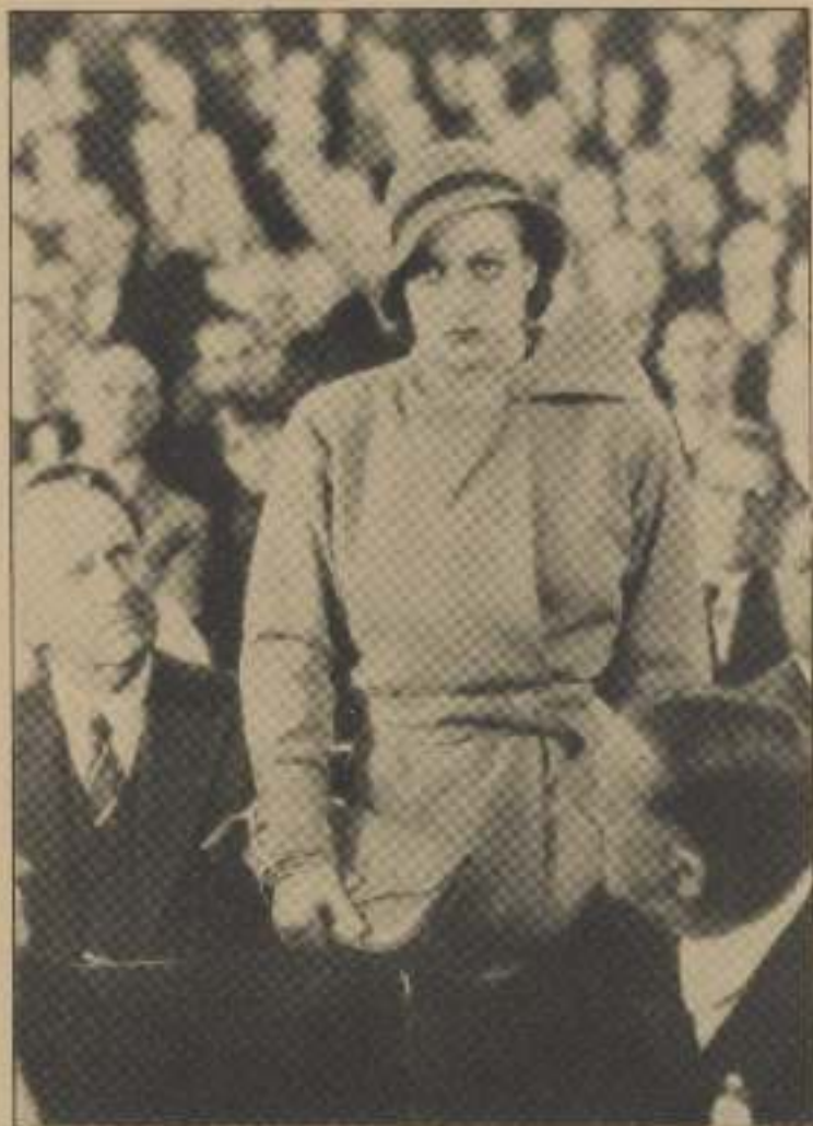
»Jeg er Mrs. Mottelund!» sagde hun og søn sig frit omkring som et Menneske, der intet har at skjule.