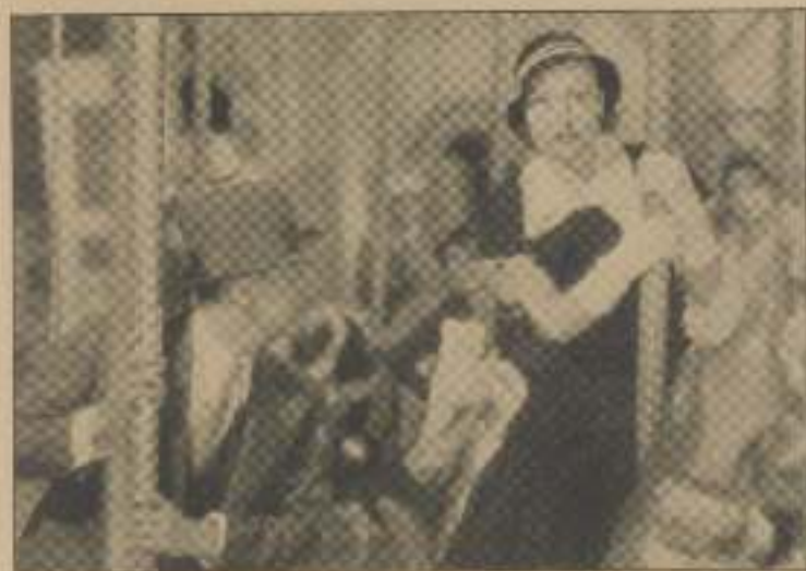
Han var ganske ør og forstumlet af at have prøvet en halv Søs Gynger, Rutschebaner og Karusseller, men han var strættelig.