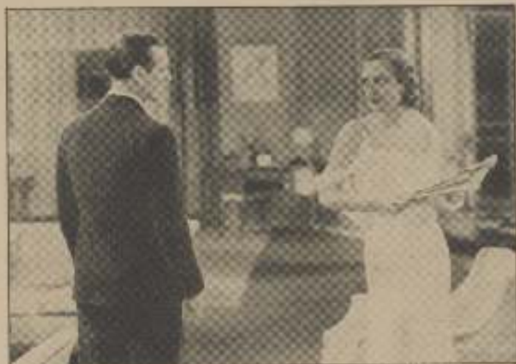
»Og jeg, som troede, at du var en respektabel Kvinde!«

»Nu maa du passe paa, hvad du siger!« sagde hun med isende Ro.