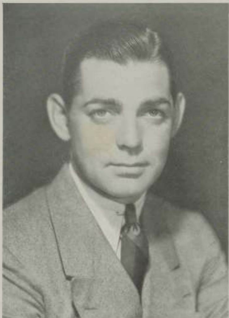
Clark Gable, Amerikas nye, forgydede Valentino, der spiller den mand- lige Hovedrolle, den unge New York-Millionær i »Uden Vielsesattest».