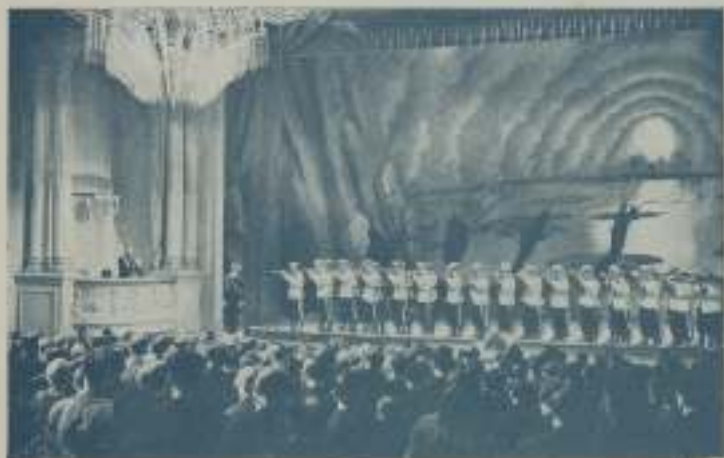
Un pelotón de cosacos, con el arma preparada, apuntaba a los espectadores...