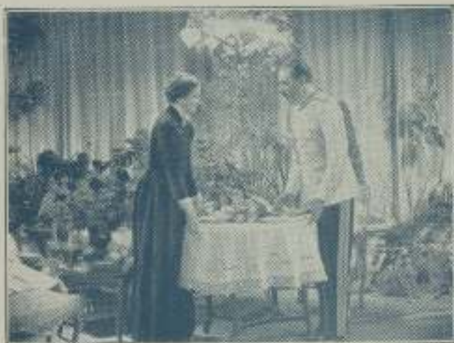
— ¡Su Excelencia desea ser recibido! — preguntó Antouska humildemente.