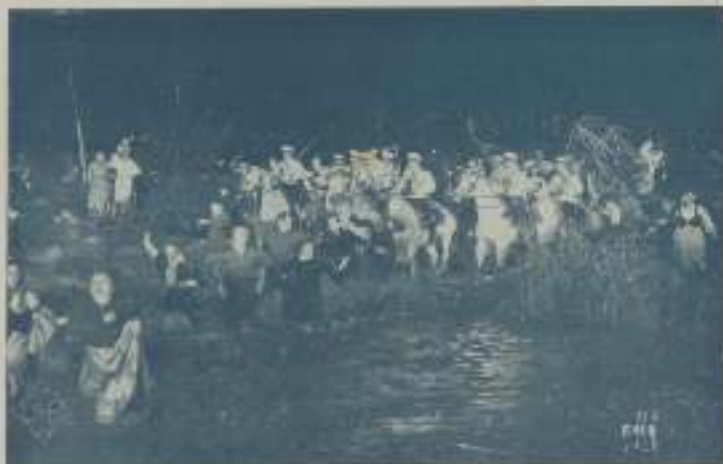
La gente corría enloquecida para salvarse de un latigazo de los cosacos...