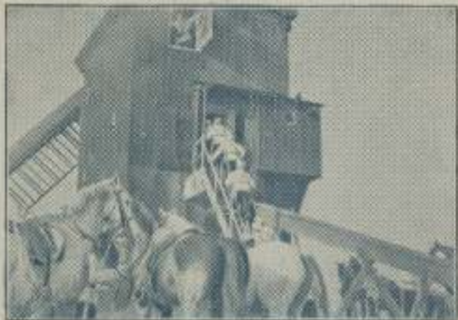
Como fieras hambrientas de carne humana, los cosacos treparon por la escalera...