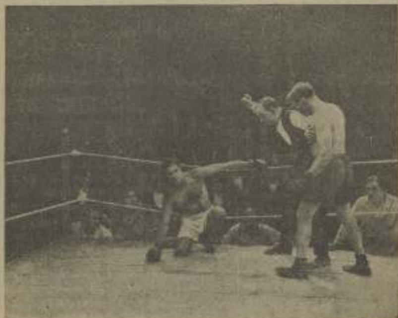
Los primeros «rounds» mantienen indecisa la lucha.,

—¡Ha querido usted perderme y perderá a mi protector! ¡Pues no será, no! — le responde José esgrimiendo amenazador, el aparato telefónico que aún tiene entre sus manos.