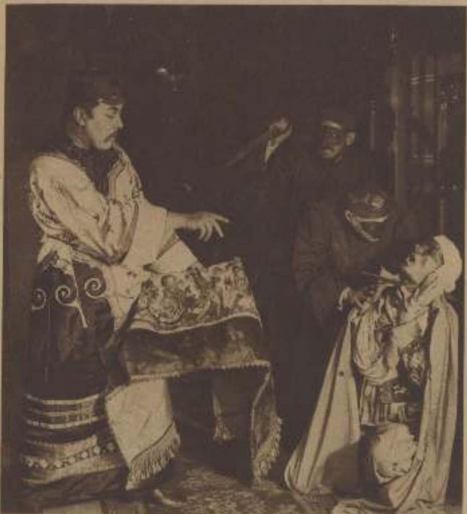
CARNAK AUX PRISES AVEC LES HINDOUS.

Mais non !... Non !... c'était là un chimérique espoir !... Il était impossible