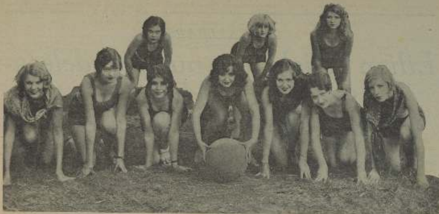
La bella ESTRELLA que tiene el balón entre las manos sólo espera una señal del Director para lanzar aquel a las locas de EL CINE, mientras las otras ESTRELLAS están, ojo avizor, dispuestas para correr a reconquistarlo del poder del afortunado a quien le tocará que caerá sobre él una lluvia de hermosas ESTRELLAS que le harán ver... la playa con muchas y nuevas bien ponderados detalles y menudencias.