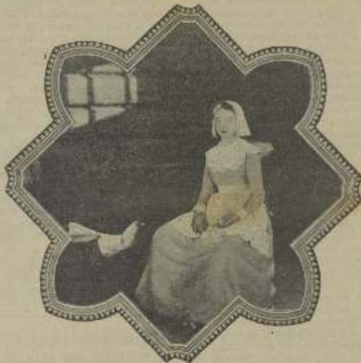
Lilian Gish, en "La mujer marcada" encosta con la naturalidad de su arte intimitivo.