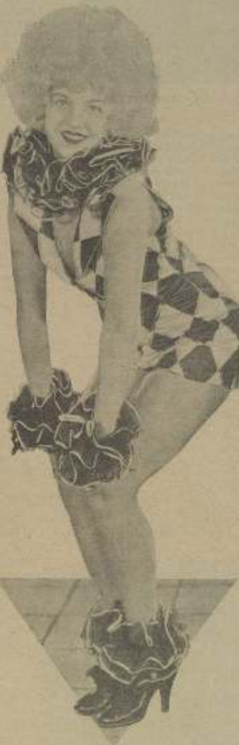
La hermosa Helen Fairweather es la protagonista de las películas demodulantes para las desvotas al sexo de este, despertándose el buen humor con sus poses, como esta, llenas de picoresa comicidad y dulce sátira. ¡Suicidas, no os unáis al otro mundo sin ver antes a Helen Fairweather!