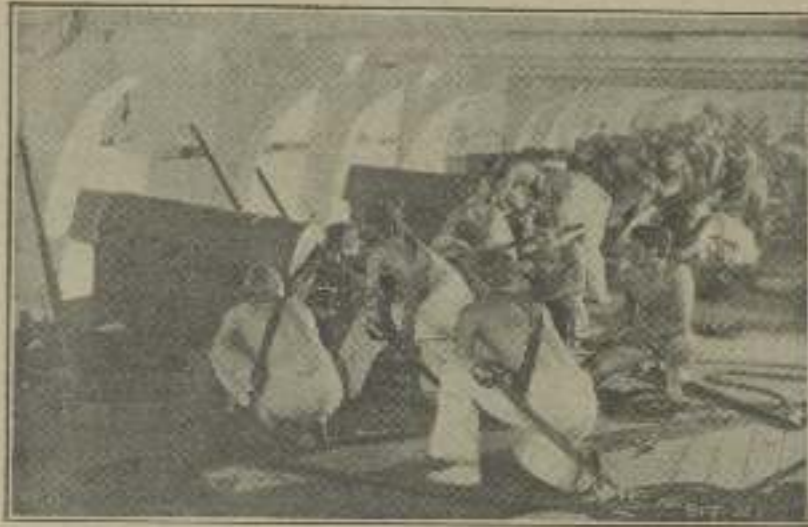
El arrebato de la lucha se ve bien reflejado en esta escena de "Tripoli".