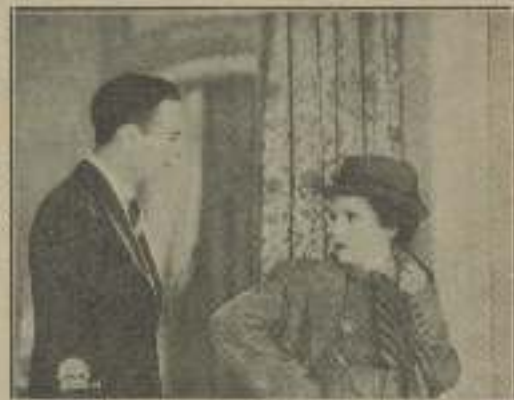
«Ni con queso...» parece que contesta ella para la detective», al protagonista.