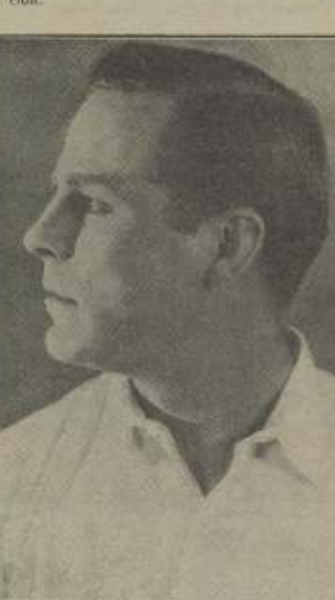
Antonio Moreno, el «caso» de la pantalla que pocos hoy por su arte, su talento y personalidad.

Cuando el espectáculo ha terminado, en un arranque de afectuosa camaradería, me propone en un español de más de cinco años: