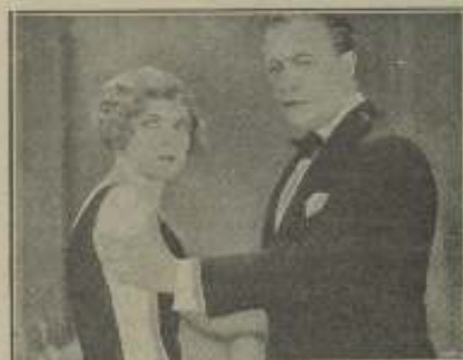
Una escena en «Trabajo de vidrio» que induce a creer en una situación vitriosa.