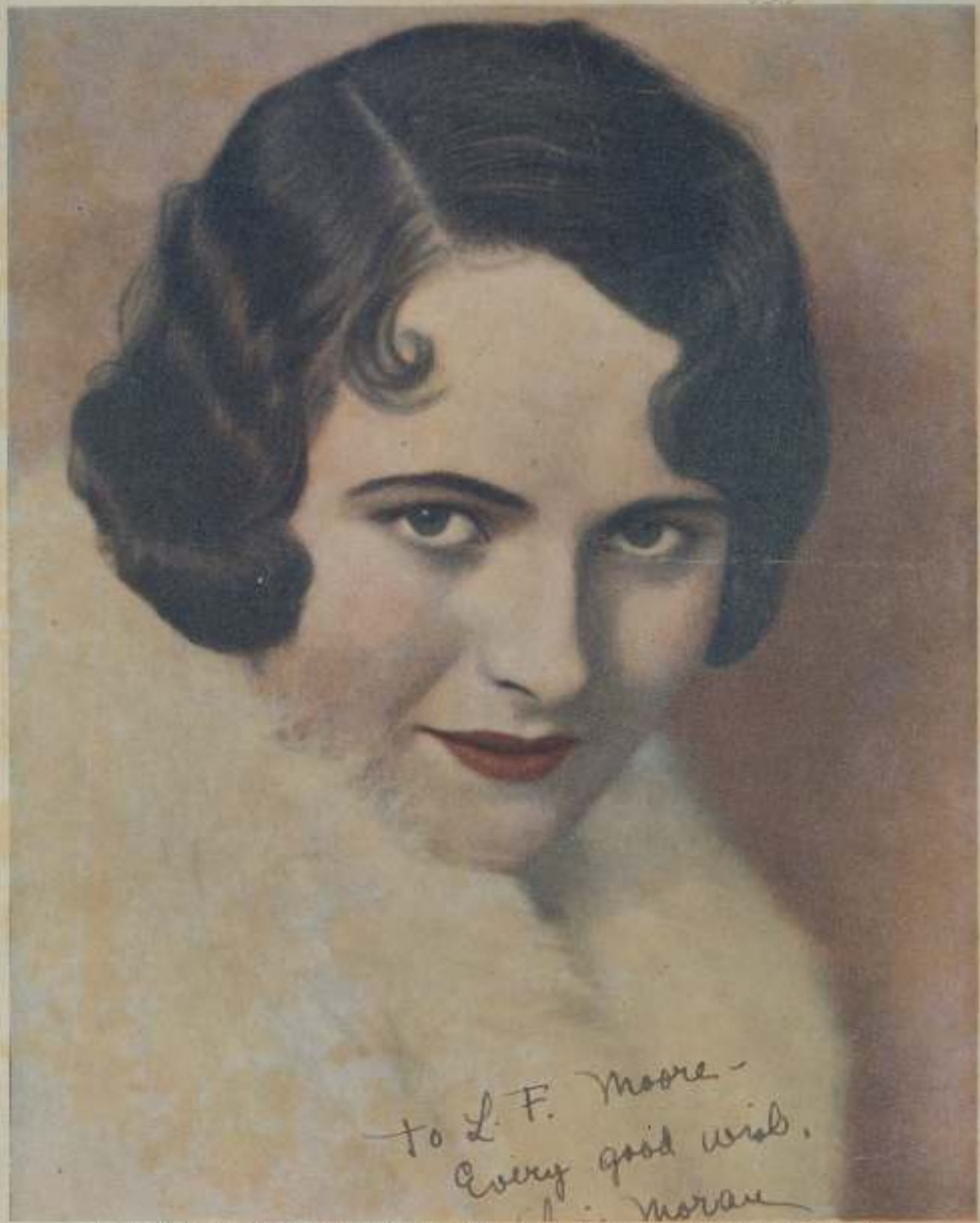
MORAN, bellísima estrella protagonista de las superproducciones Fox, «Genius del Mar» y «Pleasure de Rio»