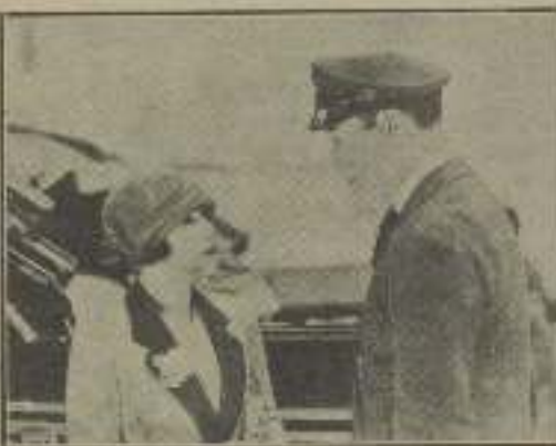
Una bonita escena de "Suzanne la detective"

P. S. — Tengo que explicarte lo que es un ayudante del director... no te vayas a imaginar que es alguien que sacude el polvo de las sillas o desempaña deberes tan poco interesantes como éstos. No, no, querida; es el acontecimiento de mayor importancia cultural que me haya sucedido en toda la vida.