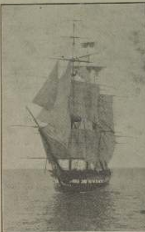
Bajel parado, en un momento, en "Teipoli", ¿dónde vas como el corazón, sin amor?

nett», en donde continúa obteniendo éxitos. Pero un año más tarde estaba de nuevo en la «Kalem» con cien pesos, lo que le permitía tener un pequeño automóvil en el