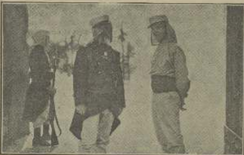
El col africano realiza el milagro de regenerar al hombre que en él no ha sido todo lo transparente que debía ser. Aquí una prueba en "Ben Hur".