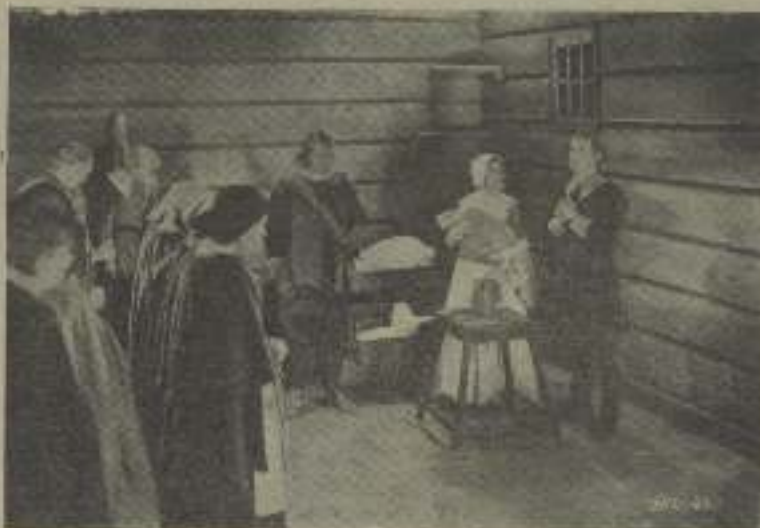
Lillian Gish en una emocionante escena de "La mujer marcada"

Tengo grandes deseos de conocer su patria. Me han hablado mucho de las exposiciones que se celebrarán en Sevilla y Barcelona. Si mis obligaciones me lo per-