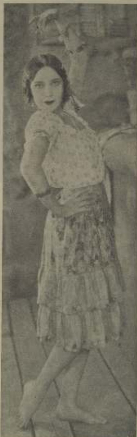
¡Ole la mare, chiquilla! De lo bueno que se nos ocurre al contemplar el cuerpo sendiguero de Dolores del Río en "Los amores de Carnetin".