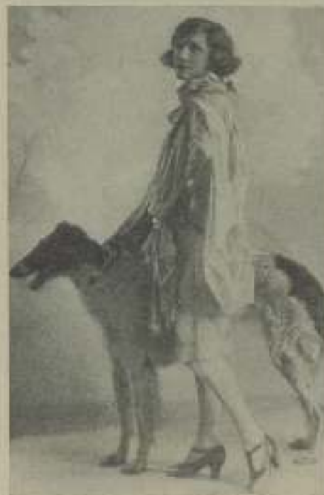
Melitta Baum, de la "EMELKA"

guión de su próximo film "La noche de Roma".