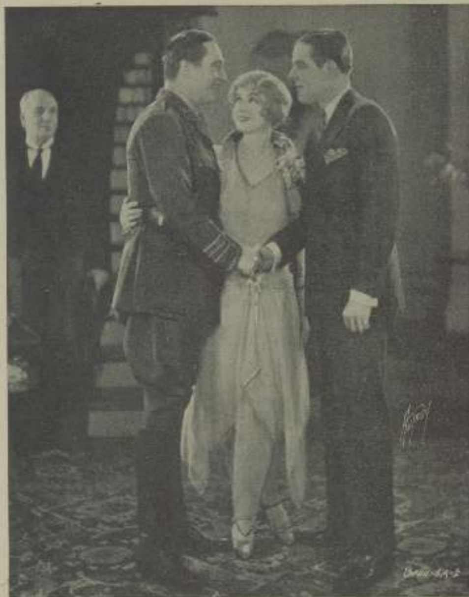
"La luz es la claridad" que levanta el "actor" Edmund Lowe, descubre el amable consorcio que forman la amistad y el amor

Las que lo hemos visto interpretar esa serie de películas tan magníficas que lo a