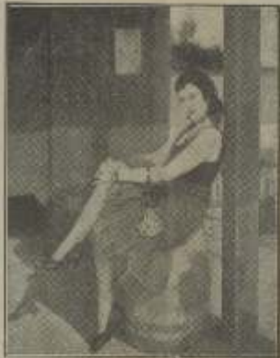
Das escenas de "El valle del Infierno" que nos dan una idea histonera del mismo