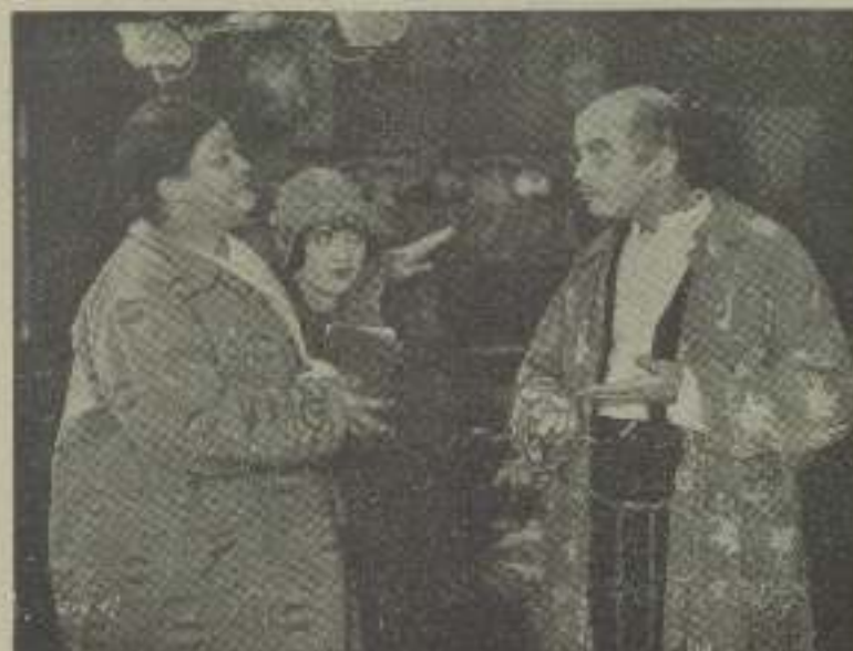
"Native Landlord" la vida es más real que a la escena, totalmente

Bos Kleio, acabo de ser escogido para filmar la parte masculina