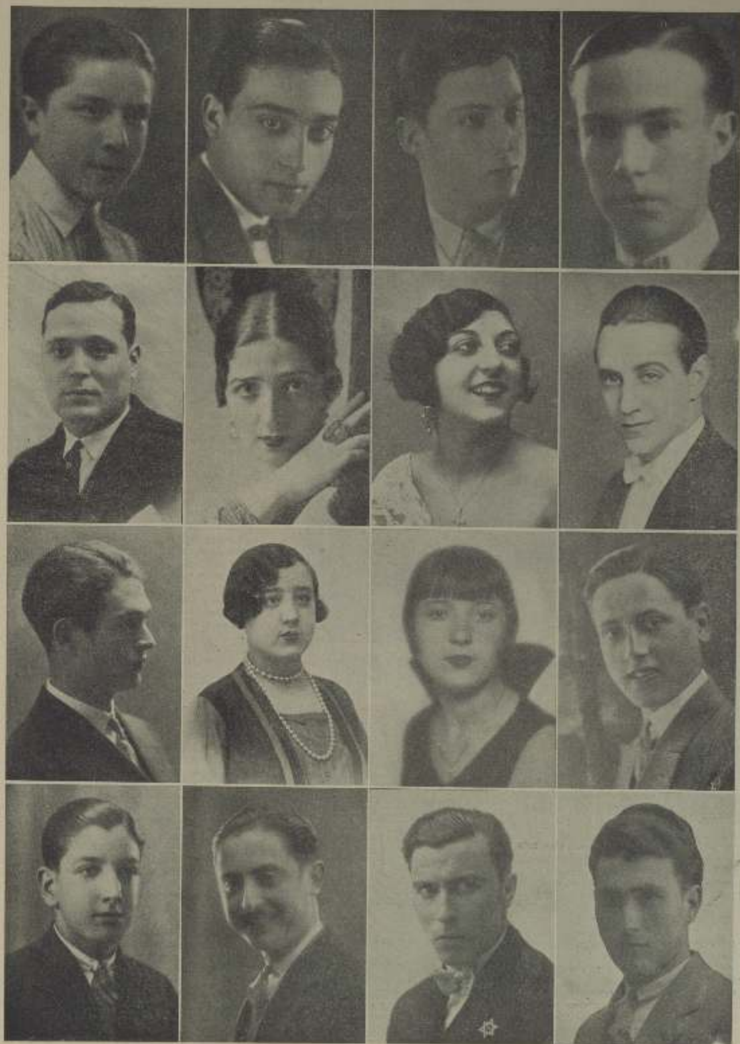
Concursantes de toda España