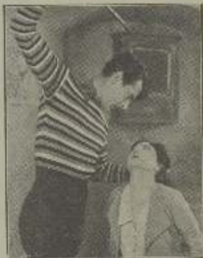
Una escena de El Palacio de Marvellous