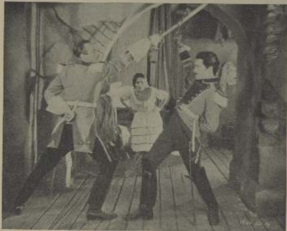
Dolores del Río en "Los amores de Carmen" contempla con ojos estupefactos el comienzo de la tragedia.

gida, inocente, salvaje. Ojos que despiertan las instintos, que entienden las hogueras de pasión; ojos de gitana, perfidia implacable del ciego e inseguro don José.