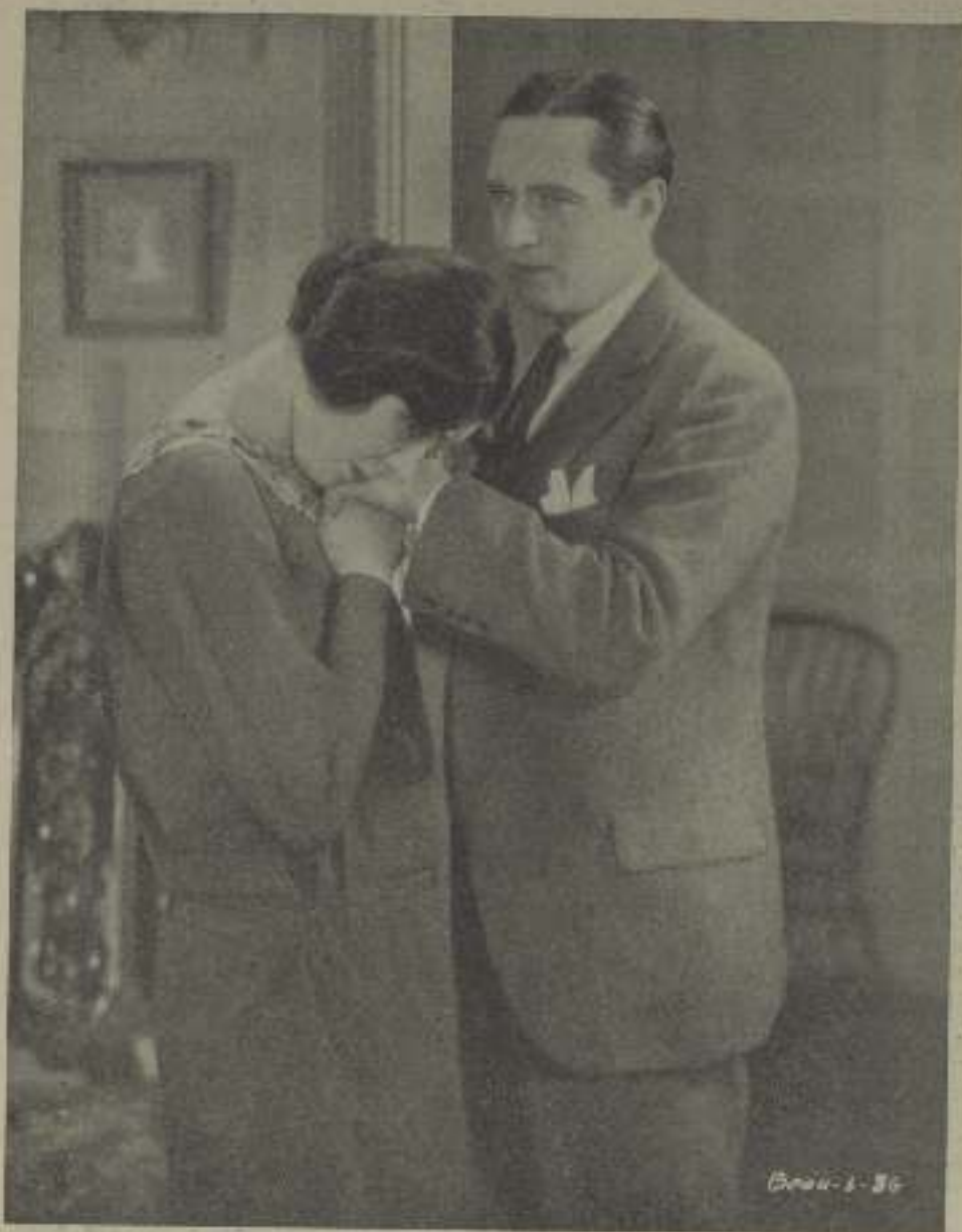
¿Qué bien se adecora en "La luz de la oscuridad" esta profunda es el amor, interpretada por Edmundo Lowe y su bella pareja!

—Se cierto. Bueno pues dígame si la mujer no es un ángel, pero un ángel bueno que cubriera nuestro problema en dulces alegrías. ¿Quiere usted cosa más hermosa?