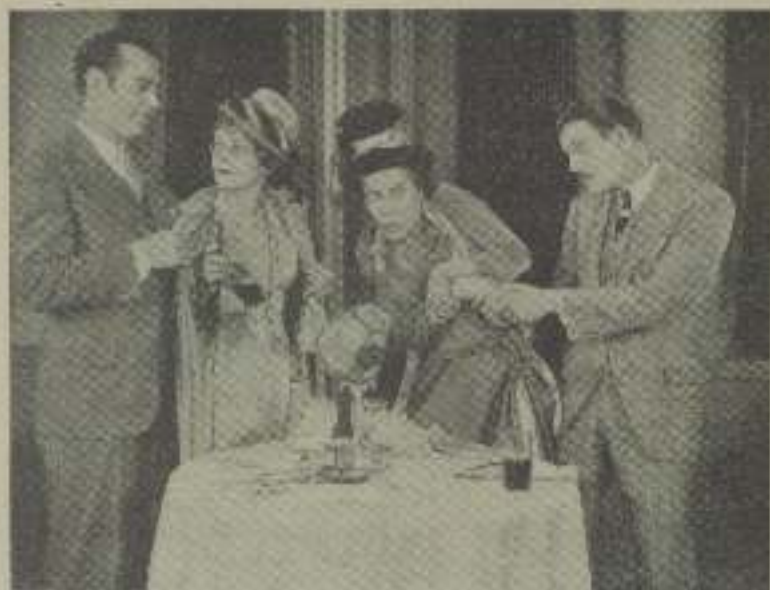
En "Juego de amor" mejor fortuna en juego de amor