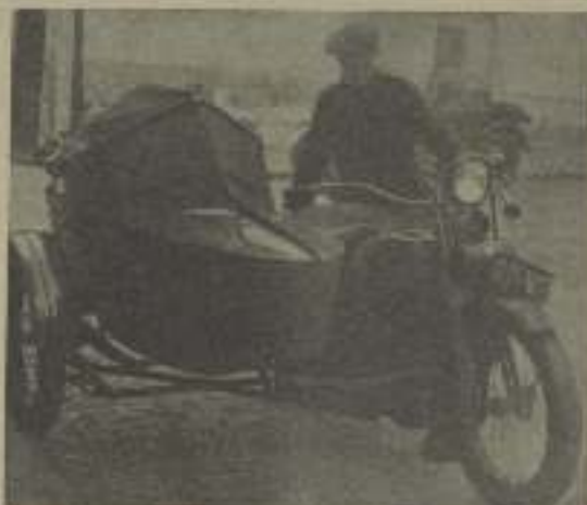
El vencedor en el recorrido de Notre Dame à la Place du Tertre, habiendo instalado en laboratorio en un side-car, recela una placa fotográfica bajo una lluvia persistente