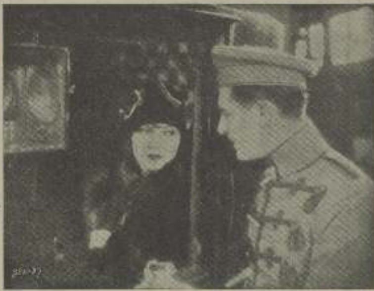
Greta Garbo y Tom Gilbert en una escena de "El demonio y la carne"