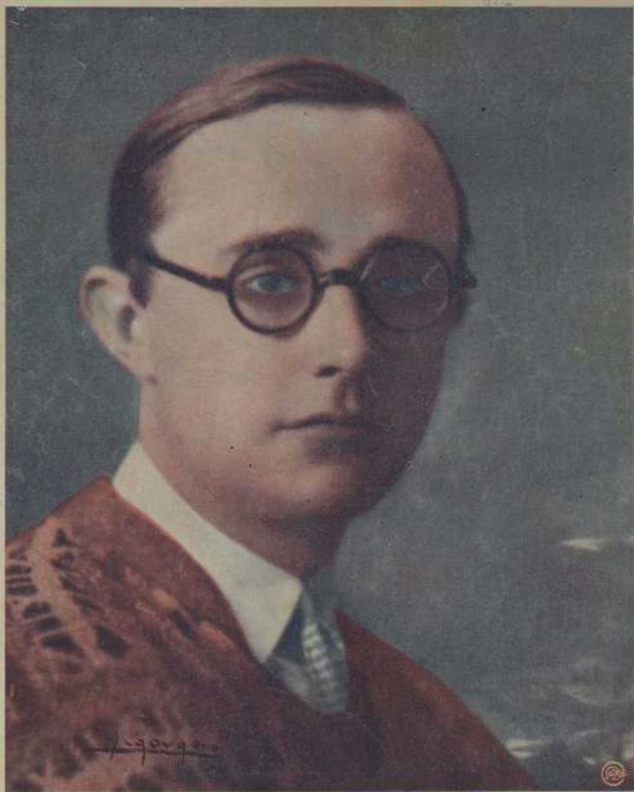
Beau Brummell, que dirigió «La gran dama» y que actualmente prepara «Cruzadas sin rumbo» ambas de Julio César, S. A.