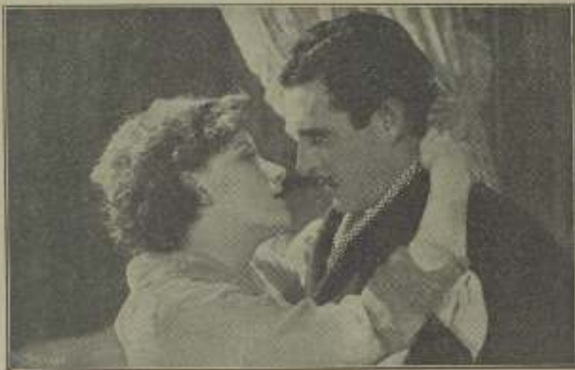
¡Qué breves momentos tan grande el de Greta Garbo y John Gilbert en El demonio y la carne

Las admiradoras de Valentino (yo no creo en los admiradores de Rudy) aprehendieron pronto de la presencia del nuevo actor. Y muchas de ellas ya multitud de os pegalosos ademanes —tan bonitos tan efectistas!— y de los besos sarcófagos del "shell" —que él se encargaba de aplicar con un cierto tinte humorístico poniendo los ojos en blanco, en un estribillo, mo chabacano de tope sensacional— fue-