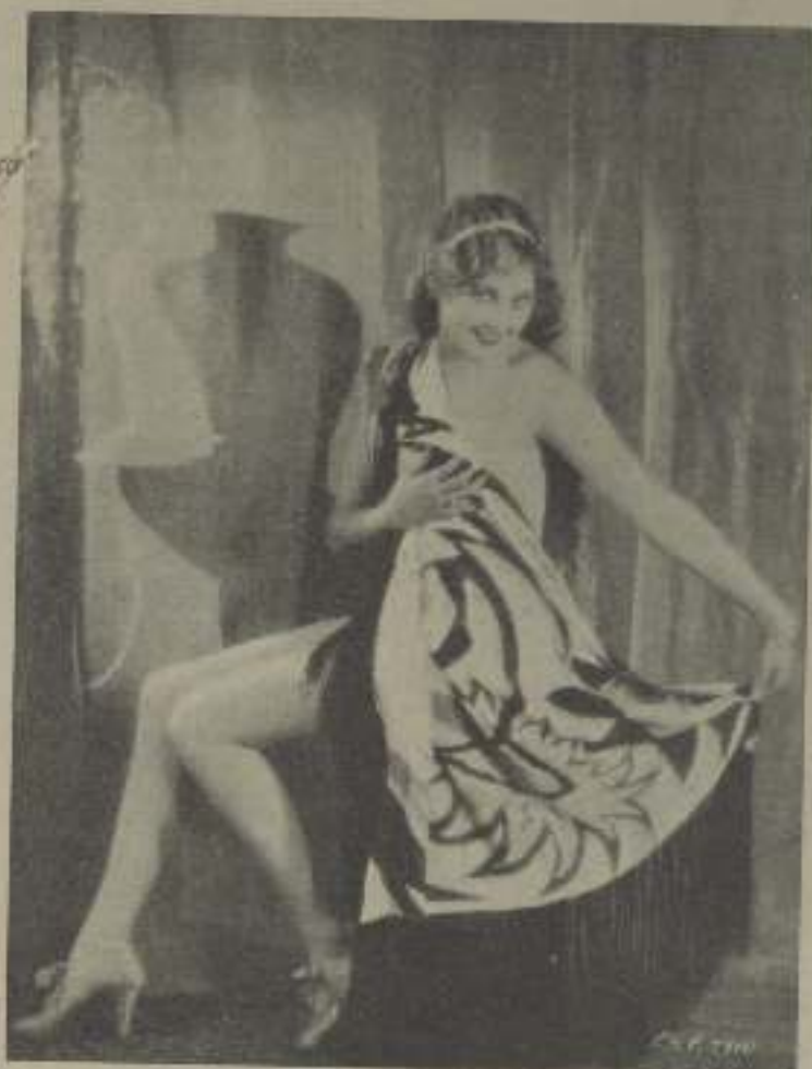
La comediante Thelma Todd, "valerita" de la Paramount, cuando el amor con el televisivo Cupido, en un arriesgada toaca de copa

Mis estudios y prácticas en cinematografía me han demostrado que entre varios artistas filmándose más «marcado es» para el director, es decir, que se amoldan más a sus instrucciones los novatos, los debutantes, en una palabra, los improvisados, que los que procedían del teatro antiguo que ya poseen costumbres y prácticas inmutables en el cinema, y también que los precedentes de académicos y novelescos, cuyos resultados y males evidentes son una dificultad para el director, pero de ningún modo los que poseen práctica en cinema-