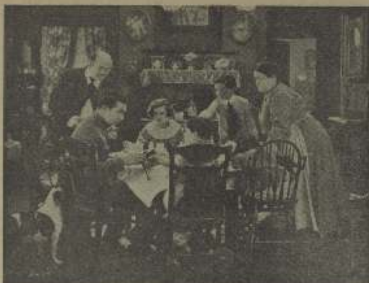
No hay duda de que "Al calor del hogar" se disfruta solamente de la presente vida.