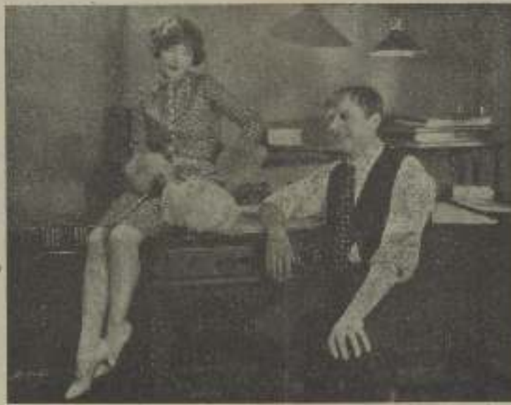
Marion Davies en "Vida la trabajadora" en un momento de entretenimiento en su car