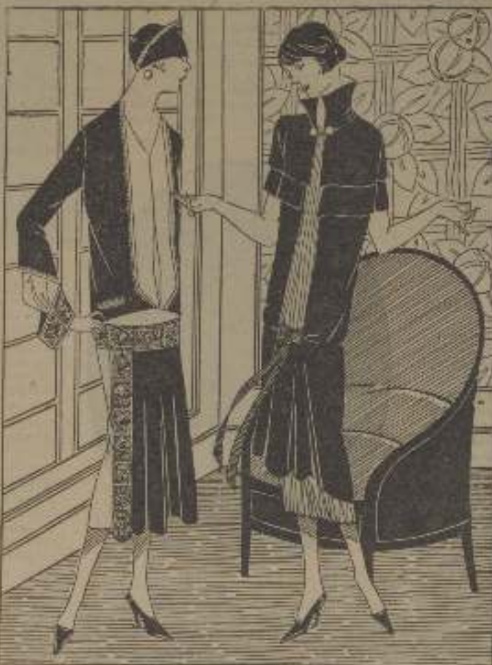
E. 20. Vestido de serape a mil marcos. Sobre un fondo de raso blanco. Galón en broderie rojo, azul y verde. Traje de jersey terciopelo castaño. Detallado y bajo del vestido en cropé color fardo.

bordado de seda que tenga huecos a propósito para ello. Si no podéis proporcionáros el bordado, será también muy bonito el traje colocando sencillamente la cinta alrededor, terminando con un lazo en la espalda, o bien formando por delante dos lazos separados.