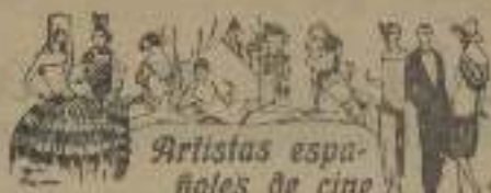
Artistas españoles de cine