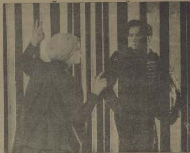
Unos días después la cista Berville en la prisión...

Luego se dirigió al palacio de Hoffmann, éste reconoció en seguida al trapero, Juan le pidió justicia para su hijo adoptivo, ofreciéndole con descubrir su verdadera personalidad si no le sacaba de