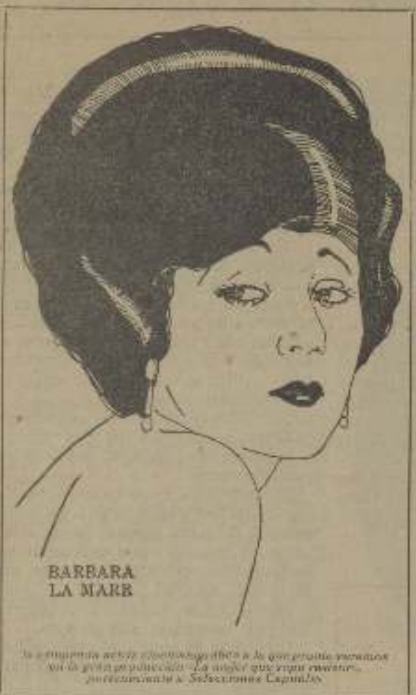
BARBARA LA MARR

La protagonista de la excepcional película «La última expedición al Polo Norte» de Knud Rasmussen. Extraordinaria curiosa y típica, que se proyectará en los cines de esta capital.