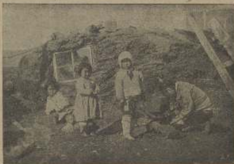
Una escena de la película de excepcional interés «La última expedición al Polo Norte» de Knud Rasmussen. Extraordinaria curiosa y típica, que se proyectará en los cines de esta capital.