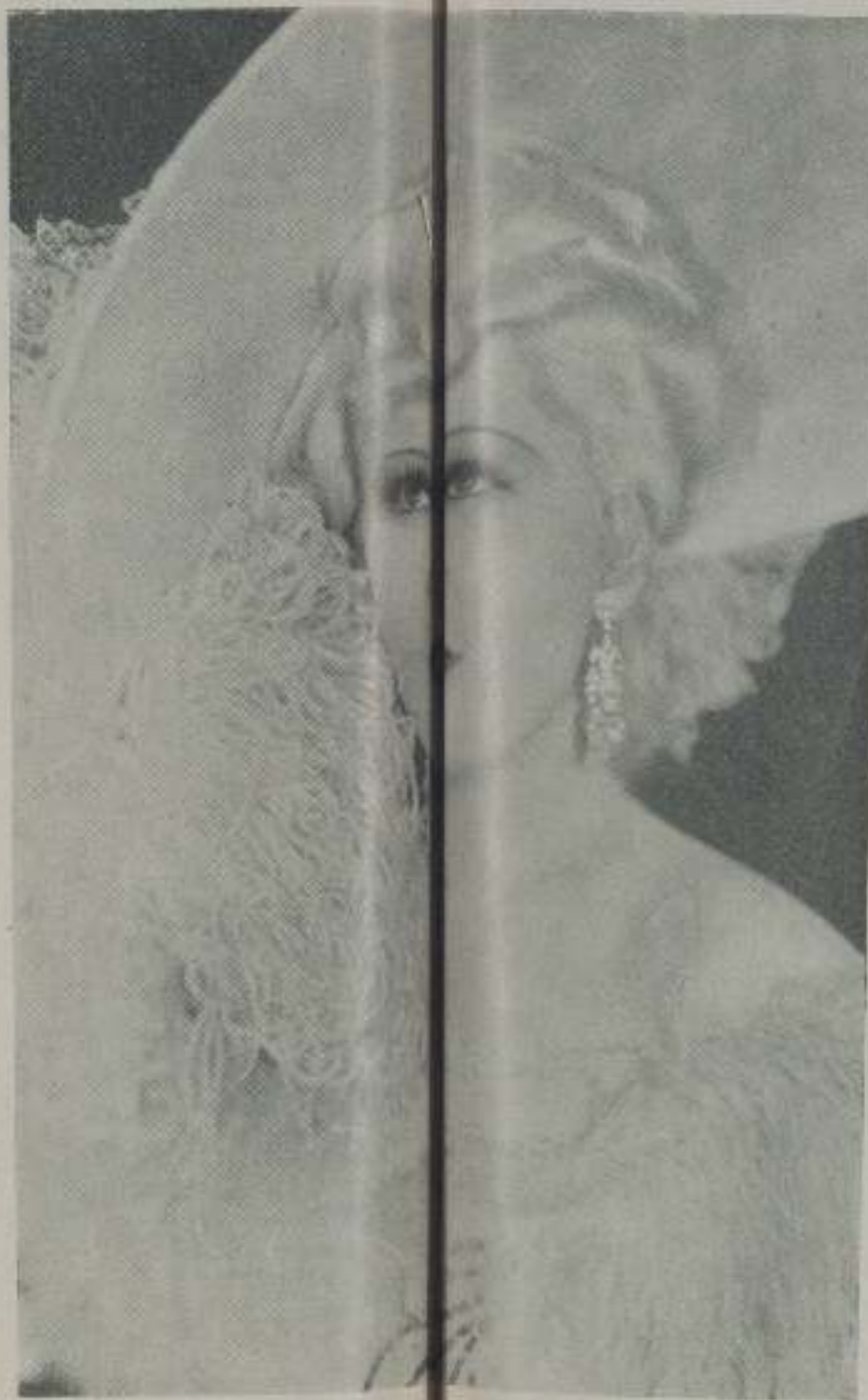
Comparamos a MAE WEST, en la izquierda, con la de la derecha y observaremos que la cinefotografía exagera sus curvas.