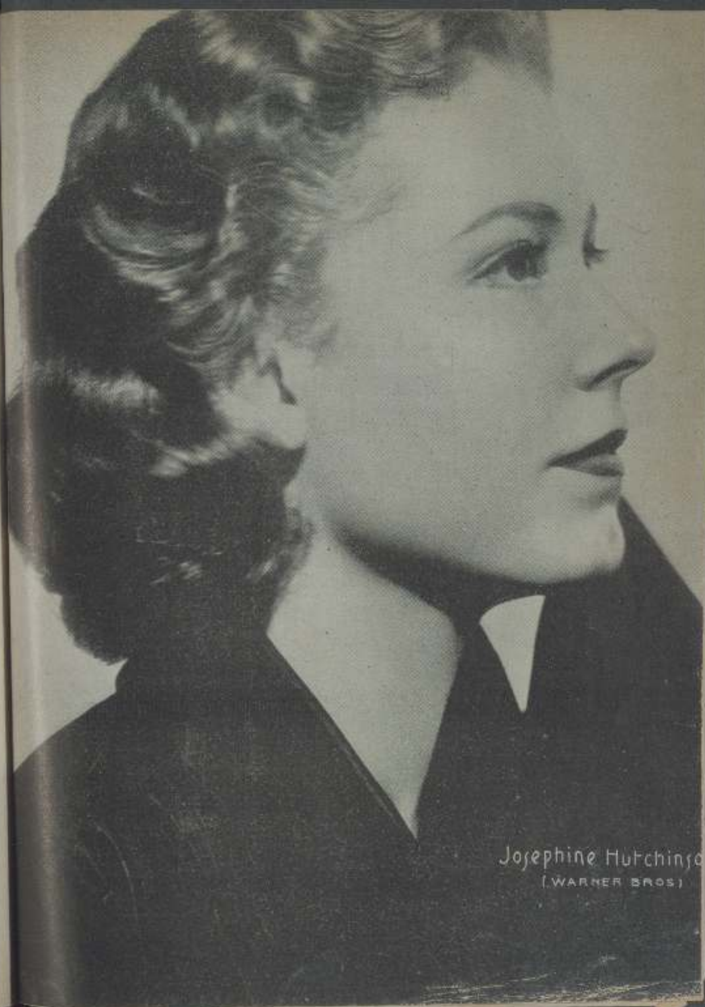
Josephine Hutchinson