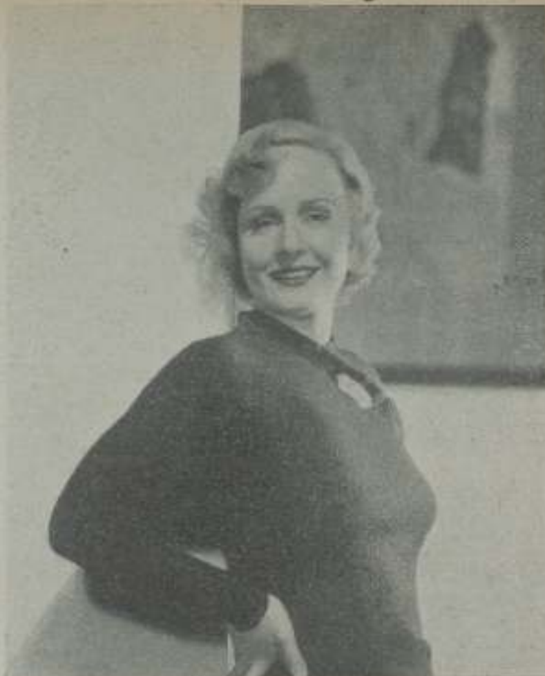
MADGE EVANS, mujer encantadora y bellísima, que triunfa en las filas de Metro Goldwyn Mayer

Si a mí me quedara tiempo de enumerarme de veras, a nadie más que a Madge Evans, se lo diría; pero me faltan horas para dedi-