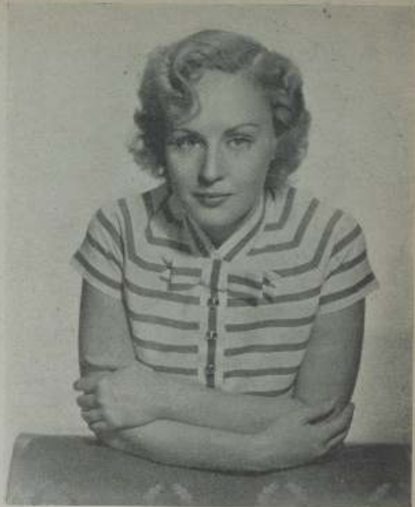
Con un suéter que ella misma fabricó, la belleza de MADGE EVANS serena y doblemente admirable, adquiere un relieve extraordinario