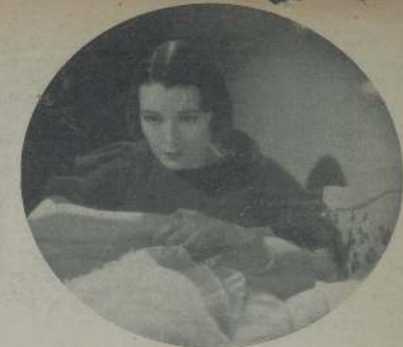
La gentil LÚPITA TOVAR en "Virus rotas", película nacional que está obteniendo el mayor éxito de la temporada.

A lo que Oly Gebauer, una rubia vienesa que es, además de actriz de indiscutibles méritos, muy guapa, pronunció sorprendida mirando al disonante artista: