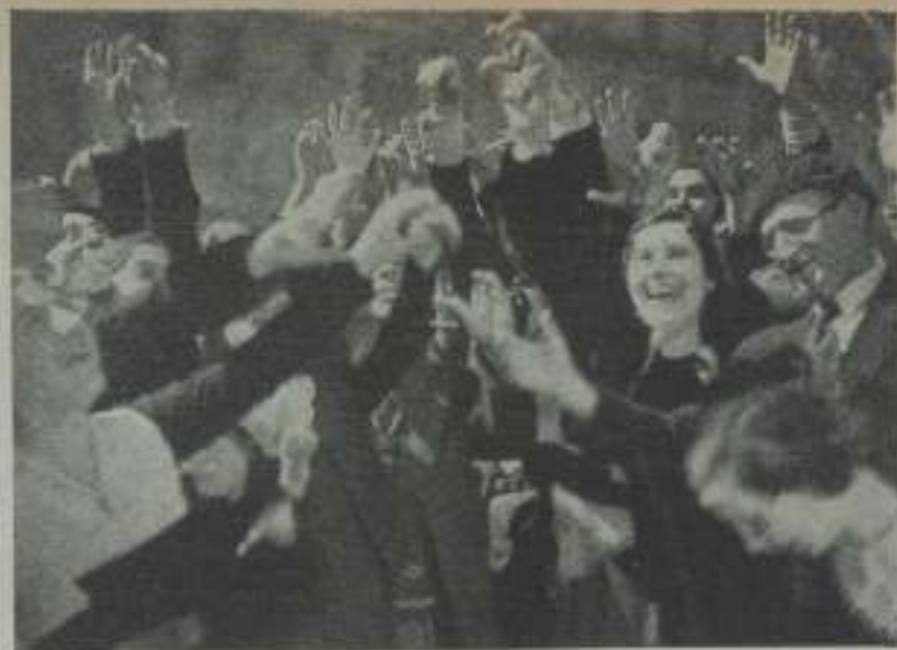
Otra, otra... la fortuna en sus manos por obra y gracia de una genialidad del protagonista de "Poderoso Caballero" el nuevo film de Ibérica.

De repente una exclamación "¡Stro!", rompe el encanto... Un hombre pequeño, de rostro benévolo y ademanes nerviosos, interrumpe la escena y da