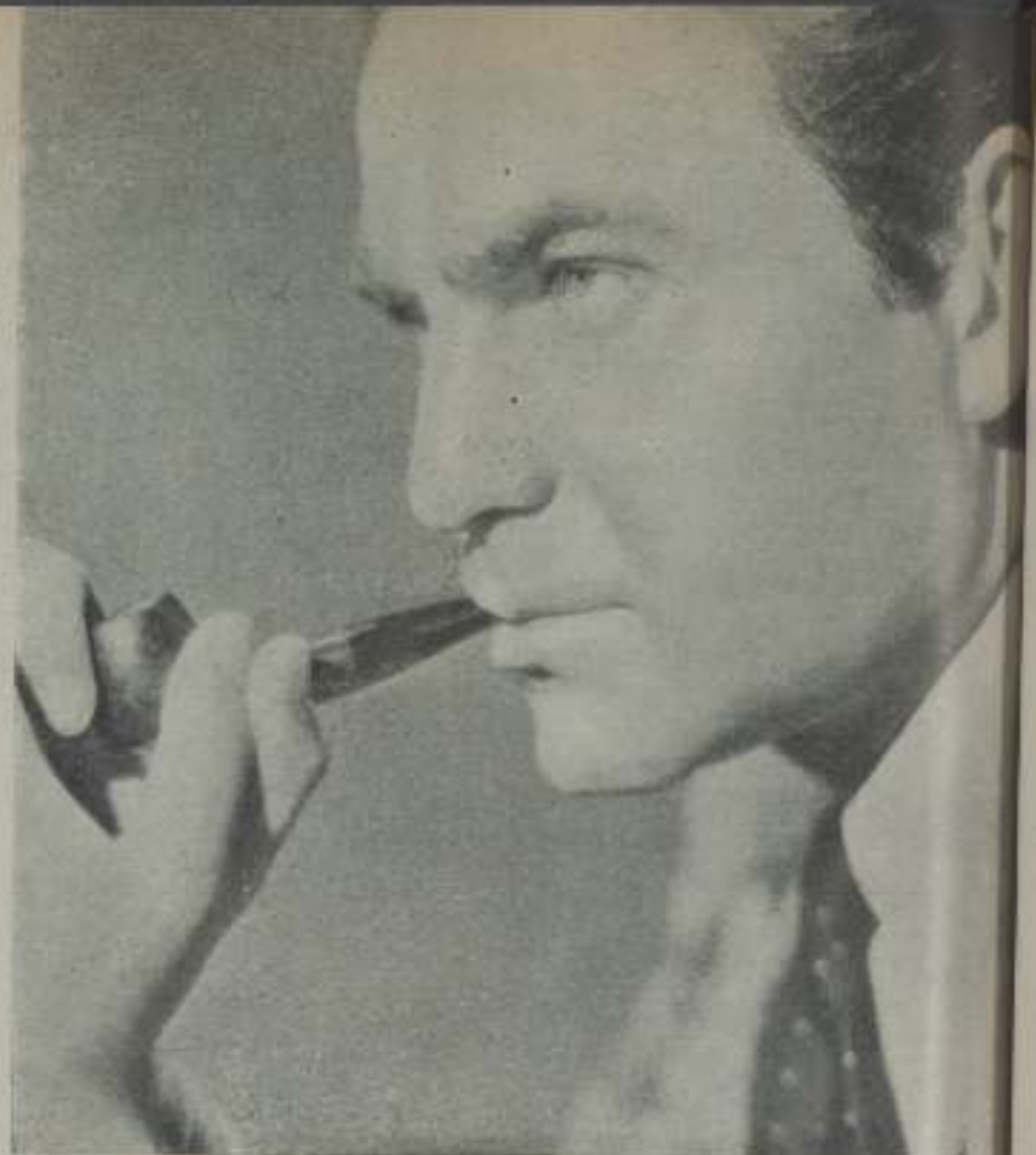
HENRY WILCOXON, actor de la Paramount que ha logrado éxitos clamorosos con sus interpretaciones cinematográficas.