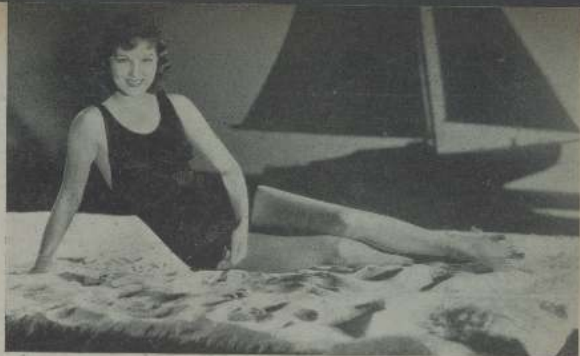
JEAN PARKER la nueva estrella de la Metro, cuya belleza proverbial va acentuándose más cada día.