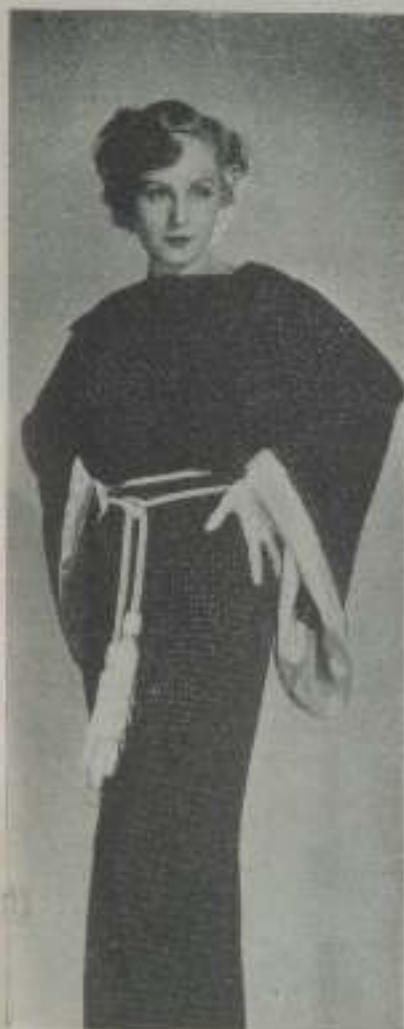
Elegante aun con los vestidos más sencillos, MADGE EVANS, de M. G. M., es siempre la mujer atractiva que todas conocemos a través de la pantalla

— Yo le he visto decir a usted en otras ocasiones que los hombres trabajan y se visten por nosotras y que si no fuese por nosotras, ustedes no se preocuparían lo más mínimo de raparse las barbas o afeitarse el cabello; pues bien, lo mismo nos sucede a nosotras. Si en el mundo no hubiese más que mujeres, le aseguro a usted, que yo ni sería presumida, ni me preocuparía lo más mínimo de vestidos. Viviría dentro de la más perfecta inacción porque, sin hombres, ¿qué iba a ser de nuestro mundo?