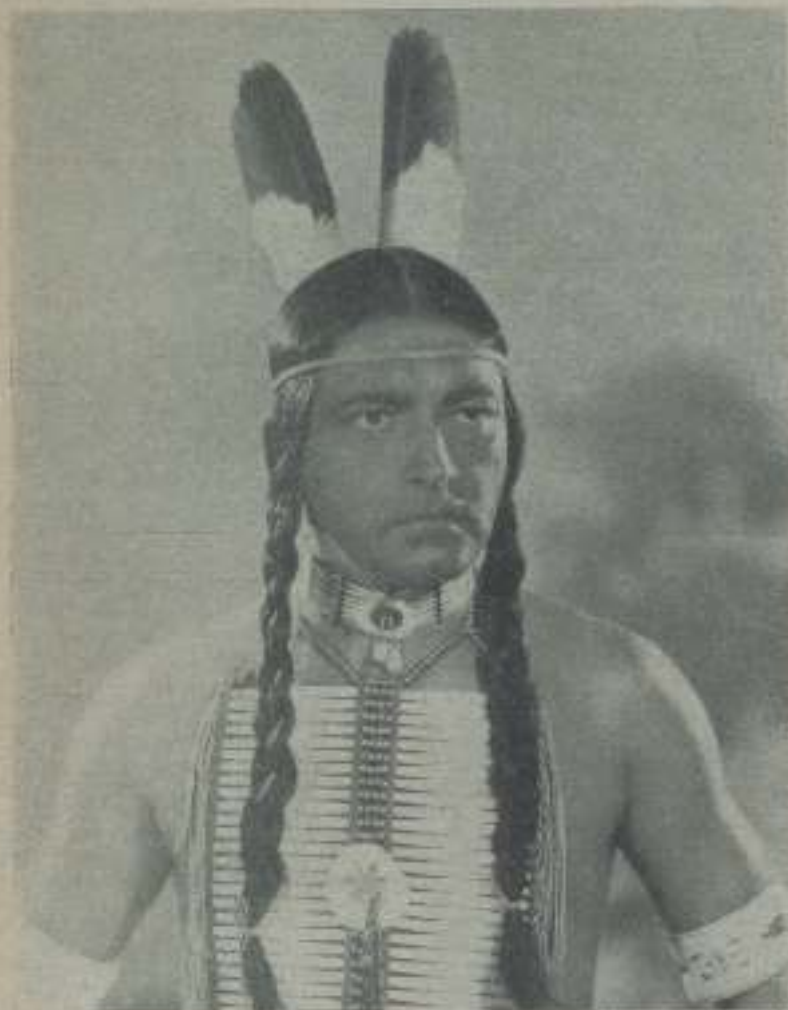
RICHARD BARTHELMES, el gran actor de la Warner Bros, en una caracterización de la película "Massacre"

Los editores americanos no se contentan ya con fotografiar los grandes problemas sociales y políticos que vienen agitando el país sino que comprendiendo como nadie lo que puede y debe ser el cinematógrafo, hacen gala de su notoriedad extendiendo su radio de acción hacia la parte educativa.