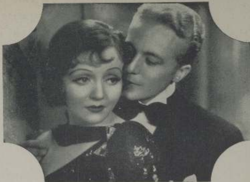
GENE RAYMOND y NANCY CARROLL en una escena de "Transatlante" de Artistas Unidos.