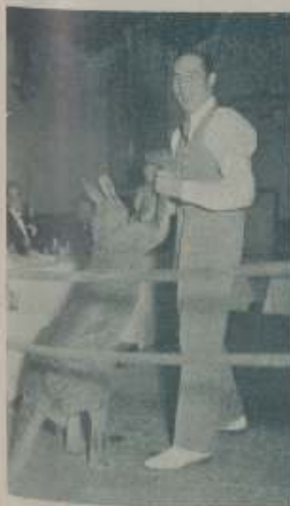
MAX BAER, el campeón del mundo de boxeo que ha firmado contrato con la Paramount