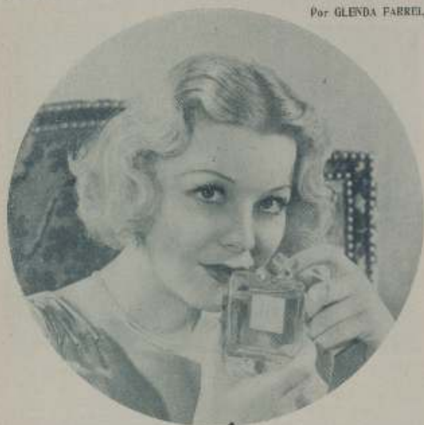
GLENDA FARRELL, española actriz de la Columbia-Cities, cuyas actuaciones cinematográficas la elevan al pináculo de la popularidad.

El perfume siempre despierta admiración porque además da una idea de limpieza personal que acredita a quien lo lleva.