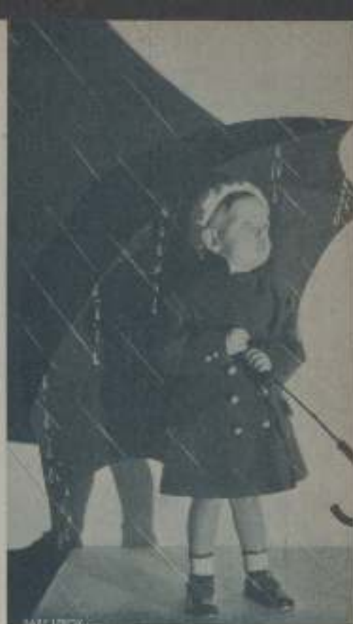
BABY LE ROY en una escena de "Un proceso sensacional" de la Paramount

La Asociación Española de la Prensa Técnica ha tenido que realizar un verdadero esfuerzo en estos momentos de crisis económica, para lanzar esta obra, que tendrá cerca de 200 páginas, pero la circunstancia de ser la primera de esta clase que ve la luz en España y en el extranjero, ha impulsado a los dirigentes de aquella entidad a no demorar su publicación, ya que ella redundará en un mayor prestigio de nuestro país.