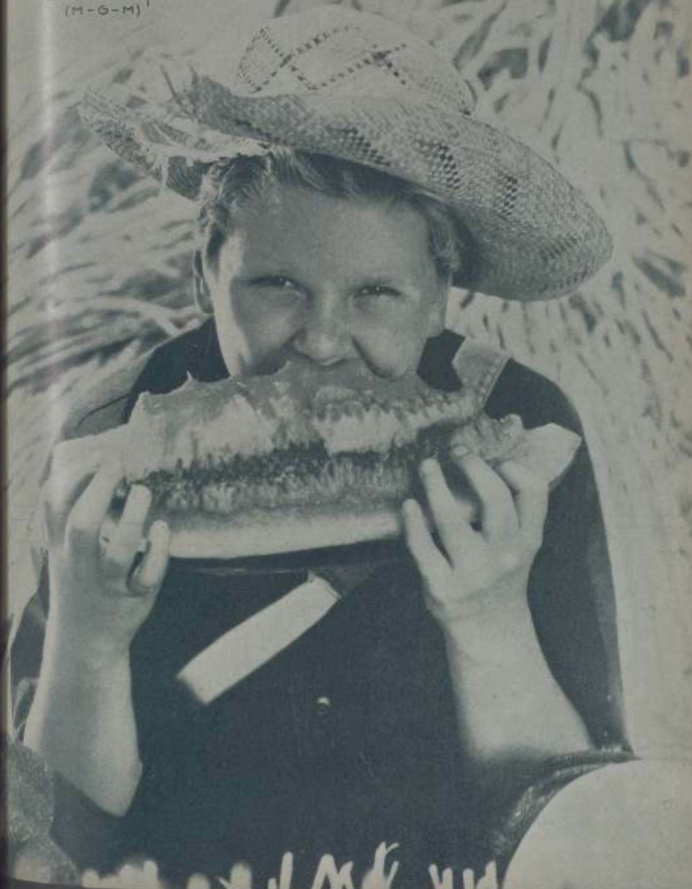
Jackie Cooper