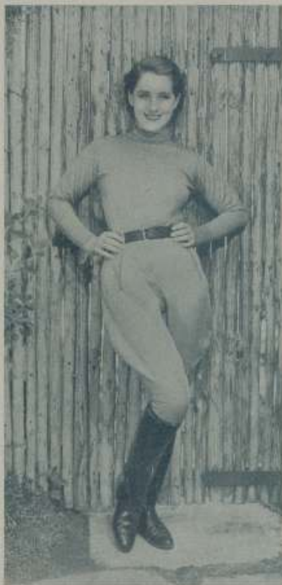
NORMA SHEARER, exquisita actriz y madre cariñosa que comienza a ser completamente despojada el cielo de su dicha

Cuando mi esposo me dijo que el estudio había determinado darme el rol principal en "Destinos", comedia dramática ultra moderna, me puse a temblar, puesto que mi film anterior había sido "Las horas electas" en la cual yo había hecho un rol de muchacha valiente y fuerte y tenía que el contraste fuese demasiado fuerte. Ahora que el film está hecho y estrenado nada temo, pero en cambio sufro ante la idea de que entre la Mary de "Destinos" y "Las vírgenes de Wimpole" haya tanta diferencia en "todo" que la crítica y el público se pongan en mi contra. Claro está que la culpa no es mía, puesto que ya me limité a hacer lo que el estudio dispuso, pero no por eso dejó de tener las consecuencias.