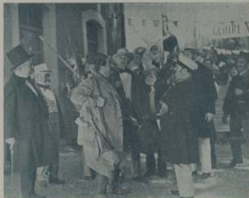
RAIMU en una escena de "Tartarin de Tarascón", de Cinoes que está obteniendo gran éxito en el Teatro Tivoli

Pero una de sus principales cualidades es la pronunciación. Dice con