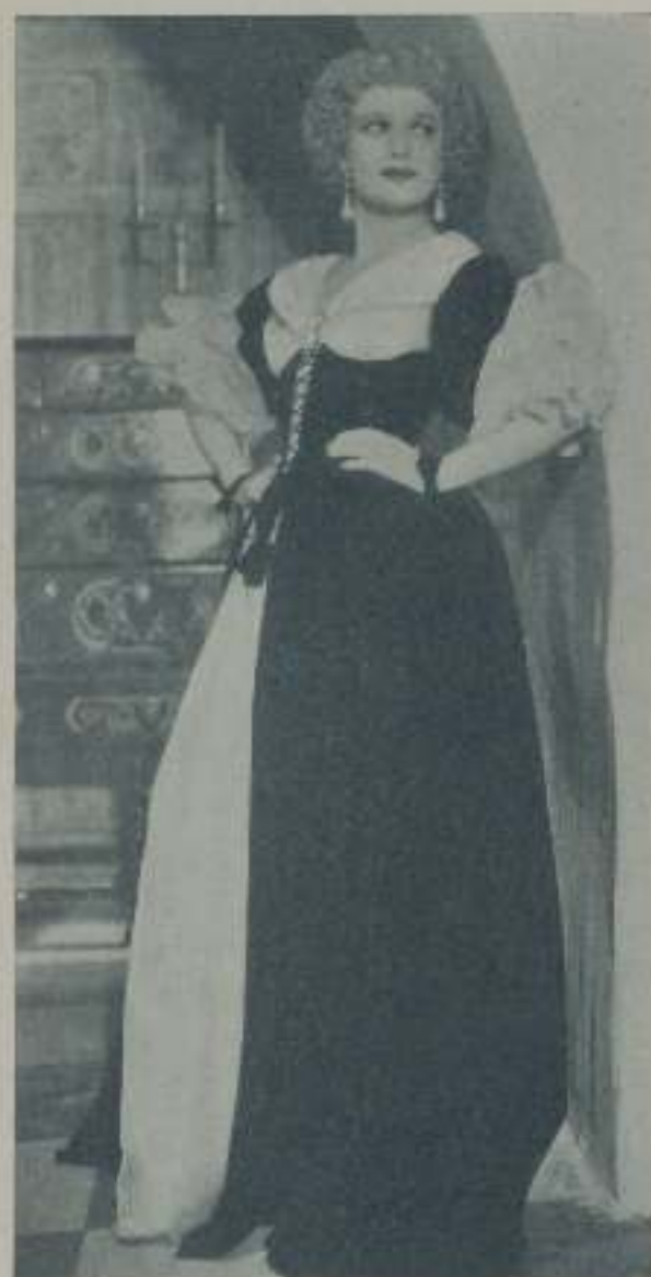
ANNA NEAGLE, bellísima mujer y gran actriz que triunfa en "Nelly Gwyn", película que distribuye Moyer PBM

A la pantalla cinematográfica van añadiéndose cada día nuevos nombres, prestigiosos muchos de ellos por haber cosechado en la escena teatral los triunfos más ruidosos, nuevos otros pero que por su belleza y su compenetración con la cinematografía están destinados a alcanzar los más altos galardones.