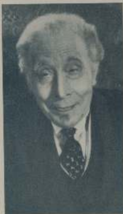
GEORGE ARLISS el gran actor de Artistas Unidos

¶ Joan Blondell está tan entusiasmada con su hijito, que ha declarado que no renovará su actual contrato con la Warner Bros cuando este expire, puesto que desea dedicarse única y exclusivamente al hogar. Metro, real que el contrato en cuestión no toca a su fin hasta últimos de 1937.