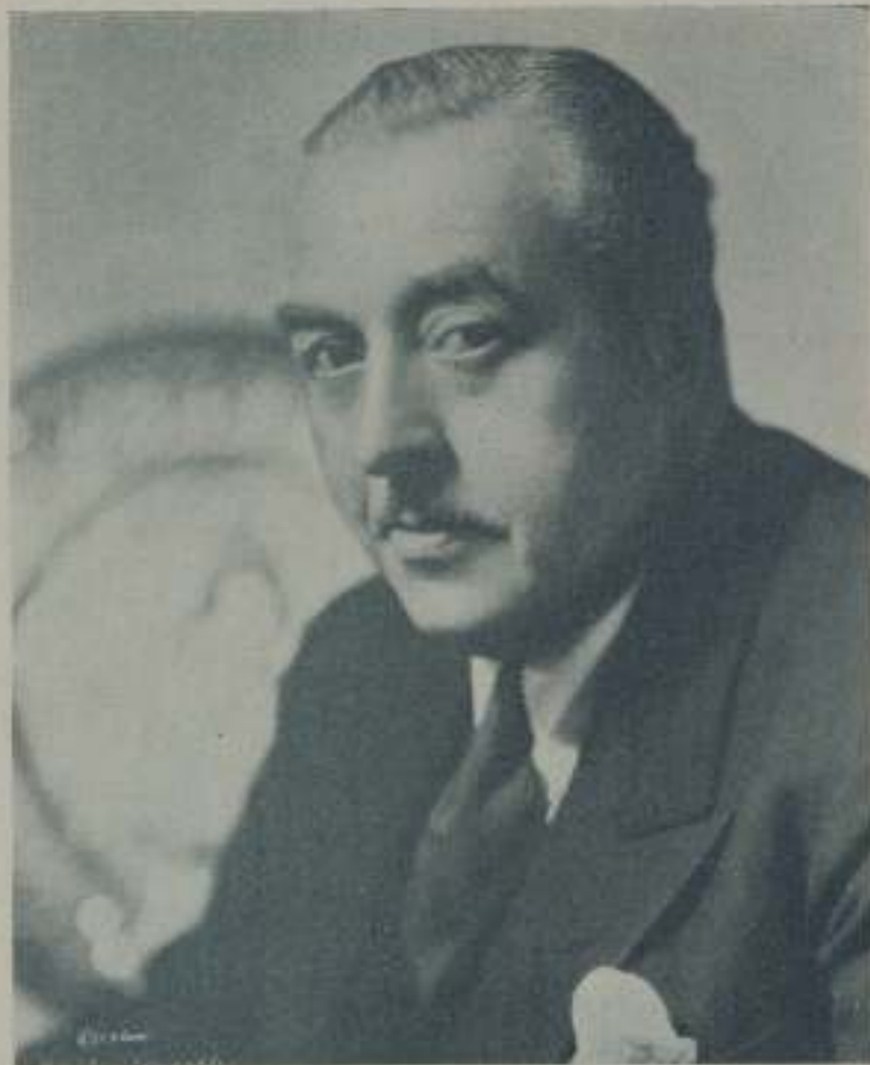
WALTER CONNOLLY, excelente actor de Columbia-Cifera, que realiza una de sus mejores interpretaciones en la sólida comedia "Sucedió una noche"