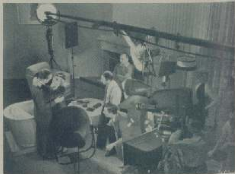
Una escena de la película "Amores de un día" de la Universal interpretada por PAUL LUCAS y LEILA HVAMS

¶ Josef Von Sternberg ignora la presencia de Ruben Mamoulian cuando el director ruso visita a Marlene Dietrich en el "set" de "Carnaval en España" y Marlene a su vez "ignora" a Sternberg y es constantemente enredado cuando éste va a visitarla al estudio Paramount. Pero, a pesar de sus frecuentes visitas a la Dietrich, Mamoulian continúa siendo íntimo amigo de la Garbo, que ahora divide su tiempo libre entre Ruben y George Brent de quien se dice se halla actualmente en morada.