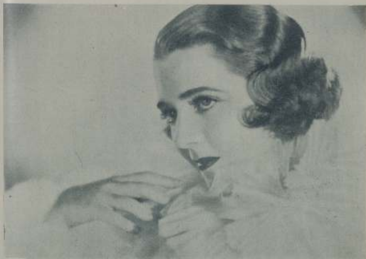
RUBY KEELER, estrella de la Warner que uno a su belleza una gran sensibilidad artística

Así, mi opinión general — que ya he dejado asentado no puede ser por completo imparcial — es que el matrimonio es perfectamente compatible con el arte.