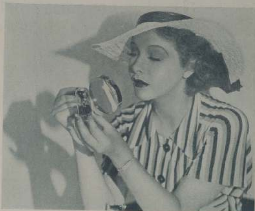
HELEN TWEL- VETTES, bellí- sima actriz de la Fox protagonista de "Nada de Nueva York"