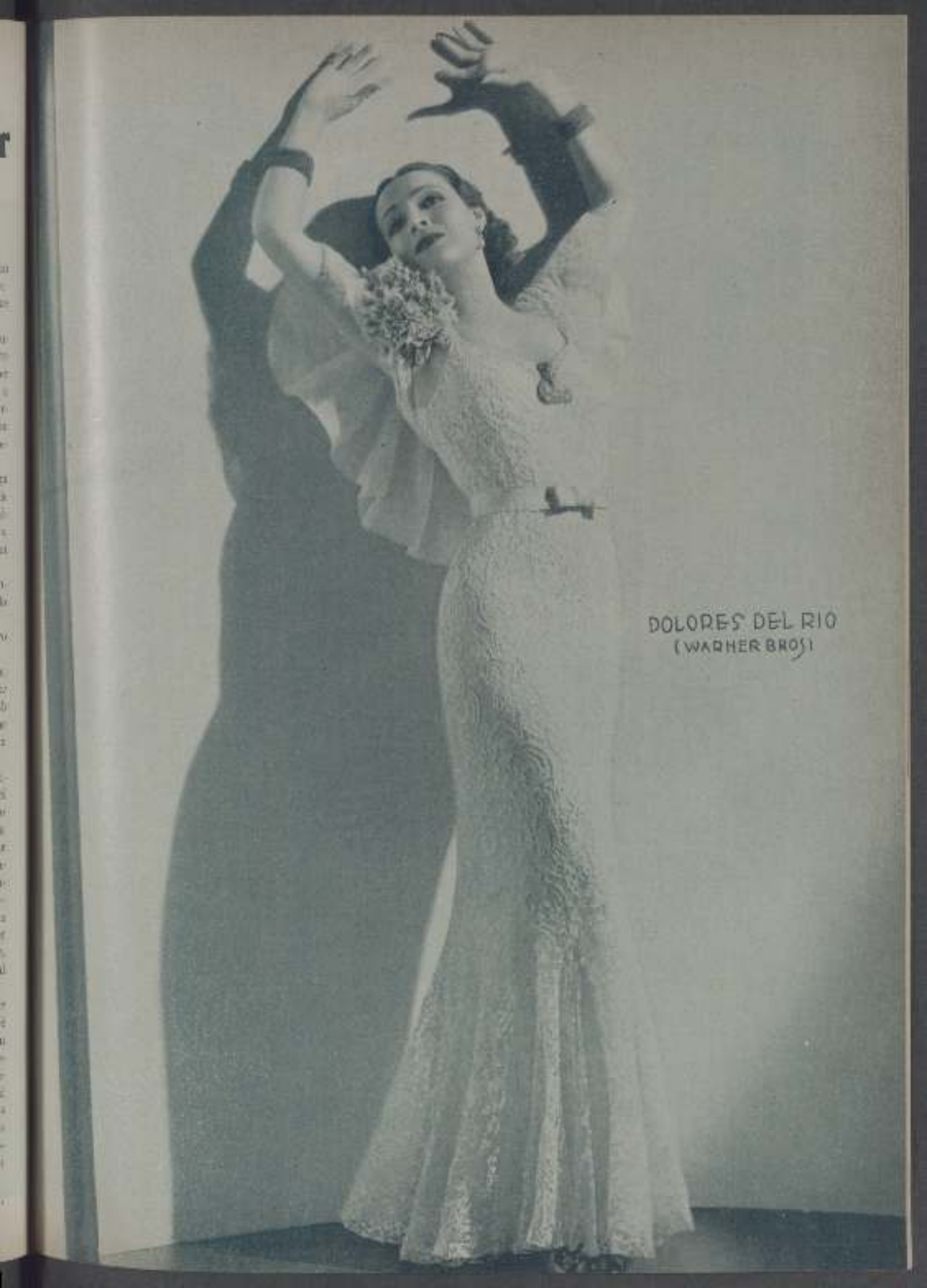
DOLORES DEL RIO (WARNER BROS.)