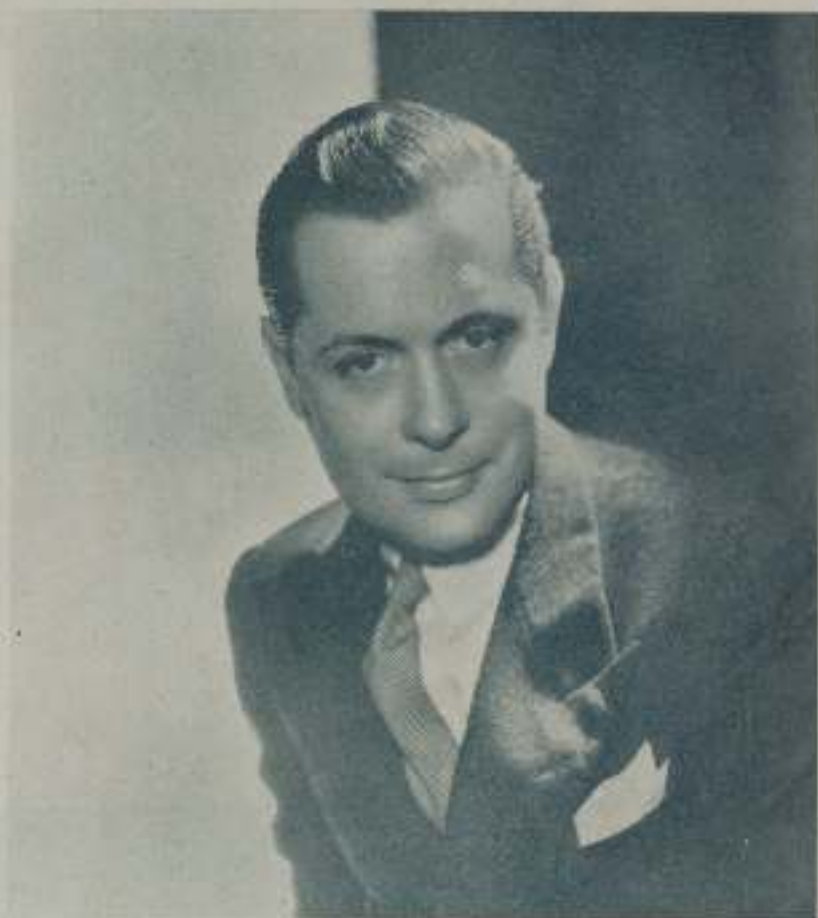
ROBERT MONTGOMERY, actor de M. G. M., que nos habla de los grandes inconvenientes de la popularidad.

De visita en los estudios de la M. G. M. vamos a Robert Montgomery cómodamente instalado en un rincón del escenario. Desde hace mucho tiempo nos escarabajaba la idea de preguntar a cualquier luminaria de la pantalla qué tal se sentía siendo estrella. Y tomamos la ocasión por los cabellos.