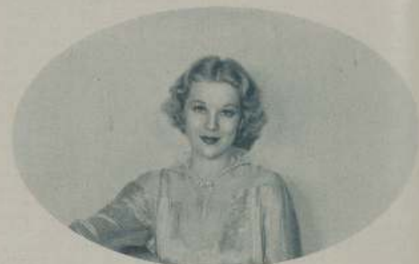
GLENDA FARRELL, española actriz de singular belleza que ha logrado destacarse en Hollywood.

no debemos descuidar las mujeres. El es parte de nuestra personalidad y así como conocemos a las flores por su perfume sin necesidad de verlas, así debemos nosotros perdurar en el recuerdo de los hombres sin necesidad