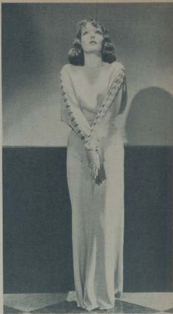
LUPE VELEZ la mujer más traviesa y atractiva de Hollywood, protagonista de "La flecha" de Metro Goldwyn Mayer.

Vivir malidos cuando la felicidad se aleja es superior a la voluntad de Lupe Velez. Habían pasado ya los días de mutuos halagos, la dicha huía de ellos y antes de que el casamiento pudiera separar sus vidas