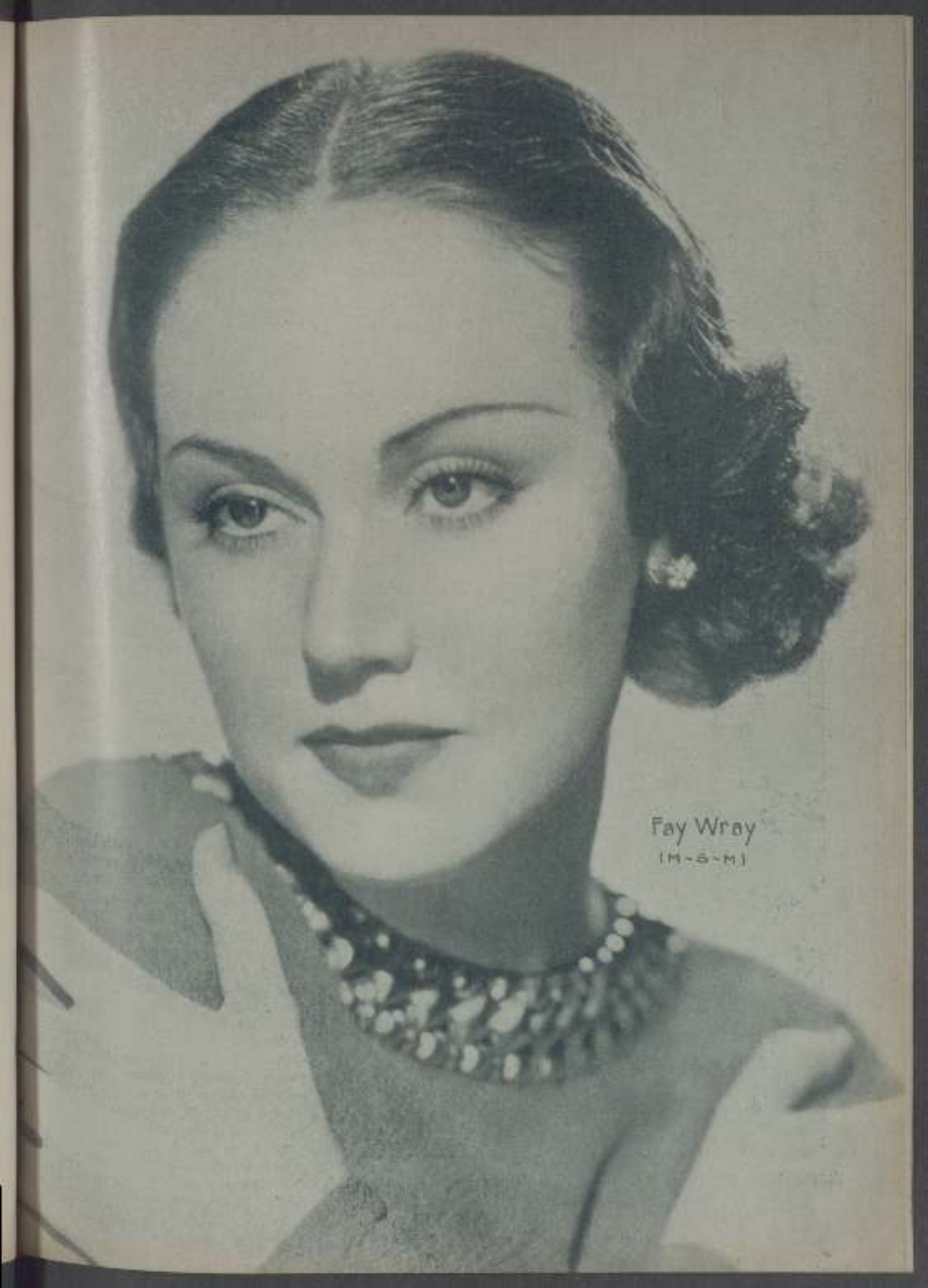
Fay Wray (M-S-M)