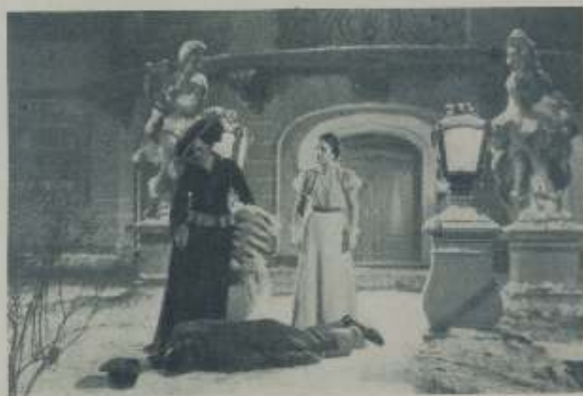
Una escena de la gran película de Ufima, "Mascarada"

— ¿Qué? ¿Quién? ¡La señorita Du- all está! ¡Hay efectivamente una se- ñorita Du! — piensa Heiden- eck. Entonces se acerca a Poldi, ajena a toda conciencia, y se interesa inco- municadamente por ella y el mujeriego pintor se acerca, prendado de la muchacha. La sala de la sala para que Poldi sea para él y la lleva a un cubare típico vienés. La muchacha vive tal atractivo para este hombre acostumbrado a despreciar a las mujeres, que desea volverla a ver. Por primera vez en su vida, el artista Heiden-eck, puede comprobar que su arte pictórico fracasa ante los rasgos de esta muchacha, que tiene a su lado.