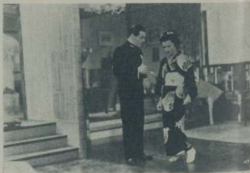
CHARLES BOYER y ANNABELLA en la gran película de Ibérica Film "La Batalla"

Charles Boyer hace una espléndida creación del marqués de Yoritaka; Annabella una deliciosa marquesa atormentada entre un señor y el oficial inglés que la corteja John Lodge más interesante por su naturalidad, Injijoff anima a la perfección el papel de Hirata.