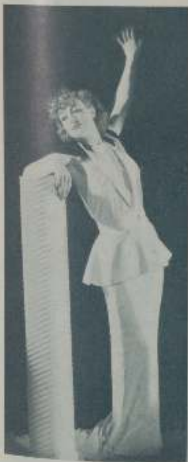
Admirable de línea, de belleza imponderable JOAN CRAWFORD continúa siendo la mujer seductora de sus primeros tiempos

cuando esto llega yo quiero desear, desear siempre porque el deseo de algo son ilusiones, esperanzas... y vibras entre tanto y te animas por conseguir tu objetivo y tratas de experimentar siempre. ¿Que alguna de esas ilusiones se rompe? ¡bah! otra nueva en su lugar y a comenzar de nuevo.