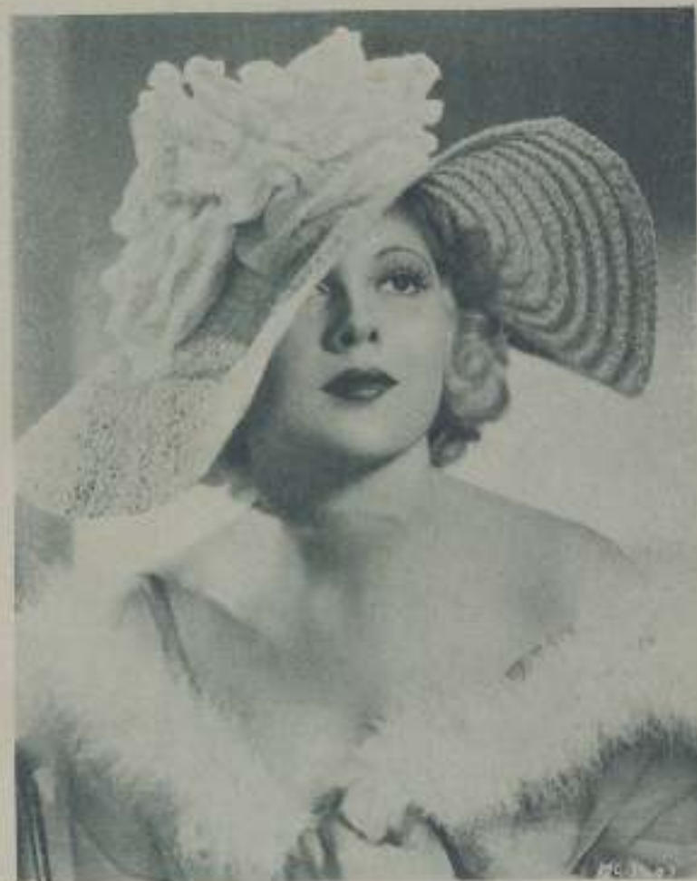
MARY CARLISLE, la bellísima actriz de Metro Goldwyn Mayer que camina hacia el estrellato

Mujer de belleza tan espléndida, joven y llena de voluntad, trata necesariamente que triunfar en cuantas actividades humanas se dedique. No hace que muchos años que su nombre se unió al cinematógrafo, pero apenas llegada a Hollywood, Mary Carlisle se hizo notar en los escenarios. Su alegría rebosante, su empeño por destacar hicieron que los directivos cinematográficos se dieran cuenta de su presencia y fué la Metro Goldwyn Mayer la que advirtió las muchas posibilidades que resalta la plerórica belleza de la telecípiante.