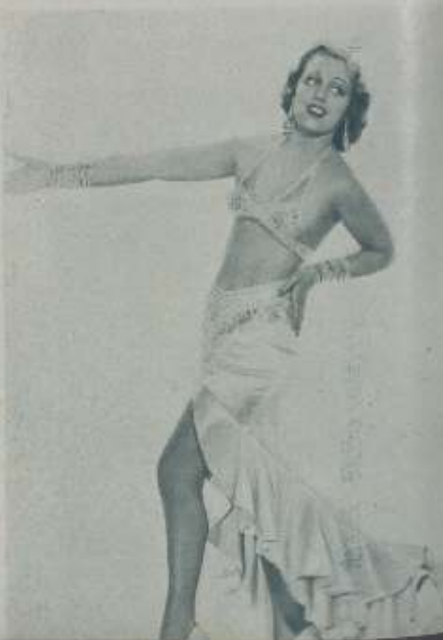
Airosa, llena de garbo, FRANCES DRAKE marca los puntos de la rumba con la gracia de su desenvoltura americana

Estábamos firmemente convencidos de que Frances Drake era una mujer admirable, pero una vez vista bailando el danzón, con una falda de largas volutas pero abierta por el centro para dejar libres los movimientos de las piernas — y para que podamos apreciar lo bonitas que son — y un ligero sostén por tanto atavío, en el fondo, no dudamos en afirmar que es un encanto de criatura de belleza indescriptible.