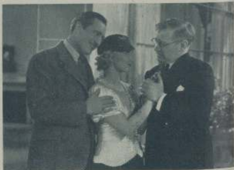
EDMUND LOWE, ANNA SOTHERN y GREGORY RATTOP en "Es hora de amarnos"