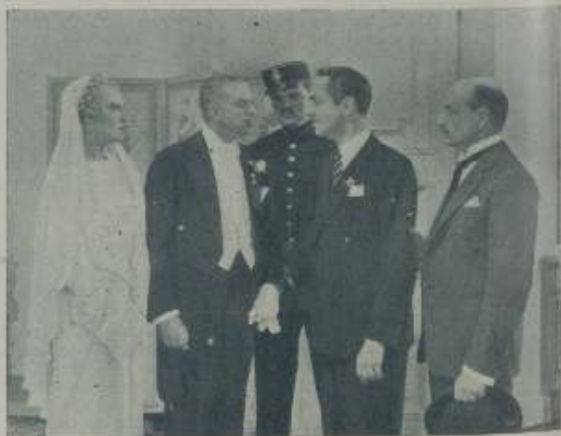
Una escena de "El altar y la moda" protagonizado por WILLIAM POWELL

No le importa llevar medias sueltas en los zapatos siempre que el cuero esté nuevo y reluciente. No le gusta deshacerse de una cosa que todavía puede usar.