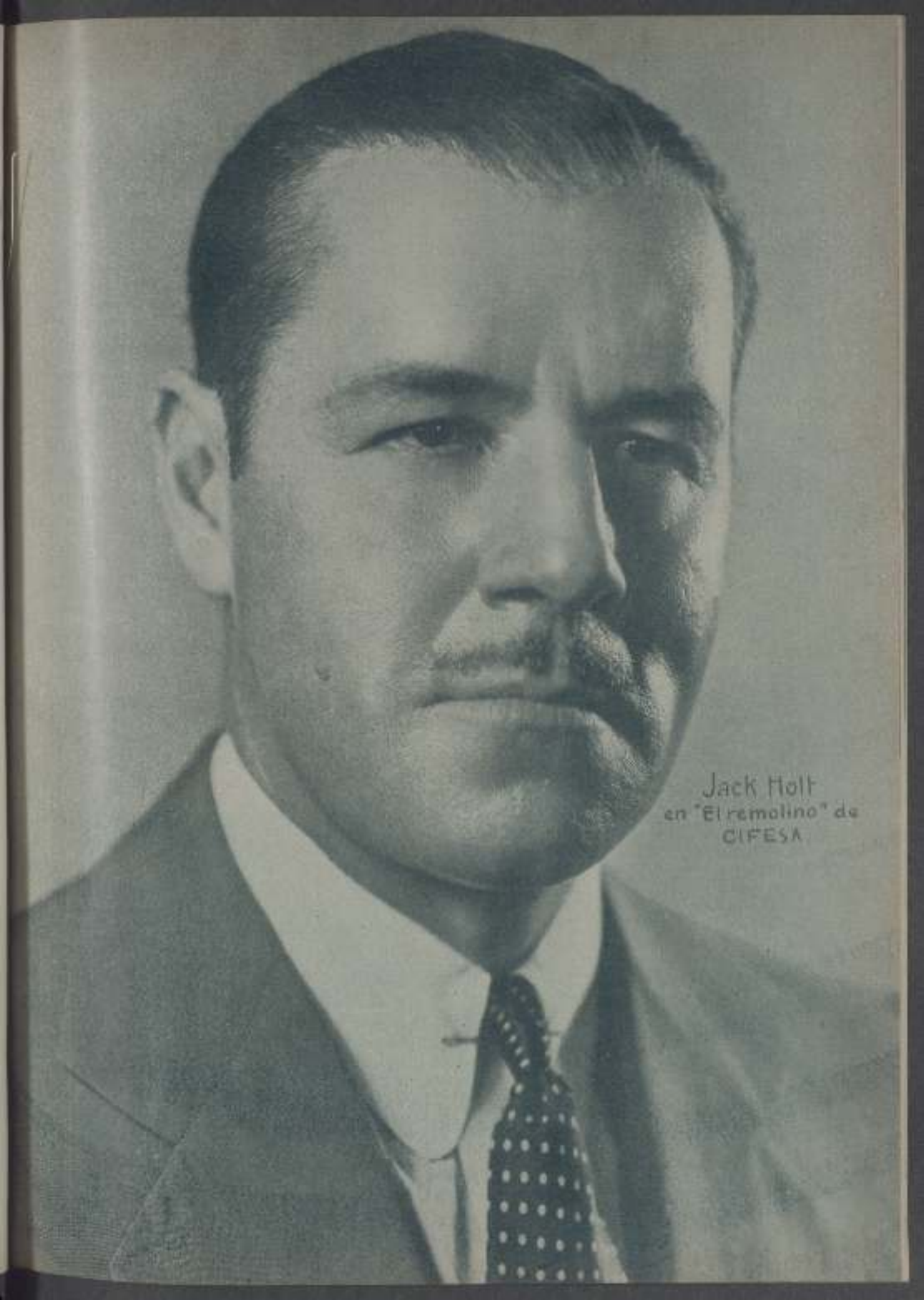
Jack Holt en "El remolino" de CIFESA