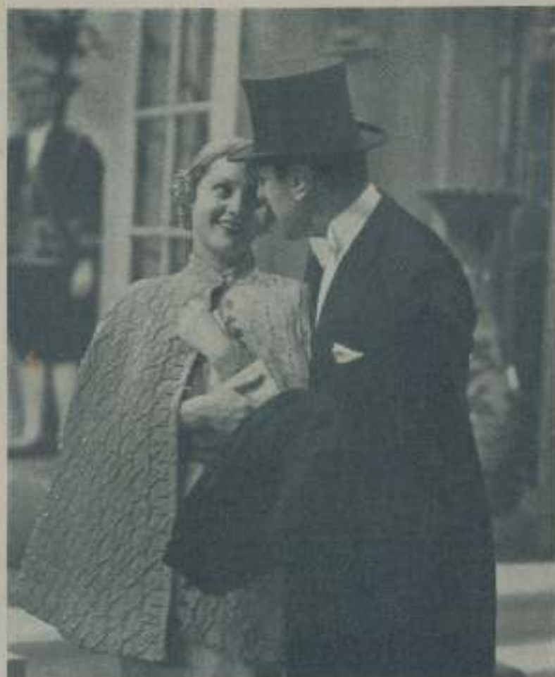
MARIE GLORY y JEAN MURAT, protagonistas de "La taquimeca se casa" que se estrenó hoy en Femsa presentada por Cinesa

La gentil actriz francesa, ha hallado una nueva oportunidad para afirmarse en el concepto de sus admiradores. Marie Glory hace una verdadera creación del papel de taquimeca, poniendo de relieve su temperamento artístico y en cuya acción, aparte de la personalidad en ella reconocida, destaca su belleza graciosa belleza que cada día es más firme.