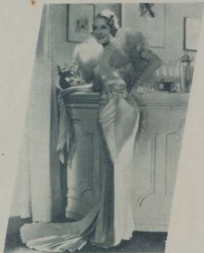
MIRIAM JORDAN, bellísima actriz protagonista de "Es hora de amarnos" de Cifesa

Hollywood es la ciudad mágica donde se reproducen las usos, costumbres y lugares de todas las partes del globo: con martillo, sierra, pintura y cartón surgen por ensalmo una encantadora escena en Venecia, la aboga de un esquinjal o una de esas esquinas cosmopolitas de la Rue de la Paix.