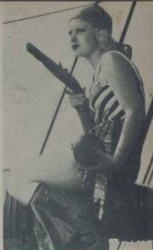
MARY CARLISLE, puesta en un viejo galcón hispano, película de la Metro Goldwyn Mayer recientemente filmada

Y no podía ser de otra manera. Una mujer como ella, llena de entusiasmos platónicos de vida e ilusiones que siente por la cinematografía profundos afectos y que ha querido recorrer poco a poco el camino que otros aspiran a salvar de un salto, tenía que recoger el fruto de sus afanes, y estamos seguros que en breve su nombre brillará en los letreros luminosos de los Cinematógrafos del mundo orlado por