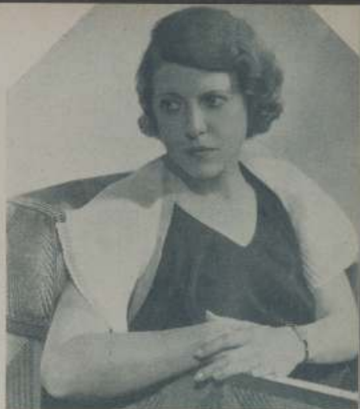
RUTH CHATTERTON, de la Warner que convencida de que el reposo es necesario a los cuerpos, duerme diez a doce horas diarias.

BARBARA STANWYCK, de la Warner, dedica sus horas libres a la natación que vitaliza las líneas de su cuerpo.