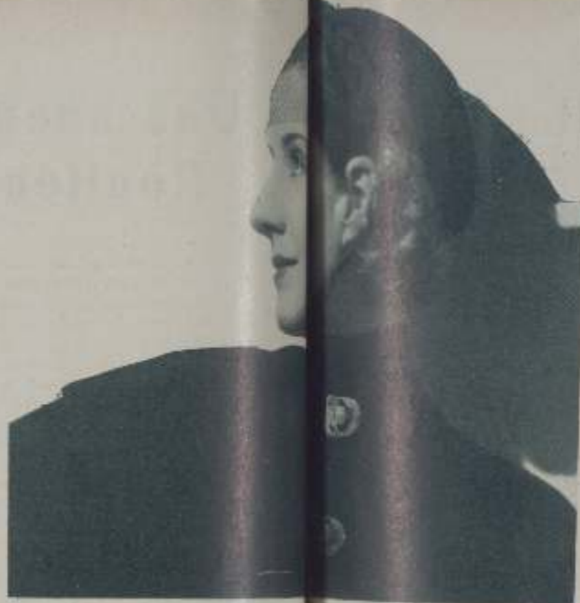
Ingenua en la expresión y de las actrices, NORMA SHEARER continúa siendo la estrella de los días del cine mudo