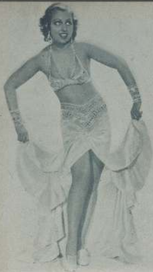
FRANCES DRAKE, mujer bellísima cuyo cuerpo de maripala se mece al bailar el danzón cubano con voluptuoso ritmo