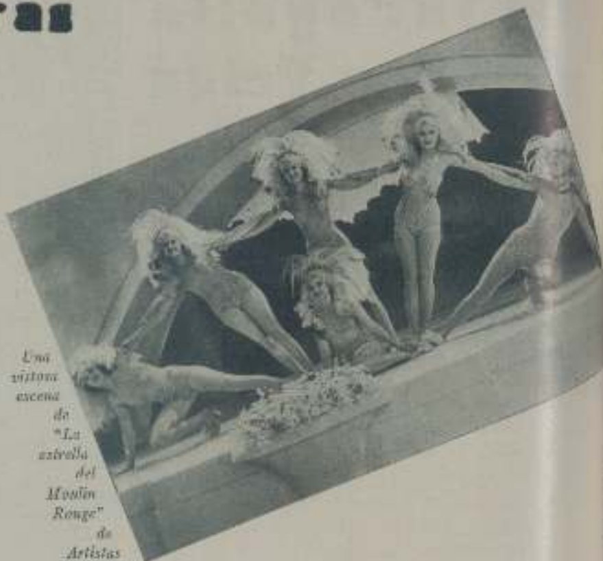
Una vistosa escena de "La zorra del Molin Rouge" de Artistas Asociados

June Knight se ha marchado de la Universal al expirar su contrato porque no estaba conforme en aceptar la renovación del mismo si no le aumentaban el sueldo.