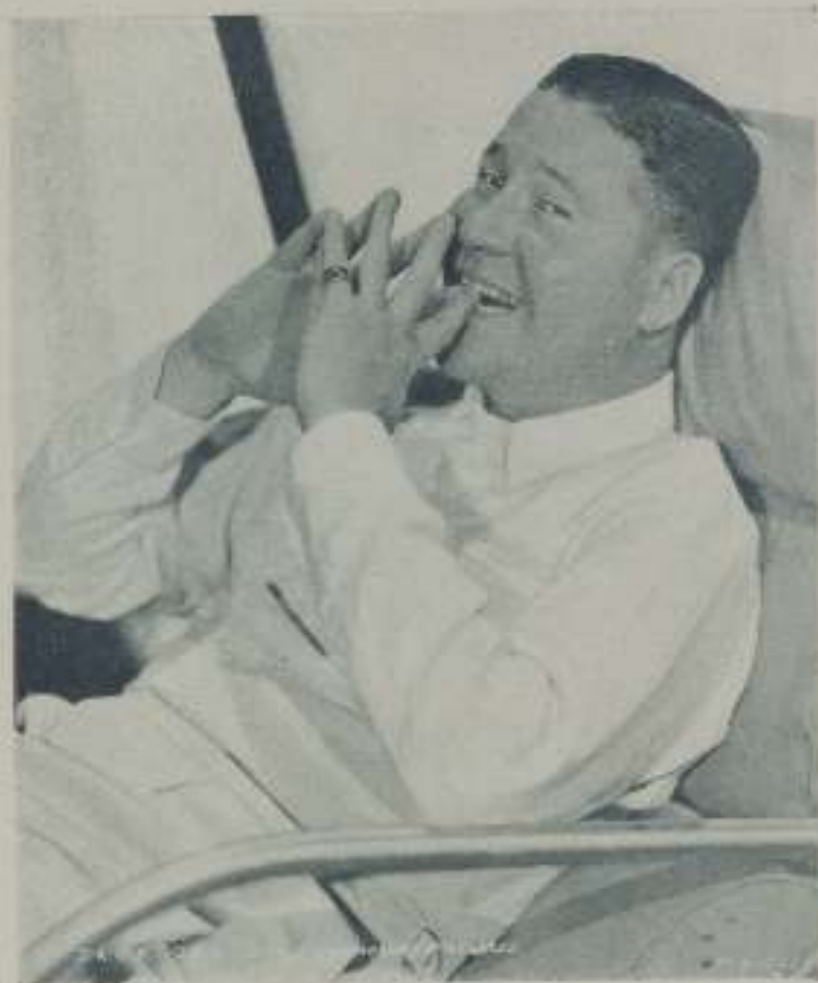
JACK OAKIE, simpático actor de la Paramount, protagonista de "Deja me soñar"

Semana tras semana recibe unos dos mil cartas procedentes de las cinco partes del mundo. Todas ellas dicen sobre poco más o menos lo mismo; se trata de alguien que reúne condiciones para ser actor de cine y desea saber cuál sería el camino mejor para llegar a serlo. Per supuesto, y es precisamente lo que me impulsa a escribir estas líneas, todos mis correspondientes dan por sentado que, cualquiera que fuere el camino, el emprenderlo presupondrá la necesidad de trasladarse a Hollywood.