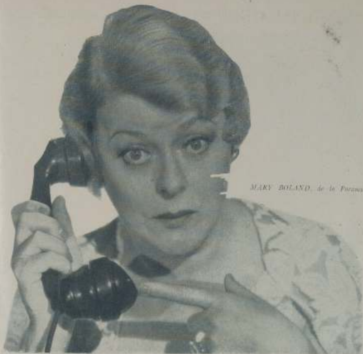
MARY BOLAND de la Paramount