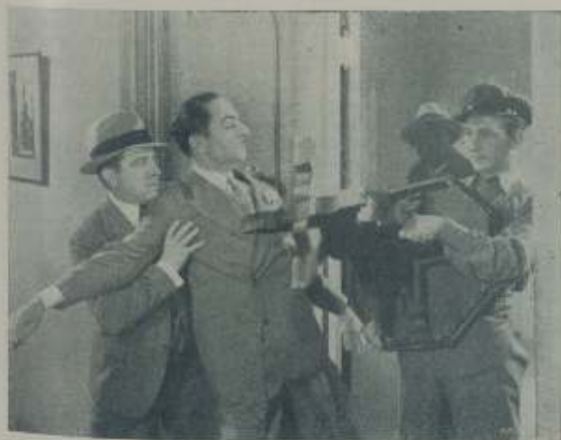
Escena de "El altar y la moda", película Warner Bros cuyo estreno ha conseguido un gran éxito

Es un fiel aferrado a los estudios Warner Bros.-First National para los que hace ya tiempo trabaja y cree que Michael Curtiz, el director de "Matando en la sombra" es uno de los mejores directores del cinema y el que sabe encontrar mejor el medio de intrigar al público y de acrecentar el misterio del drama en esas producciones de trama complicada hechas para tener el ánimo del público en tensión hasta el último momento.