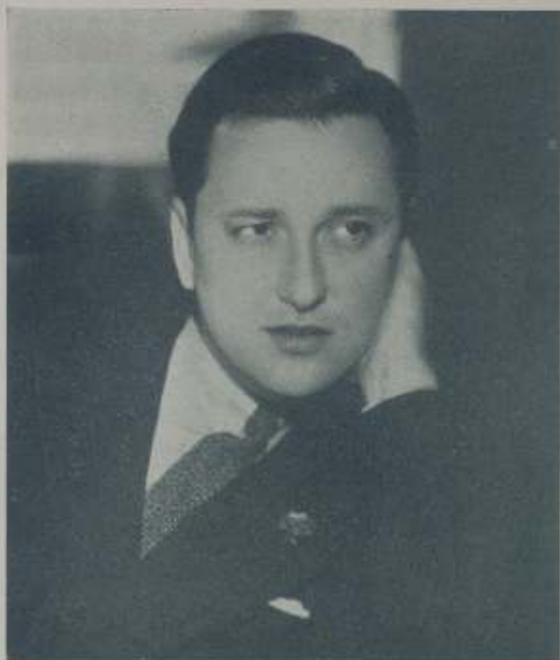
RAOUL ROULIEN, artista de la Fox cuyas actuaciones se ven coronadas por el éxito

La música por él compuesta y cantada llegó a hacerse tan popular que le proporcionó pingües beneficios asegurándonos que "Adiós mis farras" una de sus composiciones más nota-