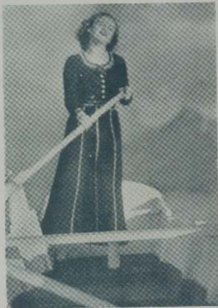
SIMONE SIMON, exquisita actriz francesa que en "El lago de las damas" de Filmofono realiza una labor meritoria.

Menuda, vivaracha, admirable en la primavera de su vida, sencillamente ingenia, Simone Simon ha hecho una verdadera revolución en el papel que le confiara Marc Allégret en "El lago de las damas".