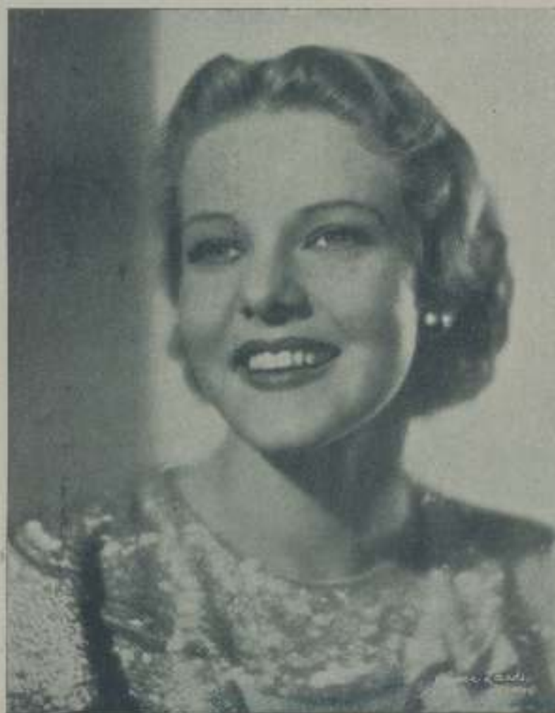
ELISSA LANDI, la gran actriz y protagonista de "La mujer de mi marido" de la Cifesa

Elissa Landi con su doble personalidad artística, está llamada a ser una de las figuras de mayor relieve de Hollywood. Sus expresiones, justas el timbre de su voz, la forma en que se penetra con los personajes que plasma le hicieron recorrer con rapidez el camino de la fama, convirtiéndola en estrella de primera magnitud. Que no se equivocaron los que pusieron fe en ella, lo demuestran sus actuaciones que culminan en la obra de la Columbia "La mujer de mi marido".