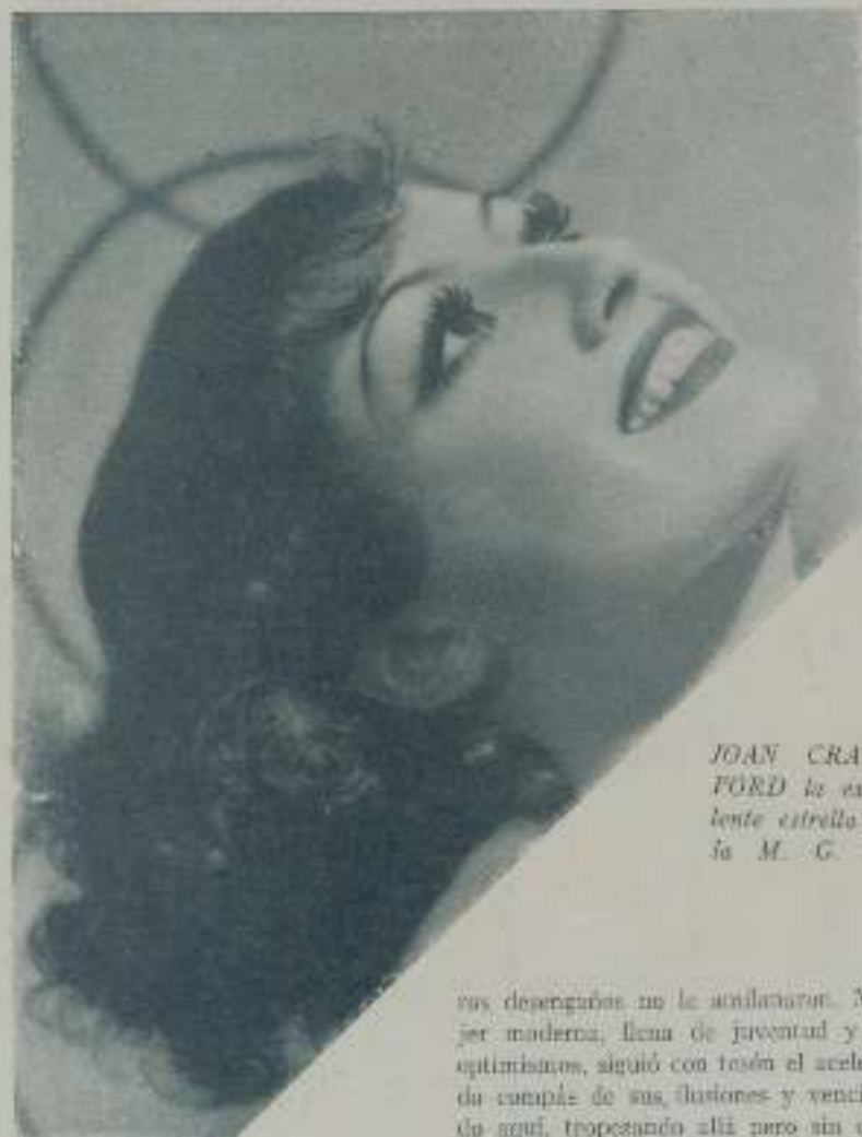
JOAN CRAWFORD la excelente estrella de la M. G. M.

Pocas mujeres han vivido con la intensidad que Joan Crawford y pocas mujeres también han sufrido tan grandes contradicciones. Pero el temple incomparable de esa mujer que ha nacido para la lucha, es tan flexible, que ha sabido vibrar sin romperse cuando vientos contrarios la azotaron en el camino de la vida.