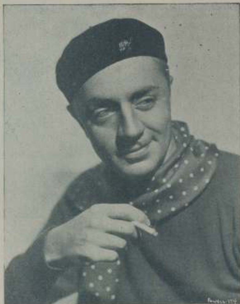
WILLIAM POWELL, el hombre malo que ha vestido nuevamente su personalidad para la Warner Bros

A William Powell le llaman Bill sus íntimos amigos y "Junior" aquellos que están íntimamente ligados a él. Tiene una frente ancha, despejada, de hombre inteligente, y una cicatriz en la punta de su nariz larga y afilada. Es acróata; lleva tacones de goma; le gusta dormir al aire libre; bebe mucha agua; lee los periódicos mientras desayuna y se rasura él mismo.