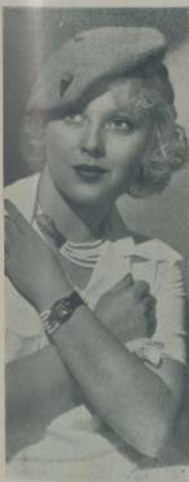
Mujer de casaca helena MARY CARLISLE recibe cada día centenares de cartas de sus admiradores

En casa ya buscamos en nuestro archivo una de sus más preciosas fotografías. La linda sibeta tomó cuerpo en nuestra mente y volvió a nosotros, no con aquella sonrisa afectada de sus días de extra, sino con la contracción de labios propios de los triunfadores.