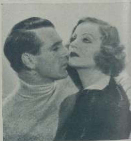
TALLULAH BANKHEAD y GARY COOPER, en una escena de "Entre la espada y la rueda" de la Paramount.

No se crea que utilísimo compendio sea muy conocido; al contrario, es casi desconocido, por lo menos