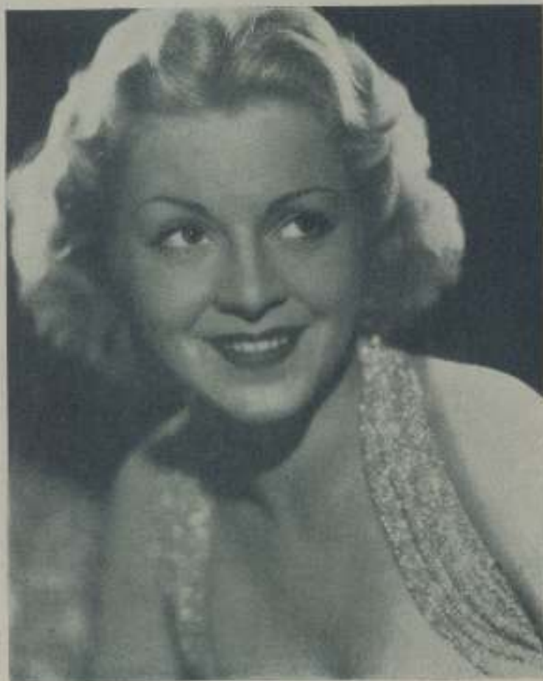
CLAIRE TREVOR bellísima actriz de la Fox, protagonista femenina de "Amor y cuartillos"

El elenco artístico de la Fox, cada vez más nutrido, va llenándose de caras bonitas y atractivas, de criaturas primaverales que aspiran a llegar a la cumbre de la fama. Podríamos decir sin faltar a la verdad, que es la casa editora nombrada la que más cuidado pone en la selección de artistas que más tarde ha de encontrar por méritos propios a la categoría estelar a que aspiran todas las aficionadas y de esa selección salen todos los años actores completos cuyos nombres van a quedar grabados en la memoria de sus admiradores.