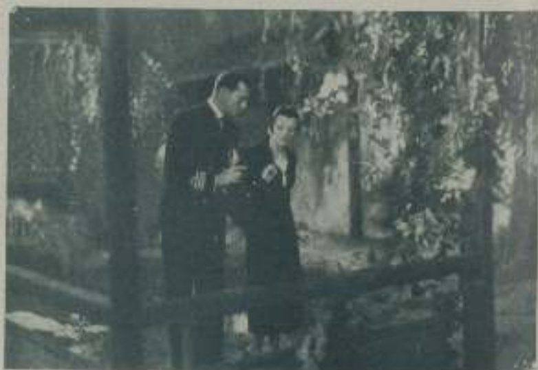
ANNABELLA y JOHN LODER en una escena de "La Batalla" que distribuye D. A. S. A.

victoria del 10 de Agosto, cuando la multitud desbordante de entusiasmo es para la llegada de la flota, se termina después de la batalla de Tshanshina, en la misma rada, en medio de igual entusiasmo. Alrededor de estos grandes rasgos, nos deleita con bonitas escenas, graciosos decorados; pero el film