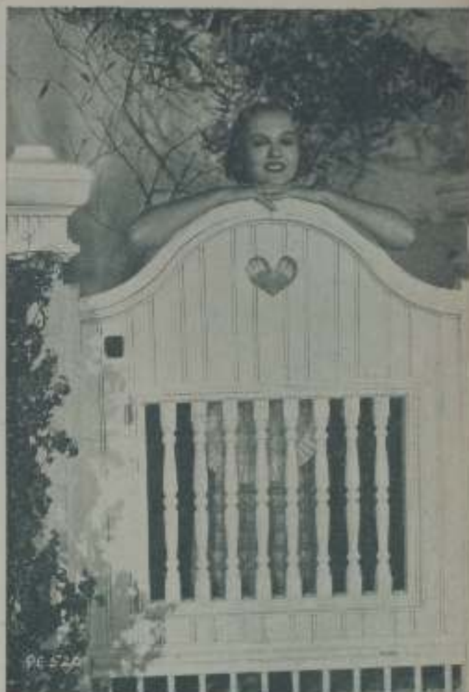
¿Quién diría que tras la expresión bondadosa de PATRICIA ELLIS, se oculta una alma llena de rebeldía?

Hace poco menos de un año la Warner Bros-First National nos presentó este rostro nuevo lleno de gracia y gentileza y hoy ya nos la ofrece como actriz madura y consumada en la gran producción "El Mundo cambia" cinta de honda intensidad dramática en la que Pat pueda demostrar lo que es su arte actual y demostrar lo que es su arte actual y dejarnos vislum-