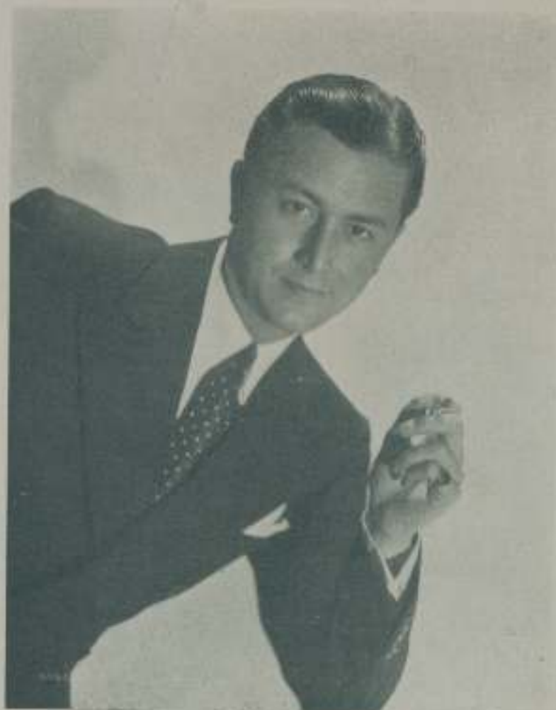
FRANCHOT TONE que con Joan Crawford interpretan "Así amo la mujer" de M. G. M., cuyos nombres han corrido unidos por el mundo entero

TODO CUANTO SUCEDE EN HOLLYWOOD DE SENSACIONAL PODRA USTED SABERLO EN DETALLE ADQUIRIENDO "EL CINE" QUE ES EL DE MAS COMPLETA Y VERAZ INFORMACION