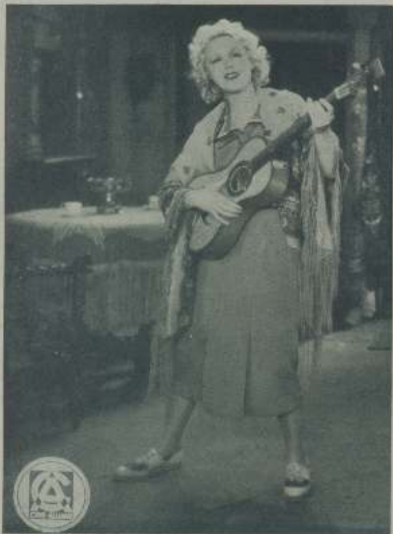
ANNY ONDRA, protagonista de "La viñeta de los cuentos de Hoffman" de Ufilm

Desconocida nos pareció la gentil estrella alemana cuando, con motivo del combate de su esposo Schmeling con nuestro Uscodan, llegó a Barcelona. La pispireta criatura que en las películas cinematográficas salta como cabellera loca adoptando las más cómicas posiciones, se nos había convertido en mujercita juiciosa de cara picaresca y traviesa y ojos claros e ingenuos que nos miraban con cierta curiosidad al advertir nuestra admiración. De su rostro, había huido la candidez de sus manifestaciones cinematográficas; su