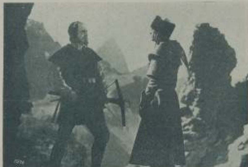
Una escena de "Guillermo Tell" de Selecciones Filmófono