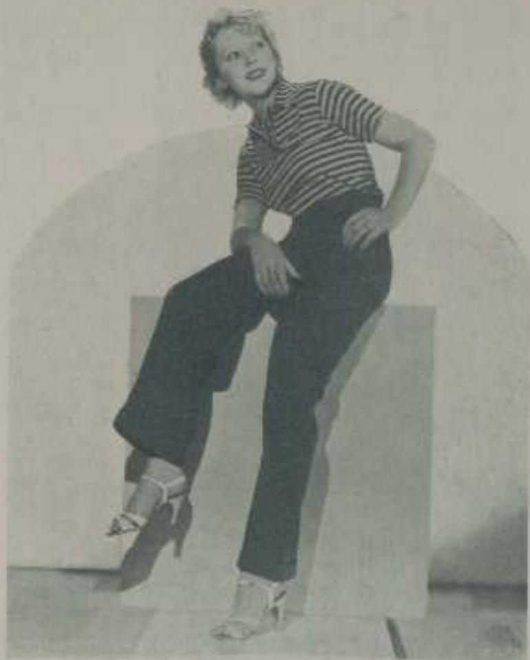
IDA LUPINO, la traviesa actriz de la Paramount que cada día se afirma más en el público cinematográfico

bezas... aunque sean las de palabras cruzadas... que tan de moda están en la actualidad... le contraría mucho... no olvidarse de una palabra que sea de los papeles que representa... pertenece a una familia que figura con brillo en el teatro... desde hace dos siglos... se pinta los labios... y cambia con frecuencia el color del esmalte que emplea para ellos... le parece que el guardespaldas de George Raft es la persona más rara que ha conocido... su bebida favorita es la sangría... le encanta hacer crachet... empezó a aprender declamación cuando apenas tenía siete años... con su propio padre... Stanley Lupino... famoso actor