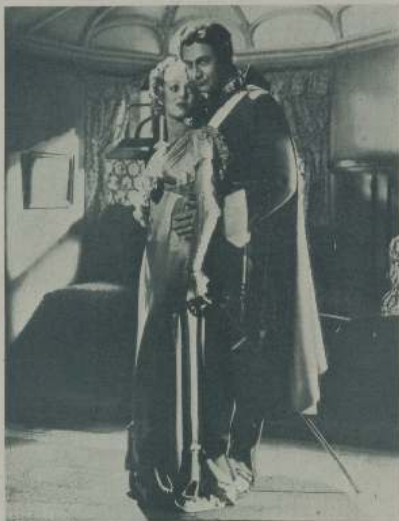
LORETTA YOUNG y ROBERT YOUNG, protagonistas de la película de Artistas Asociados "La casa de Rothschild"

Si bien el nombre de Rothschild es uno de los más famosos en el mundo mercantil y bancario, pocos son los que conocen su curioso origen hasta que se estrenó hace poco en Nueva York la película 20th Century "The House of Rothschild" distribuida nuevamente por la United Artists. Al departamento de investigaciones del estudio se debe haber sacado a la luz que Rothschild significaba "escudo rojo".