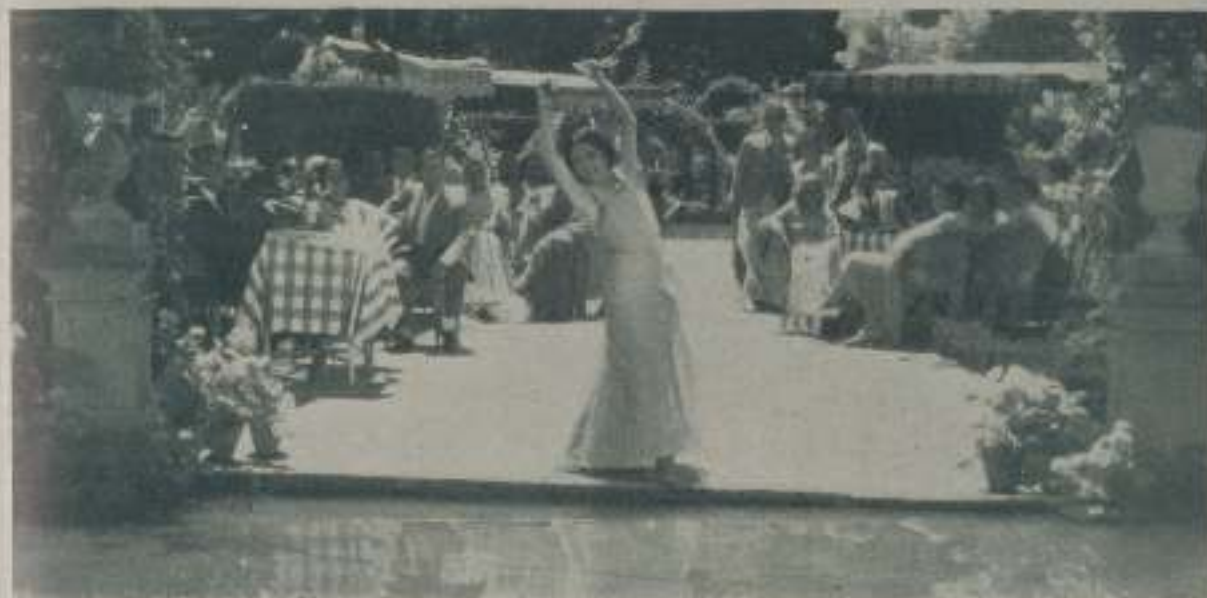
CELEBRIO ARGENTINA luciendo con la gracia característica en ella, las excelencias de su arte, en una escena de "La hermana de San Sulpicio" que dirige el Cifra

Peliculas verdaderamente grandes no hay ni deudo por todos los dias. Llegan hasta nosotros de cuando en cuando una verdadera maravilla y los ojos del público, habiéndose quietos de lo mucho mediocre que en materia cinematográfica pasa por su retina, no acierta a moverse, llevándolo al pensamiento, las grandezas de esa producción durante una esperada.