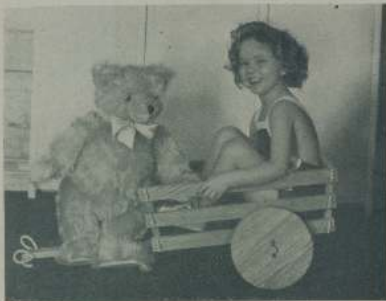
SHIRLEY TEMPLE la muñequita descubierta por la Fox que se ha revelado como genial artista

Hará visto que llegar a ser estrella cinematográfica está lleno de inconvenientes nada fáciles de resolver. El poder escalar los escalones de la fama es ya cosa, difícilísima que no logran salvar sino unos cuantos privilegiados y que una vez salvados están llenos de inconvenientes que son motivo de grandes preocupaciones que apenas si les dejan en paz los que de una manera indirecta, contribuyeron a prestarles auxilio.