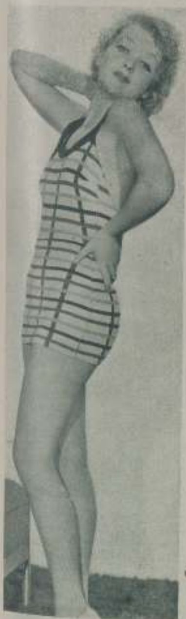
IDA LUPINO cuya espiñada belleza no necesita comentario