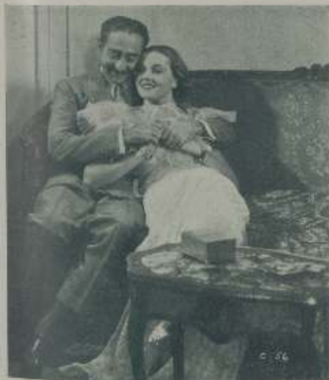
PATRICIA ELLIS y ADOLPHE MENJOU en una escena de "¿Qué semana?" de la Paramount

brar maravillosas promesas para un futuro no muy lejano.