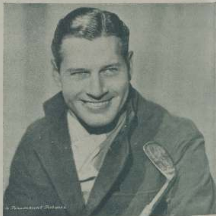
RICHARD ARLEN que acaba de apostar con Bing Crosby una serie cuantiosa por cosa de la radio