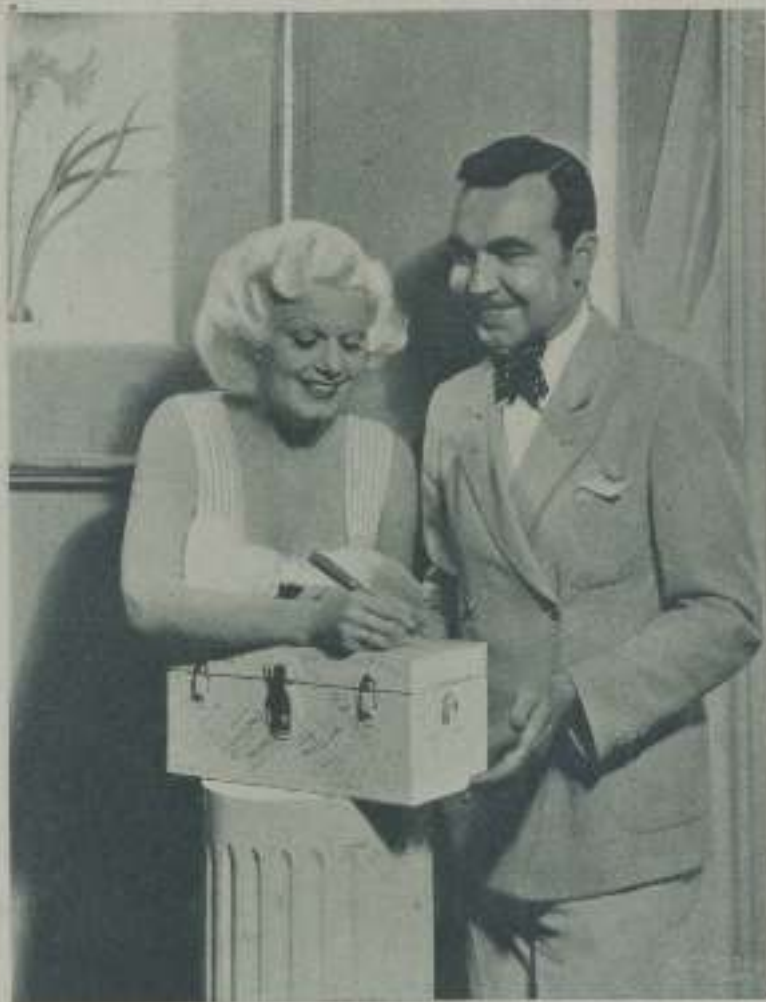
JEAN HARLOW firmando en una caja en que un cinéasta ha recogido autógrafos de las estrellas más famosas

Poco después la vi de nuevo. Hallábase firmando en una gran caja que un admirador de las estrellas había hecho firmar a cada una de ellas y Jean Harlow complacientemente, sonriendo con satisfacción, estampó su firma al requerimiento del caballero. Una vez más había complacido a un admirador y como a él desearía hacerlo con todos, según nos ha dicho con sinceridad manifiesta.