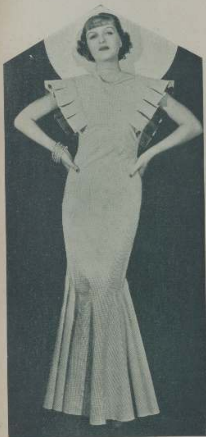
PATRICIA ELLIS, actriz de la Warner Bros, cuya belleza serena le ha producido grandes triunfos

Patricia Ellis es aún una niña, pero una niña rebelde que se ha impuesto a las gentes mayores por sola su fuerza de voluntad.