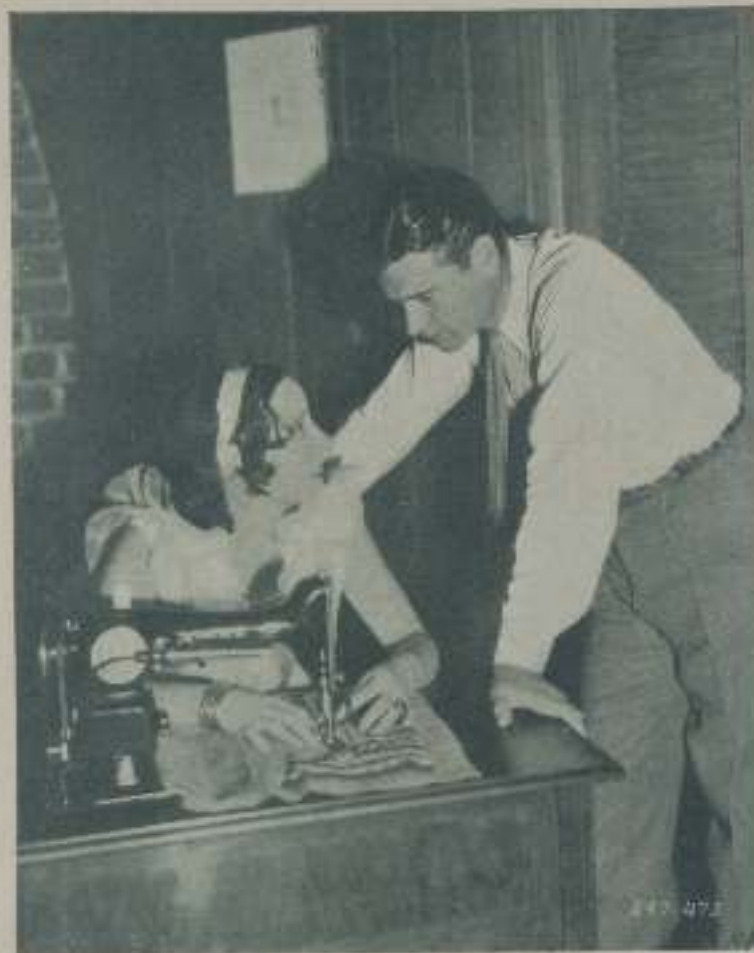
RICHARD ARLEN y JOBYNA RALSTON envidiosos actores de la Paramount

Bing Crosby y Richard Arlen son ambos actores de la Paramount, actúan en Toluca, lugar cercano a Hollywood, sendas casas que quedan casi vecinas; están unidos por cordial amistad. Y esto no obstante, han concertado un desafío en el cual, aunque no ha de correr la sangre, pondrá cada uno de los contendientes cuantos medios halla a su alcance para lograr que el otro abandone el campo en completa derrota... y con mil dólares de menos.