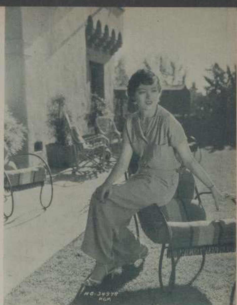
MYRNA LOY la gran actriz de la Metro cuya exótica belleza ha causado tan profunda admiración entre la oficina cinematográfica

—No puedo contemplar a estos viejos amigos de mi jardín sin detenerme a pensar en el amor. Ahí está usted, la yedra adherida al olmo