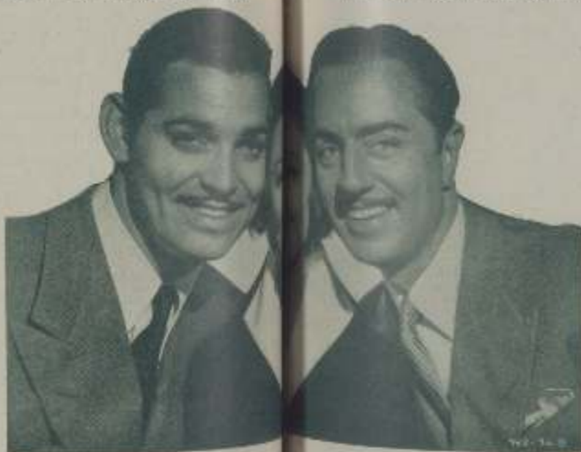
CLARK GABLE, MYRNA LOY y PENELOPE WOOD, protagonistas de "The Sign of the Cross"

Dichosa ella que puede hacerlo, pero que no se olvide de las travestidas del corazón que pueden convertirla en yedra cariñosa abrazando de por vida al olmo.