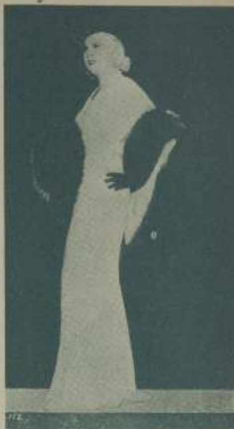
MAE WEST la incomparable estrella de la Paramount

— Estove a punto de desmayarme al sentir entre mis brazos el cuerpo admirable de una mujer tan dispuesta. El perfume de su carne, la sonrisa de sus ojos cargados, cuando ella quiere, de maliciosas picardías, la sensación voluptuosa de saber que la estaba abrazando produjo en mí sensaciones tan extrañas que al notarlas ella me dijo no sin malicia: