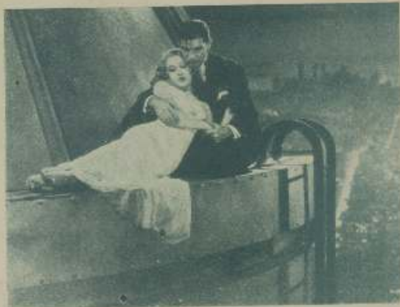
FAY WRAY y BRUCE CABOT en una escena de "King-Kong"