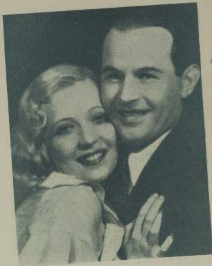
JEAN KIEPURA y MARTA EGGERTH

Cuando se tienen ansias de triunfo, cuando la vida dota a los audaces de fortaleza y corazón, el triunfo no puede dejar de serles propio. Así es la película, un hombre enamorado con dotes especiales para el triunfo con