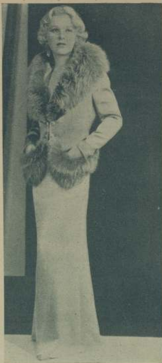
GLEND FARRELL en una escena de "Las viudas habaneras" que presentará esta temporada la Warner Bros.

Y Bette Davis, la espiritual y aristocrática Bette, se viste un pelo de