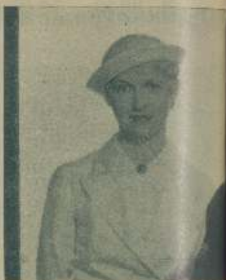
NORMA SHEARER y DOLORES DEL RÍO fueron clasificadas como tres de las

Y ya que viene a cuento, permítame decir que Norma Shearer ha sido