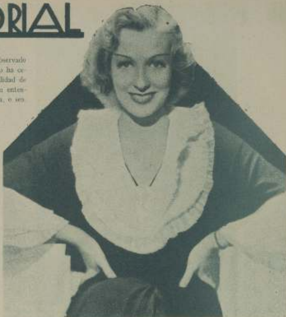
GERTRUDE MICHAEL una de las nuevas actrices de la Paramount que vemos destacar por sus muchos méritos

Los pesimistas habrán observado que la inquietud productora no ha cesado en España. Y que la calidad de los films (calidad técnica, bien entendido) es cada vez más discreta, o sea más perfecta.