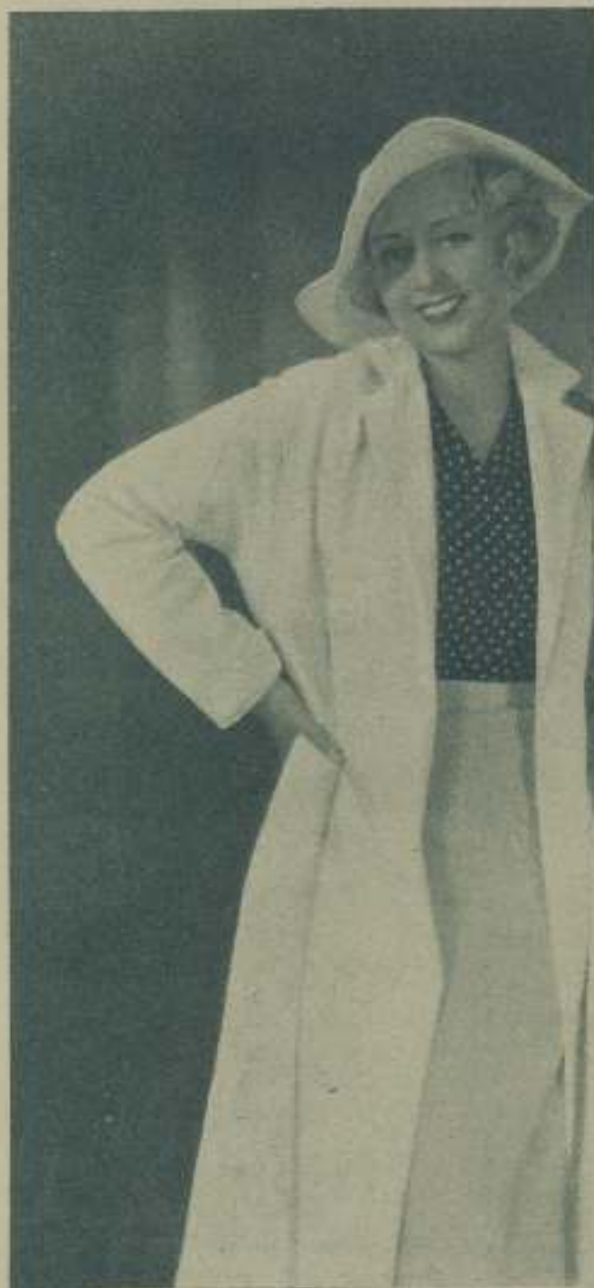
JOAN BLONDELL artista de la Warner protagonista de "Caprichos"

¿En qué emplean el tiempo las estrellas del cinema cuando, libres ya de todo trabajo y de toda vigilancia de afuera pueden quedarse en casa y hacer lo que en lenguaje vulgar se llama la real gana?