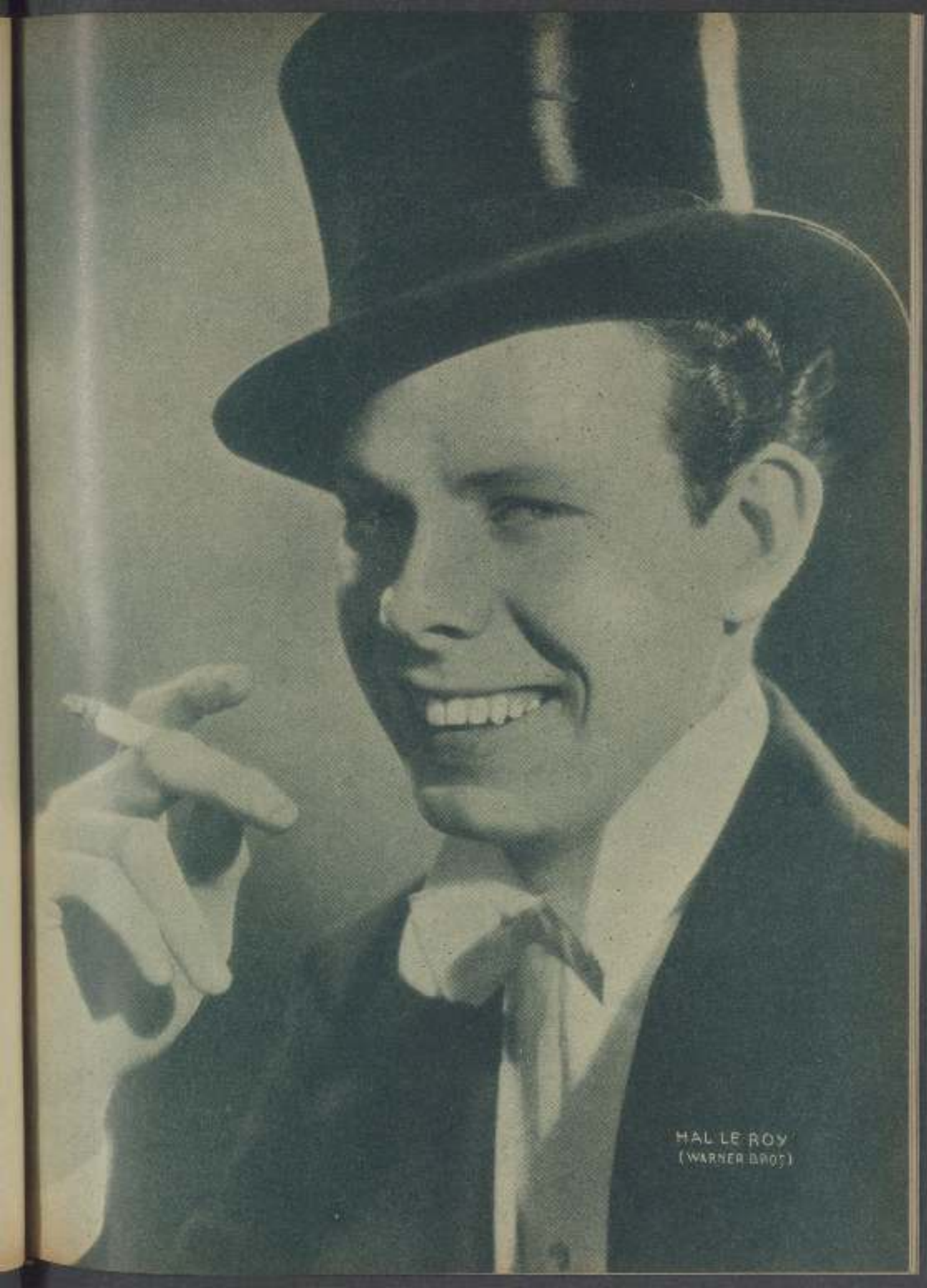
HAL LE ROY (WARNER BROS.)