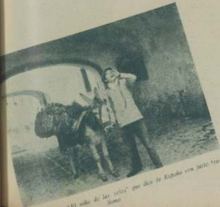
En "El niño de las coles" que dice se Estaba con justo ten- llamo

el maestro Ballester, reúne esas cuali- dades que requiere toda obra realizada con miras al gran público y se ha construido contando con los elemen- tos que actualmente poseemos que ni bien son suficientes para editar con sencillez no reúnen la perfección ne- cesaria ni son tan cuantiosos como para realizar superproducciones.