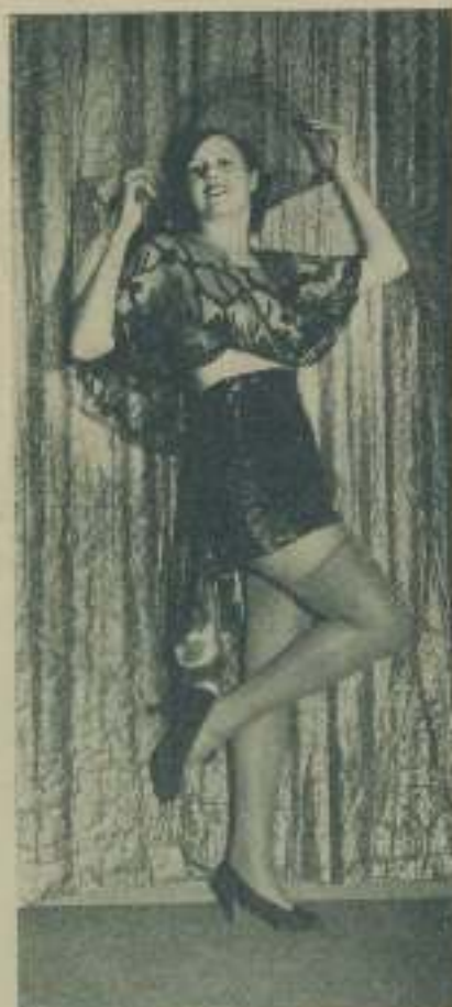
En "desfile de canchales" le halla de las cytatas de conjunto es uno de sus principales atractivos

Curiosidad romántica — Barcelona. — No le extrañe no haber recibido con