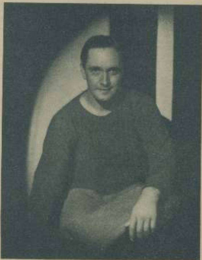
FREDERIC MARCH, actor que ha despertado gran admiración entre las mujeres desde su actuación en "El hombre y el monstruo"

Y no es que nosotras prefiramos que se olviden de nuestra existencia, no; lo que queremos es que no vean condescendientemente a la mujer con sus ojos de hombres, que nos consideren como los héroes cinematográficos lo hacen con sus compañeras, que no vean auto-