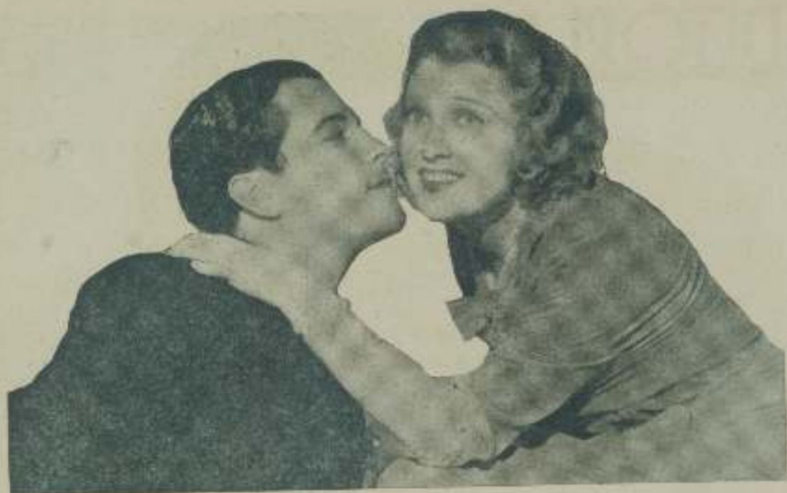
JEANETTE MAC DONALD y RAMON NOVARRO en "El gato y el violín" de la M. G. M.