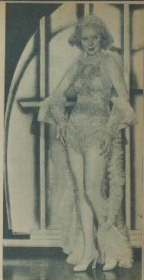
Una maravillosa extra que adorna con su belleza a "Desfile de candilejas" de la Warner