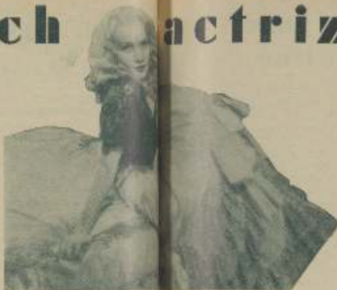
MARLENE DIETRICH en un momento de la Paramount

Nosotros hemos opinado siempre que la belleza no es necesaria cuando se es verdaderamente artista, pero sería necio dejar de reconocer que el atractivo de una gran artista se acrecentará siempre que posea a la par