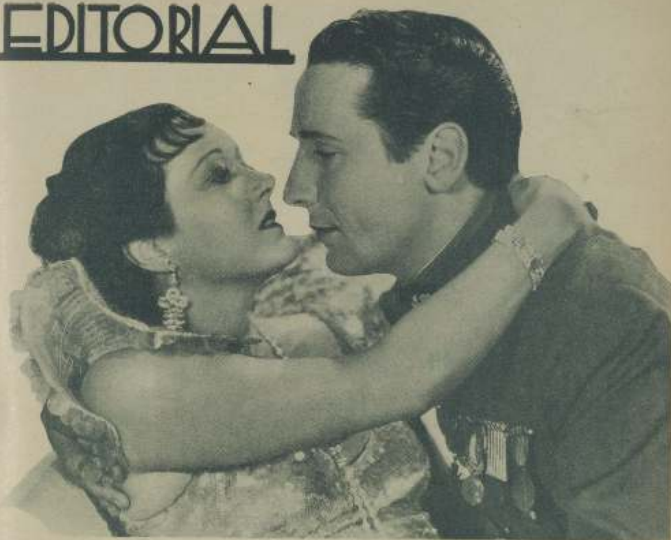
Una escena de "El diablo se divierte" de la Fox, en que VICTOR JORY consigue un nuevo éxito

El cine amateur va cimentándose de día en día. Un considerable grupo de entusiastas aficionados, poniendo a contribución esfuerzo y aficiones van recogiendo en las diminutas cámaras bellos rincones de nuestra patria, rincones olvidados por una acción de la que se halla exenta la comercialidad pero que, en cambio, se sitúa dentro de los dominios del arte.