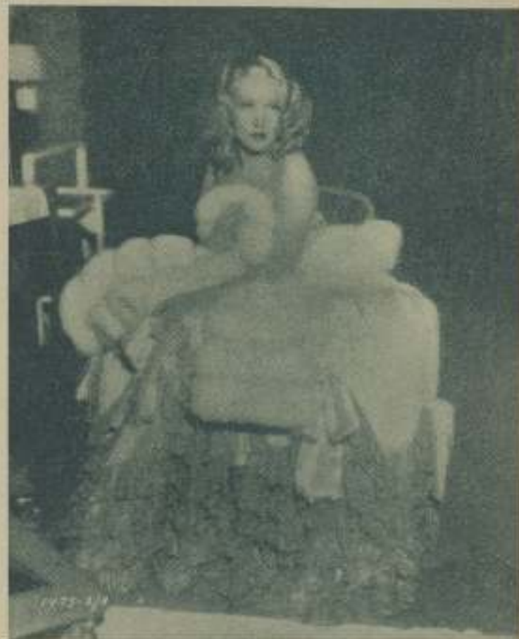
Con su sonrisa entre la hija y su compañera MARLENE DIETRICH expresa maravillosamente los estados de su espíritu

Actualmente acaba de interpretar el difícilísimo papel de la reina Catalina de Rusia, en "Capriccio Imperial" para la Paramount. Una vez más Von Sternberg, ha hecho todo lo posible porque la figura de la gran artista adquiriera todo su relieve, dándole cuantas oportunidades ha creído necesarias para que su actuación contenga