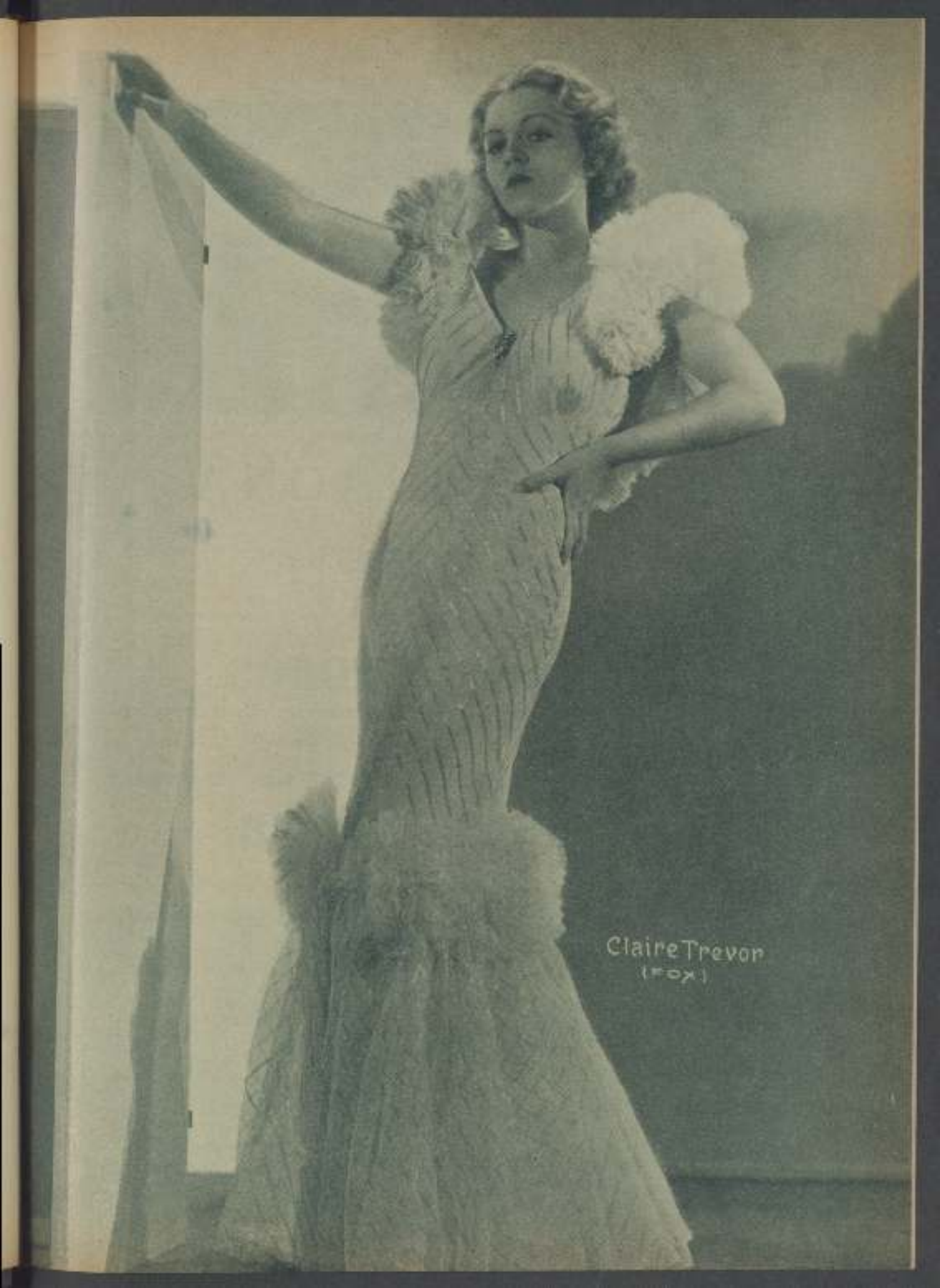
Claire Trevor