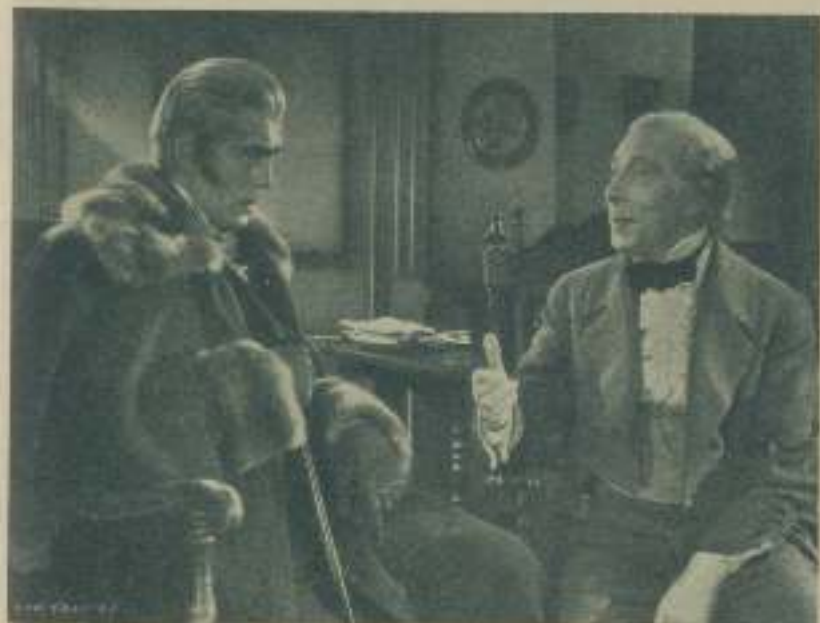
BORIS KARLOFF en una escena de la película "Rothschild", de Artistas Unidos.

Dorothy Jordan regresará a la pantalla en "Casa de muñeca". Este será su primer film después de haber sido madre.