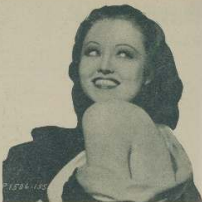
LONA ANDRE y su hechicera sonrisa

Cuando aun no hacía dos meses que estaba en Hollywood, fué elegida entre las quince Wampus Baby Stars de 1932 y no hace mucho le fué concedido uno