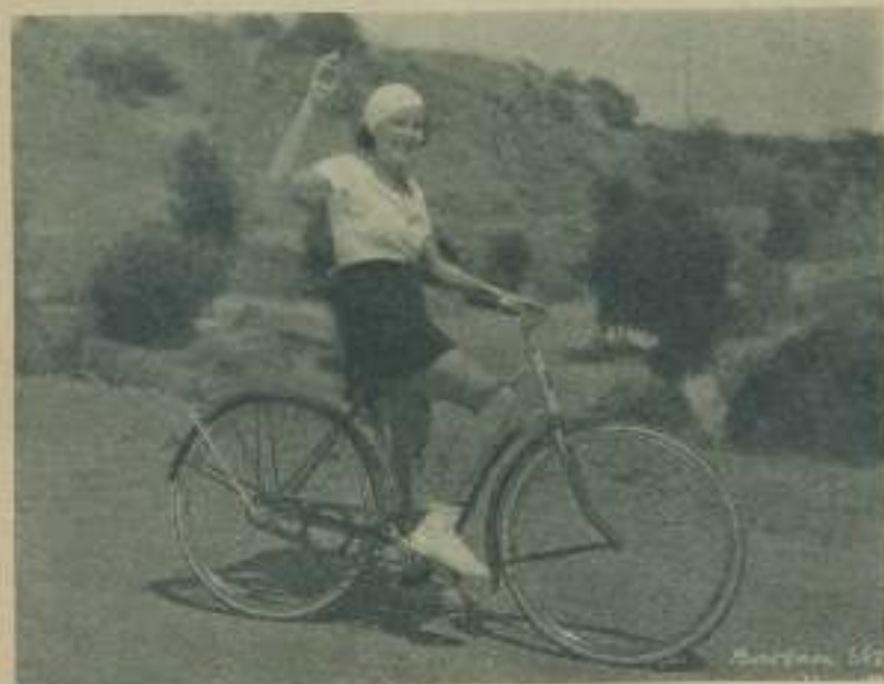
MARIE GLORY, gentil actriz francesa que ha alcanzado grandes éxitos en "Carlomagno"

G. P. F. A. (Antigua casa Goument) va a fusionarse con la Thomson-Houston (controlada por R. C. A.)