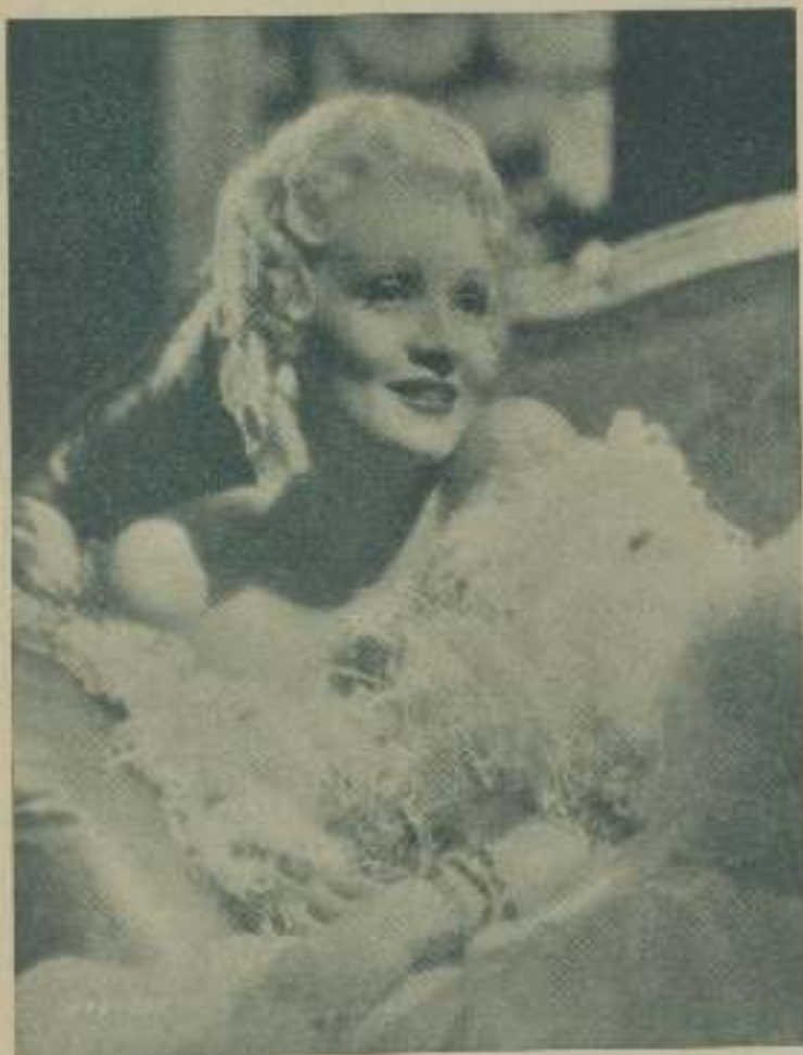
"Capriccio Imperial" última de las películas interpretadas por MARLENE DIETRICH que hace gala una vez más de su talento artístico

Así es Marlene Dietrich. A pesar de su reconocido prestigio, es una mujer de una modestia incomparable. Se debe a su público y por su parte, busca todos los motivos para satisfacerle ya que sabe que a nadie más que a él se debe consagrar una artista.