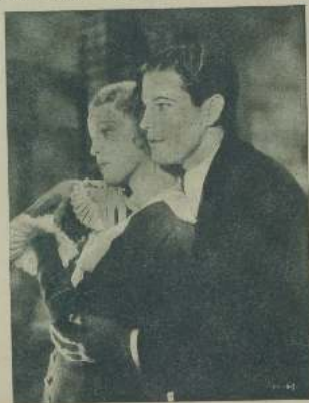
Una escena de "El gato y el violín" interpretada por JEANETTE MAC DONALD y RAMON NOVARRO

Este gasto, realizado una sola vez, puede amortizarse fácilmente, teniendo en cuenta la extensión que abarca el mercado cinematográfico, con imposible con los medios teatrales de que hoy se dispone.