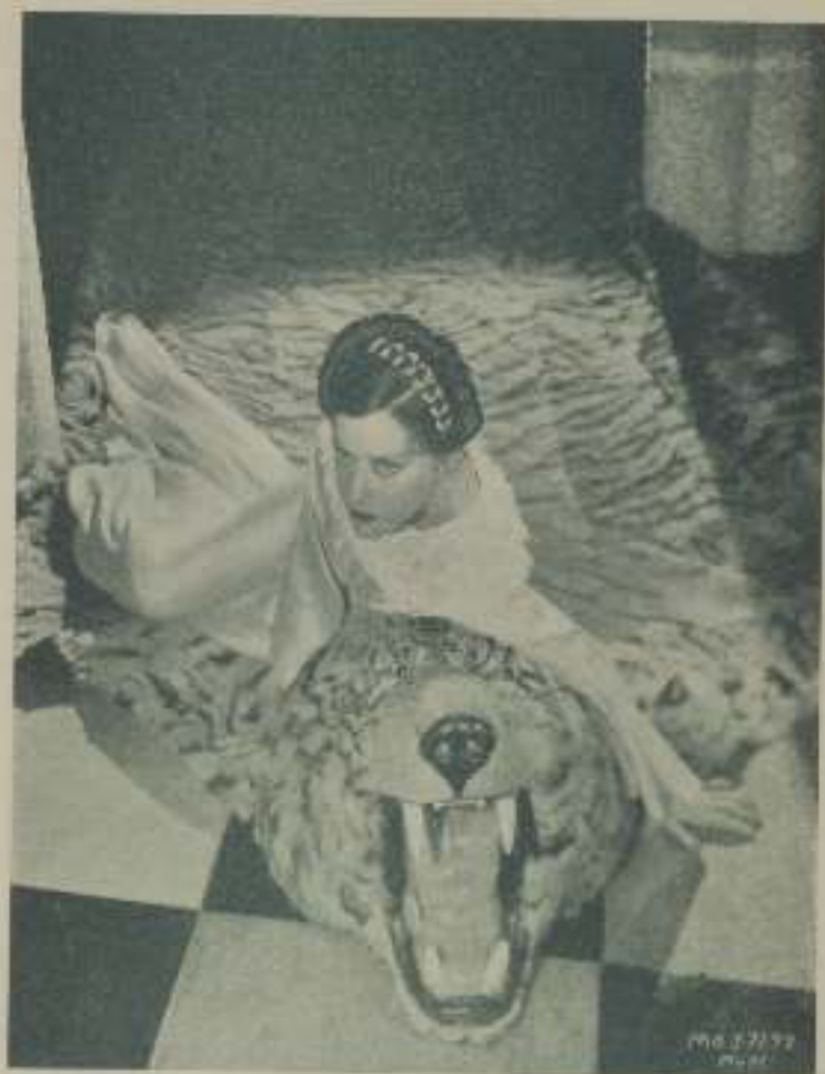
GLORIA SWANSON una de las figuras más destacadas de el cine mudo, cuya personalidad artística se conserva aun en todo su apogeo

Un cabello lacio, indómito al peine, sabéis todas que puede dominarse con la indolencia permanente. El cabello debe cuidarse con esmero porque es el principal adorno del rostro puesto que contribuye a darle expresión y belleza. Los labios pálidos y sobre todo en los cutis blancos, produce impresión de anemia; sonreírlos levemente, procurando que no desentonen de la nieve blanca del cutis excesivamente rojos calman también mal efecto. Debéis procurar que los dientes se hallen siempre limpios, blancos y evitar ante todo que vuestros mejillas aparezcan lívidas. La grasosidad en la epidermis, requiere un tratamiento especial pero que produce maravillosos efectos. Frotados con celulosa todos los días y después báccos un masaje facial con una crema de reconocida eficacia y veréis como en poco tiempo habrá desaparecido la grasa de vuestra epidermis.