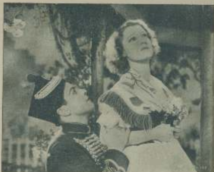
Una interesantísima escena de la película de M. G. M. "El gato y el violín"

No obstante, América no cede y se prepara continuamente para la batalla. La Metro Goldwyn echando mano de