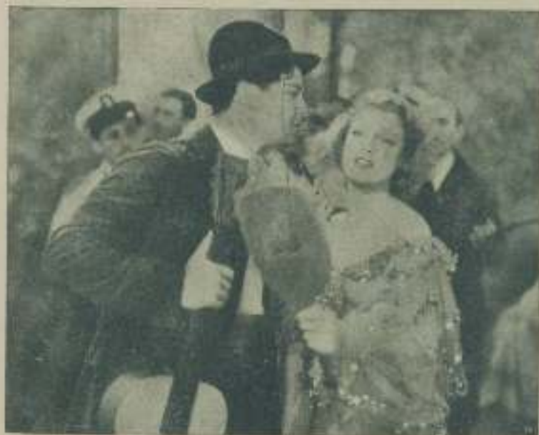
Momento culminante de la producción M. G. M. "El gato y el violín" interpretada por JEANETTE MAC DONALD y RAMON NOVARRO

Las comedias musicales se imponen. La presente temporada nos ha demostrado que son del agrado del público y la que viene acabará por decirnos que nuestras sospechas no son equivocadas.