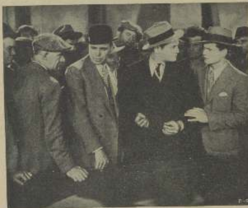
Una escena de "Tirando a dar", donde RICHARD DIX consigue un nuevo triunfo con su acertada interpretación.

Doña Mito. — Barcelona. — Así me gusta pergamina que hayas quedado satisfecha con mi respuesta. Esta vez no voy a ser tan afortunado, aunque te advierto que si me indicas de qué casa es la película a que te referes te diré el nombre del galán que deseas.