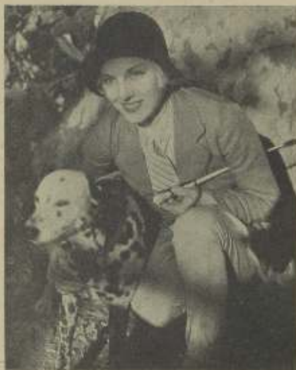
LEILA HYAMS y su perro favorito en uno de sus papeos matinales.

¡Dietrich! En la pantalla demuestra ser una mujer de mucho mundo y lo es en efecto en la vida real.