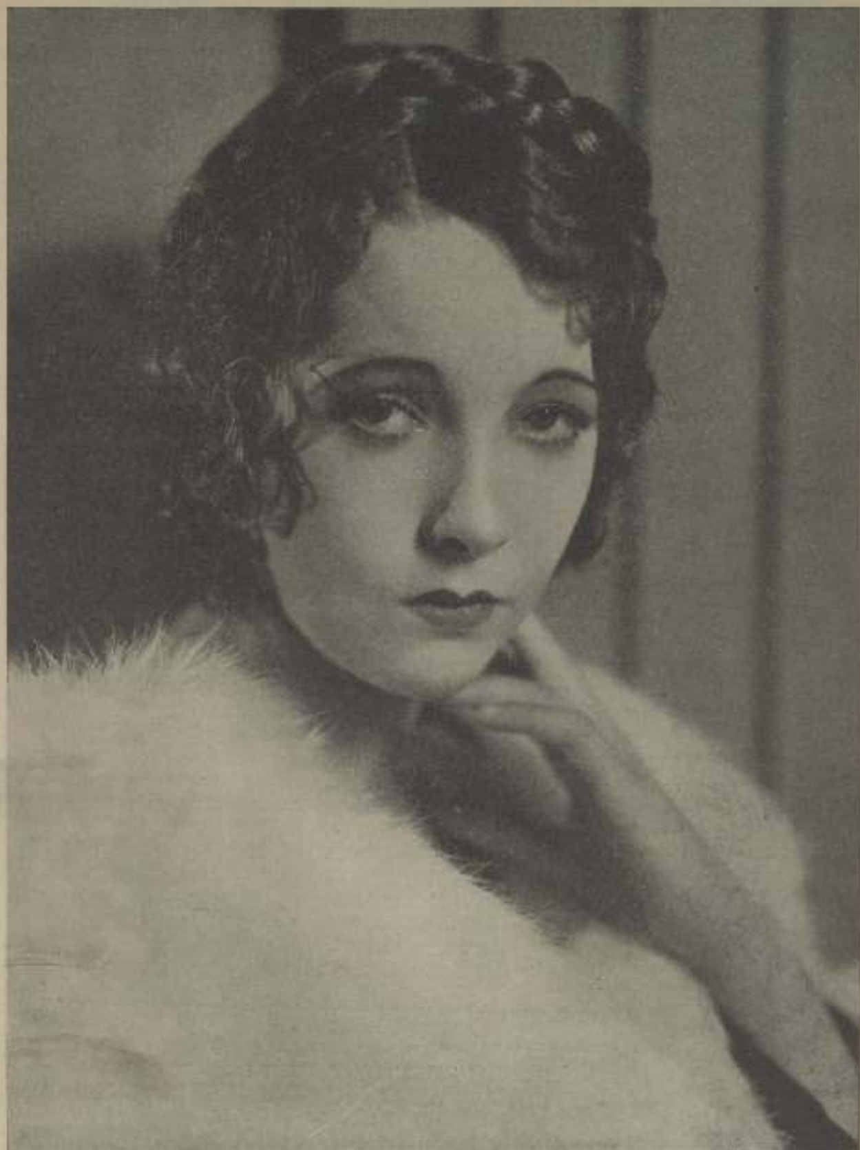
HELEN TWELVETREES, una de las más famosas "estrellas" del cinema americano, que muy pronto veremos en las pantallas españolas en su maravillosa creación "Su hombre" de R. K. O-PATHE.