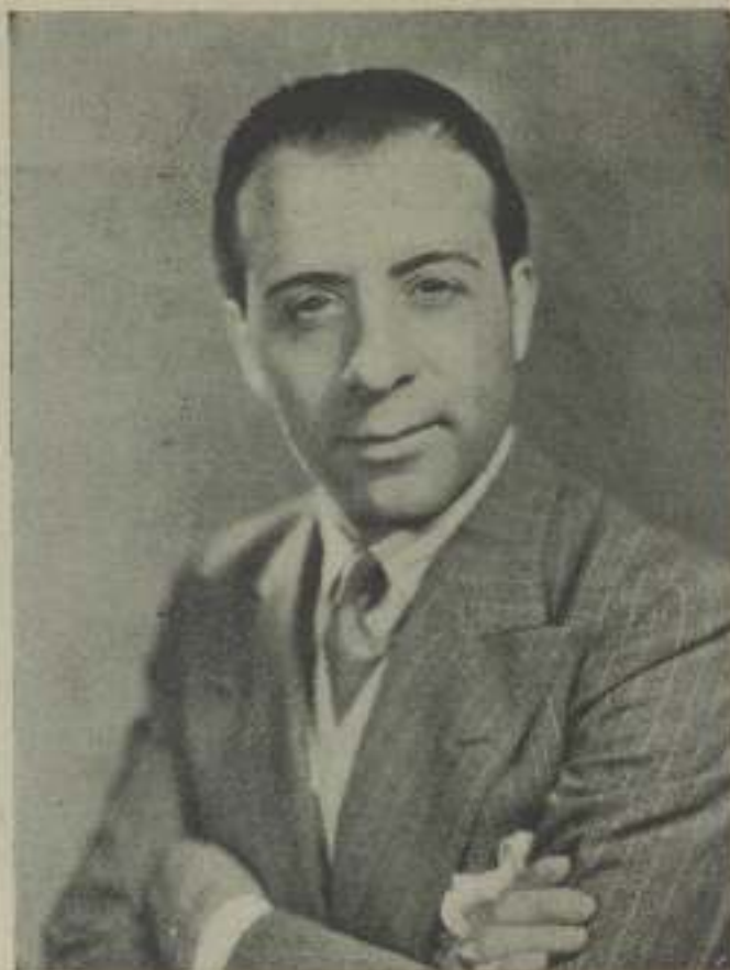
MIGUEL LIGERO, uno de los prestigios de la escena española

La persona en cuestión no es otra sino el propio Miguel Ligeró a quien todos conocemos poco o mucho por haberlo visto en el cine trabajando en las tablas españolas. Miguel es netamente madrileño, ya que nació en el corazón de Carabanchel el 21 de octubre de 1888, y en 1905 debutó en el teatro. Se dedicó al vodevillo, a la comedia ligera, interpretando siempre papeles de gracioso o de chulo en los que nadie alcanzaba a superarlo, por la incomparable vis cómica que en ellos ponía .