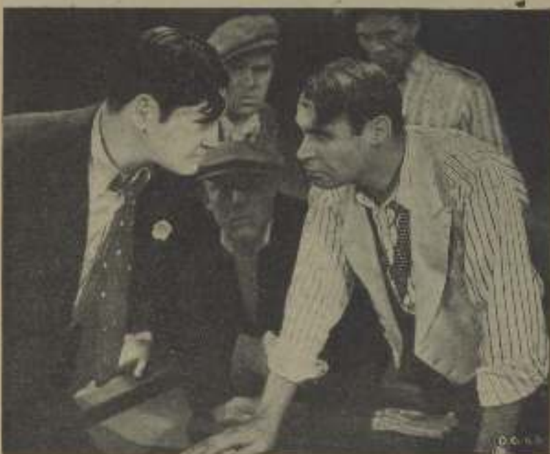
RICHARD DIX, en la intimidad le maso Pete en una escena de la película "Travels with Almy"

Kay Francis y Kay Johnson fueron bautizadas Katherine, pero cuando se