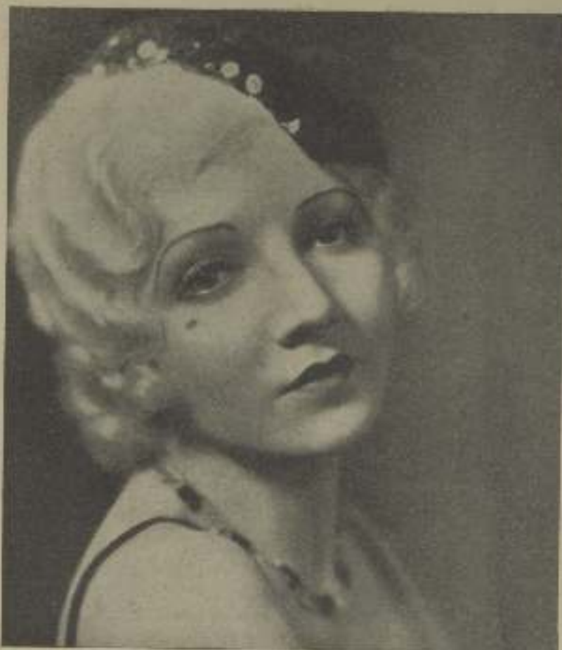
CLAUDETTE COLBERT, estrella de la Paramount, que usa a su belleza el atractivo de su inteligencia

"Todo esto me recuerda a cierta muchacha que el público y yo conocemos. La joven en cuestión es sumamente bella, simpática, generosa, modesta, llena de juventud y le entusiasman las