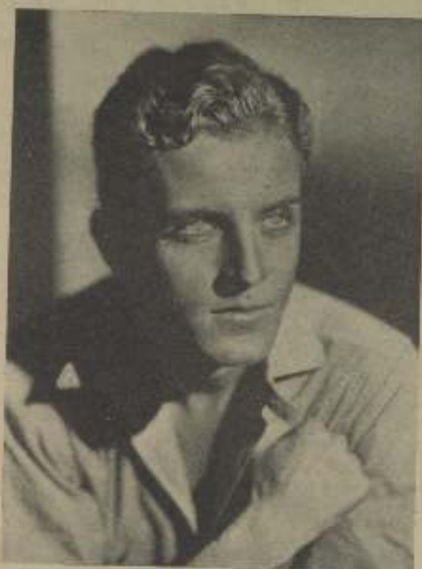
PHILLIPS HOLMES el nuevo galán de la Paramount que aunque no está decidido a casarse confiesa que no le disgusta Sylvia Sydney

"No, Sylvia no es mi novia. Me gusta mucho, pero no tengo intención de casarme hasta dentro de cinco o seis años, aunque he de confesar que la dicha de June Collyer y Stu Erwin me dan horribles tentaciones de declararme a Sylvia o de raptarla. Lo que me sucede es que me gustan otras muchachas casi tanto como ella. Frances Dee, por ejemplo, que es tan encantadora como simpática, pero que no me pone atención por preocuparse demasiado de Howard Hughes, el millonario que estuvo (según se dice) prometido con Billie Dove. Billie también me encanta, pero solo soy un niño para ella. La gentil Carmen Barnés, me entusiasma como mujer, como autora, y como persona competente y generosa. Tiene un carácter encantador y es de una franqueza única. Clara Bow también me gustaba en extremo, pero nunca se lo dí a entender porque Rex Bell, es uno de mis mejores amigos y es muy probable que se casen algún día. Hollywood, la más generosa, culta y elegante.