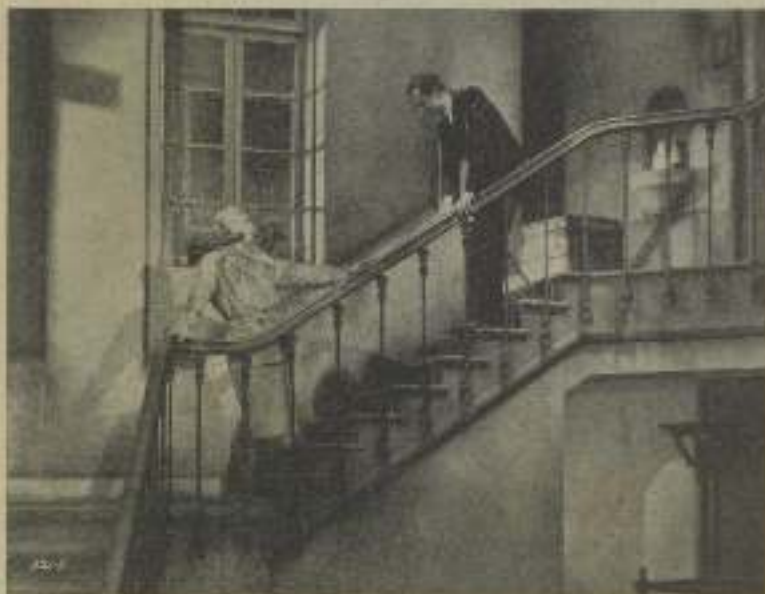
GRETA GARBO y ROBERT MONTGOMERY en una escena de "Inspiración"

¿Cuál es el colmo de un fresco? Aprovecharse "En nombre de la amistad".