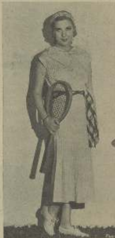
LILYAN TASHMAN, esposa de Edmund Lowe, una de las mujeres más elegantes de Hollywood