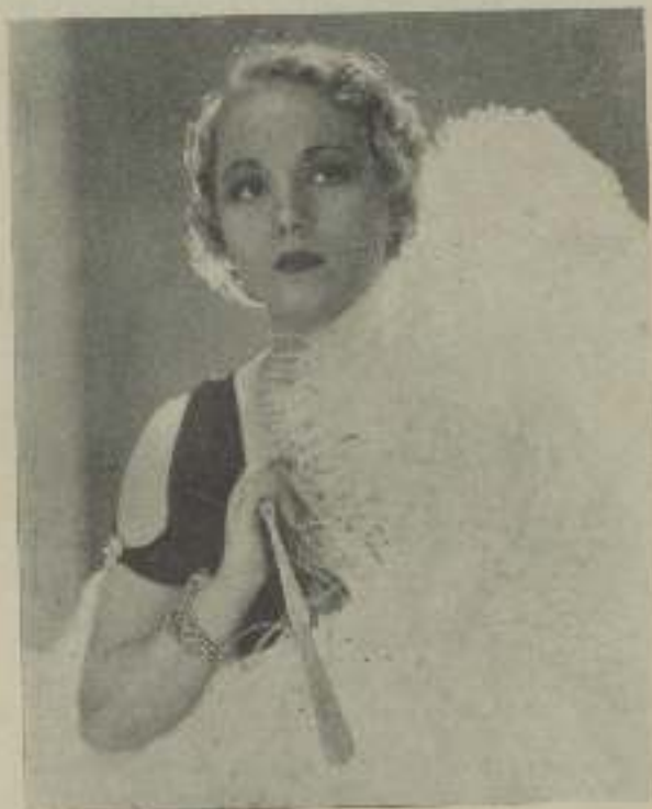
Quisimos el abusaco de LEILA HYAMS que nos oculta su cuerpo de Dios