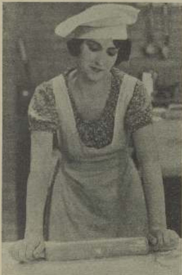
ENRIQUETA SOLER, gentilísima artista española, que en los estudios de Hollywood está causando sensación.

§ José Bohr se encuentra en Méjico cosechando aplausos en los teatros donde se presenta.