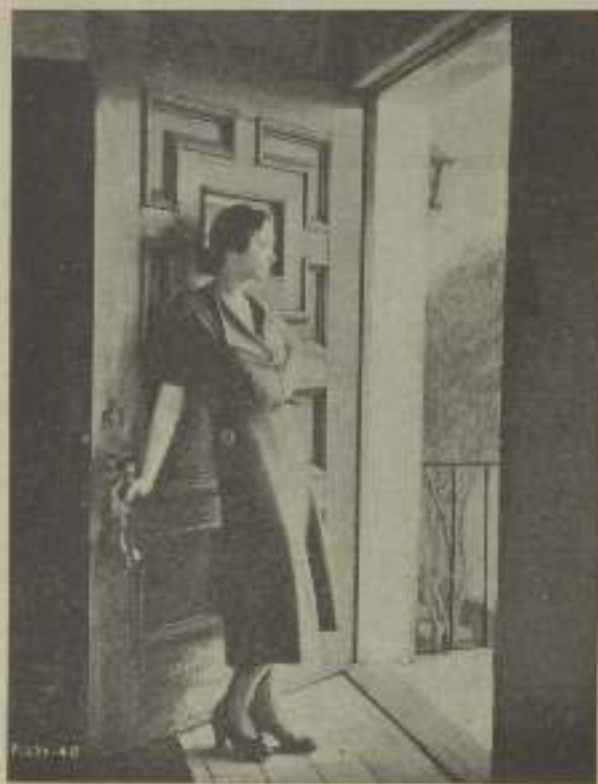
A la puerta de su casa SYLVIA SIDNEY, contemplando el paisaje

La Fox necesitaba personas aptas para el micrófo-