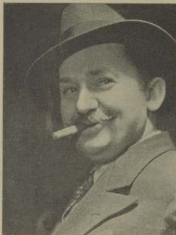
JEAN HERSHOLT veterano actor de M. G. M. sonríe satisfecho mientras aspira el aroma de un espléndido habano

"Retroscedido a 1916", nos dice Hersholt, "el difunto LonChancy y yo compartíamos el mismo camerino en los viejos estudios de la Universal. Desde entonces hasta el día de su muerte fuimos muy buenos amigos. El había firmado un largo contrato, por el módico precio de treinta dólares semanales y por treinta y cinco, lo cual, como Ud. comprenderá, era una gran cantidad de dinero para un mero actor de cine, en aquellos tiempos".