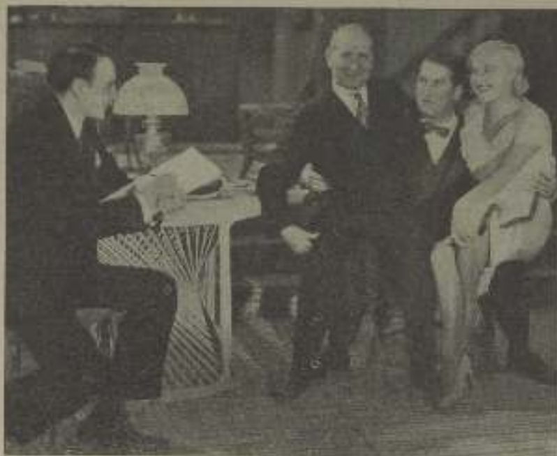
MAURICE CHEVALIER asistiendo a la lectura de un guión en Jolville

Des aficionados jerezanos. — Jerez. — No se trata de una selección sino de dar un medio a los aficionados para que puedan darse a conocer de las editoras, pero nada más ¿comprendido?