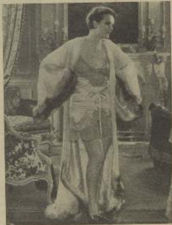
MARY ASTOR, en una escena de "Holy Day" (Día de fiesta), con atractivo salto de cama

Tenían razón. Era natural, sin embargo, que yo fuese así. Nada en mi vida había sido tan doloroso. Mi