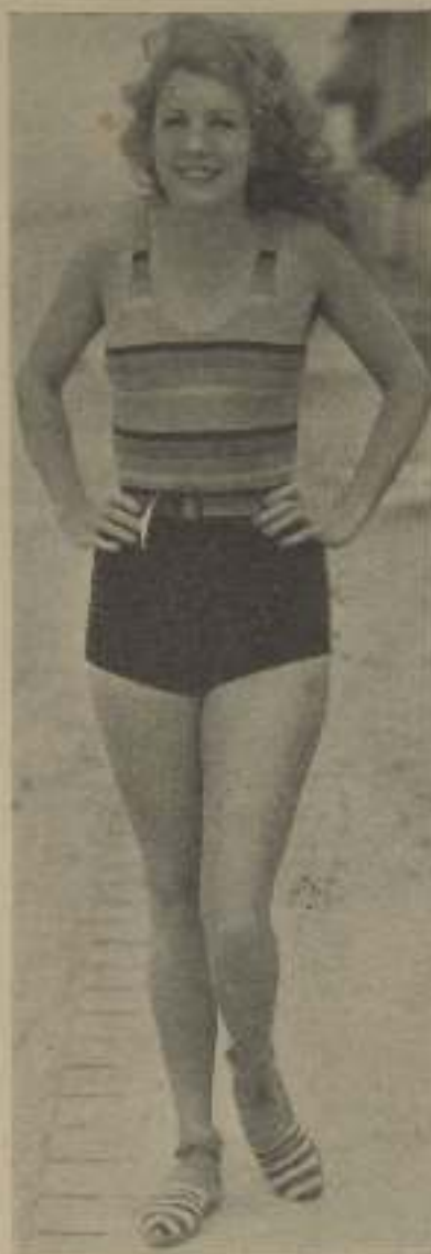
Antes la mujer cuidaba de su traje de calle y noche pero no olvida el de baño.