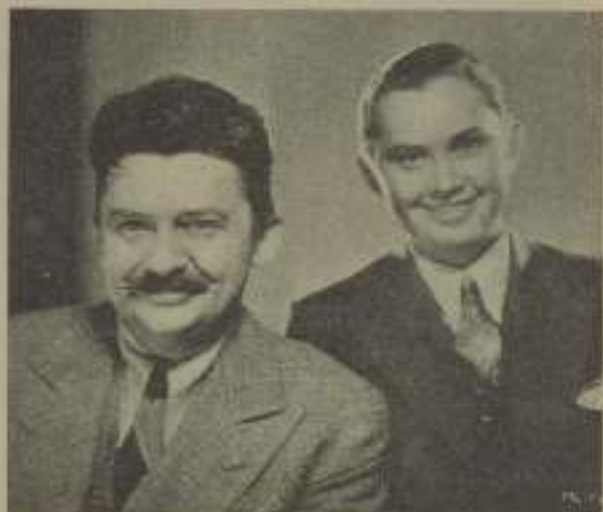
El buen JEAN nos presenta satisfecho su mejor obra. Allaí, su hijo que espera continuar sus pasos bajo la bandera de M. G. M.

Jean Hersholt por el contrario, no quiere imitar a nadie, desea tan solo contribuir de vez en cuando con un poco de trabajo cinematográfico a que se le recuerde con gratitud y afecto y es feliz si el público se da cuenta que Jean Hersholt toma parte en tal o cual película.