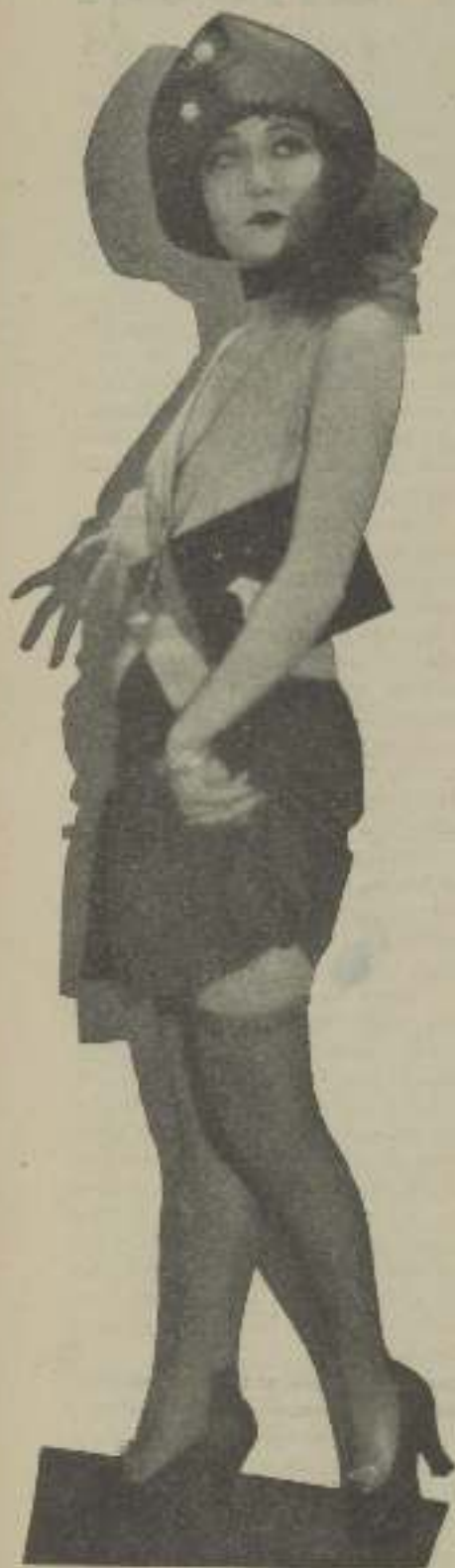
DOROTHY SEBASTIAN, creando la moda de 1940

"Algo le sucede a Gary Cooper" fue el murmullo que se oyó por el estudio durante el rodaje de "Las Calles de la Ciudad".