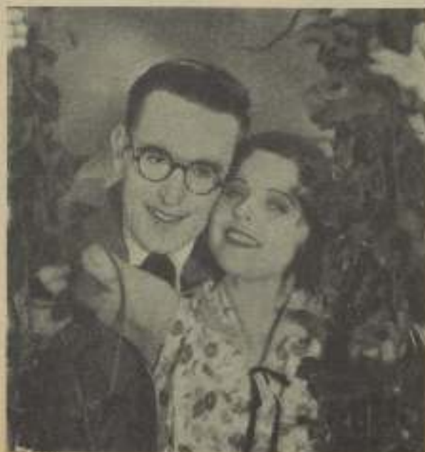
HAROLD LLOYD y BARBARA KENT en una escena de «Welcome Danger»