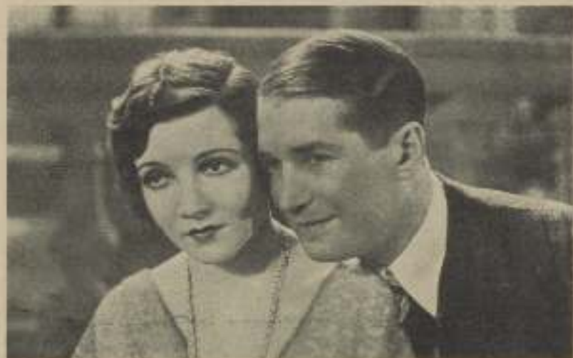
Otra vez tenemos a Maurice Chevalier y Claudette Colbert en una escena de «El gran charco»