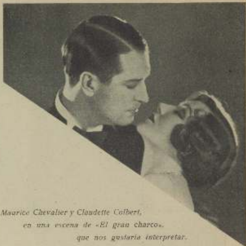
Maurice Chevalier y Claudette Colbert.

"Él es un buen muchacho" dijo la madre. "dejemos que pruebe hacer lo que su corazón desea. Si no