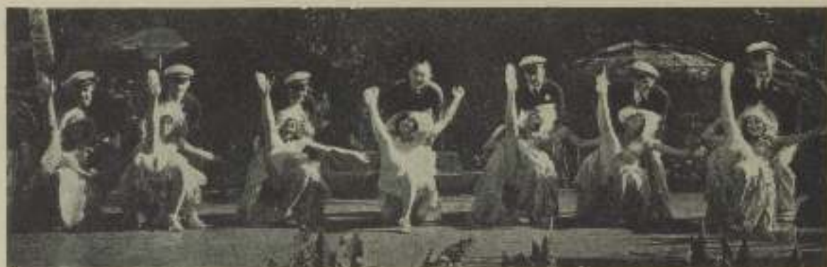
¡Qué bello cuadro se nos presenta en esta escena de «Tanned Legs»!