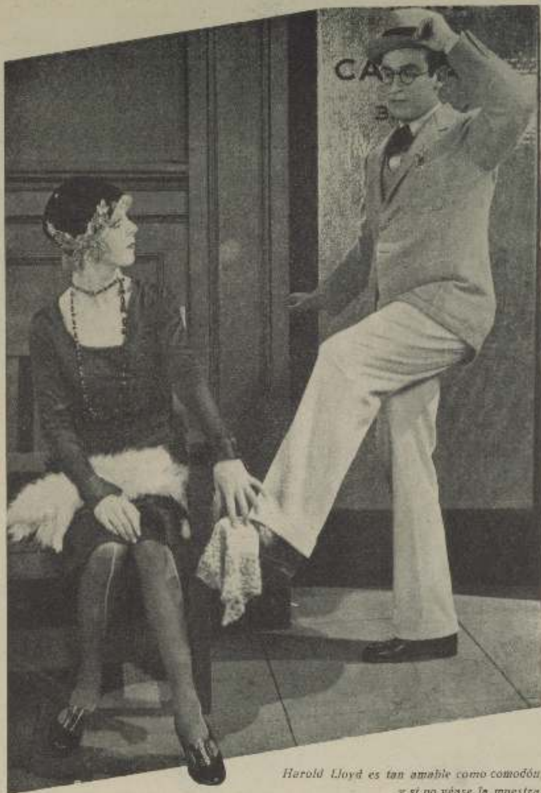
Harold Lloyd es tan amable como cómodo, y si no véase la muestra.