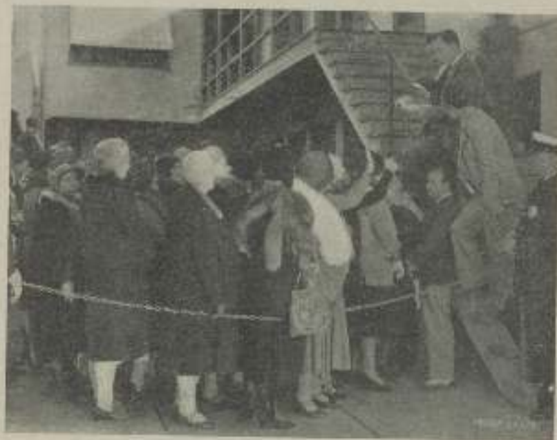
Todas estas mujeres acudieron al llamamiento de personas que supiesen hablar español. Con seguridad que muchas ni lo conocen siquiera si nos fijamos en el semblante de los seleccionadores de M-G-M

Hemos hecho versiones españolas de muchas de nuestras películas, entre otras de "La isla misteriosa", y nos hemos asegurado el concurso de elementos de habla hispana, tales como Gilbert Roland, a quien ustedes conocen por el nombre de Luis Alonso, artista de origen español que vino a España a cumplir sus deberes militares, dejando pendientes contratos de importación.