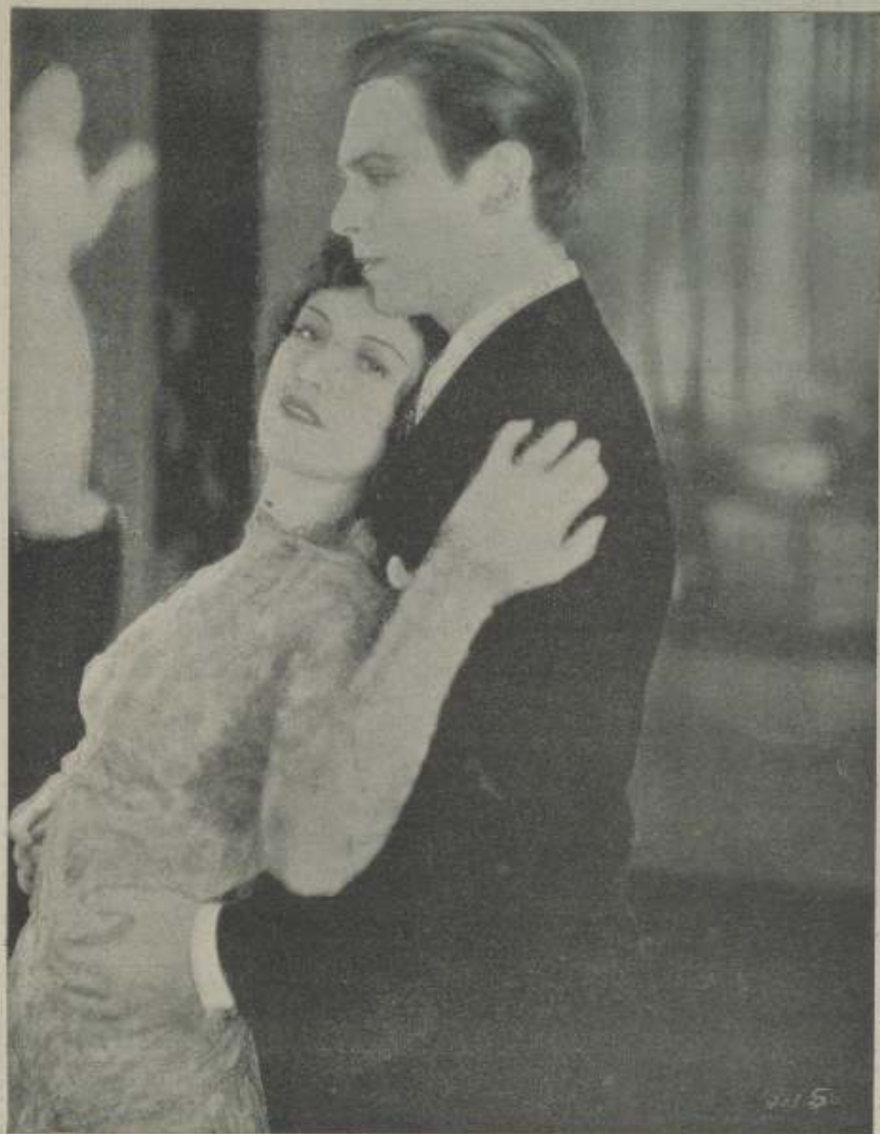
"Jugar con fuego" película M-G-M en la que sus protagonistas, el joven matrimonio Douglas Fairbanks y Joan Crawford, nos demuestran lo difícil que resulta a un corazón salvarse del amoroso incendio