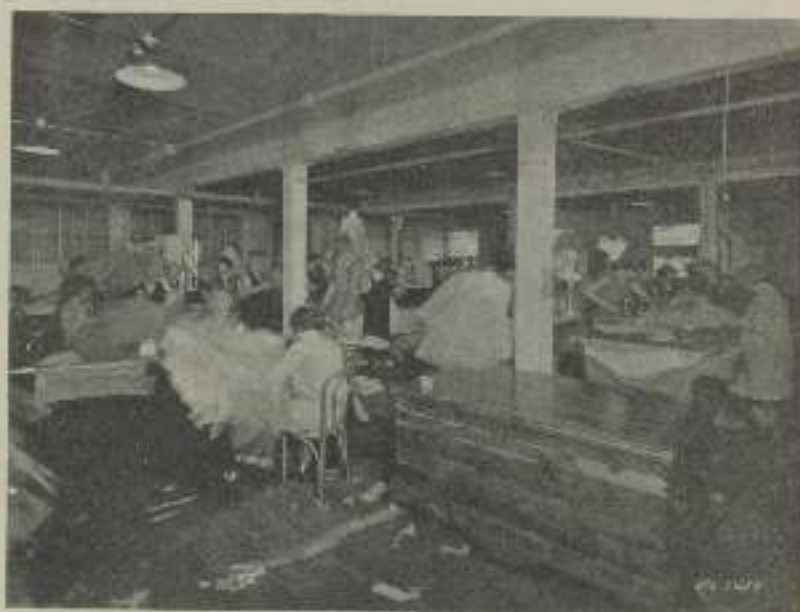
Una parte del taller de costura y guardaropa de mujeres de los Estudios de M-G-M