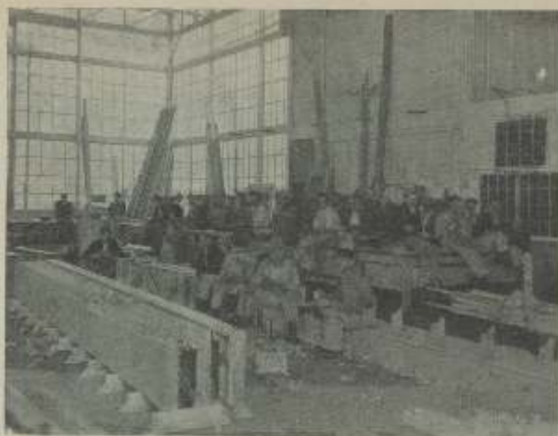
Los carpinteros del Estudio de M-G-M también comen. Hay veces que su número se eleva a más de 1.000

las oficinas de M-G-M y después de mucho batallar pudo atrancarnos noticias.