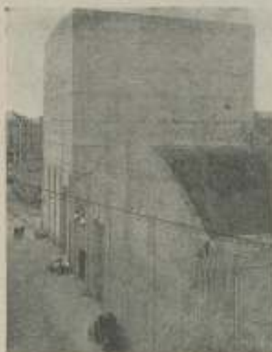
Vista exterior de un nuevo Estudio sonoro de M-G-M equipado para grandes escenarios de revistas con sus telones a prueba de fuego y escenario elevable