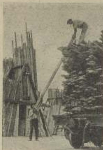
Descargando un camión de madera en los gigantes Estudios de M-G-M