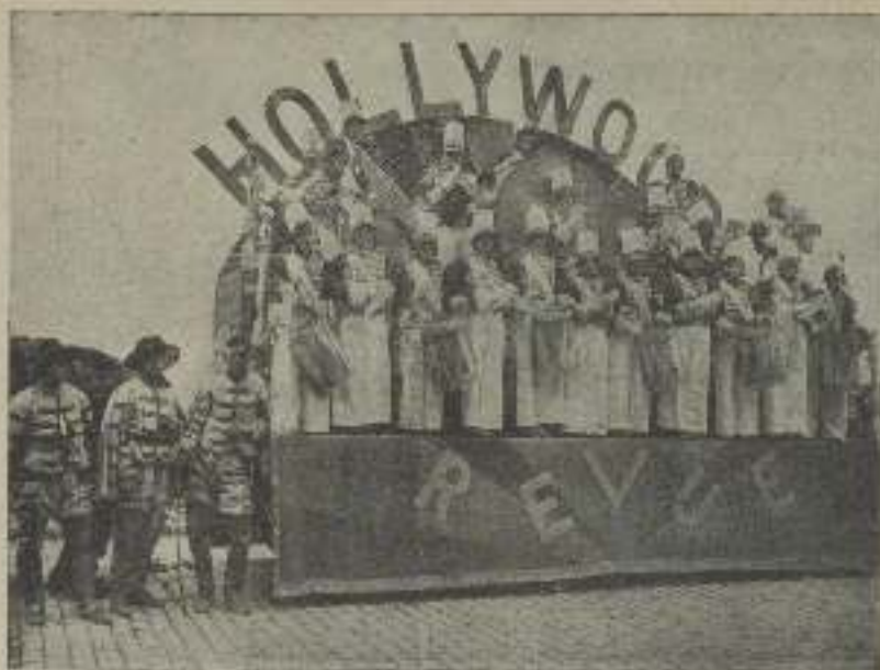
Carroza anunciadora del "Hollywood Revue"

giendo, dentro de una orientación fija y bien premeditada, todas aquellas ideas nuevas que pueden llevarle por el camino de una renovación y superación constantes.