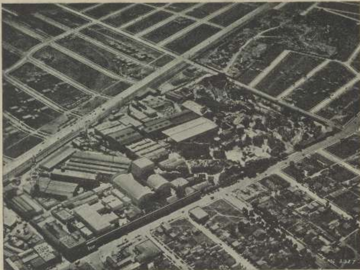
Vista aérea de los Estudios de M-G-M en Culver City y lugar donde se producen las famosas películas que el público aplaude