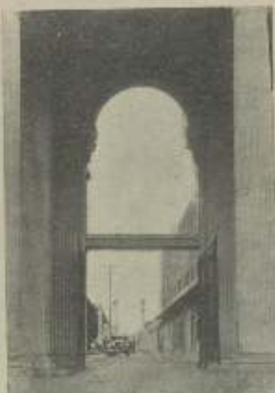
Mirando de dentro a fuera. Las enormes rejas de los Estudios de M-G-M donde hay más "estrellas" que en el mismo firmamento

"Hoy o mañana salen Barcelona personajes M-G-M."