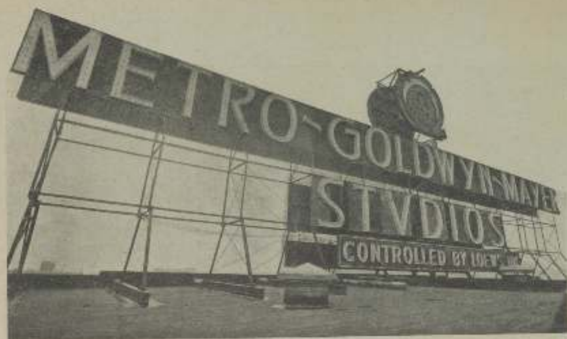
Un ángulo mostrando el enorme letrero sito en la azotea del edificio de la administración de los Estudios de M-G-M en Culver City.