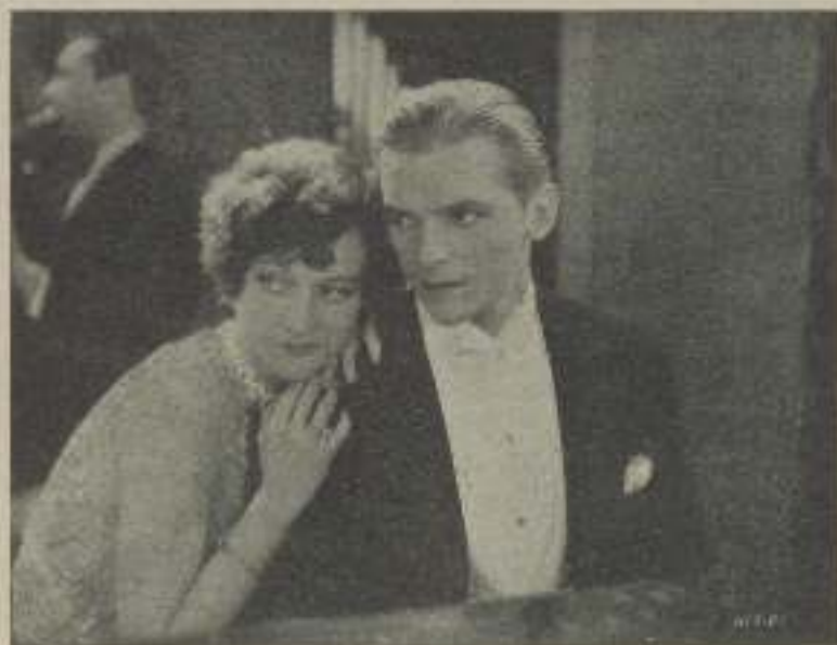
Joan Crawford y Douglas Fairbanks, hijo, la pareja de "Jugar con fuego"

Hoy termino las representaciones de "Young Woodley", y esta noche he ido con Doug al Coconut Grove para despedir al año viejo.