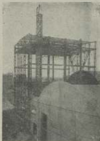
Vista exterior de un nuevo Estudio sonoro en construcción y que una vez terminado será el mayor que exista. La M-G-M producirá en él las obras de mayor envergadura

El señor Lawrence partió aquella misma tarde para Madrid. El moti-