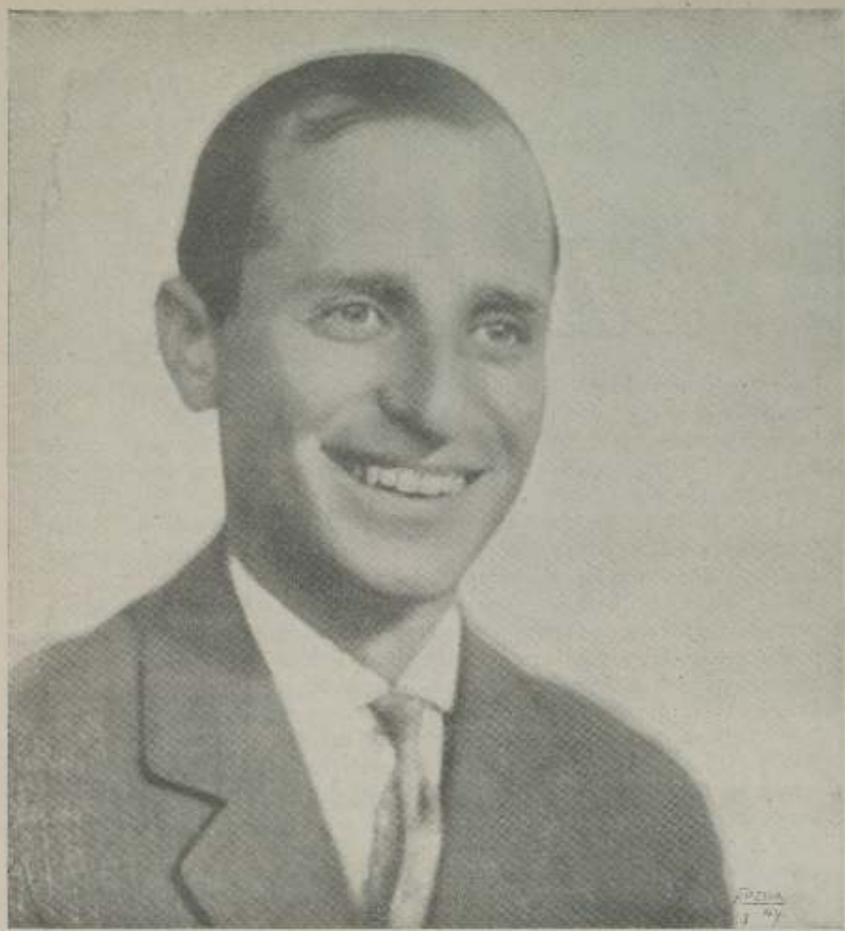
Arthur Lova, uno de los más altos valores de M-G-M cuya visita a nuestra ciudad ha sido paso decisivo para la realización de películas habladas en nuestro idioma con artistas de la raza.

Redacción y Administración Mallorca, 255 - Teléfono 76755 BARCELONA