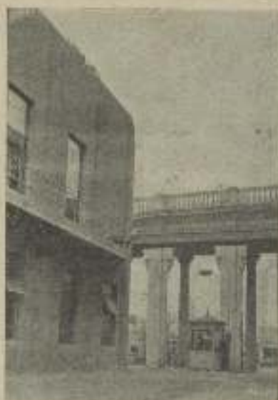
De dentro mirando hacia fuera. Las verjas de los Estudios de M-G-M