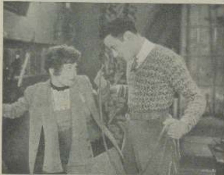
Joan Crawford y Rod La Rocque en una escena de "Jugar con fuego"