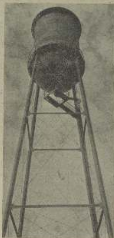
Una vista poco corriente del depósito de agua de los Estudios de Metro Goldwyn Mayer