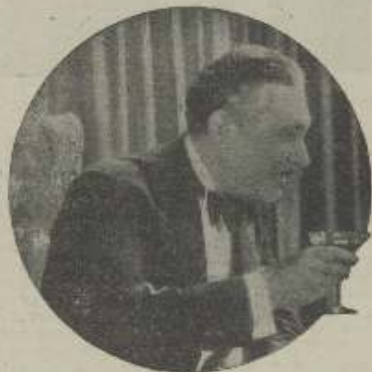
Lew Cody, viuda de Mabel Normand, a' que se le culpa de haber maltratado y abandonado a la malograda Mabe, que agonizó mientras Lew celebraba una fiesta en su casa de soltero.