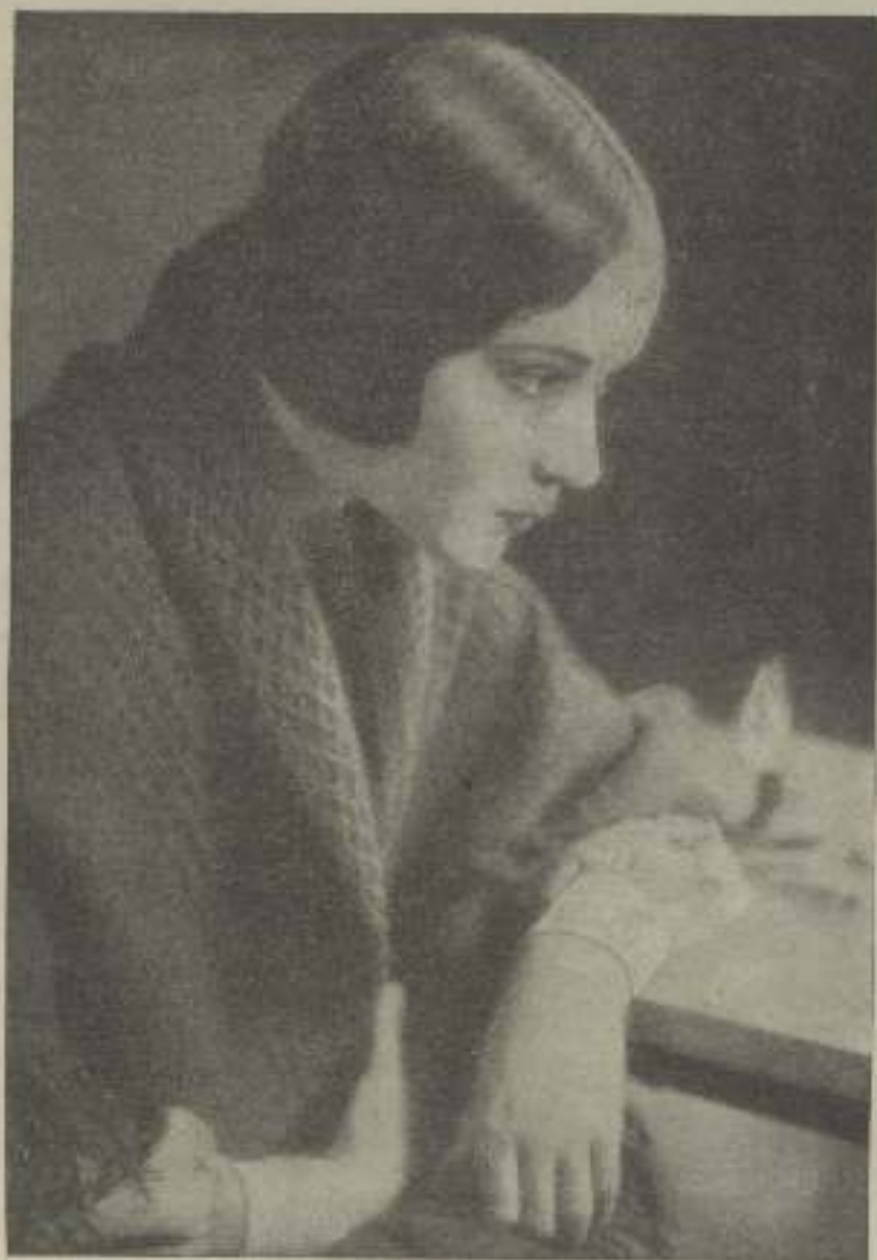
He aquí una de las mujeres que con más méritos ha llegado a la cima de la fama; Dolores del Río es la ruda er fuego, que vibra al compás de la pasión