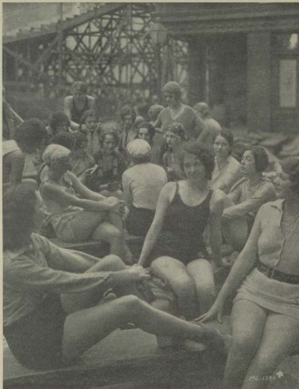
En los Estudios de M-G-M hay chicas muy bonitas como el lector podrá constatar fijándose únicamente en cualquiera de estas criaturas de cuerpo divino y cara de ángel que alegran las películas M-G-M