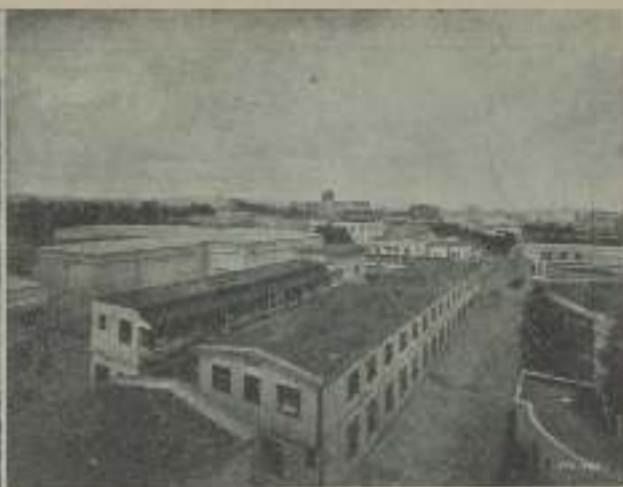
Vista parcial de los Estudios de M-G-M. — Otra vista parcial de los Estudios de M-G-M.

Blum, se rogó a éste que recabara una pose especial del señor Loew para EL CINE y como la influencia del señor Blum es tan grande, se consiguió.