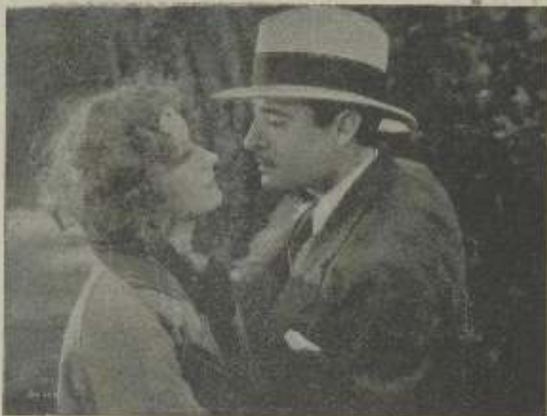
Greta Garbo mira melancólica a John Gilbert que apenas puede resistir el influjo de los ojos misteriosos

¿En qué se parece Conrad Nagel a "Ricardito"?