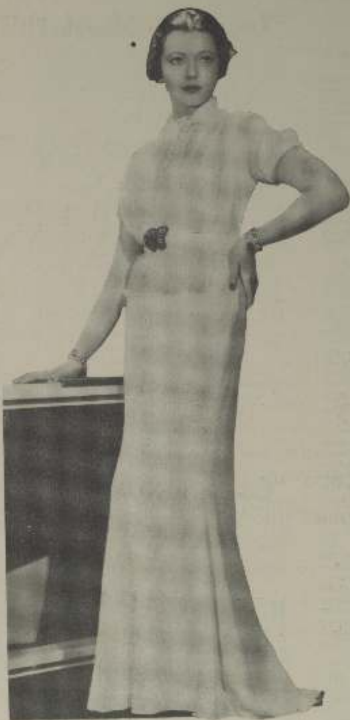
La hermosa estrella de la "Paramount" luce uno de los últimos modelos de las modistas de Hollywood.

1849, Janssen: "Revólver Fotográfico". 1849, Janssen: "Revólver Fotográfico".