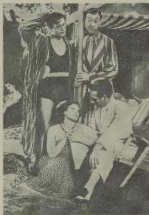
Una riquísima escena de la interesantísima producción "Por tu amor", interpretada por el tenor Franco Foresta, y que la distribuidora Atlante Film presentará en el Cine Capitol a finales de noviembre.

Entre las superproducciones que la prestigiosa distribuidora Atlante Film nos ofrece para esta temporada ocupa un lugar preeminente la que corresponde a este título, que será estrenada próximamente en la aristocrática sala del Capitol.