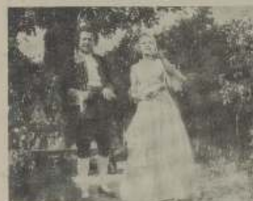
(Esta película se estrenará en el auditorio Cine Capitol)

La mujer de los sueños del poeta le cree ver Goethe en la persona de "Federica" al conocerla en una excursión organizada por su amigo Wagner. Y allí a orillas del Rhin saben los primeros instantes de amor con los ruidos cristalinos de la azulada corriente.