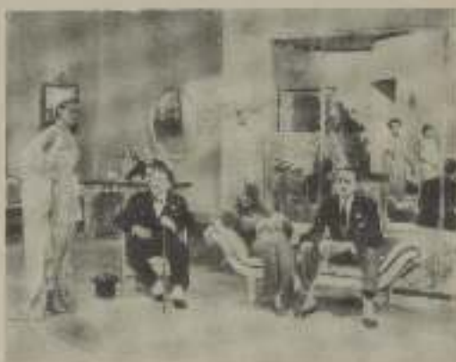
Boris Karloff y William Powell en una escena de esta superproducción, Warner Bros. First National Inc., cuya presentación se anuncia para muy en breve en el Cine "Rialto".