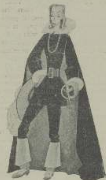
Greta Garbo, que, bajo la acertada dirección de Rouben Mamoulian, ha logrado, con su maravillosa interpretación de "La reina Cristina", encontrarse a sí misma.

SUECIA, la gran nación protestante, estaba en guerra contra los seis quinquenios. Durante los últi-