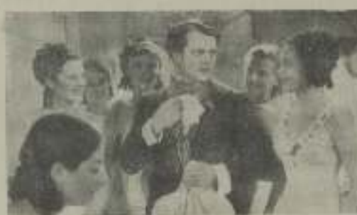
Calmante escena de esta película, que anuncia la Anglo Iberica Super Films