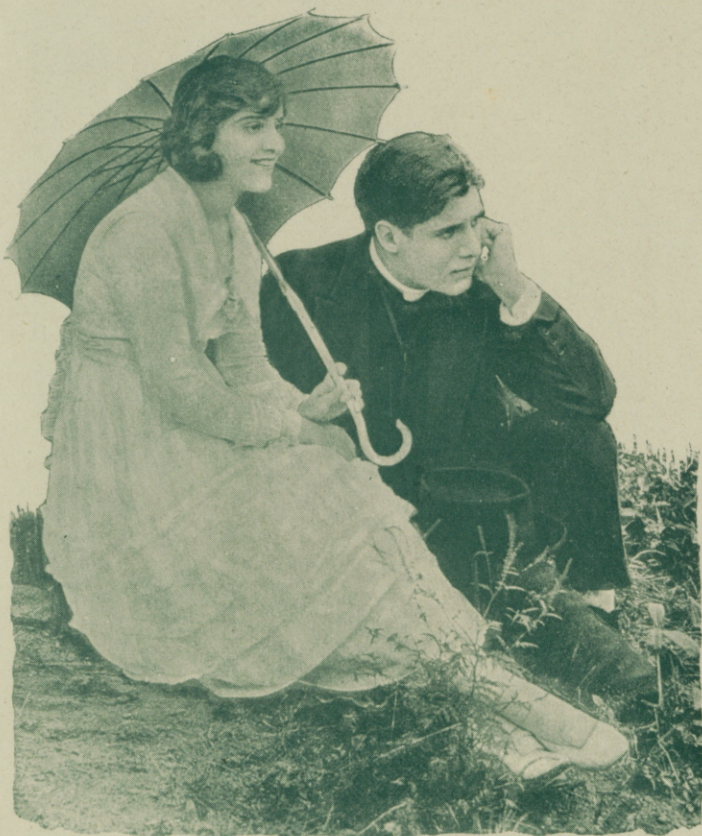
MADGE KENNEDY en « Toda una dama »