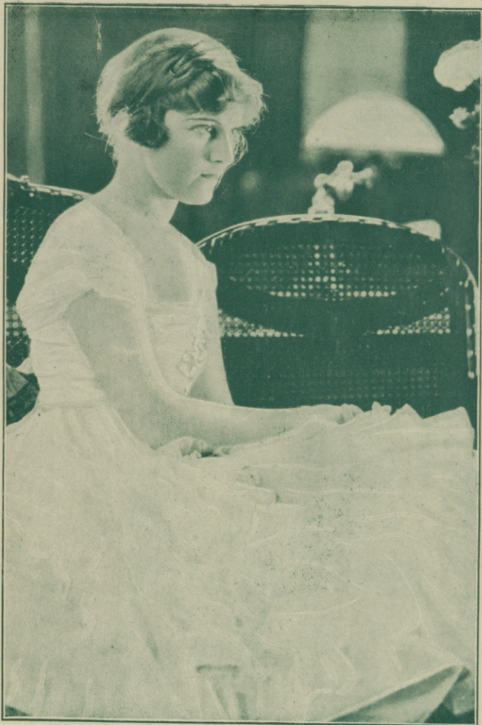
MADGE KENNEDY en «Los amores de Dodó»