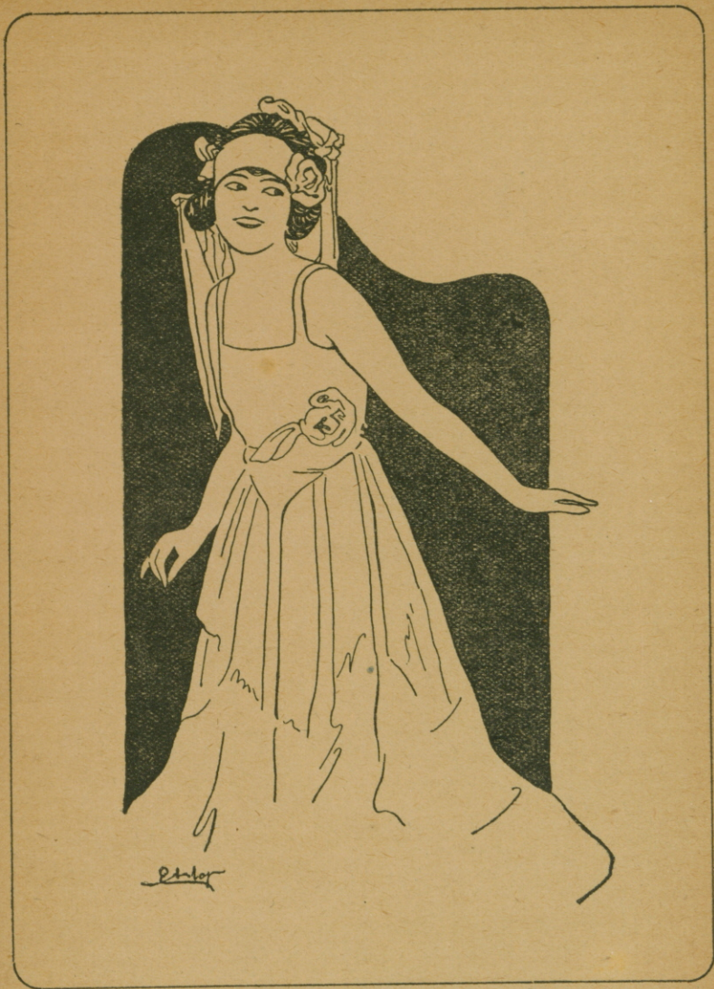
Madge Kennedy en Toda una dama