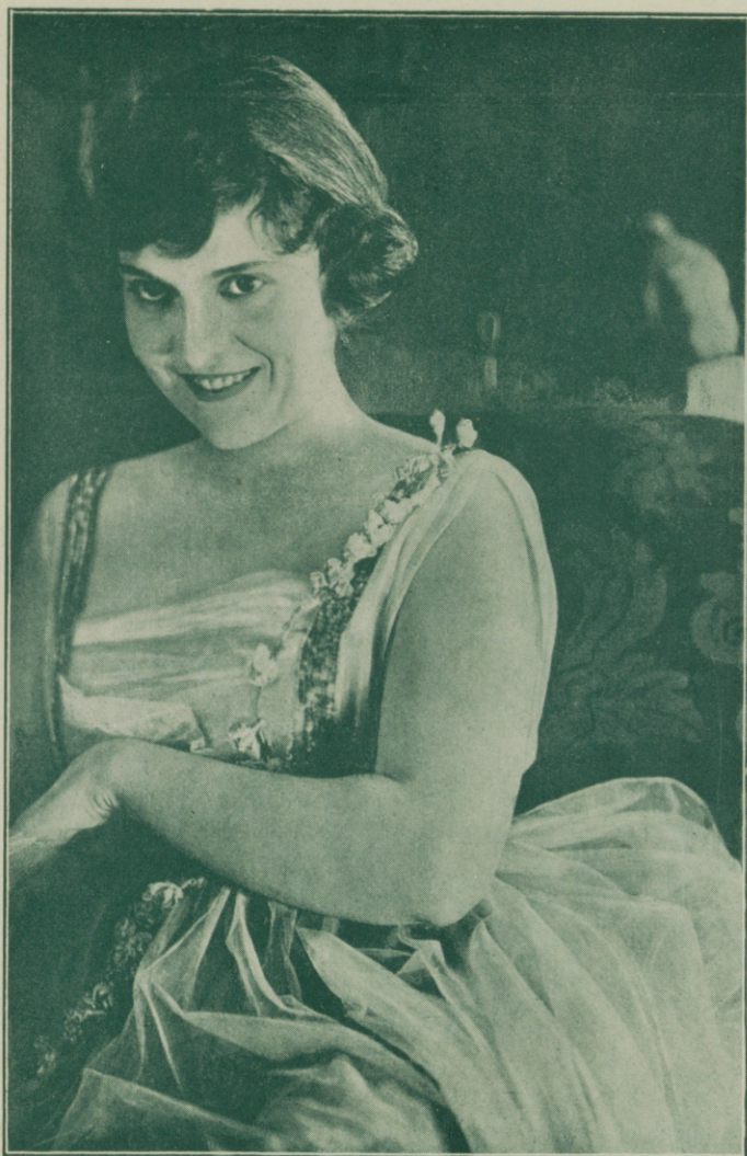
MADGE KENNEDY en «Jugar con fuego» de WILLIAM SHAKESPEARE