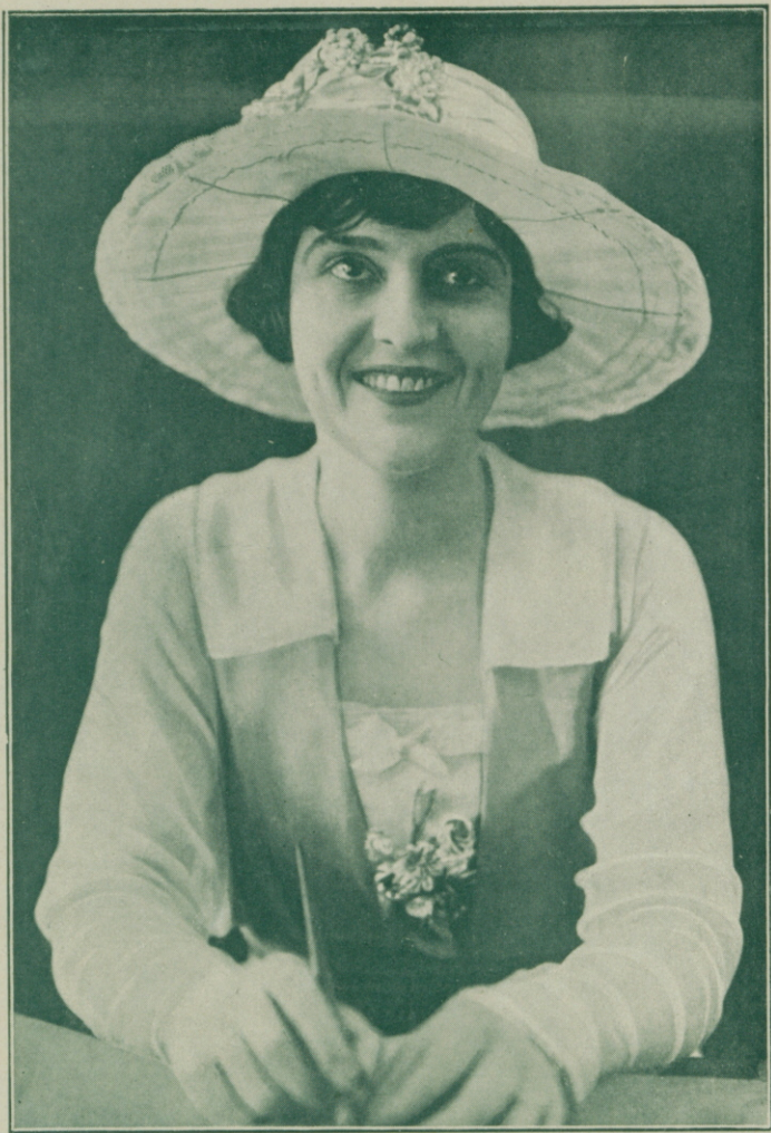
MADGE KENNEDY en «Lo más sublime»