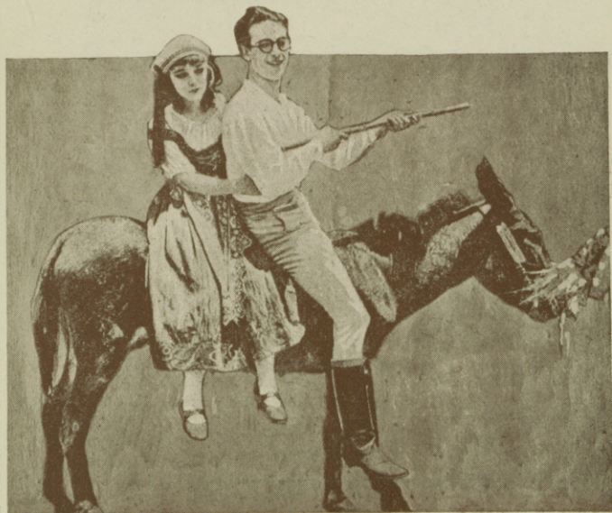
HAROLD LLOYD y sus creaciones