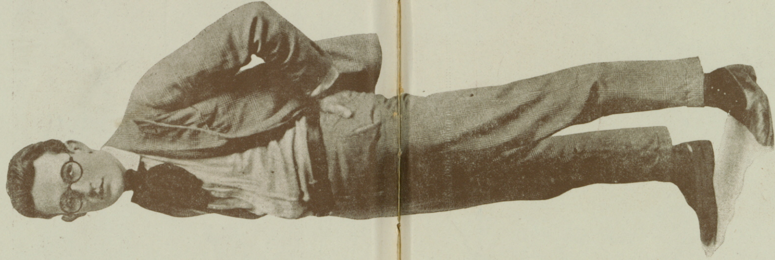
Retrato del célebre cómico HAROLD LLOYD