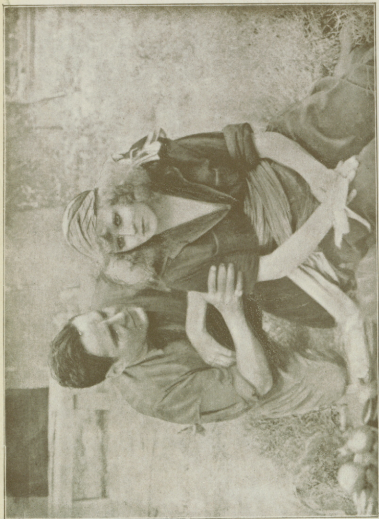
JUANITA HANSEN en « Minerva, o la ciudad perdida »