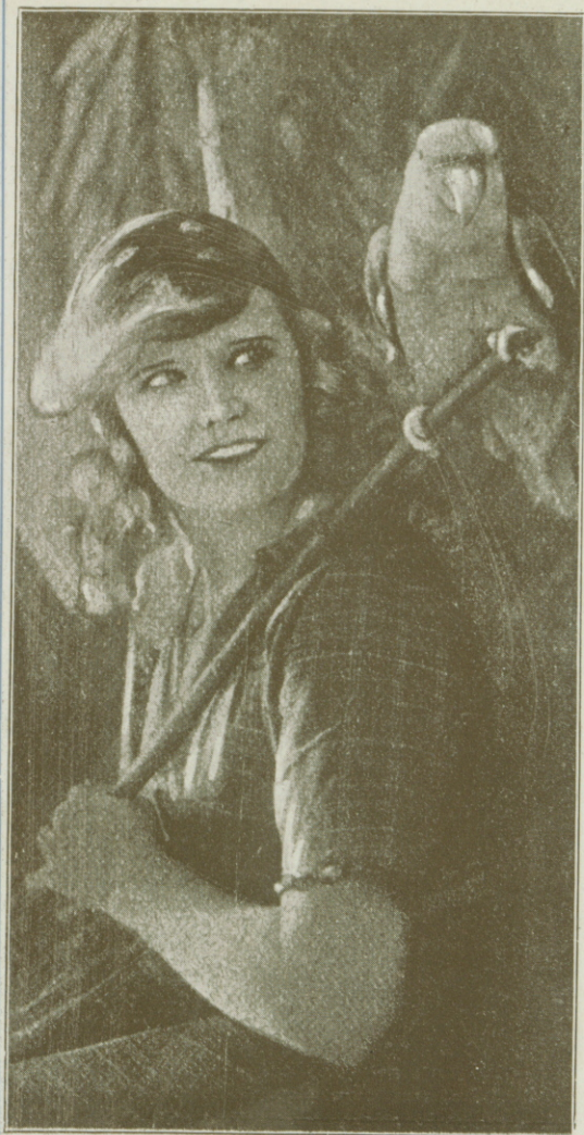
JUANITA HANSEN en «Flor de Mar»