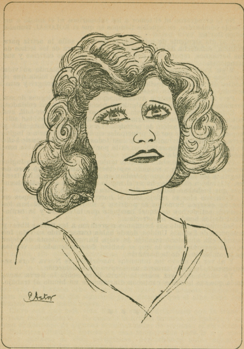
Retrato de Juanita Hansen