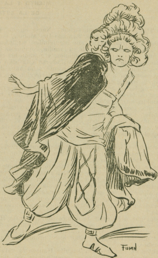
Juanita Hansen en La ciudad perdida