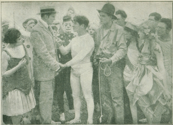
EDDIE POLO en «La tentación del circo»