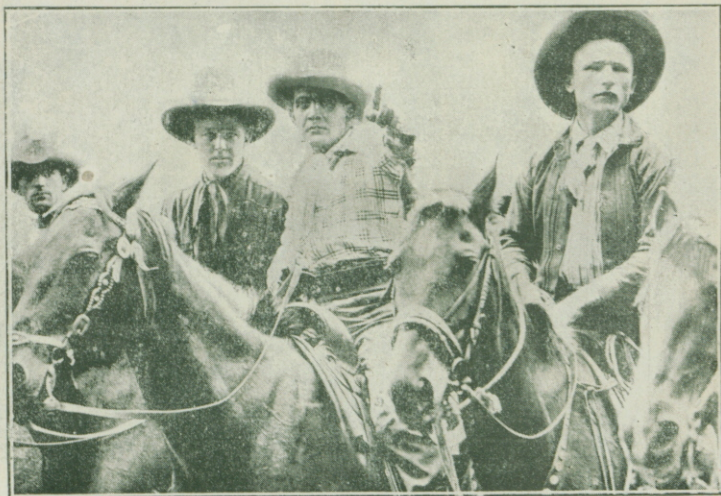
EDDIE POLO en «La daga que se desvanece»