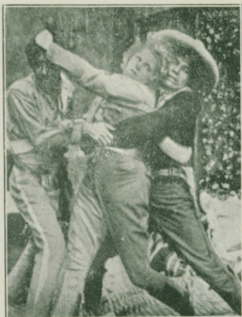
EDDIE POLO en dos aspectos de «Libertad»