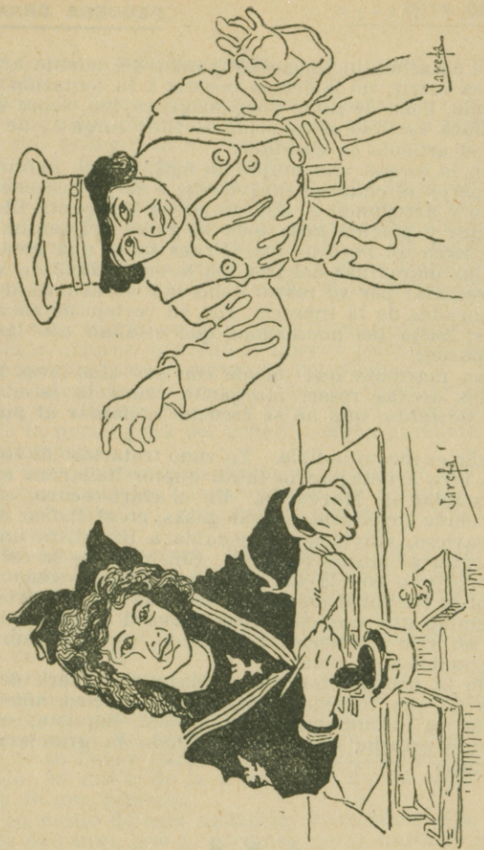
Margarita Clark en El diario de una niña y en Ladrón nocturno